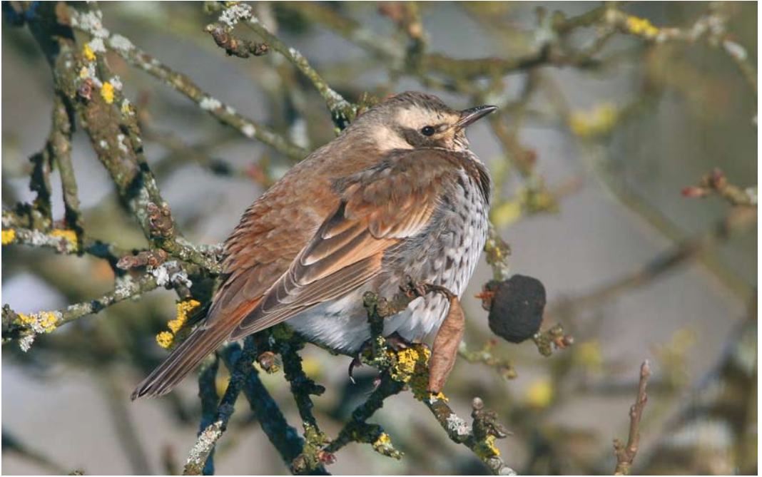
66 Dusky Thrush / Bruine Lijster Turdus eunomus , first-winter, Ezerée, Luxembourg, Belgium, 9 January 2009