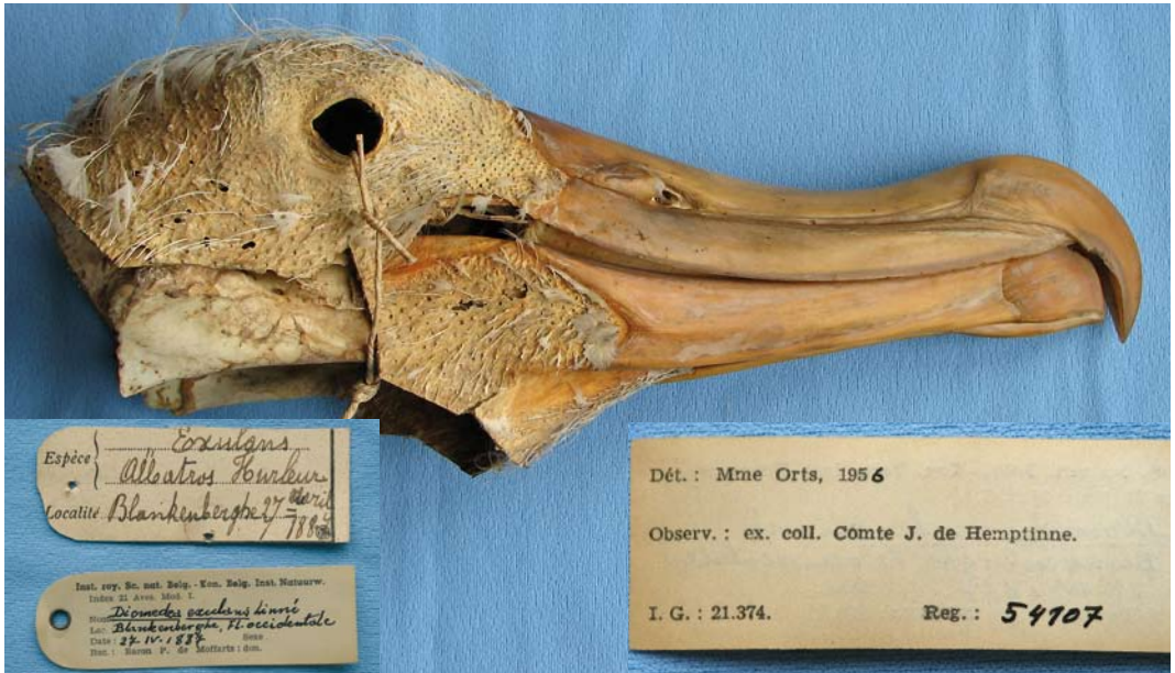
FIGURE 7 Wandering Albatross / Grote Albatros Diomedea exulans , found at Blankenberghe, West-Vlaanderen, Belgium, on 27 April 1887

Blankenberghe on 27 April 1887. The story goes that the bird was eaten by the port warden's family but that the head was kept, although it only just escaped being eaten by a cat or by rats (Jacobs & Dirx 1945). The head ended up in the collection of a small zoo in Gent, Oost-Vlaanderen. When this zoo went out of business, the head was acquired by the count De Hemptinne for his private collection. Shortly after the count's death in September 1942, Dupond (1943) visited the count's widow to verify the find. He found the head in a poor state ('badly eaten by mites'). De Hemptinne's collection was transferred to baron P de Moffarts, who donated it in May 1958 to the Royal Belgian Institute of Natural Sciences in Brussels where it is still kept (KBIN 54107) (figure 7). The bird can be identified as exulans , with a culmen of 164.8 mm and a bill width of 44.4 mm (figure 5). The bill is nicked at the cutting edge of the inner hook.