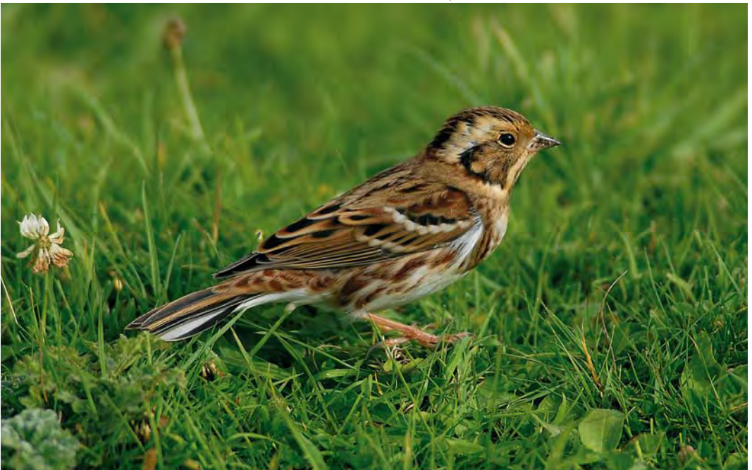
466 Rustic Bunting / Bosgors Emberiza rustica , first-year, De Cocksdoorp, Texel, Noord-Holland, Netherlands, 4 October 2008