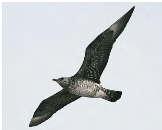
492 Parasitic Jaeger / Kleine Jager Stercorarius parasiticus , first-summer, Skagen, Nordjylland, Denmark, 16 July 2009. Note juvenile-like plumage in both pattern and freshness, comparable with first-summer Long-tailed Jaeger S longicaudus . This individual seemed to have completed its post-juvenile moult. Central tail-feathers missing or growing, possibly indicating start of moult to second-winter plumage.