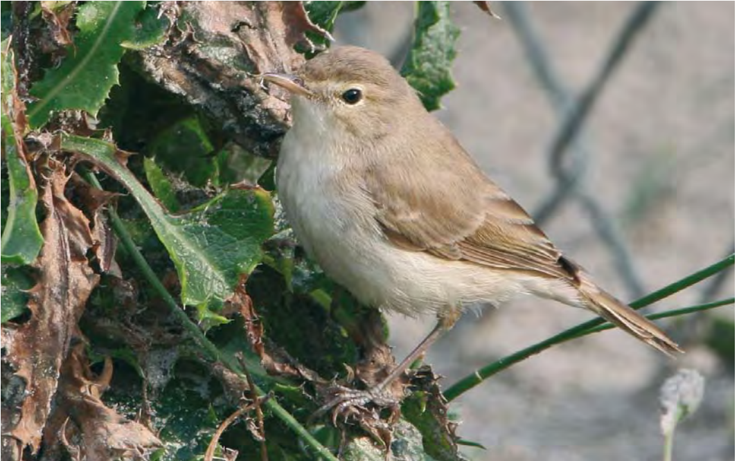
465 Booted Warbler / Kleine Spotvogel Acrocephalus caligatus , Maasvlakte, Zuid-Holland, Netherlands, 13 September 2008 (Martin van der Schalk)