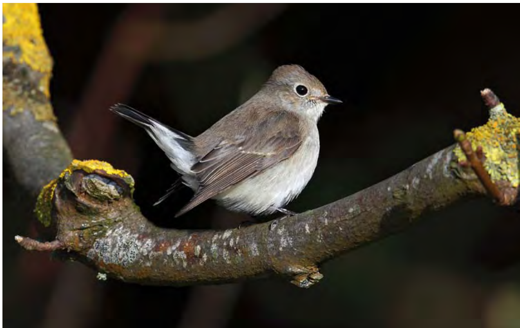
509 Taiga Flycatcher / Taigavliegenvanger Ficedula albicilla , first-year, Fetlar, Shetland, Scotland, 29 September 2009 (Hugh Harrop)