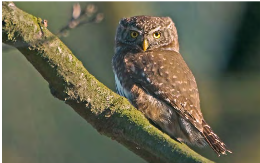
449 Eurasian Pygmy Owl / Dwerguil Glaucidium passerinum , Leenderbos, Noord-Brabant, 11 February 2008