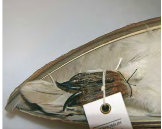
474 Witte Kerkuil / Pale Barn Owl Tyto alba alba (verzameld tussen / collected between Axel en / and Zuid-dorp, Zeeland, 14 maart 1983). Let op lichte ondervleugel zonder tekening en lichte onderzijde van staart / Note pale underwing without markings and pale underside of tail. Nationaal Natuurhistorisch Museum Naturalis, Leiden, 14 september 2007 ( Chris van Rijswijk/birdshooting.nl )

De voorzichtige conclusie hiervan is dat in Nederland alleen de meest lichte alba 's met zekerheid op naam zijn te brengen en lichte guttata 's uitsluiten. Een aanvaardbare alba moet voldoen