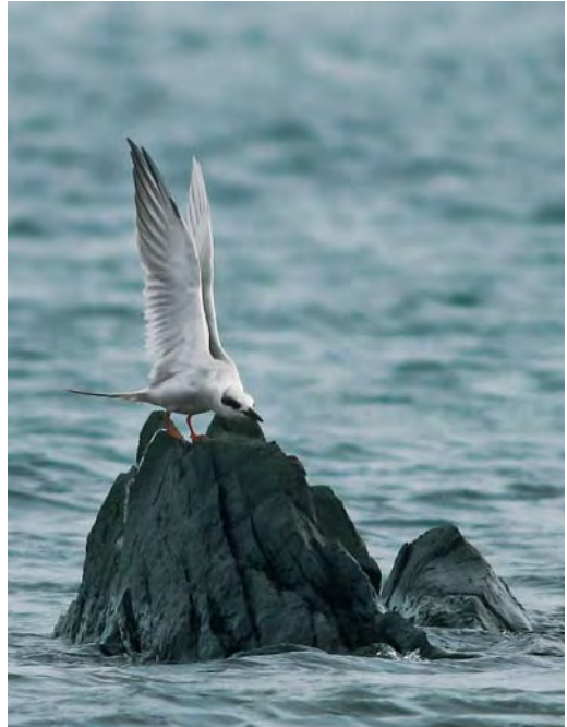
501 Forster's Tern / Forsters Stern Sterna forsteri , Cruisetown Strand, Louth, Ireland, 19 October 2009 (Gerry O'Neill)