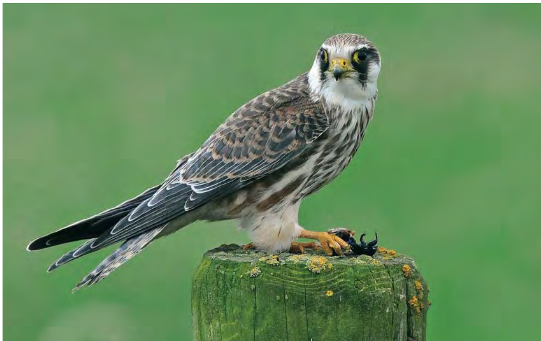
545 Roodpootvalk / Red-footed Falcon Falco vespertinus , juveniel, Kollumerwaard, Friesland, 6 september 2009 (Roef Mulder)