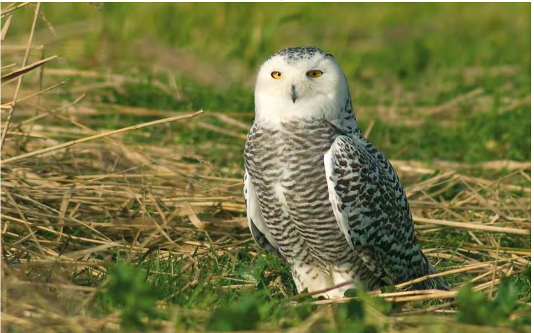
450 Snowy Owl / Sneeuwuil Bubo scandiacus , first-winter female, Texel, Noord-Holland, 17 November 2008 (René Pop)