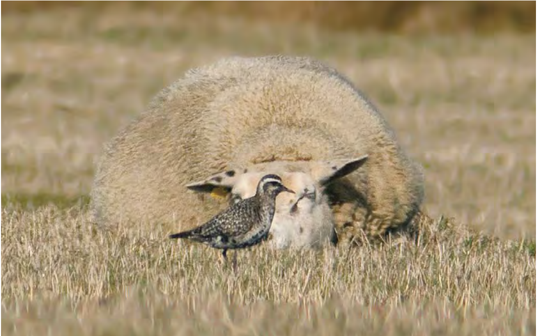
540 Amerikaanse Goudplevier / American Golden Plover Pluvialis dominica , adult, Dijkmanshuizen, Texel, Noord-Holland, 14 oktober 2009 (Peter Soer)