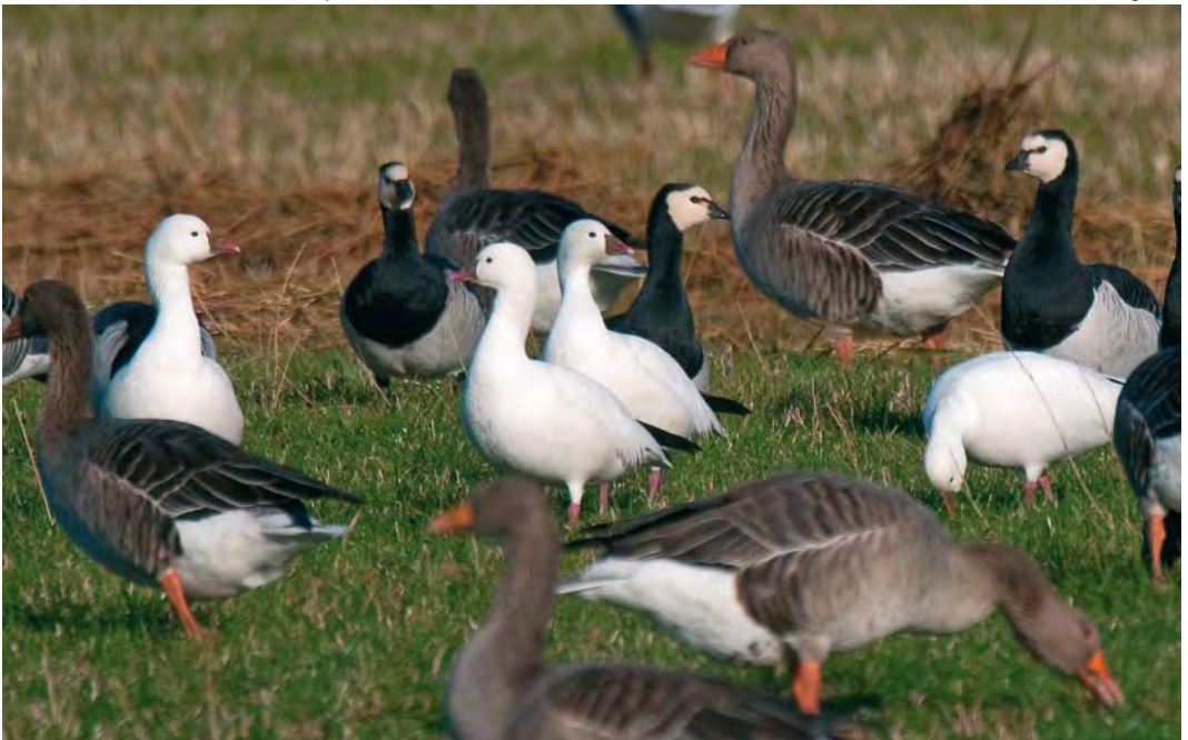
543 Ross' Ganzen / Ross's Geese Anser rossii , met Grauwe Ganzen / Greylag Geese A anser en Brandganzen / Barnacle Geese Branta leucopsis , Ottersaat, Texel, Noord-Holland, 18 oktober 2009