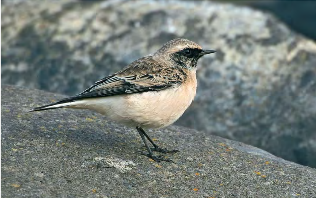
455 Pied Wheatear / Bonte Tapuit Oenanthe pleschanka , adult male, Jan Ayeslag, Texel, Noord-Holland, 13 October 2008