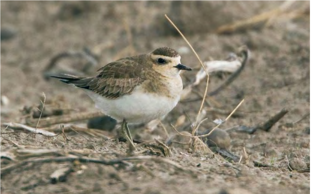
495 Caspian Plover / Kaspische Plevier Charadrius asiaticus , first-year, Buitendijk, Texel, Noord-Holland, Netherlands, 19 October 2009