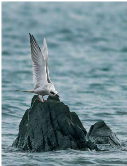
501 Forster's Tern / Forsters Stern Sterna forsteri , Cruisetown Strand, Louth, Ireland, 19 October 2009