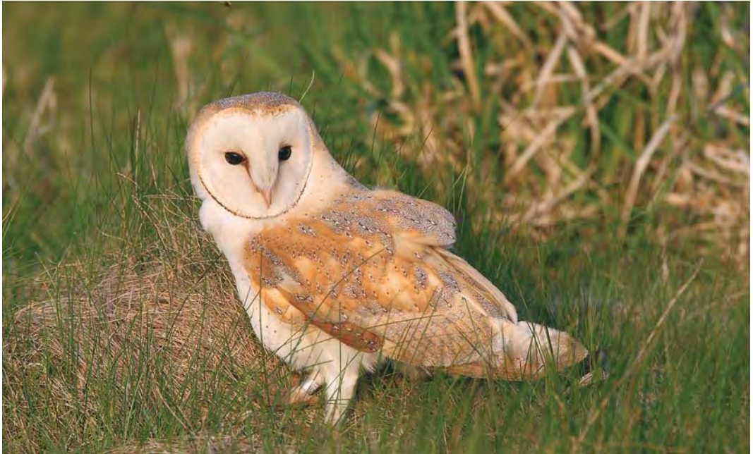
484-485 Waarschijnlijke Witte Kerkuil / probable Pale Barn Owl Tyto alba alba , Alphen aan den Rijn, Zuid-Holland, 20 april 2008. Let op geelbruine bovendelen met weinig licht grijze tekening en zeer lichte onderzijde (met wel wat donkere stipjes en tekening op onderkant van buitenste handpennen). Let ook op afgeknipte of afgebroken buitenste handpennen aan linkervleugel, wat samen met tamme gedrag wijst op een mogelijke herkomst uit gevangenschap / Note yellow-brown upperparts with little pale grey markings and very pale underparts (but with a few dark dots and markings on underside of outer primaries). Also note clipped or broken outer primaries on left wing which, combined with tameness, indicates possible captive origin.