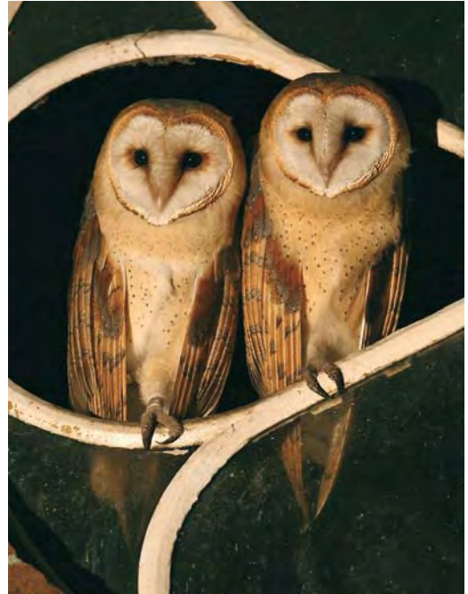
468 Witte Kerkuil / Pale Barn Owl Tyto alba alba , adult, Zuid-Holland, 2 juni 2007 (Chris van Rijswijk/birdshooting.nl). Let op geheel witte onderdelen en ondervleugel / Note completely white underparts and underwing. 469 Hybriden Witte Kerkuil x Kerkuil / hybrids Pale x Dark Barn Owl Tyto alba alba x alba guttata , juveniel, Zuid-Holland, 6 augustus 2007 (Chris van Rijswijk/birdshooting.nl). Bewezen hybriden uit gemengd broedgeval. Deze vogels zijn niet te onderscheiden van guttata / Proven hybrids from mixed breeding pair. These birds are inseparable from guttata .

1976. De vogel was een kippenboerderij binnen-gevlagen en kon worden gevangen en geringd. Hij werd als volgt beschreven: 'geheel zijdeachtige witte onderzijde, wangen en ondervleugels zonder ook maar een spoor van donkere stippen; de bovenzijde oranje-geel'. Bij het artikel is een foto geplaatst van de vogel in de hand. Hij werd op 22 april 1976 dood aangetroffen als verkeersslachtoffer bij Varades, Loire-Atlantique, Frankrijk, waar alba broedvogel is. Het is de enige door van den Berg & Bosman (2001) vermelde alba en aangezien dit taxon tot voor kort niet door de Commissie Dwaalgasten Nederlandse Avifauna (CDNA) werd beoordeeld tevens het enige bekende geval. Op basis van onderstaande criteria is deze vogel nu alsnog beoordeeld en aanvaard door de CDNA (cf Ovaa et al 2009).