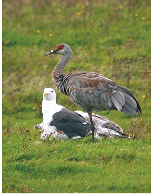
497 American Great Egret / Amerikaanse Grote Zilverreiger Casmerodius albus egretta , Pico, Azores, 28 October 2009 498 Sandhill Crane / Canadese Kraanvogel Grus canadensis , South Ronaldsay, Orkney, Scotland, 23 September 2009 499 Western Reef Egret / Westelijke Rifreiger Egretta gularis , with Little Egret / Kleine Zilverreiger Egretta garzetta , Oued Ksob, Essaouira, Morocco, 12 November 2009