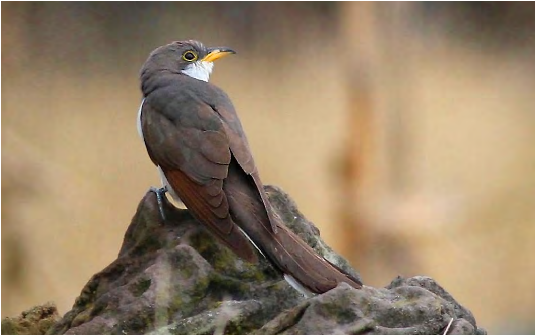
525 Yellow-billed Cuckoo / Geelsnavelkoekoek Coccyzus americanus , Corvo, Azores, 19 October 2009