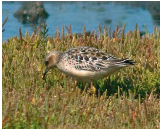
445 Lesser Yellowlegs / Kleine Geelpootruiter Tringa flavipes , Bokkegat, Wissenkerke, Zeeland, 22 July 2008 ( René Weenink ) 446 Lesser Yellowlegs / Kleine Geelpootruiter Tringa flavipes , Ezumakeeg, Friesland, 1 June 2008 ( Martijn Bot ) 447 White-rumped Sandpiper / Bonapartes Strandloper Calidris fuscicollis , adult, Schiermonnikoog, Friesland, 17 August 2008 ( Enno B Ebels ) 448 Buff-breasted Sandpiper / Blonde Ruiters Tryngites subruficollis , adult, Ottersaat, Texel, Noord-Holland, 4 August 2008 ( Arnoud B van den Berg )