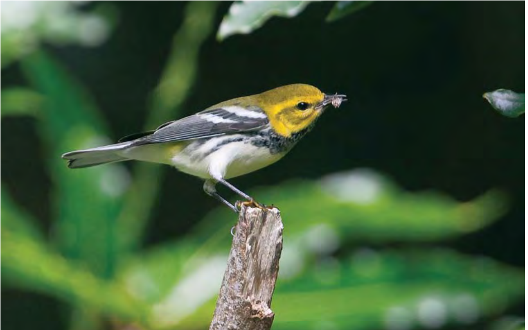
529 Black-throated Green Warbler / Gele Zwartkeelzanger Dendroica virens , Fojo, Corvo, Azores, 7 October 2009 (Rafael Armada)