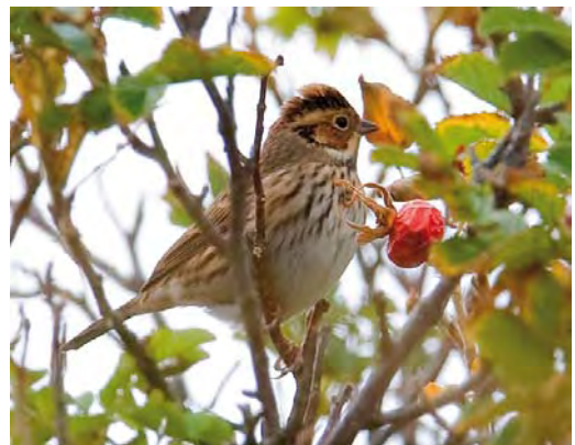
558 Siberische Tjiftjaf / Siberian Chiffchaff Phylloscopus collybita tristis , Noordwijkerhout, Zuid-Holland, 27 oktober 2009 (René van Rossum) 559 Blauwstaart / Red-flanked Bluetail Tarsiger cyanurus , eerstejaars, Oranjezon, Zeeland, 9 oktober 2009 (Adri Joosse) 560 Citroenkwikstaart / Citrine Wagtail Motacilla citreola , eerstejaars, Oegstgeest, Zuid-Holland, 4 september 2009 (Enno B Ebels) 561 Izabeltapuit / Isabelline Wheatear Oenanthe isabellina , Oost-Vlieland, Vlieland, Friesland, 19 september 2009 (Bas van den Boogaard) 562 Raddes Boszanger / Radde's Warbler Phylloscopus schwarzi , Katwijk aan Zee, Zuid-Holland, 27 september 2009 (René van Rossum) 563 Dwerggors / Little Bunting Emberiza pusilla , Vlieland, Friesland, 2 oktober 2009 (Han Zevenhuizen)