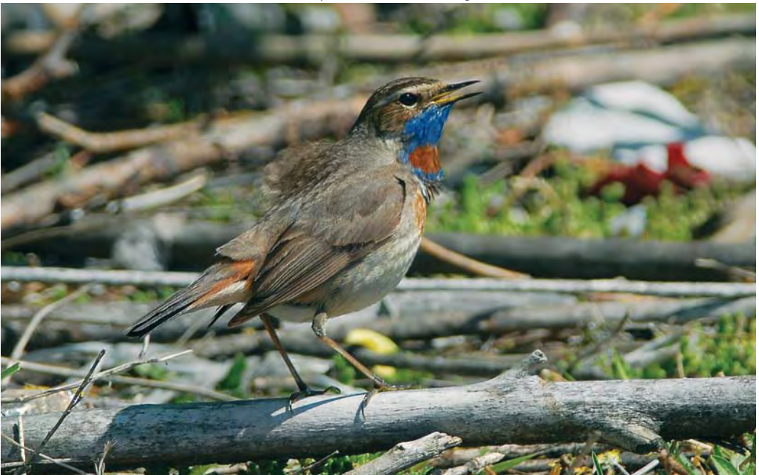
454 Red-spotted Bluethroat / Roodsterblauwborst Luscinia svecica svecica , male, Maasvlakte, Zuid-Holland, 18 May 2008 (Ellen Sandberg)