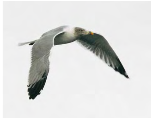
505-506 Belted Kingfisher / Bandijsvogel Megasceryle alcyon , first-year female, Mar Menor, Murcía, Spain, 16 November 2009 507 Western Sandpiper / Alaskastrandloper Calidris mauri , juvenile, Cabo da Praia, Terceira, Azores, 2 September 2009 508 Atlantic Yellow-legged Gull / Atlantische Geelpootmeeuw Larus michahellis atlantis , Appleford, Oxfordshire, England, 17 October 2009

winged Gull L. glaucescens for Denmark, if accepted, was a fourth-calendar year seen for less than 1.5 h at Århus, Midtjylland, on 27 November. The adult Forster's Tern Sterna forsteri seen each October since 2006 at Cruisetown Strand, Louth, Ireland, made its (re)appearance this year on at least 11-19 October; this or another was seen at Balbriggan, Dublin, on 1 November.