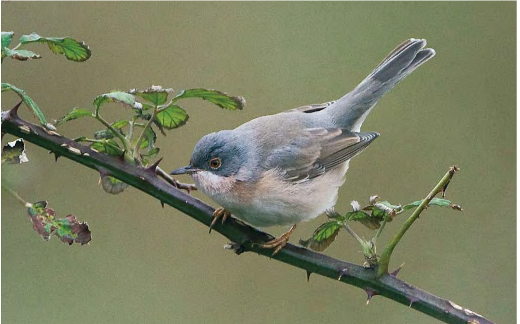
515 Moltoni's Warbler / Moltoni's Beardgrasmus Sylvia subalpina , Helgoland, Schleswig-Holstein, Germany, 11 October 2009 (René van Rossum)