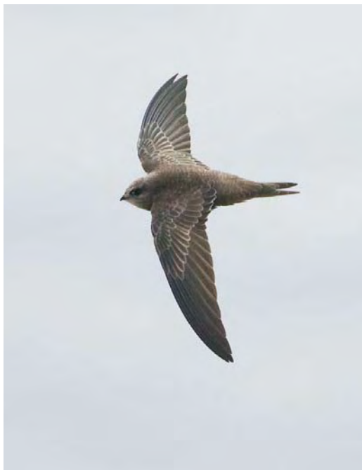
500 Pallid Swift / Vale Gierzwaluw Apus pallidus , Helgoland, Schleswig-Holstein, Germany, 29 October 2009