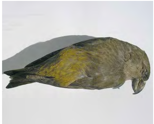
461 Rufous-tailed Rock Thrush / Rode Rotslijster Monticola saxatilis , male, Drouwenezand, Drenthe, 10 May 2008 ( Adri Groenendal ) 462 Rustic Bunting / Bosgors Emberiza rustica , first-year female, Groene Glop, Schiermonnikoog, Friesland, 17 November 2008 ( Henri Bouwmeester ) 463 Parrot Crossbill / Grote Kruisbek Loxia pytyopsittacus , Schoorl, Noord-Holland, Netherlands, 4 January 2008 ( Chris van Rijswijk/birdshooting.nl ) 464 Parrot Crossbill / Grote Kruisbek Loxia pytyopsittacus , female (found dead at Eerbeek, Gelderland, on 7 March 2008), Eerbeek, Gelderland, 24 March 2008 ( Jip Louwe Kooijmans )

This concerns a date extension of a record already mentioned in van der Vliet et al (2002). It appears that the bird was trapped not only on 13 September but also two days earlier (André van Loon/Vrs Schiermonnikoog in litt).