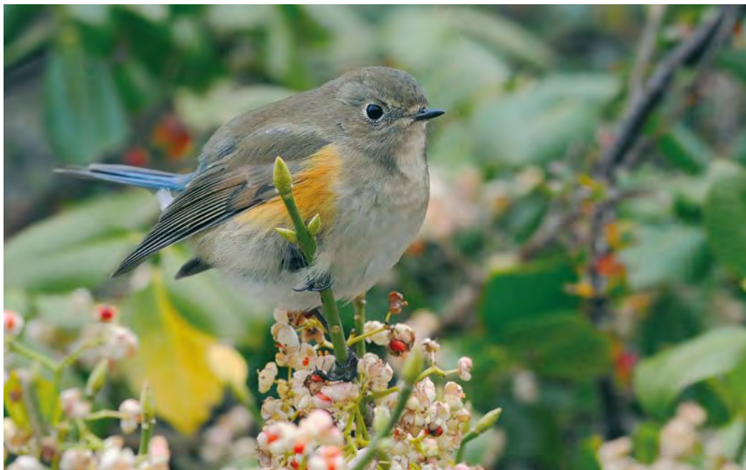
513 Red-flanked Bluetail / Blauwstaart Tarsiger cyanurus , first-year, Helgoland, Schleswig-Holstein, Germany, 31 October 2009