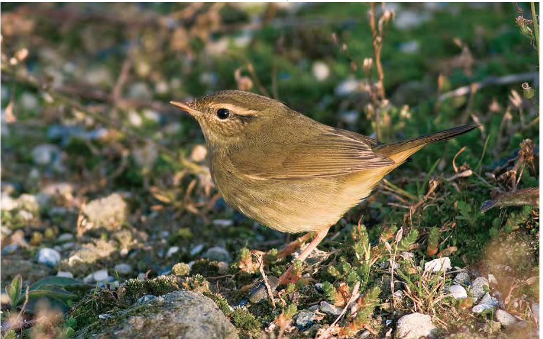
512 Radde's Warbler / Raddes Boszanger Phylloscopus schwarzi , Zeebrugge, West-Vlaanderen, Belgium, 22 October 2009