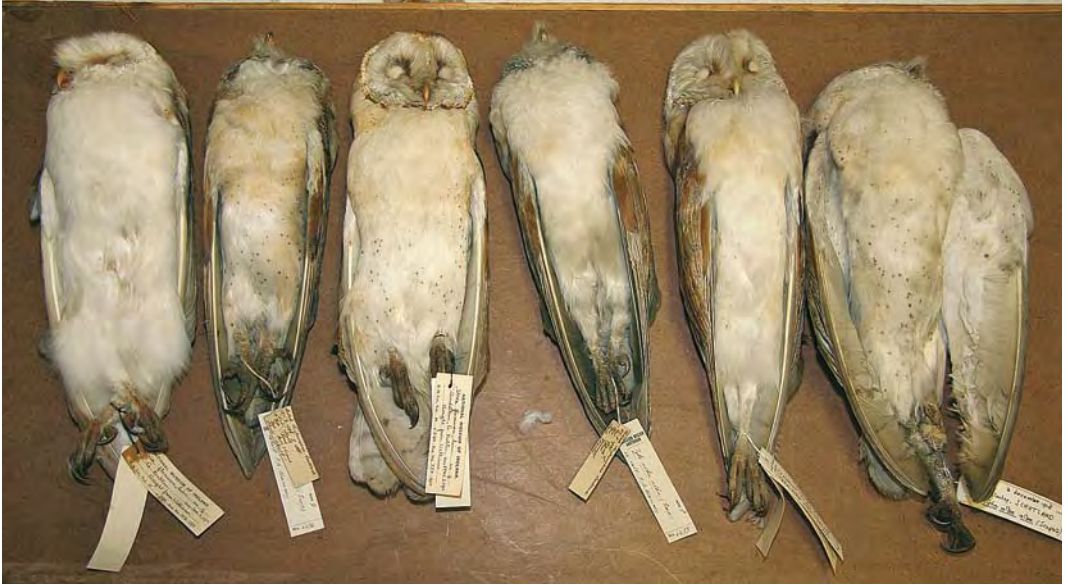
476-477 Witte Kerkuilen / Pale Barn Owls Tyto alba alba (alle verzameld in Engeland / all collected in England). Let op variatie in boven- en onderdelen / Note variation in upper- and underparts. Zoölogisch Museum Amsterdam, 16 februari 2009

Deze criteria worden bij de beoordeling van gevallen van alba door de CDNA als leidraad gehanteerd.