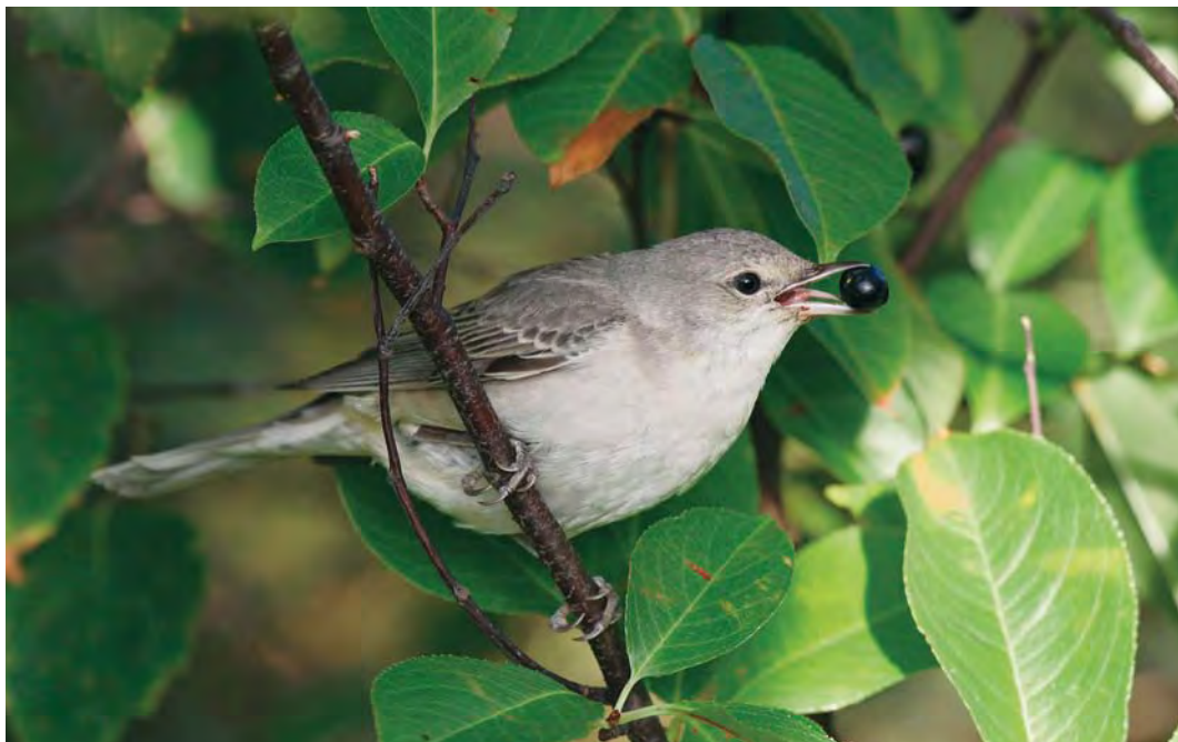
553 Spervergrasmus / Barred Warbler Sylvia nisoria , eerstejaars, Lange Paal, Vlieland, Friesland, 18 september 2009