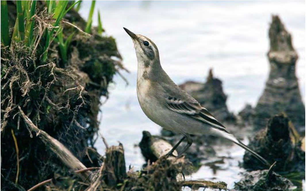
451 Citrine Wagtail / Citroenkwikstaart Motacilla citreola , first-year, Ooijpolder, Gelderland, 25 August 2008