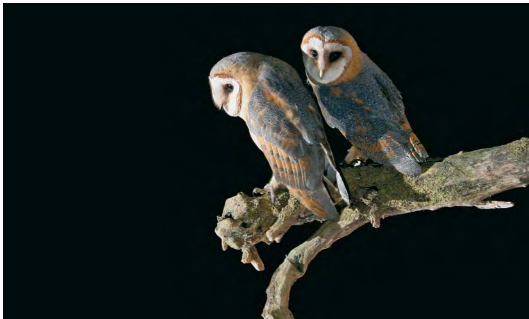
487 Kerkuilen / Dark Barn Owls Tyto alba guttata , juveniel, Barneveld, Gelderland, 27 augustus 2005. Let op vele donkergrijs op bovendelen / Note much dark grey on upperparts.