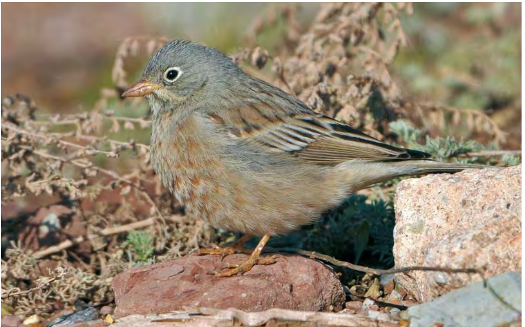
516 Grey-necked Bunting / Steenortolaan Emberiza buchanani , Helgoland, Schleswig-Holstein, Germany, 13 October 2009