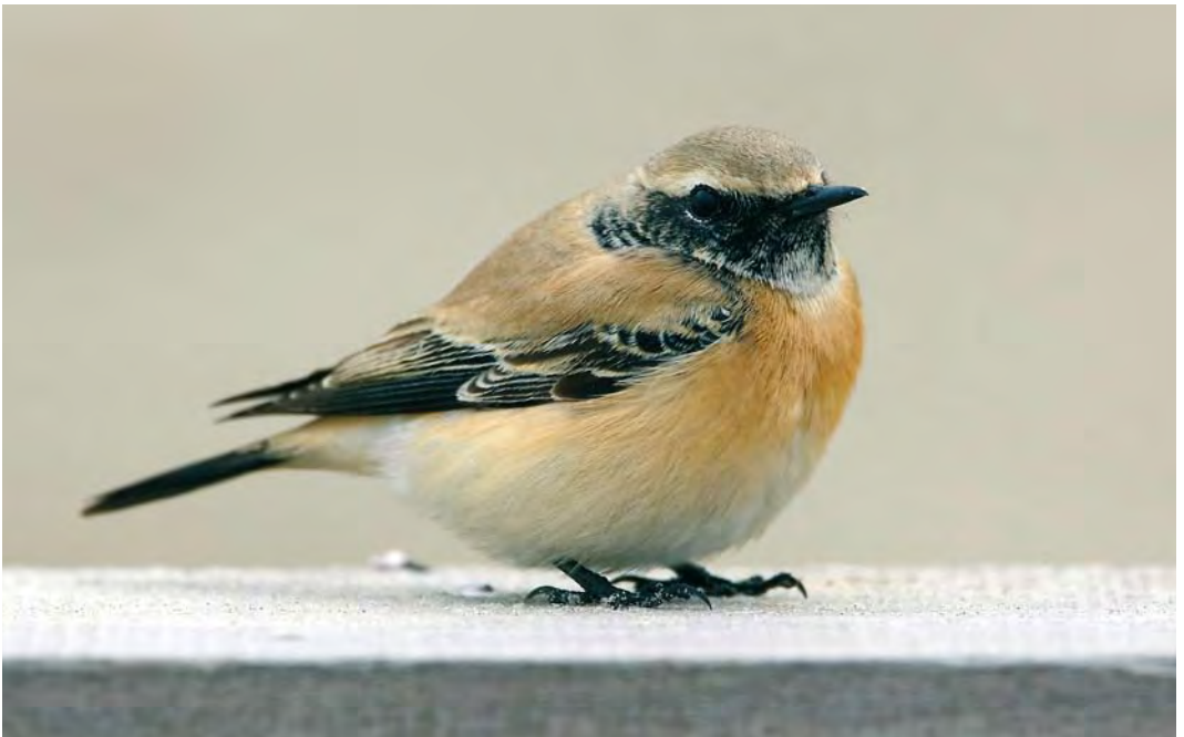
456 Desert Wheatear / Woestijntapuit Oenanthe deserti , male, Schoorl, Noord-Holland, 10 November 2008