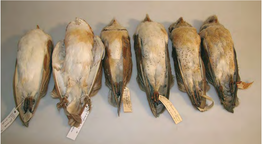
472-473 Witte Kerkuil / Pale Barn Owl Tyto alba alba (links / left; verzameld tussen / collected between Axel en / and Zuyddorp, Zeeland, 14 maart 1983). Vijf vogels rechts / five birds on right: Kerkuilen / Dark Barn Owls T. guttata , verzameld in Nederland / collected in Netherlands. Vijf rechtse vogels zijn lichte guttata 's of vogels van intermediaire/hybride populatie; tweede van links is zelfde als in plaat 470-471. Let op variatie in zowel boven- als onderdelen. Met name derde vogel van links is voor guttata erg geelbruin op bovendelen maar heeft vlekjes op onderdelen en behoorlijk crème bovenborst. Let ook op erg donkergrijze vlekken op bovendelen van drie rechter vogels / Five birds on right are pale guttata or 'intergrades/hybrids'; second left is same as in plate 470-471. Note variation in both upper- and underparts. Especially third bird from left is very yellow-brown on upperparts for guttata but has spots on underparts and rather cream-coloured upperbreast. Note also very dark grey spots on upperside in three on right. Van links naar rechts: twee mannetjes, twee vrouwtjes en twee mannetjes / from left to right: two males, two females and two males. Nationaal Natuurhistorisch Museum Naturalis, Leiden, 14 september 2007