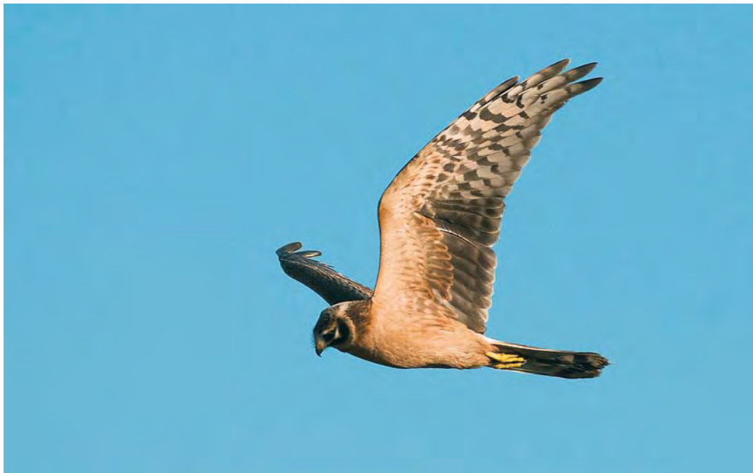
544 Steppekiekendief / Pallid Harrier Circus macrourus , eerstejaars mannetje, Dordtse Biesbosch, Zuid-Holland, 8 oktober 2009