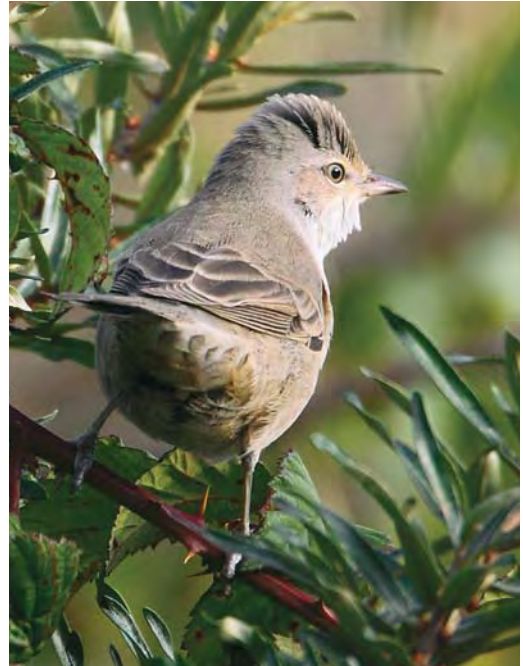
555 Kleine Spotvogel / Booted Warbler Acrocephalus caligatus , De Cocksdorp, Texel, Noord-Holland, 13 september 2009 556 Sperwergrasmus / Barred Warbler Sylvia nisoria , eerstejaars, De Cocksdorp, Texel, Noord-Holland, 15 oktober 2009 557 Mogelijke Vale Braamsluiper / possible Central Asian Lesser Whitethroat Sylvia curruca halimodendri , Robbenjager, Texel, Noord-Holland, 11 oktober 2009