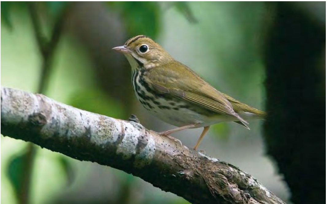
532 Ovenbird / Ovenvogel Seiurus aurocapilla , Corvo, Azores, 10 October 2009