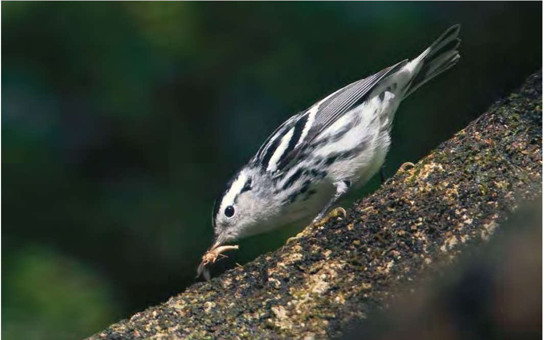
531 Black-and-white Warbler / Bonte Zanger Mniotilta varia , Ribeira do Ponte, Corvo, Azores, 7 October 2009