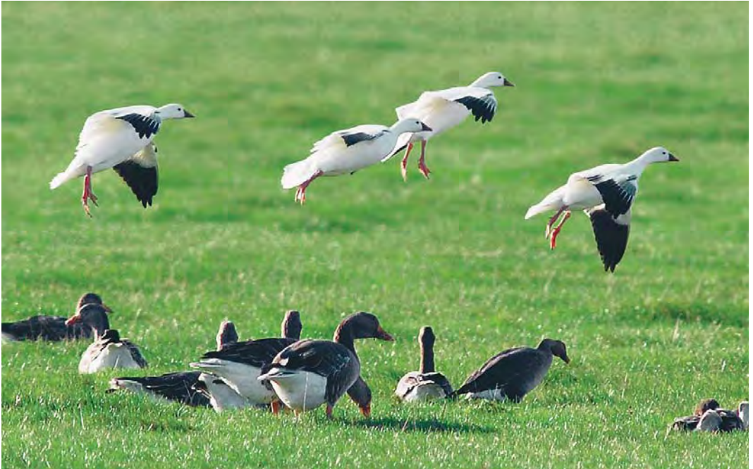
542 Ross' Ganzen / Ross's Geese Anser rossii , met Grauwe Ganzen / Greylag Geese A anser , Ottersaat, Texel, Noord-Holland, 12 oktober 2009