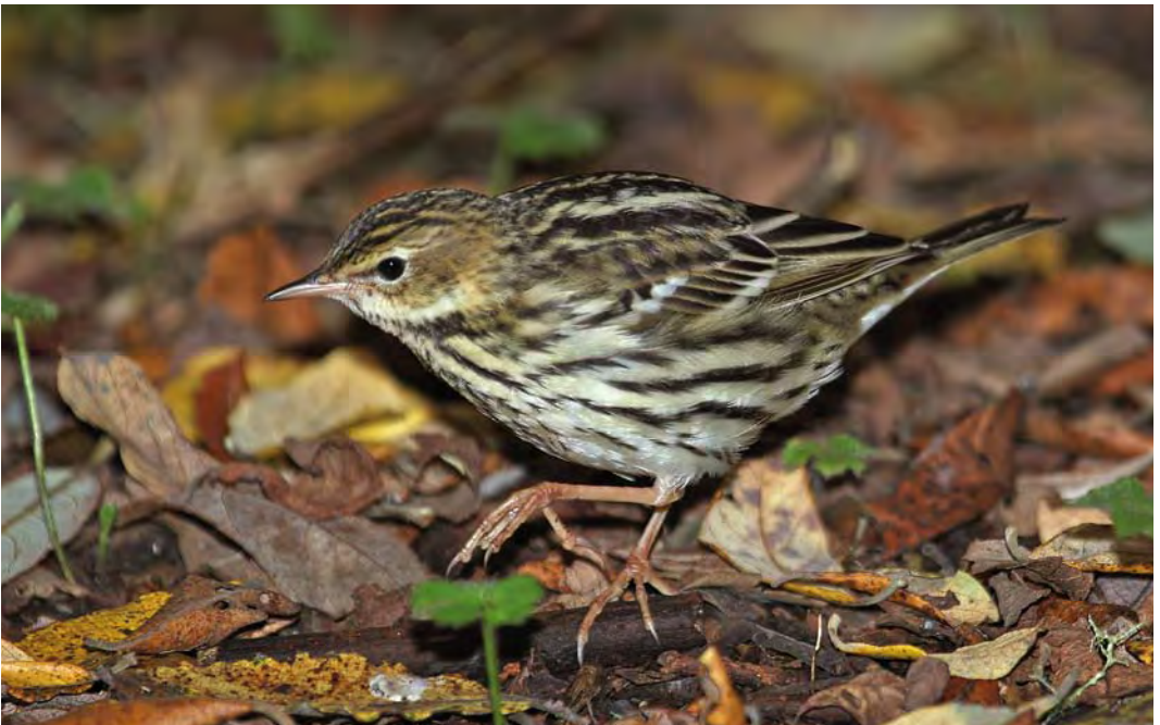
510 Pechora Pipit / Petsjorapieper Anthus gustavi , Ouessant, Finistère, France, 9 October 2009 (Aurélien Audevard)