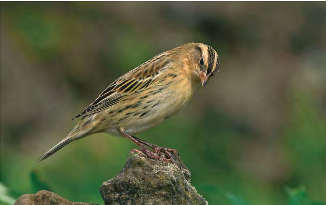
526 Bobolink / Bobolink Dolichonyx oryzivorus , Corvo, Azores, 11 October 2009 (Ferran López)