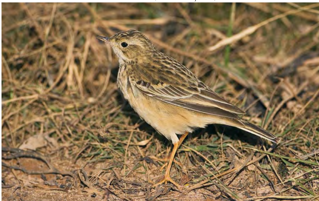
514 Blyth's Pipit / Mongoolse Pieper Anthus godlewskii , Helgoland, Schleswig-Holstein, Germany, 20 October 2009