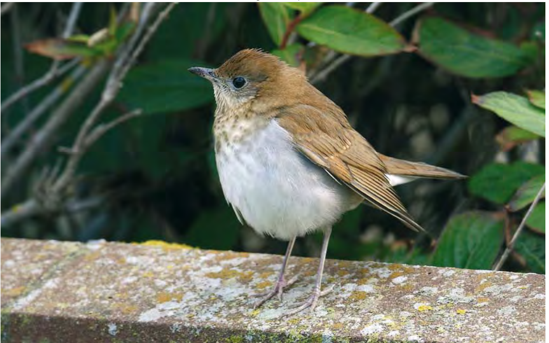
528 Veery / Veery Catharus fuscescens , first-year, Whalsay, Shetland, Scotland, 4 October 2009