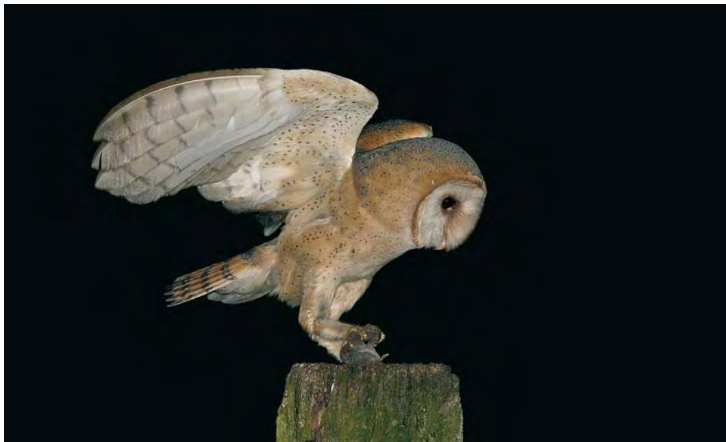
486 Kerkuil / Dark Barn Owl Tyto alba guttata , adult, Barneveld, Gelderland, 29 juni 2004. Let op donkere tekening op onderkant van buitenste handpennen / Note dark markings on underside of outer primaries.