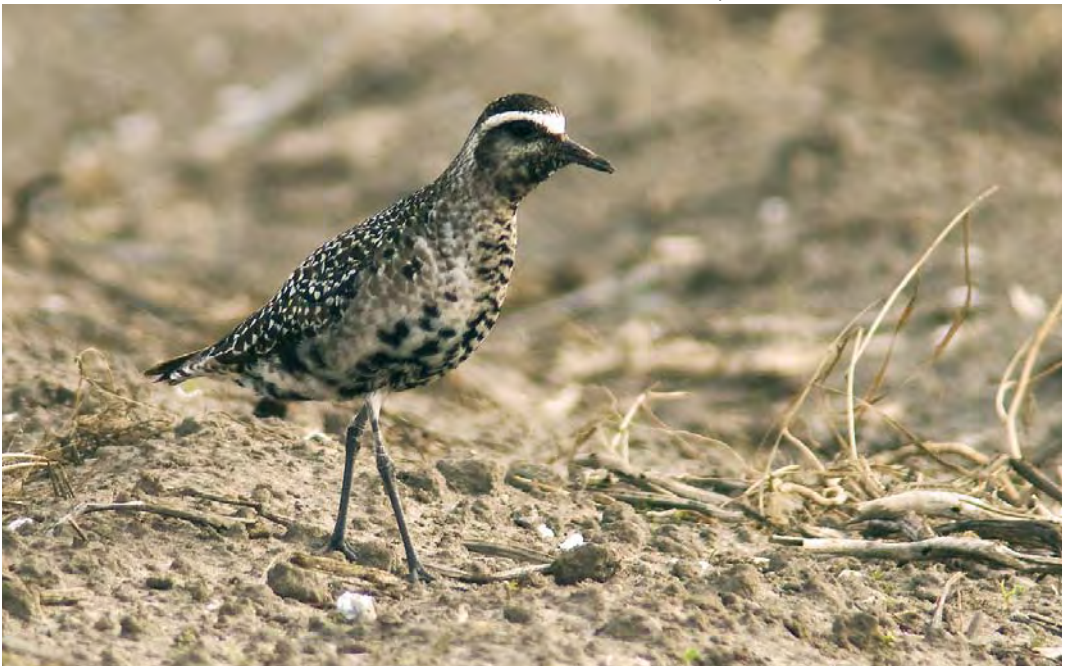
541 Amerikaanse Goudplevier / American Golden Plover Pluvialis dominica , adult, Buitendijk, Texel, Noord-Holland, 19 oktober 2009 (René Pop)