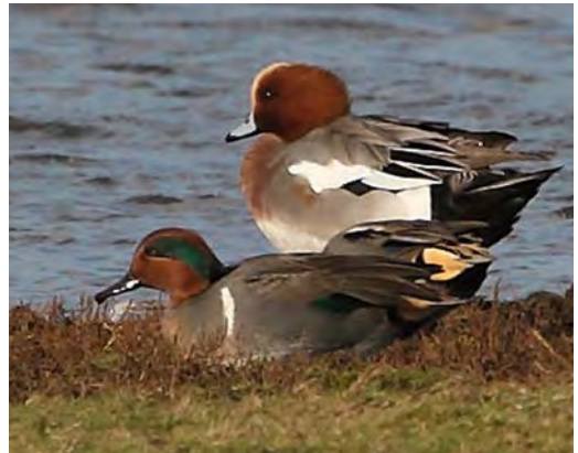
437 Spanish Imperial Eagle / Spaanse Keizerarend Aquila adalberti , second calendar-year, Loozerheide, Limburg, 6 May 2007 (René Weenink) 438 Short-toed Snake Eagle / Slangenarend Circaetus gallicus , Loozerheide, Limburg, 5 May 2008 (René Weenink) 439 Gyr Falcon / Giervalk Falco rusticolus , immature, Dollardkwelders, Groningen, 2 November 2008 (Rein Hofman) 440 Green-winged Teal / Amerikaanse Wintertaling Anas carolinensis , male, Eurasian Wigeon / Smient A penelope , Ottersaat, Texel, Noord-Holland, 27 October 2008 (Eric Menkveld)