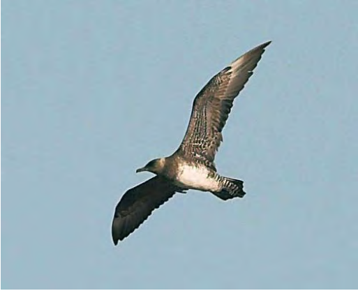
494 Pomarine Skua / Middelste Jager Stercorarius pomarinus , first-summer, Skagen, Nordjylland, Denmark, 5 September 2008. In this individual, post-juvenile moult not completed by September, indicated by old central secondaries and active moult in outer hand. Such slow moult progression is normal for Pomarine in second calendar-year.

their pelagic winter range during summer of which an unknown part wanders north to European waters. First-summer birds probably just occasionally reach the breeding grounds (eg, Meltofte 2007). Older immatures (second- and third-summer birds) more often reach the breeding grounds (increasingly per age-class) (de Korte 1986, Furness 1987, Olsen & Larsson 1997). So, the number of first-summer birds in western Europe is small.