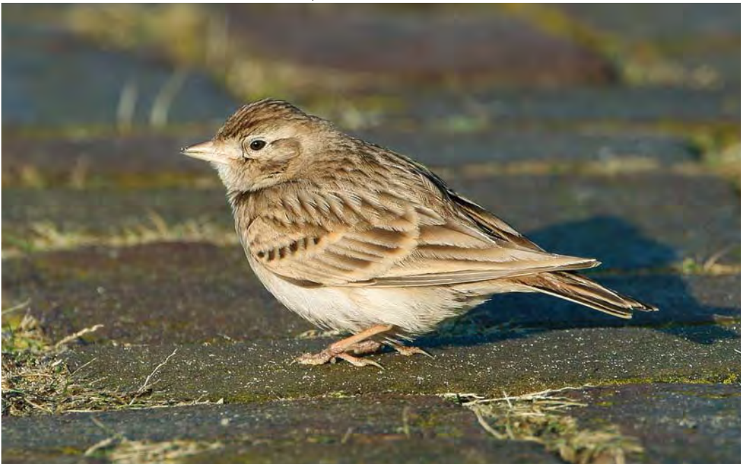
452 Greater Short-toed Lark / Kortteenleeuwerik Calandrella brachydactyla , Castricum aan Zee, Noord-Holland, 6 January 2008