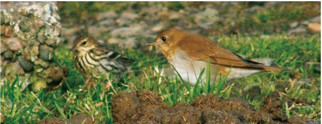
520 Dickcissel / Dickcissel Spiza americana , Flores, Azores, 6 November 2009 ( Nico de Vries ) 521 Black-throated Accentor / Zwartkeelheggenmus Prunella atrogularis , Simrishamn, Skåne, Sweden, 24 October 2009 ( Richard Ek ) 522 Chestnut Bunting / Rosse Gors Emberiza rutila , first-year male, Île de Sein, Finistère, France, 13 October 2009 ( Sebastien Reeber ) 523 Pechora Pipit / Petsjorapieper Anthus gustavi , Utsira, Rogaland, Norway, 10 October 2009 ( Bert de Bruin ) 524 Veery / Veery Catharus fuscescens , first-year, and Pechora Pipit / Petsjorapieper Anthus gustavi , Whalsay, Shetland, Scotland, 3 October 2009 ( Mark Wilkinson )