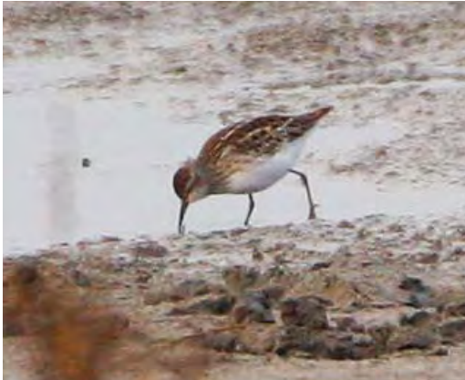
568 Taigastrandloper / Long-toed Stint Calidris subminuta , juveniel, Vreugderijkerwaard, Overijssel, 24 oktober 2009 (Martin van der Schalk)