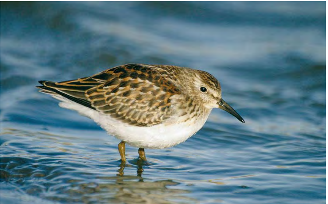
496 Least Sandpiper / Kleinste Strandloper Calidris minutilla , juvenile, Bakkatjörn, Seltjarnarnes, Iceland, 11 October 2009 ( Alex Máni )