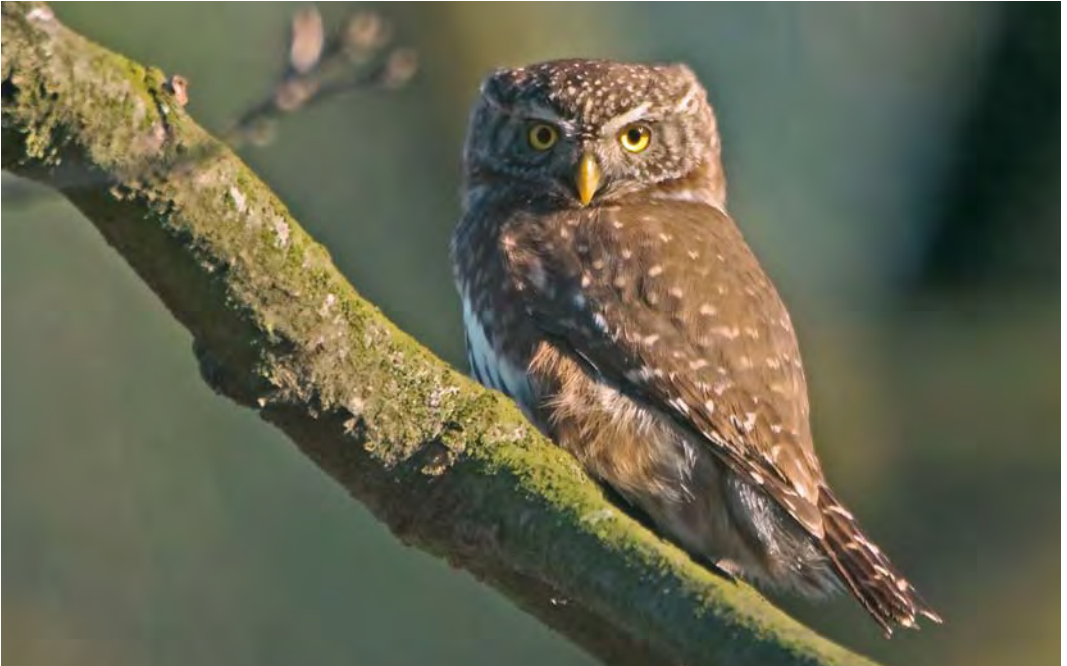
449 Eurasian Pygmy Owl / Dwerguil Glaucidium passerinum , Leenderbos, Noord-Brabant, 11 February 2008 (Jan-Kees Schwiebbe)