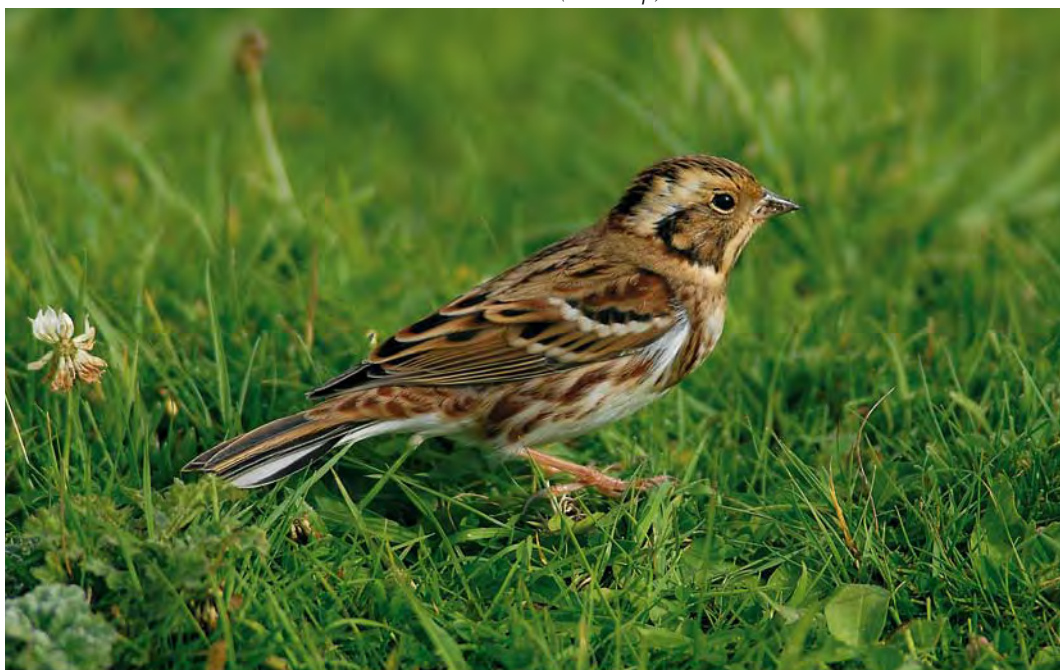
466 Rustic Bunting / Bosgors Emberiza rustica , first-year, De Cocksdoorp, Texel, Noord-Holland, Netherlands, 4 October 2008