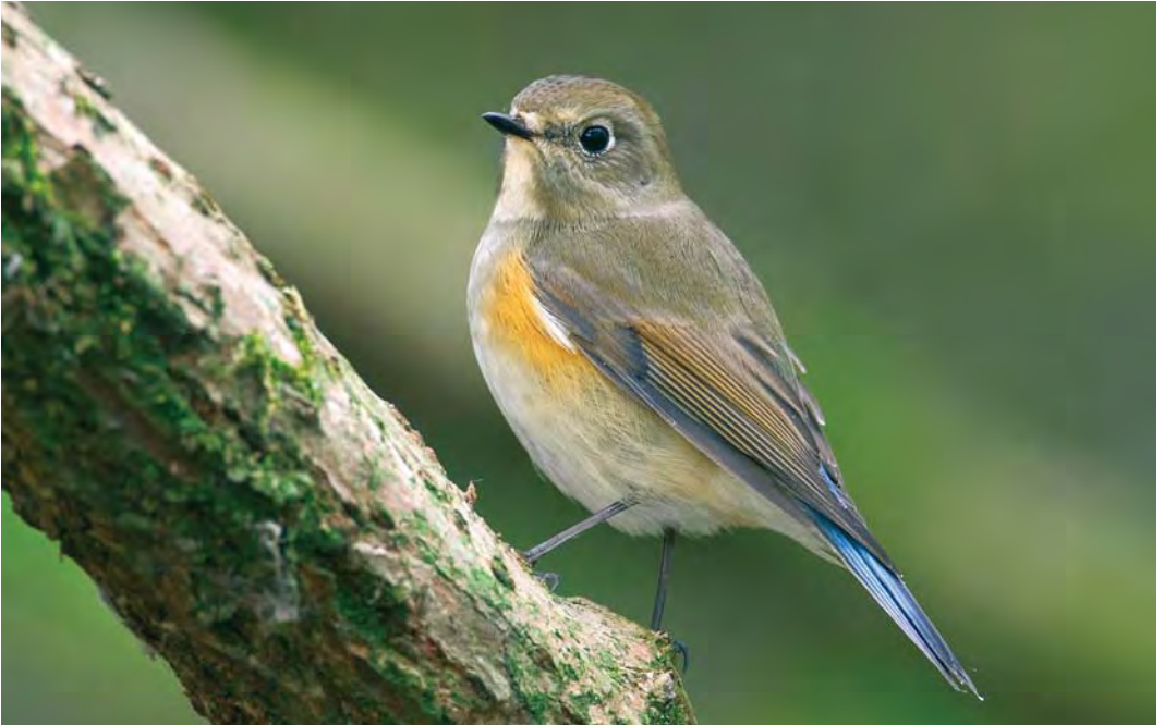
511 Red-flanked Bluetail / Blauwstaart Tarsiger cyanurus , first-year, Heist, West-Vlaanderen, Belgium, 18 October 2009