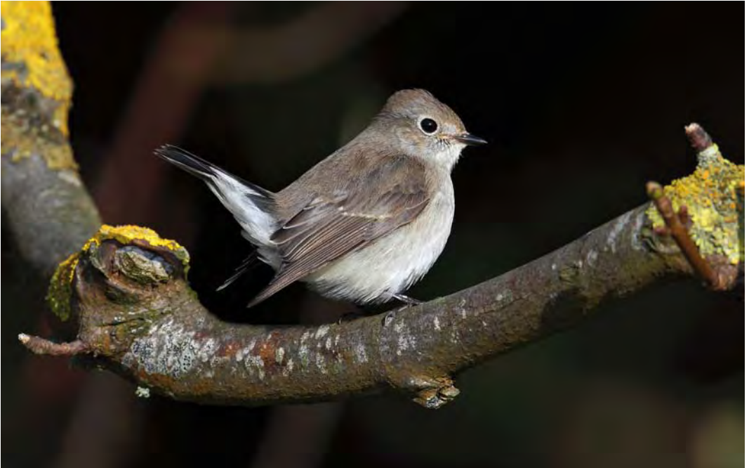
509 Taiga Flycatcher / Taigavliegenvanger Ficedula albicilla , first-year, Fetlar, Shetland, Scotland, 29 September 2009