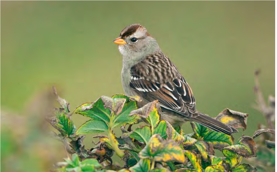
527 White-crowned Sparrow / Witkruingors Zonotrichia leucophrys , first-year, Ona, Sandøy, Møre og Romsdal, Norway, 9 October 2009