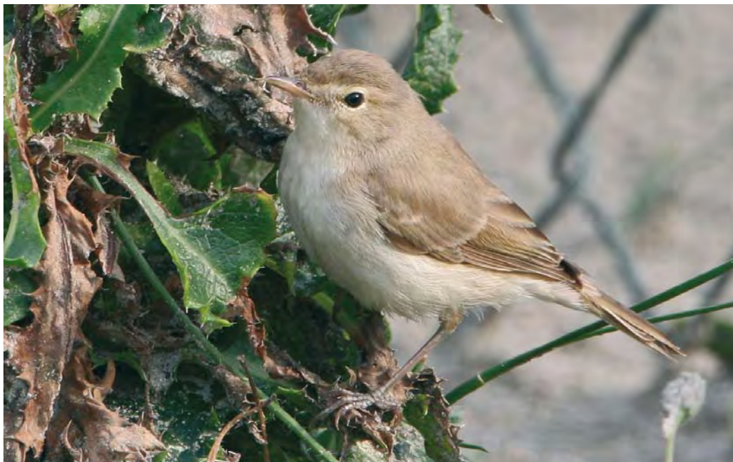
465 Booted Warbler / Kleine Spotvogel Acrocephalus caligatus , Maasvlakte, Zuid-Holland, Netherlands, 13 September 2008 (Martin van der Schalk)