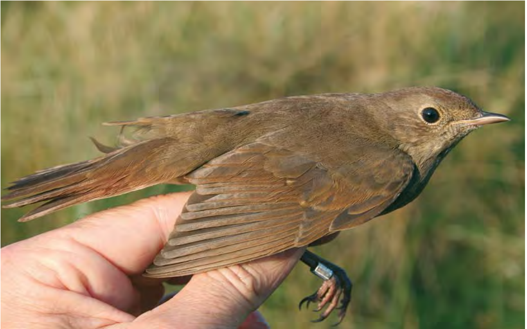
453 Thrush Nightingale / Noordse Nachtegaal Luscinia luscinia , Noordhollands Duinreservaat, Castricum, Noord-Holland, 31 August 2009 (Guido O Keijl)