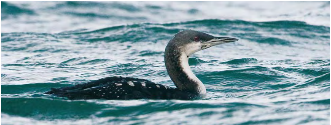
502 White-headed Duck / Witkopeend Oxyura leucocephala , Sidi Bou Rhaba, Kénitra, Morocco, 5 October 2009 503 American Scoter / Amerikaanse Zee-eend Melanitta americana , adult male, Miedzywodzie, Poland, 19 October 2009 504 Pacific Loon / Pacifische Parelduiker Gavia pacifica , Hayle Estuary, Cornwall, England, 22 November 2009

route of Common Cranes G grus and, therefore, it seems likely that the Sandhill will join them into Spain.