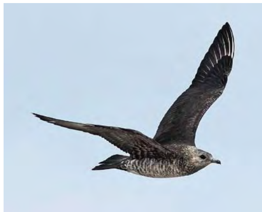
493 Parasitic Jaeger / Kleine Jäger Stercorarius parasiticus , first-summer, Skagen, Nordjylland, Denmark, 16 July 2009. Same individual as plate 492. Note uniform upperwing-coverts with pale fringes restricted to mantle-feathers.

rare occurrence may seem strange given that birds of this age class regularly do reach far north. This may reflect either a highly pelagic behaviour (and staying west of Britain, avoiding the shallow North Sea), difficulties in identification, or a combination of these factors.