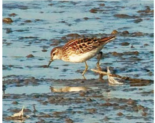
569 Taigastrandloper / Long-toed Stint Calidris subminuta , juveniel, Vreugderijkerwaard, Overijssel, 24 oktober 2009 (Dirk Ottenburghs)

waarschijnlijk naar een Taigastrandloper keken! Per telefoon en met veel enthousiasme kreeg HP te horen dat de vogel nu dichtbij zat en dat het waarschijnlijk een Taigastrandloper betrof! We besloten om de vogel voorzichtig te melden want we vonden het risico op een foutieve determinatie nog te hoog. Door kennis te nemen van de piep konden geïnteresseerde vogelaars zelf afwegen te gaan rijden of niet. Wietze Janse belde binnen zeven minuten na het inspreken terug en piepte de waarneming om 16:00 door met code 'mogelijk deze soort, determinatie lastig, wordt aan gewerkt'.