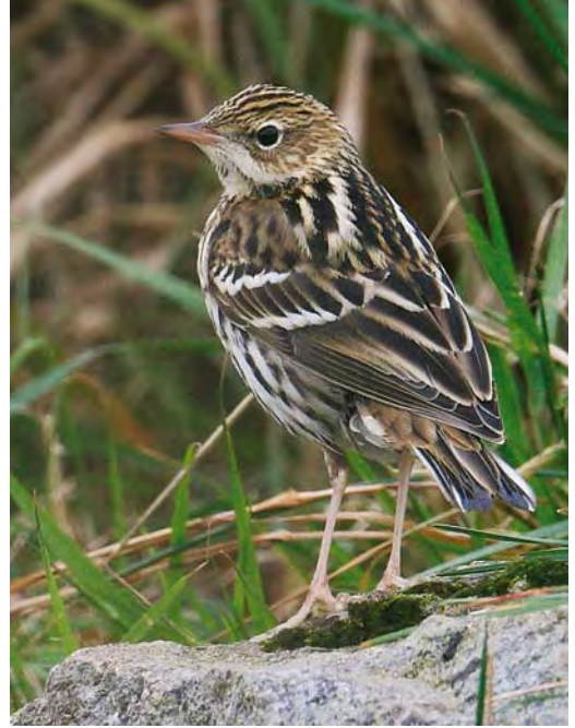
517 Brown Shrike / Bruine Klauwier Lanius cristatus , first-year, Staines Moor, Surrey, England, 7 November 2009 518 Pechora Pipit / Petsjorapieper Anthus gustavi , Whalsay, Shetland, Scotland, 2 October 2009 519 Arctic Warbler / Noordse Boszanger Phylloscopus borealis , Cape Clear, Cork, Ireland, 10 October 2009