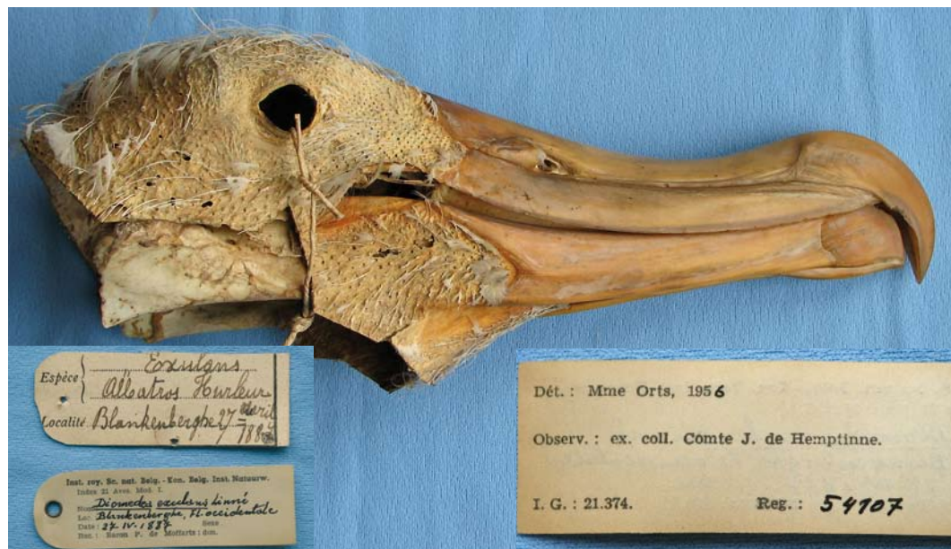
FIGURE 7 Wandering Albatross / Grote Albatros Diomedea exulans, found at Blankenberghe, West-Vlaanderen, Belgium, on 27 April 1887