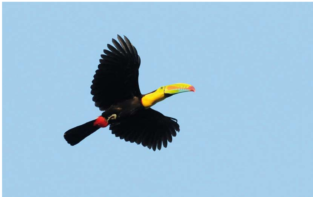
369 Keel-billed Toucan / Zwartborsttoekan Rhamphastos sulfuratus , Pipeline Road, Panama, 15 March 2009