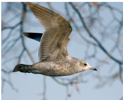
384-387 Stormmeeuw / Mew Gull Larus canus , eerste-winter, Visé, Liège, België, december 2008. Verenkleeed met aantal kenmerken van kamtschatschensis maar formaat en snavelvorm duiden op nominaat canus / Plumage showing characters of kamtschatschensis but size and bill shape indicate nominate canus .

nominaat canus en (westelijke) heinei niet altijd duidelijk is worden ze behandeld zonder apart te worden benoemd, tenzij dit aan de orde is.