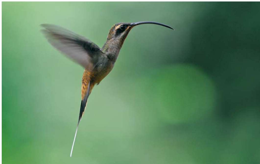
352 Long-billed Hermit / Grote Heremietkolibrie Phaethornis longirostris , Forest Discovery Center, Panama, 6 March 2009 (Roef Mulder)