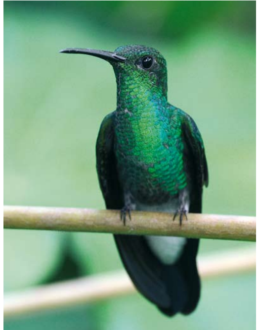
354 Green-crowned Brilliant / Groenkruinbriljantkolibri Heliodoxa jacula , Los Quetzales, Chiriquí, Panama, 11 March 2009 (Roef Mulder) 355 White-vented Plumeleteer / Buffons Pluimkolibri Chalybura buffoni , Forest Discovery Center, Panama, 13 June 2009 (Roef Mulder) 356 Violet-crowned Woodnymph / Paarskroonbosnif Thalurania colombica , female, Forest Discovery Center, Panama, 13 June 2009 (Roef Mulder)