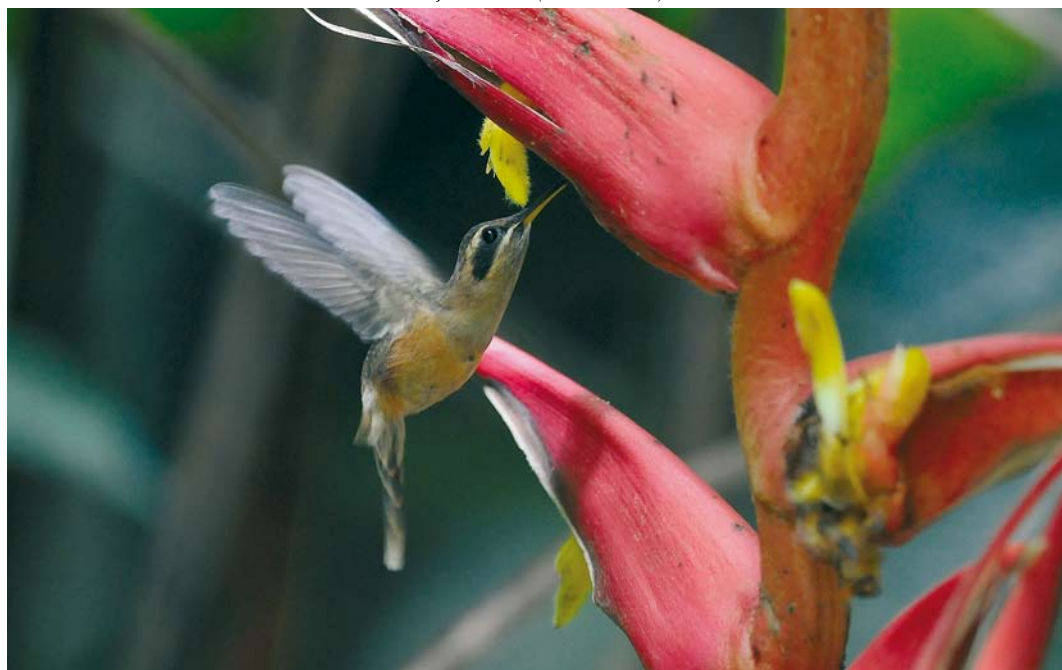
353 Stripe-throated Hermit / Kleine Streepkeelheremietkolibrie Phaethornis striigularis , El Valle, Panama, 16 June 2009 (Roef Mulder)