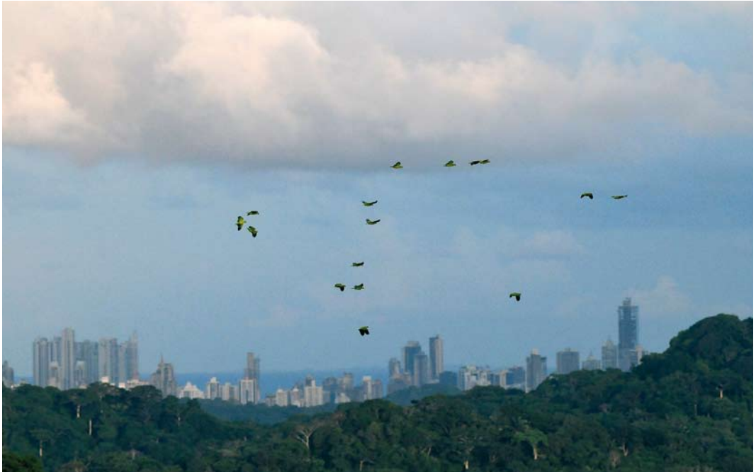
371 Red-ored Parrots / Geelwangamazones Amazona autumnalis , Canopy Tower, Soberanía National Park, Panama, 15 June 2009. Forest view from Canopy Tower, with Panama City in background.

mogelijkheden voor vogelfotografie. Door de grote verscheidenheid en de spectaculair getekend soorten is het een aantrekkelijke bestemming voor vogelfotografen maar in het regenwoud zijn de omstandigheden vaak erg lastig (weinig licht, vochtig, slecht zicht) en vraagt het goed fotograferen veel geduld en inzet. In deze omstandigheden is het fotograferen uit de hand met een gestabiliseerde lens met niet al te grote vergroting (200-400 mm) het meest geschikt, omdat met dergelijke apparatuur snel gereageerd kan worden op wendbare vogels in het bos. ‘Digiscopen’ is in het regenwoud en eigenlijk alleen geschikt om bewijsplaatjes te maken, behalve als aan de bosrand of op een uitkijkpunt boven de bomen de lichtomstandigheden beter zijn.