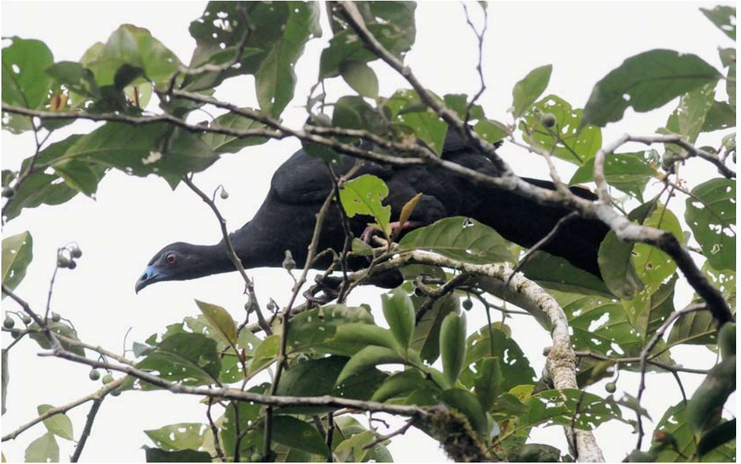
367 Black Guan / Zwarte Goean Chamaepetes unicolor , Cerro Gaital, Panama, 18 June 2009 (Roef Mulder)