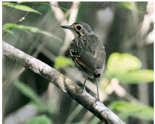
347 Streak-chested Antpitta / Brilmierpitta Hylopezus perspicillatus , male, Pipeline Road, Panama, 12 June 2009

Panama Bay offers shorebirds and seabirds and a half-day visit to the coast can strongly boost the trip-list, although many of the species present