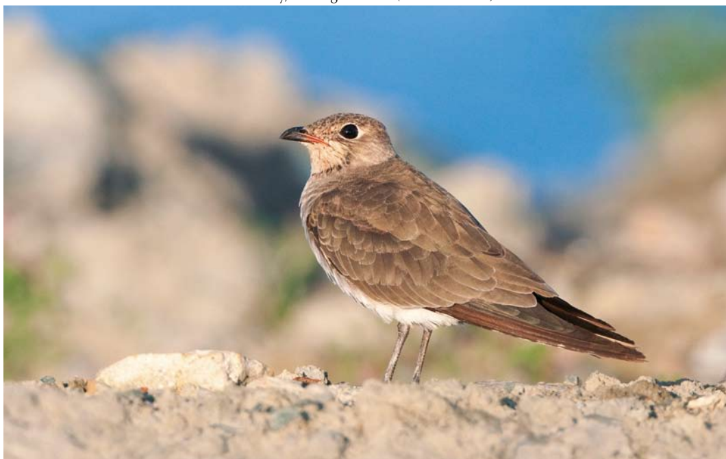
399 Oriental Pratincole / Oosterse Vorkstaartplevier Glareola maldivarum , Grilstadjæra, Trondheim, Sør-Trøndelag, Norway, 23 August 2009