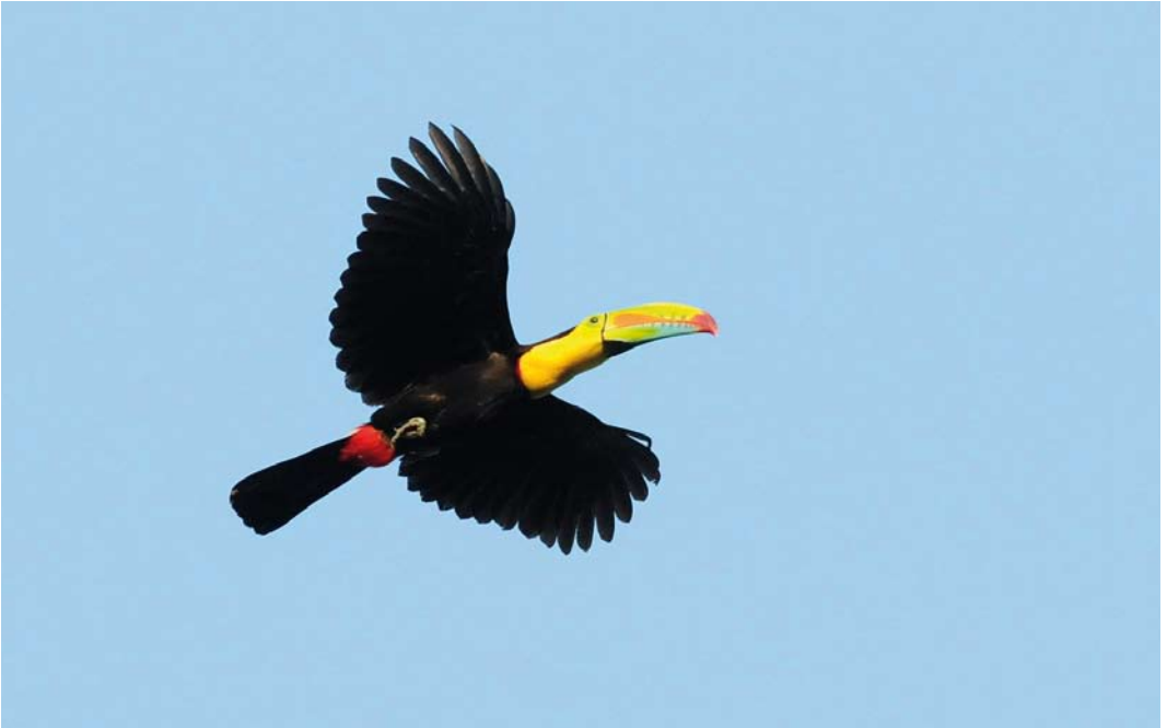
369 Keel-billed Toucan / Zwartborsttoekan Rhamphastos sulfuratus , Pipeline Road, Panama, 15 March 2009