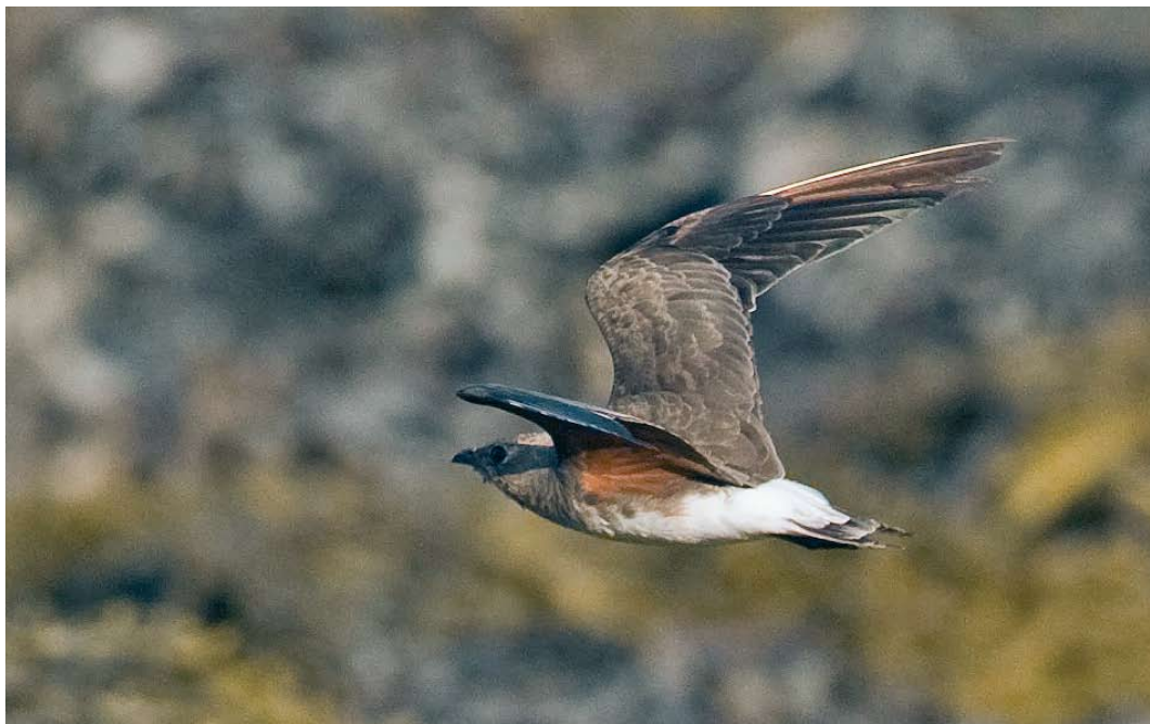
398 Oriental Pratincole / Oosterse Vorkstaartplevier Glareola maldivarum , Grilstadjæra, Trondheim, Sør-Trøndelag, Norway, 23 August 2009