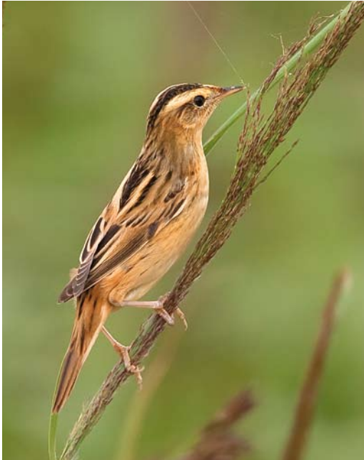
434 Waterrietzanger / Aquatic Warbler Acrocephalus paludicola , De Schorren, Texel, Noord-Holland, 18 augustus 2009