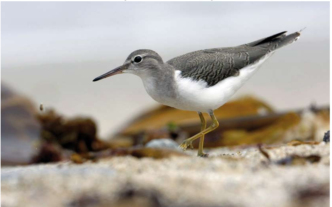
404 Spotted Sandpiper / Amerikaanse Oeverloper Actitis macularius , first-year, Ferrol, A Coruña, Spain, 2 August 2009