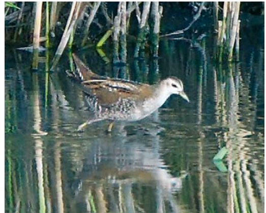
415 Eastern Olivaceous Warbler / Oostelijke Vale Spotvogel Acrocephalus pallidus , Utsira, Rogaland, Norway, 21 August 2009 ( Øystein B Nilsen ) 416 Two-barred Crossbill / Witbandkruisbek Loxia leucoptera , adult male, Stöðvarfjörður, Iceland, 6 August 2009 ( Yann Kolbeinnsson ) 417 River Warbler / Kreckelzanger Locustella fluviatilis , juvenile, Marche-en-Famenne, Luxembourg, Belgium, 6 August 2009 ( Didier Vieuxtemps ) 418 Little Crake / Klein Waterhoen Porzana parva , juvenile, Lier-Anderstad, Antwerpen, Belgium, 27 August 2009 ( Kris De Rouck )

southern Finland where, for instance, 21 were ringed at Hanko until 14 September. The first Richard's Pipit Anthus richardi reported this autumn for Egypt was as early as 12 September. Six Buff-bellied Pipits A rubescens turned up in Iceland from 21 September (there are 17 previous records). The fourth breeding of Citrine Wagtail Motacilla citreola for Norway concerned a female paired with a male Blue-headed Wagtail M flava at Vågsvollvåien, Vest-Agder; it stayed for three to four weeks from late May but breeding was probably unsuccessful (none of the previous breeding records involved a pure pair either). The first for the Azores was found together with an American Great Egret Casmerodius albus egretta , four White-rumped Sandpipers and a Least Sandpiper at Caldeirão, Corvo, on 14 September.