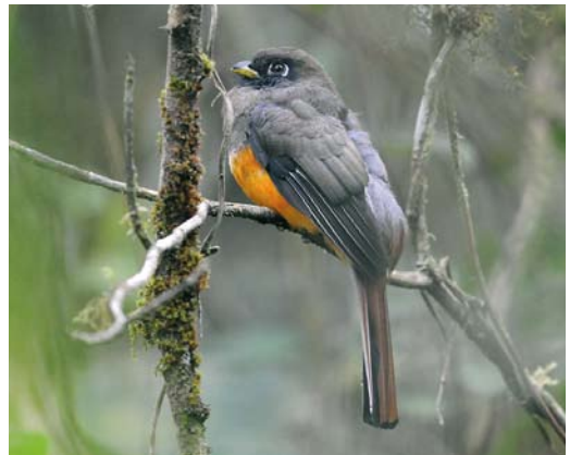
357 White-tipped Sickletail / Haaksnavelkolibrie Eutoxeres aquila , El Valle, Panama, 16 June 2009 (Roef Mulder) 358 Violet-headed Hummingbird / Paarskopkolibrie Klais guimeti , female, Canopy Lodge, El Valle, Panama, 15 June 2009 (Roef Mulder) 359 White-necked Jacobin / Witnekkolibrie Florisuga mellivora , Forest Discovery Center, Panama, 6 March 2009 (Roef Mulder) 360 Violet-bellied Hummingbird / Paarsbuikkolibrie Damophila julie , Forest Discovery Center, Panama, 13 June 2009 (Roef Mulder) 361 Red-capped Manakin / Geelbroekmanakin Pipra mentalis , male, Canopy Tower, Soberanía National Park, Panama, 2 March 2009 (Roef Mulder) 362 Orange-bellied Trogon / Oranjebuiktrogon Trogon aurantiiventris , male, Cerro Gaital, Panama, 9 March 2009 (Roef Mulder)