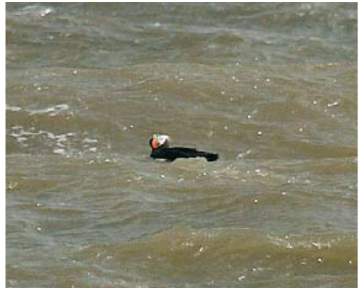
411-412 American Black Tern / Amerikaanse Zwarte Stern Chlidonias niger surinamensis , first-year, Farmoor Reservoir, Oxfordshire, England, 1 September 2009 413-414 Tufted Puffin / Kuifpapegaaiduiker Fratercula cirrhata , Swale Estuary, Kent, England, 16 September 2009

In England, a juvenile American Black Tern Chlidonias niger surinamensis remained at Farmoor Reservoir, Oxfordshire, from 28 August to 3 September, together with a juvenile Black Tern C. n. niger and a juvenile White-winged Tern C. leucopterus . Previous records include singles in Dublin, Ireland, and Somerset, England, in October 1999 and in Outer Hebrides in November 2008. In the Azores, a first-year American Black stayed at Cabrito reservoir, Terceira, from 11 September. On 24 August and 7 September, respectively, 575 and 550 Roseate Terns Sterna dougallii were counted at the roost of Sandymount Strand, Dublin. The fourth Black Guillemot Cephus grylle for Spain was a first-winter at Ría de la Villa from 31 August to at least 5 September. An adult Tufted Puffin Fratercula cirrhata swimming for 15 min less than 80 m from the shore of Oare Marshes along the Swale Estuary, Kent, on 16 September was the first for Britain and the second for the WP (the first was in Sweden in June 1994); it flew off and landed to swim for another 5 min within view before it flew off west not to be seen again.