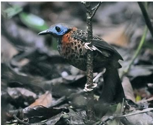
346 Ocellated Antbird / McCleannans Miervogel Phaenostictus mcleannani , Pipeline Road, Panama, 13 June 2009

is a more conventional but delicately designed lodge next to a small stream on the outskirts of El Valle, at c 650 m above sea level. With a series of feeders in the garden, this place is just the opposite of the tower: it brings the birds down to the birders and many hours can be spent just watching the birds feeding on the bananas. El Valle is situated in the caldera of a long extinct volcano. In the surrounding hills, largely covered by cloud-forest, several (half-)day excursions can be made, including to Cerro Gaital Natural Monument and the cloud forest of Altos del Maria, with altitudes reaching 1600 m above sea level. For the higher unpaved roads, a four-wheel drive car is necessary.