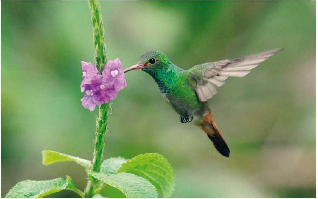
350 Rufous-tailed Hummingbird / Roodstaartamazilia Amazilia tzacatl , Forest Discovery Center, Panama, 13 June 2009 (Roef Mulder)