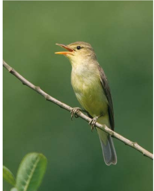
435 Orpheusspotvogel / Melodious Warbler Hippolais polyglotta , Sint Oedenrode, Noord-Brabant, 5 juli 2009 (Marc Gottenbos)

Cockschorp op Texel. Op c 12 plekken werden Hoppen Upupa epops waargenomen. De waarnemingen op 9 augustus bij Durgerdam en later op Marken, Noord-Holland, hebben vermoedelijk betrekking op hetzelfde exemplaar. Andere bevonden zich onder meer van 13 tot 18 juli bij Roermond, Limburg; op 26 augustus bij Haaksbergen, Overijssel; op 26 en 27 augustus bij 's-Gravensande, Zuid-Holland; en van 29 tot 31 augustus bij Zevenaar, Gelderland. In de laatste 10 dagen van augustus werden op meer dan 20 plekken Draaihalzen Jynx torquilla gemeld. Kuifleeuweriken Galerida cristata werden uitsluitend gezien op de bekende plekken bij Venlo, Limburg (maximaal drie), 's-Hertogenbosch, Noord-Brabant, en Eindhoven, Noord-Brabant. Een Roodstuitzwaluw Cecropis daurica vloog op 19 augustus over het Dwingelderveld bij Dwingeloo, Drenthe.