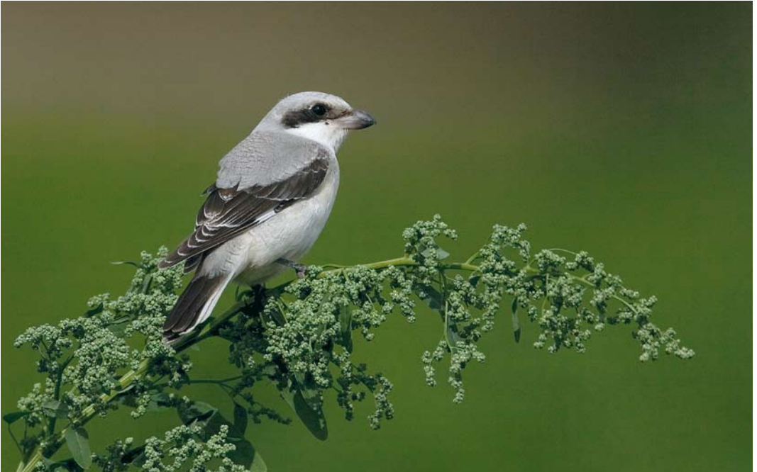
419 Lesser Grey Shrike / Kleine Klapekster Lanius minor , first-year, Othée, Liège, Belgium, 29 August 2009