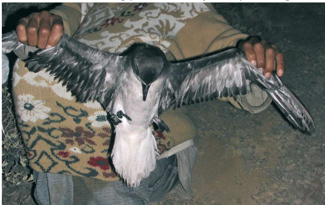
394 Aberrant Fea's Petrel / Gon-gon Pterodroma feae , adult, Fogo, Cape Verde Islands, 21 March 2007 (Jacob González-Solís). Note grey wash on whole of underparts and very dark underwing.