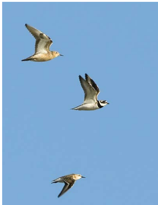
425 Marmereend / Marbled Duck Marmaronetta angustirostris , Westkapelle, Zeeland, 11 juli 2009 (Marten van Dijl/charlatanmessiah.com) 426 Blonde Ruiters / Buff-breasted Sandpiper Tryngites subruficollis , adult, met Bontbekplevier / Greater Ringed Plover Charadrius hiaticula en Kleine Strandloper / Little Stint Calidris minuta , Ezumakeeg, Friesland, 21 augustus 2009 (Jan Bosch) 427 Kleine Burgemeester / Iceland Gull Larus glaucooides , eerste-zomer, Scheveningen, Zuid-Holland, 15 juli 2009 (Marten van Dijl/charlatanmessiah.com)