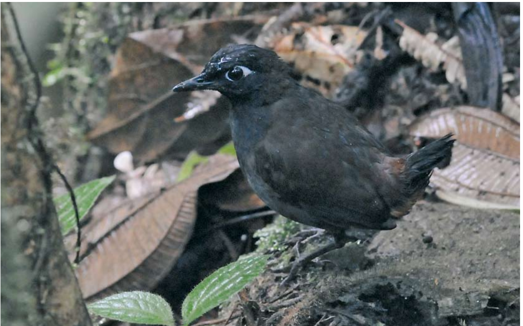
345 Black-headed Antthrush / Zwartkopmierlijster Formicarius nigricapillus , male, El Valle, Panama, 19 June 2009 (Roef Mulder)