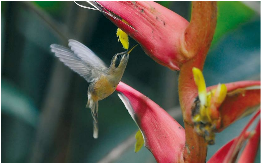
353 Stripe-throated Hermit / Kleine Streepkeelheremietkolibrie Phaethornis striigularis , El Valle, Panama, 16 June 2009