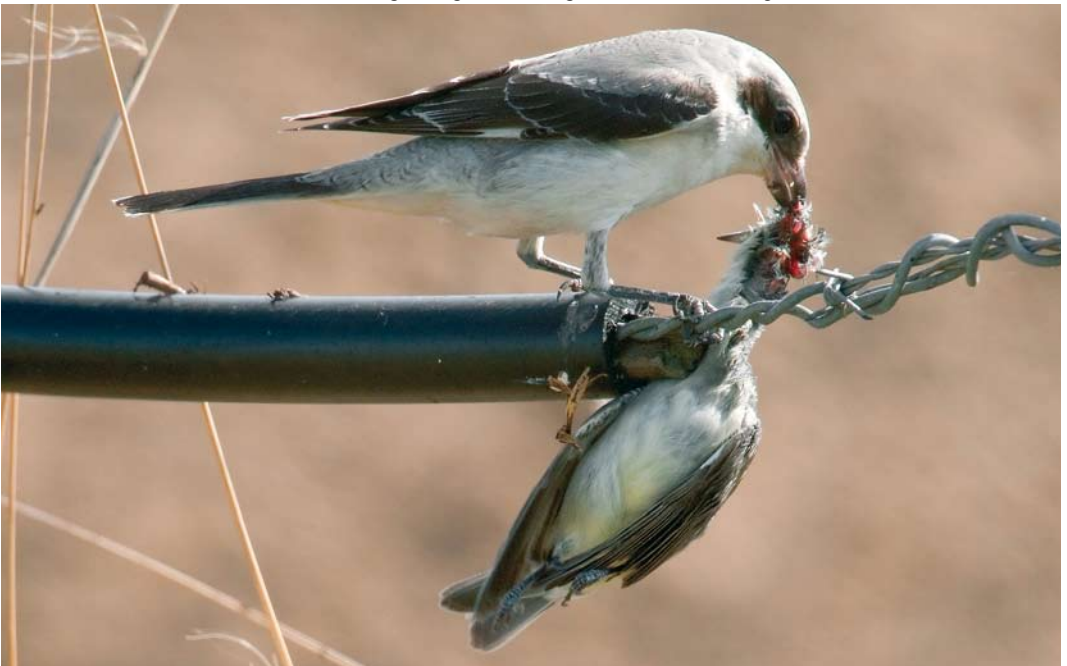
420 Lesser Grey Shrike / Kleine Klapekster Lanius minor , first-year, with Blackcap / Zwartkop Sylvia atricapilla , male, Othée, Liège, Belgium, 29 August 2009