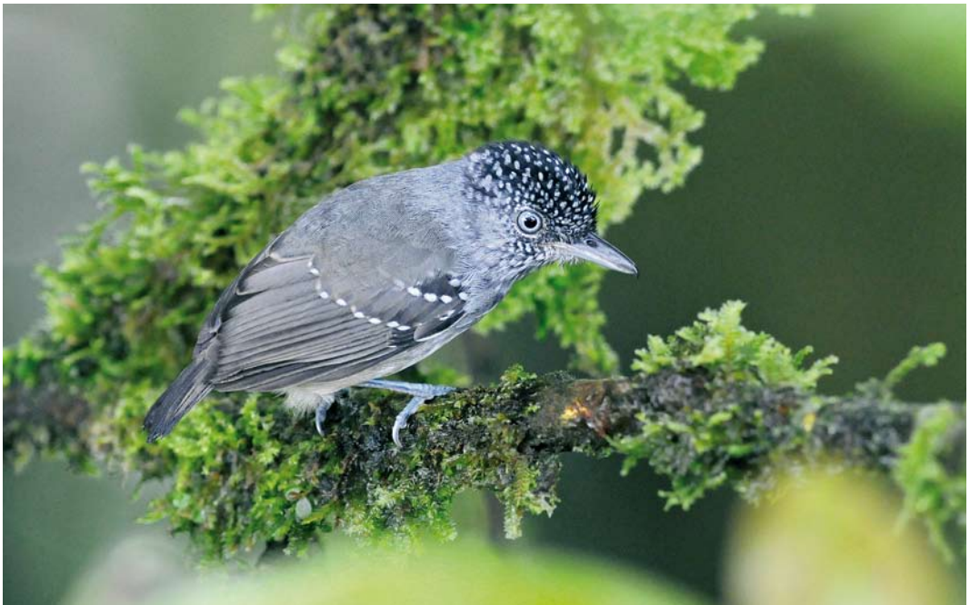
343 Spot-crowned Antvireo / Vlekkapmiervireo Dysithamnus puncticeps , male, El Valle, 8 March 2009 (Roef Mulder)