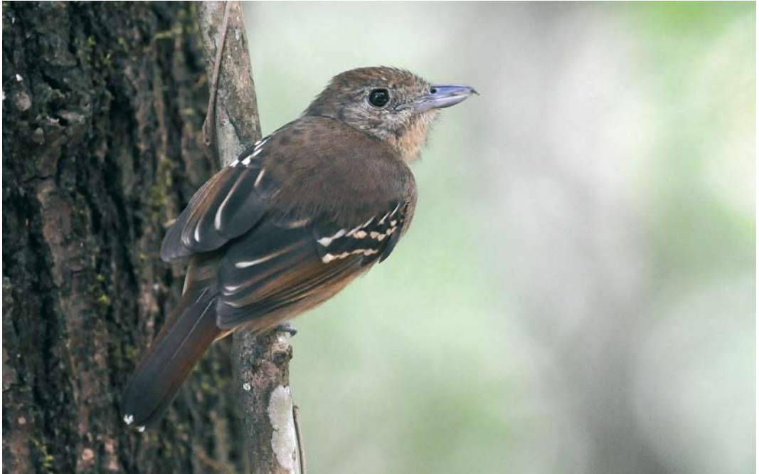
342 Western Slaty Antshrike / Westelijke Gevlekte Mierklauwier Thamnophilus atrinucha , female, Pipeline Road, Panama, 4 March 2009