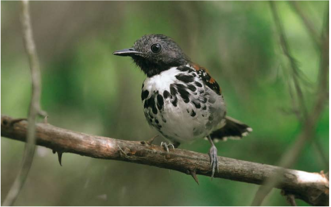
340 Spotted Antbird / Vlekborstmiervogel Hylophylax naevioides , Forest Discovery Center, Panama, 13 June 2009 (Roef Mulder)