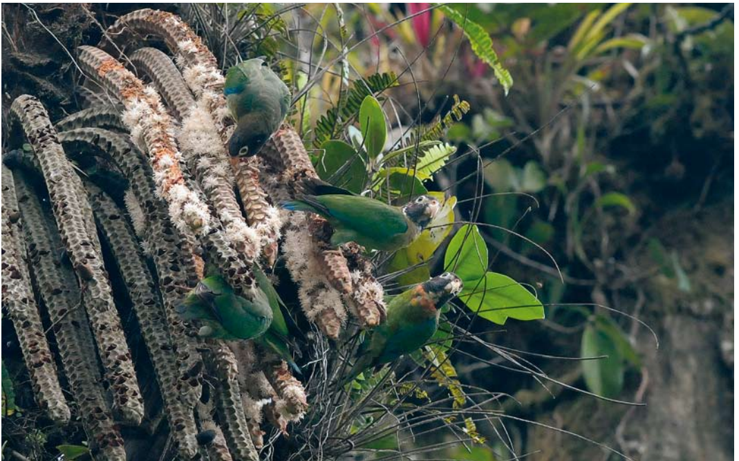
368 Brown-hooded Parrots / Roodoorpapegaaien Pionopsitta haematotis , El Valle, Panama, 18 June 2009