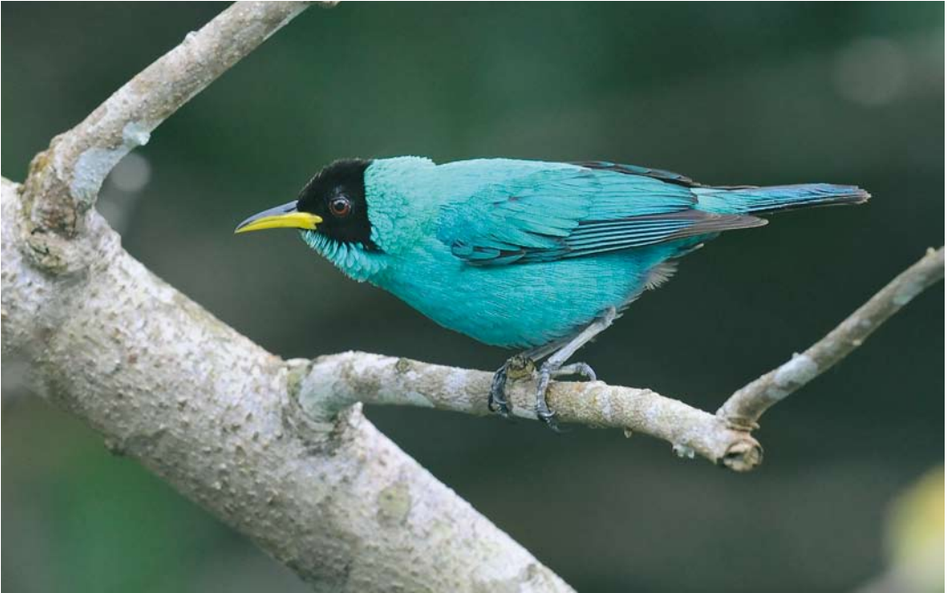
365 Green Honeycreeper / Groene Suikervogel Chlorophanes spiza , male, Canopy Tower, Soberanía National Park, Panama, 11 June 2009 (Roef Mulder)