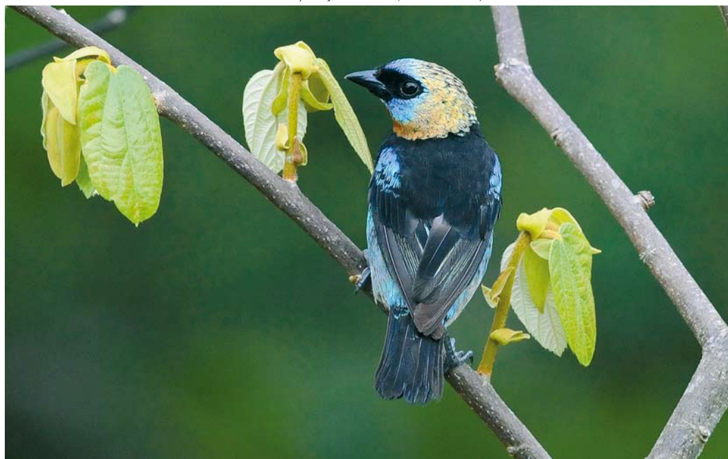
364 Golden-hooded Tanager / Purpermaskertangare Tangara larvata , Canopy Tower, Soberanía National Park, Panama, 11 June 2009