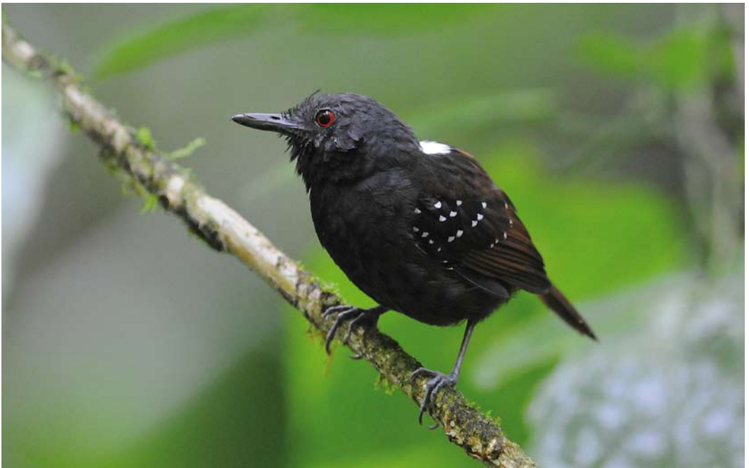
341 Dull-mantled Antbird / Grijskruinmiervogel Myrmeciza laemosticta , male, El Valle, Panama, 18 June 2009 (Roef Mulder)