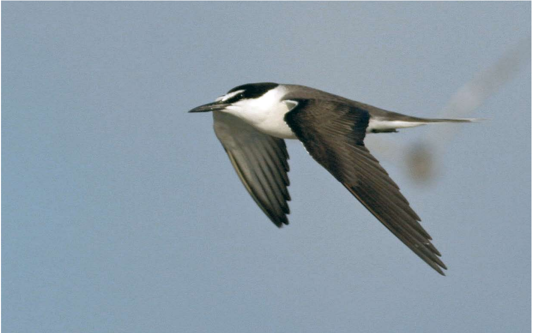
403 Bridled Tern / Brilstern Onychoprion anaethetus , Nachlieni, Western Galilee, Israel, 6 August 2009