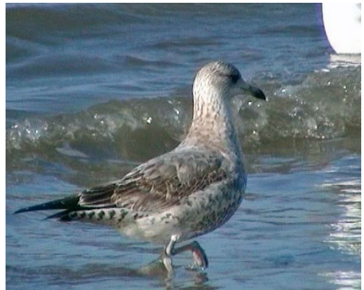
374 Stormmeeuw / Mew Gull Larus canus met kenmerken van Kamtsjatkastormmeeuw / showing characters of Kamtschatka Gull L c kamtschatschensis , eerstejaars (links / left), met / with Zilvermeeuw / Herring Gull L argentatus , eerstejaars / first-year, Egmond aan Zee, Noord-Holland, 11 februari 2005 (Leon Edelaar) 375-379 Stormmeeuw / Mew Gull Larus canus met kenmerken van Kamtsjatkastormmeeuw / showing characters of Kamtschatka Gull L c kamtschatschensis , eerstejaars, Egmond aan Zee, Noord-Holland, 11 februari 2005 (Leon Edelaar)