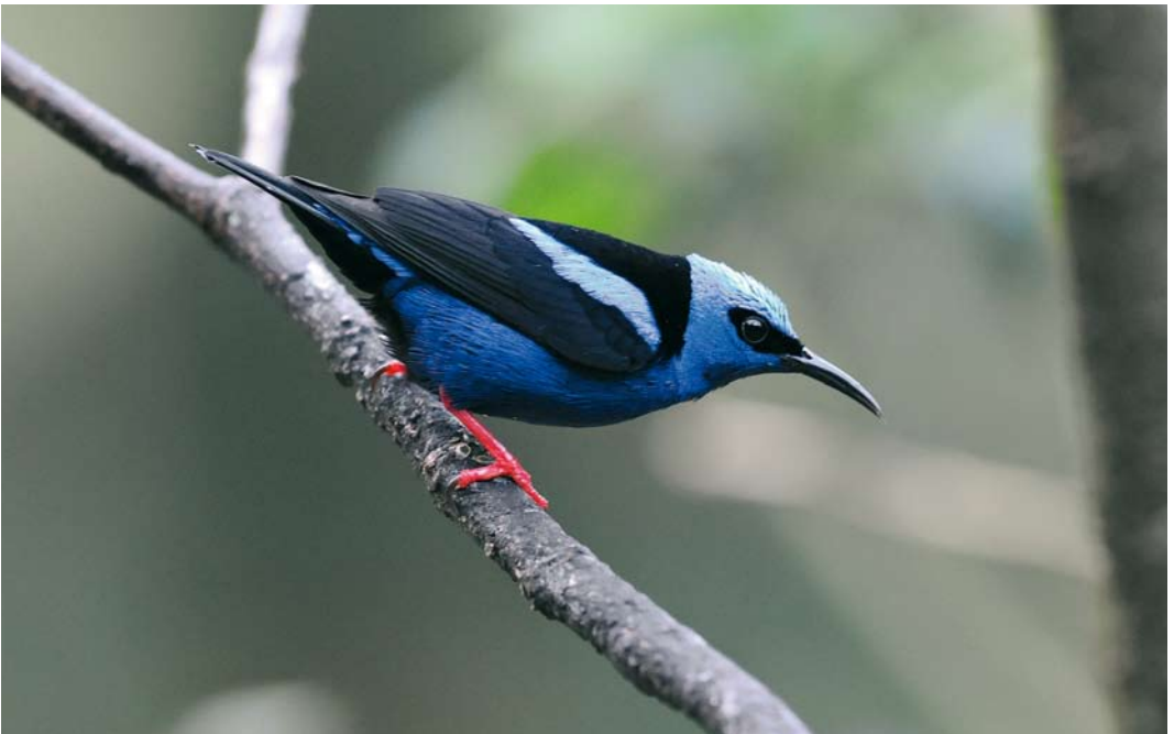
366 Red-legged Honeycreeper / Blauwe Suikervogel Cyanerpes cyaneus , male, Canopy Lodge, El Valle, Panama, 10 March 2009