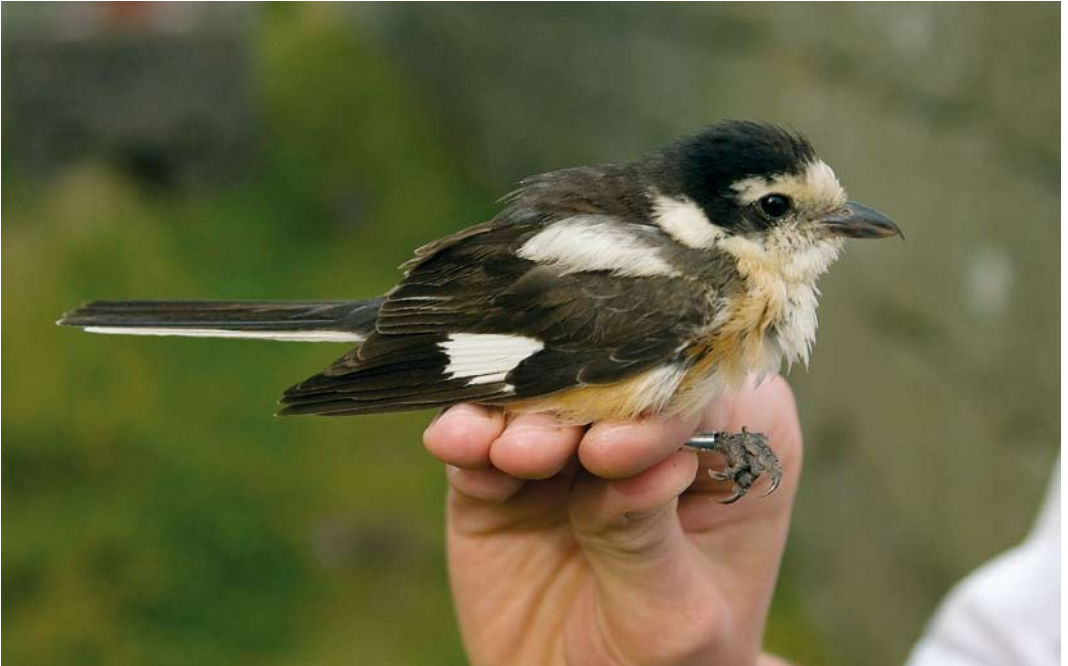
421 Masked Shrike / Maskerklauwier Lanius nubicus , adult female, Lista Fyr, Vest-Agder, Norway, 10 August 2009