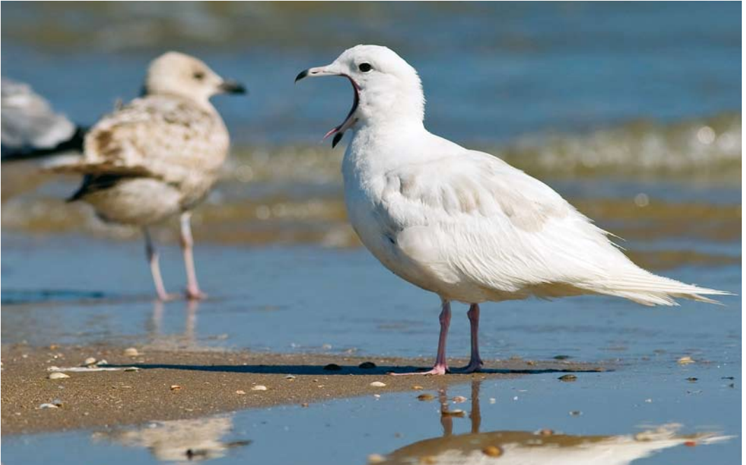
423 Kleine Burgemeester / Iceland Gull Larus glaucooides , eerste-zomer, Katwijk aan Zee, Zuid-Holland, 4 juli 2009