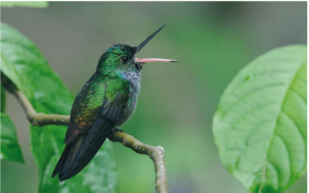
349 Blue-chested Hummingbird / Blauwborstamazilia Amazilia amabilis , Canopy Tower, Soberanía National Park, Panama, 11 June 2009 (Roef Mulder)