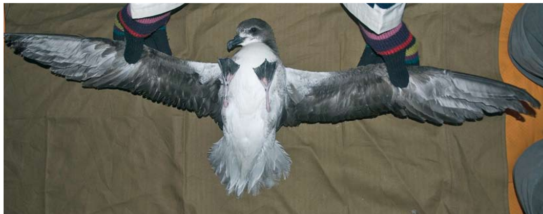
395 Fea's Petrel / Gon-gon Pterodroma feae , adult, Fogo, Cape Verde Islands, 21 March 2007. Normally coloured adult with spread wings.