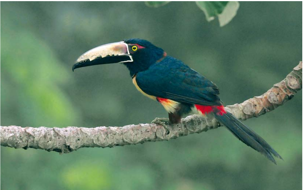
370 Collared Aracari / Halsbandarassari Pteroglossus torquatus , Canopy Tower, Soberanía National Park, Panama, 11 June 2009