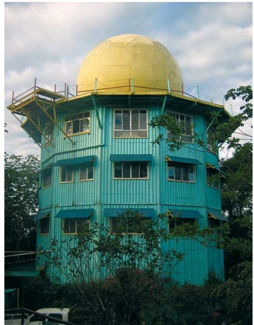
339 Canopy Tower, Soberanía National Park, Panama, 15 June 2009 ( Enno B Ebels )

found. Of all species on the Panamanian list, 95 are ‘restricted-range species’ (as defined by BirdLife International, ie, with a global historical range of less than 50 000 km 2 ). Five of the 221 Endemic Bird Areas (EBA) identified by BirdLife International throughout the world reach into Panama and cover c 70% of the total surface (Central American Caribbean slope, Costa Rica and Panama highlands, South Central American Pacific slope, Darién highlands and Darién lowlands; BirdLife International 2009). The first three EBAs are shared with Costa Rica, and the last two with Colombia. The number of species in central Panama (here defined as the area covered by the checklist of Carlos Bethancourt (2007)), is almost 600 and, during a trip of 10-15 days, 300-350 species can be seen in summer and 350-400 in winter, when the resident species are accompa-