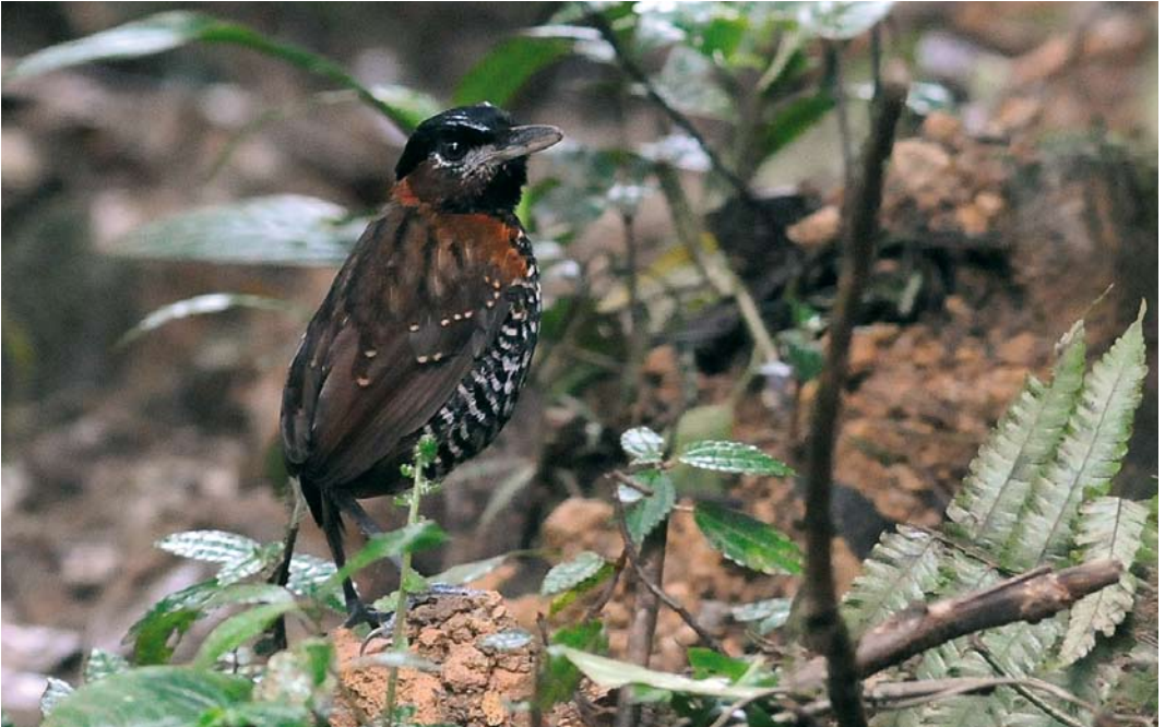
344 Black-crowned Antpitta / Zwartkruinmierpitta Pittasoma michleri , male, El Valle, Panama, 18 June 2009