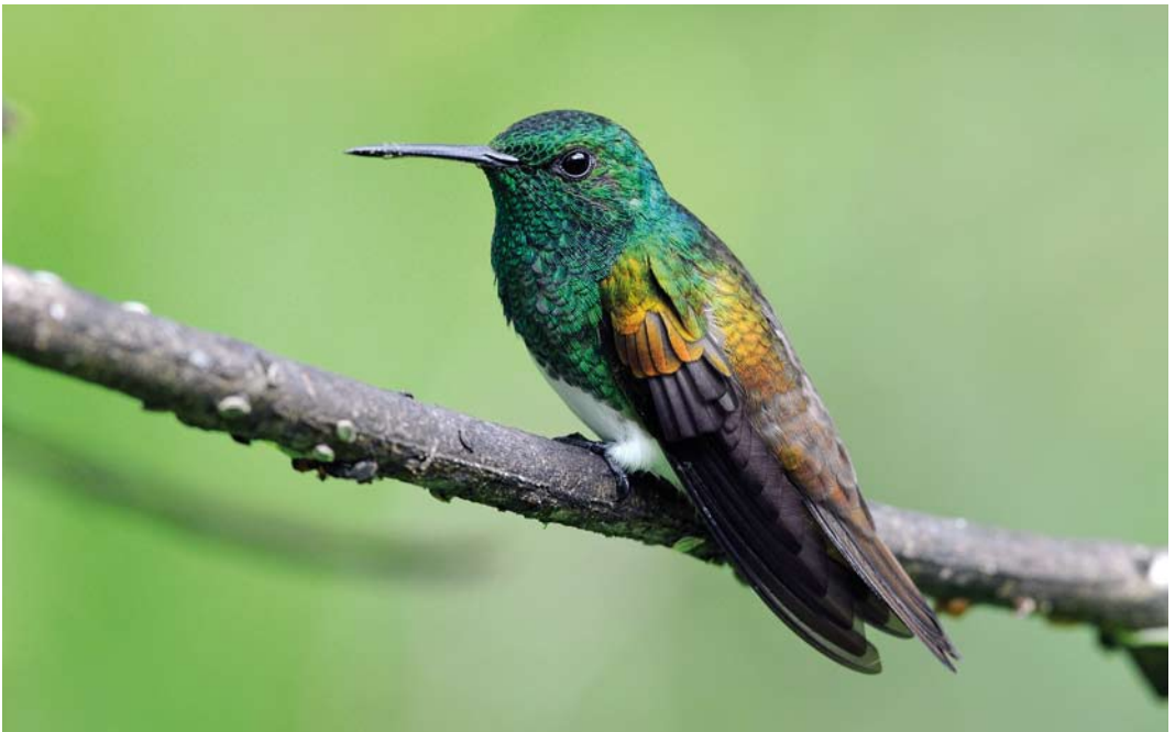
351 Snowy-bellied Hummingbird / Edwards Amazilia Amazilia edward , Canopy Lodge, El Valle, Panama, 17 June 2009 (Roef Mulder)