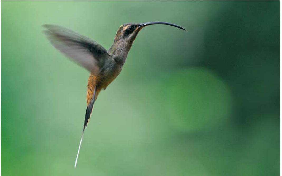
352 Long-billed Hermit / Grote Heremietkolibrie Phaethornis longirostris , Forest Discovery Center, Panama, 6 March 2009