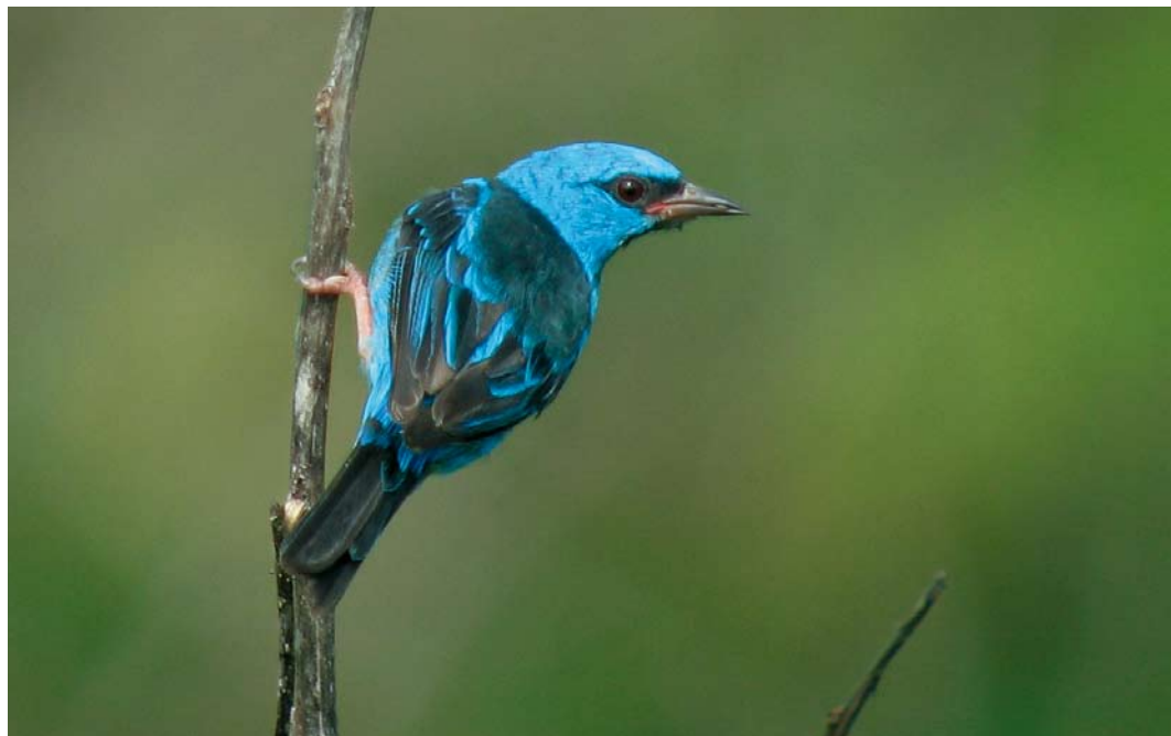
363 Blue Dacnis / Blauwe Pitpit Dacnis cayana , male, Forest Discovery Center, Panama, 13 June 2009