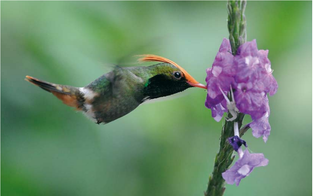
348 Rufous-crested Coquette / Vuurkuifkoketkolibrie Lophornis delattrei , male, El Valle, Panama, 9 March 2009 (Roef Mulder)