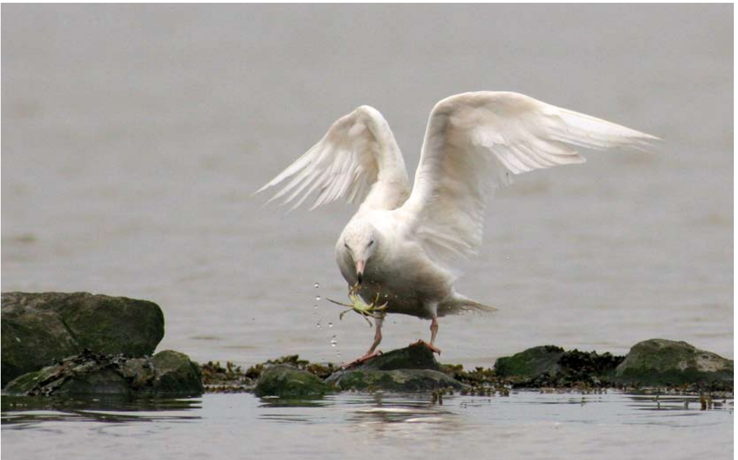
424 Grote Burgemeester / Glaucous Gull Larus hyperboreus , eerste-zomer, Termunterzijl, Groningen, 14 juli 2009