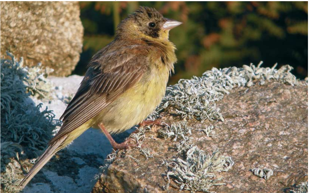
422 Black-headed Bunting / Zwartkopgors Emberiza melanocephala , male, Ouessant, Finistère, France, 21 September 2009 (Aurélien Audevard)