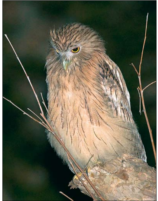
400 Trindade Petrel / Arminjons Stormvogel Pterodroma arminjoniana , dark morph, off Faial, Azores, 20 August 2009 401 Western Brown Fish Owl / Westelijke Bruine Visuil Ketupa zeylonensis semenowi , juvenile, southern Turkey, 5 August 2009 402 Short-toed Snake Eagle / Slangenarend Circaetus gallicus , Brecht, Antwerpen, Belgium, 24 July 2009