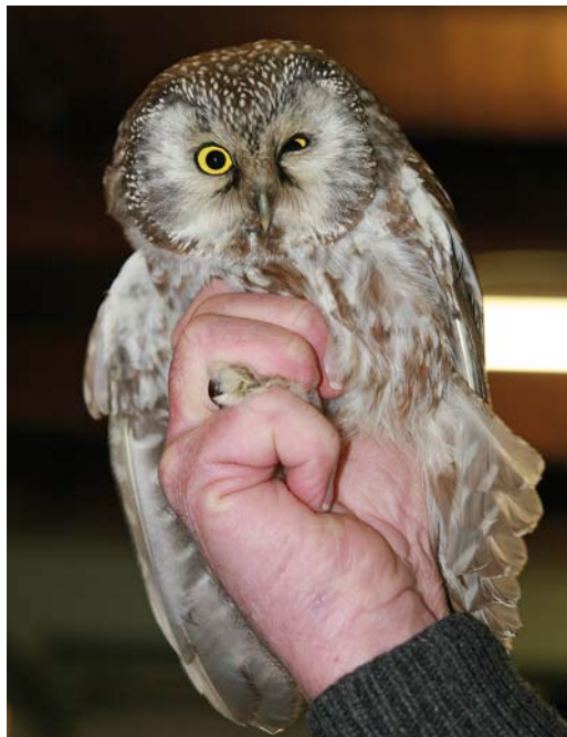
45 Koereiger / Cattle Egret Bubulcus ibis , Schiedam, Zuid-Holland, 22 december 2008 (Wilma van Holten) 46 Ruigpootuil / Boreal Owl Aegolius funereus (gevonden in Heino, Overijssel, op 16 december 2008), Beerzerveld, Overijssel, 17 december 2008 (David Uit de Weerd) 47 Kleine Burgemeester / Iceland Gull Larus glaucoides , eerstejaars, Den Helder, Noord-Holland, 27 december 2008 (René Pop)