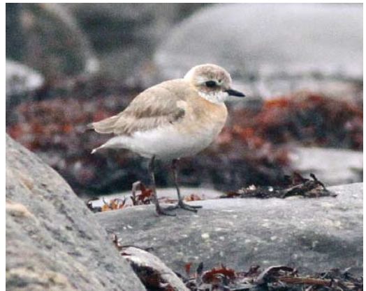
405 Eleonora's Falcon / Eleonora's Valk Falco eleonorae , Ribeira de Janela, Madeira, 14 August 2009 (Vincent van der Spek) 406 Steppe Eagle / Steppearend Aquila nipalensis , third calendar-year, Ifjordfjellet, Finnmark, Norway, 3 August 2009 (Jürgen Steudtner) 407-408 Saker Falcon / Sakervalk Falco cherrug , first-year female ('Piros'), Castilla y León, Spain, 24 August 2009 (Juan Sagardía) 409 Brown Booby / Bruine Gent Sula leucogaster , immature, off Desertas, Madeira, 1 September 2009 (Max Berlijn) 410 Lesser Sand Plover / Mongoolse Plevier Charadrius mongolus , female, Kristiinankaupunki, Finland, 27 July 2009 (Pasi Pirinen)