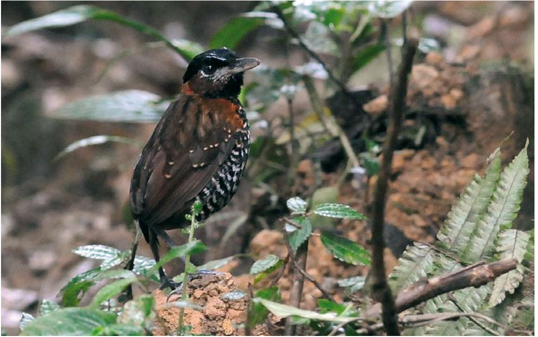
344 Black-crowned Antpitta / Zwartkruinmierpitta Pittasoma michleri , male, El Valle, Panama, 18 June 2009