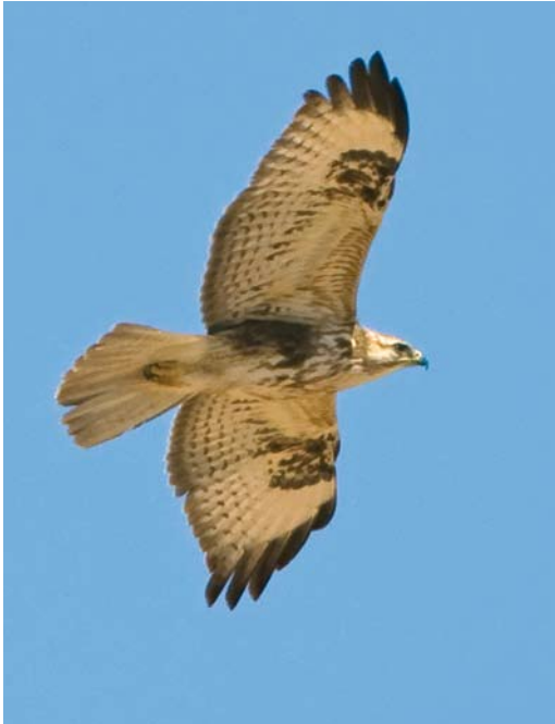
265 Atlas Long-legged Buzzard / Atlasarendbuizerd Buteo rufinus cirtensis , juvenile, between Goulimime and Atlantic coast, Morocco, 20 March 2008 (Pieter Verheij). Note strong similarities with Pantelleria hybrid but also more marked and obvious dark carpal patch, warmer tone of flank, paler and less barred tail, and less patterned underwing-coverts.

was paired and seen copulating regularly with a different second calendar-year cirtensis . Moreover, an adult male cirtensis paired with an adult female nominate buteo was seen copulating regularly and starting to breed. The increase of mixed pairs will probably lead to an increasing number