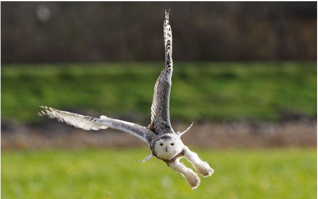
22 Sneeuwuil / Snowy Owl Bubo scandiacus , eerstejaars vrouwtje, Zeeburg, Texel, Noord-Holland, 17 november 2008 (Eric Menkveld)

Otus scops met voorkeur voor de laatste. Annelies raakte in een drukke mailwisseling met Bas van der Burg die aangaf dat het vast wel om een Vroedmeesterpad zou gaan. Ook dat was echter interessant voor de regio, dus na zwaar aandringen van Annelies ging Bas op zondag 25 mei eindelijk eens luisteren – en al vanuit de auto moest hij toegeven dat hij luisterde naar de achtste Dwergooruil ooit. Omdat de vogel zich op het terrein van een zorginstelling bevond werden met het bestuur spelregels afgesproken. Het was de eerste twitchbare sinds het geval in de Ooijpolder, Gelderland, in mei-juni 1998, en hij trok de volgende avond ruim 200 waarnemers. Tot en met 19 juni was hij te horen en soms in de schemering vliegend te zien en het bleef een publiekstrekker. Eveneens op 23 mei werd een Oeraluil Strix uralensis gefotografeerd bij Boxmeer, Noord-Brabant, die uiteindelijk belandde in een vogelopvang in St Anthonis. Hij droeg een ring die wijst op niet-wilde herkomst. Opmerkelijk is dat er in het voorjaar twee Velddrietzangers Acrocephalus agricola werden gevangen: op 30 mei bij Beetsterzwaag, Friesland, en op 2 juni in het Zwanenwater, Noord-Holland. Deze laatste was hier op 4 juni aan het zingen en werd nogmaals gevangen maar