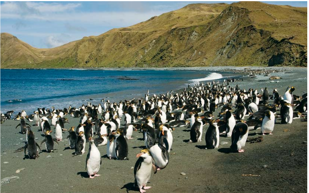
294 Royal Penguins / Schlegels Pinguins Eudyptes schlegeli , Sandy Bay, Macquarie Island, Australia, 15 November 2008