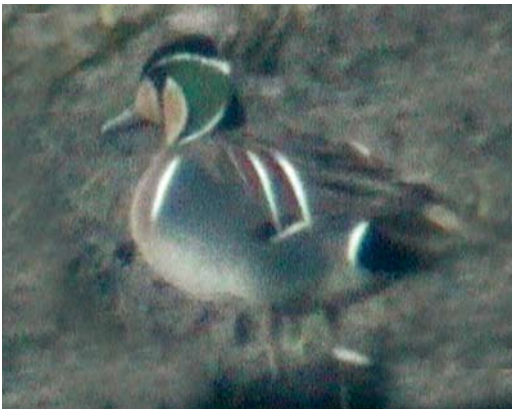
266 Siberische Taling / Baikal Teal Anas formosa , adult mannetje, Ouderkerk aan de Amstel, Noord-Holland, 18 mei 2006