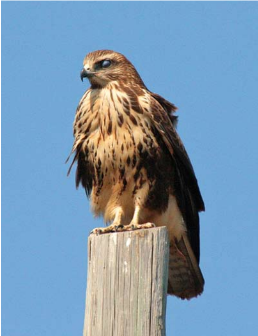
263 Hybrid Atlas Long-legged x Common Buzzard / hybride Atlasarendbuizerd x Buizerd Buteo rufinus cirtensis x buteo , recently fledged juvenile, Pantelleria, Italy, 5 September 2008. Note sparsely streaked breast and belly, dark contrasting flanks, quite long tarsus and long and heavy bill.