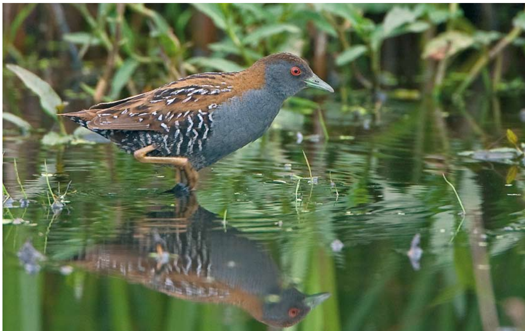
322 Kleinst Waterhoen / Baillon's Crake Porzana pusilla , mannetje, Zevenhoven, Zuid-Holland, 10 juni 2009