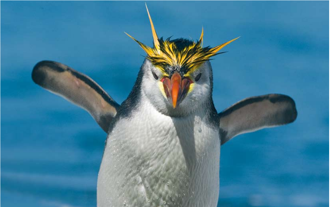
293 Royal Penguin / Schlegels Pinguin Eudyptes schlegeli , Sandy Bay, Macquarie Island, Australia, 15 November 2008