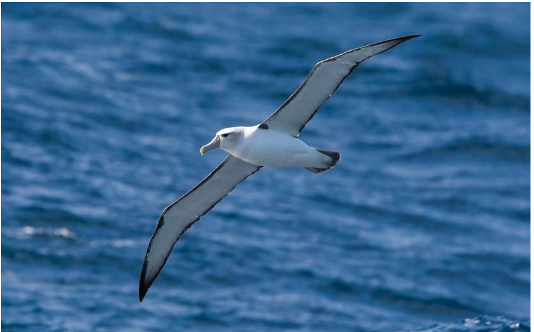
276 Shy Albatross / Witkapalbatros Thalassarche cauta , at sea off Snares islands, New Zealand, 11 November 2008