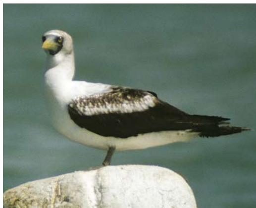
261-262 Masked Booby / Maskergent Sula dactylatra , subadult, near Jask, Hormozgan, Iran, 16 April 2007 (Raffael Ayé)

The status of Masked Booby in Iran has recently been reviewed by Scott (2008). While breeding along the Iranian Mekran coast has been reported in the past (Vaurie 1965, Hüe & Etchécopar 1970), there actually are no suitable islands for breeding. Consequently it is more likely to be a rare visitor here. The first confirmed record concerned a subadult near Chahbahar, Baluchistan, on 5 April 1972 (Scott 2008). The third record was a bird seen and photographed on 15 January 2009 at Khor e Silikie, west of Jask (Mark Zekhuis in litt). Between 8250 and 13 250 individuals breed on the Halaaniyaat islands, Oman (BirdLife Inter-