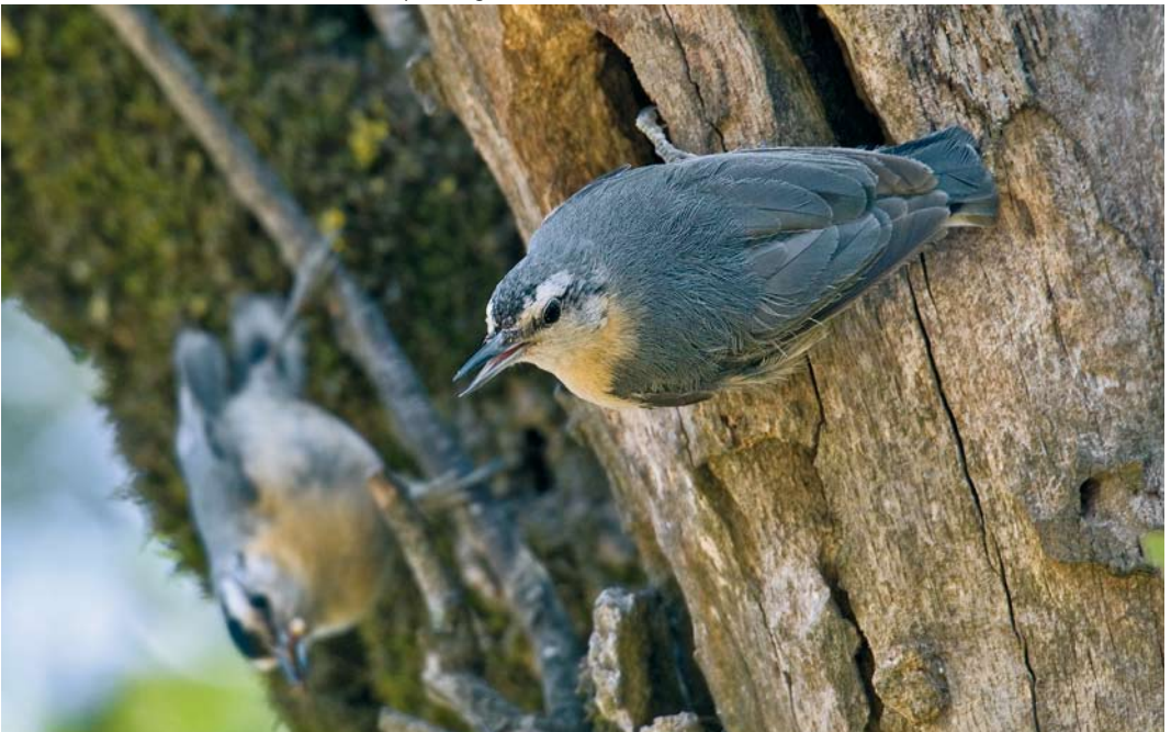
305 Algerian Nuthatches / Algerijnse Boomklevers Sitta ledanti , female (right) and male, Tamentout forest, Petit Kabylie, Algeria, 4 June 2009