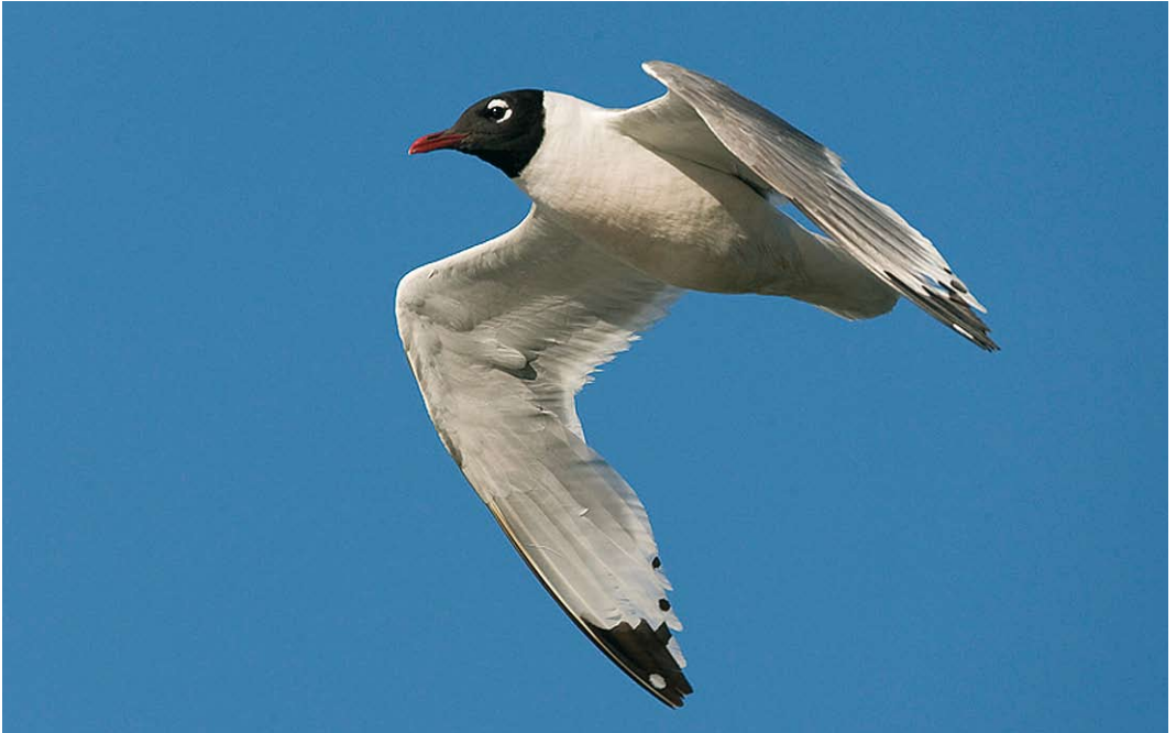
309 Franklin's Gull / Franklins Meeuw Larus pipixcan , Doornzele, Oost-Vlaanderen, Belgium, 12 July 2009