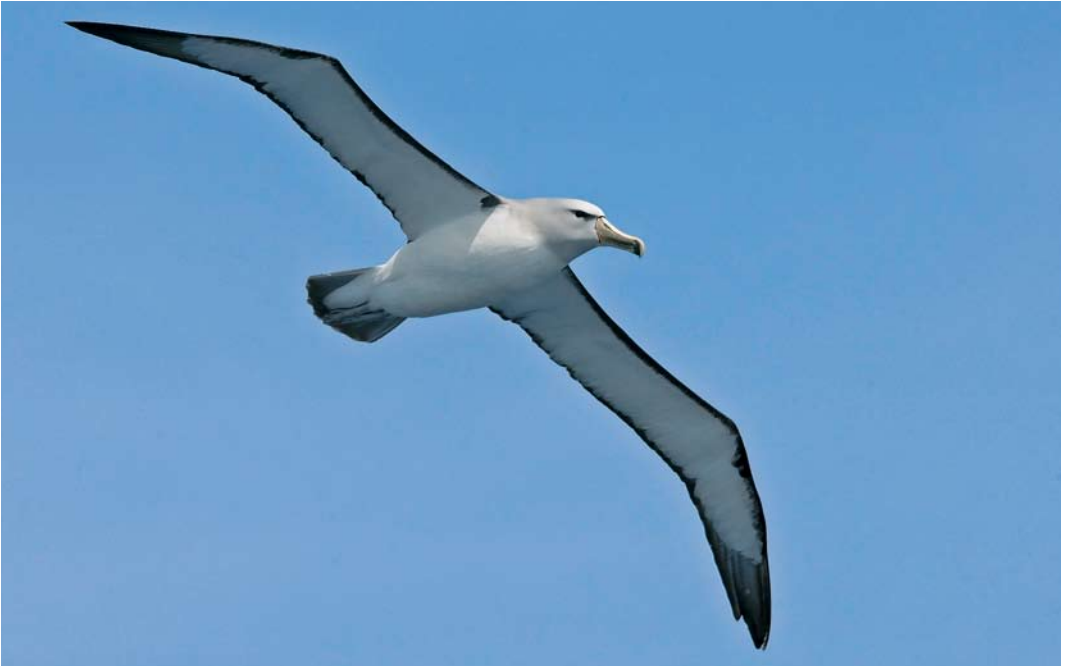
285 Salvin's Albatross / Salvins Albatros Diomedea salvini , Bounty Island, New Zealand, 21 November 2008 ( Otto Plantema )