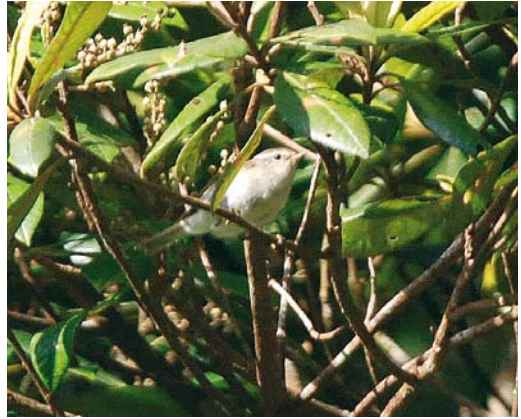
268 Yellow-browed Warbler / Bladkoning Phylloscopus inornatus , Mount Kinabalu, Borneo, Malaysia, 10 November 2008

Yellow-browed for Sabah, the second and third Yellow-browed for Borneo, and the first to be photographed and sound-recorded.