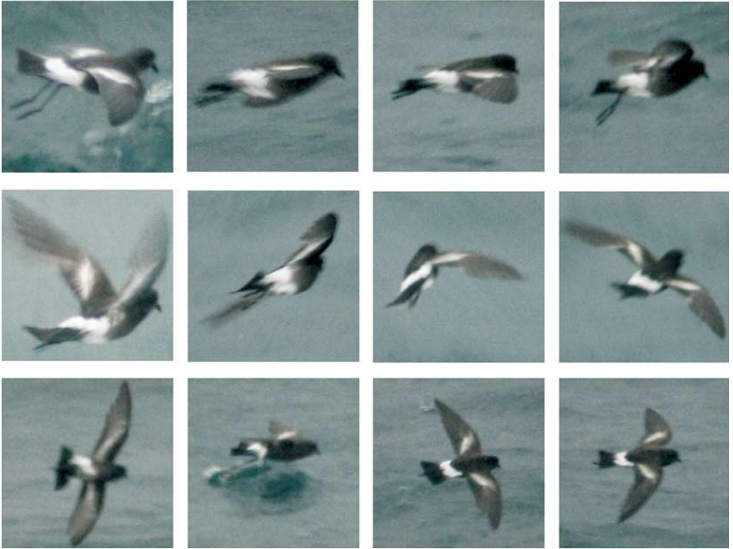
FIGURE 2 Unidentified storm petrels / ongedetermineerde stormvogeltjes Oceanites , Seno de Reloncaví, Puerto Montt, Chile, 4 February 2009 (Michael O'Keefe). Bird in upper row of images may be fresh juvenile while lower two rows appear to depict adults in moult. Note extensive white on vent and lower belly joining rump. There may be slight suggestion of dark feathering on vent. Upperwing and underwing bars both very prominent although these may appear slightly 'exaggerated' due to camera exposure. We advise some caution when analysing these slightly blurred, slightly overexposed images.

255-256 Unidentified storm petrel / ongedetermineerd stormvogeltje Oceanites , shortly off Puerto Montt, Chile, 4 February 2009 (Michael O'Keefe). Different individuals.