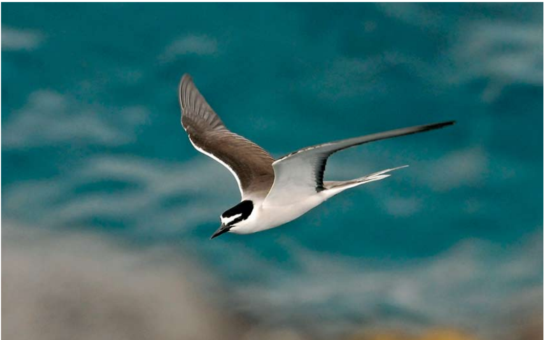
310 Bridled Tern / Brilstern Onychoprion anaethetus , Ponta do Ouriço, Pico, Azores, 16 June 2009 (João Quaresma)