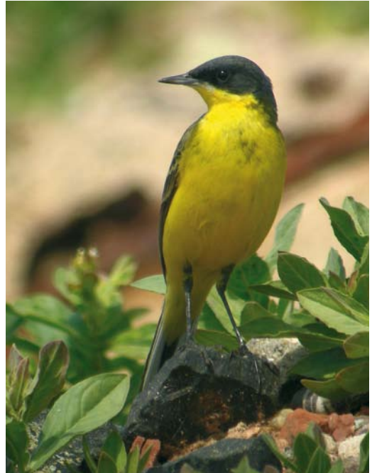
246 Noordse Kwikstaart / Grey-headed Wagtail Motacilla thunbergi , mannetje / male, Helgoland, Duitsland, 30 mei 2008. Typisch exemplaar zonder sporen van witte wenkbrauwstreep en met donkere vlekken op borst / Typical male, without trace of white supercilium and with obvious breast markings.

KOP & HALS Voorhoofd, kruin, achterhoofd en achterhals grijs, donkerder dan bij mannetje Gele Kwikstaart en blauwe tint minder opvallend. Middenkruinveren met groenachtige top. Zijkruin grijsgroen zoals bovendelen. Zijkruin boven oog donkergrijs tot zwart, net als teugel en voorste deel van oorstreek. Achterste deel van oorstreek iets lichter grijs. Smalle witachtige wenkbrauwstreep uitsluitend achter oog. Lichtgrijs vlekje boven teugel (op rechterkant van kop nagenoeg afwezig); na enkele weken nagenoeg verdwenen door sleet. Oogring grijs en onopvallend, midden onder oog iets lichter. Kin wit. Keel heldergeel.