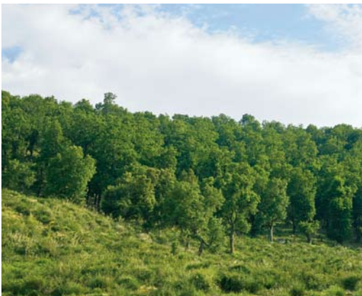
298 Algerian Nuthatch habitat (deciduous oaks such as Quercus afares and Q canariensis ), Tamentout Forest, Petit Kabylie, Algeria, 3 June 2009 (David Monticelli)