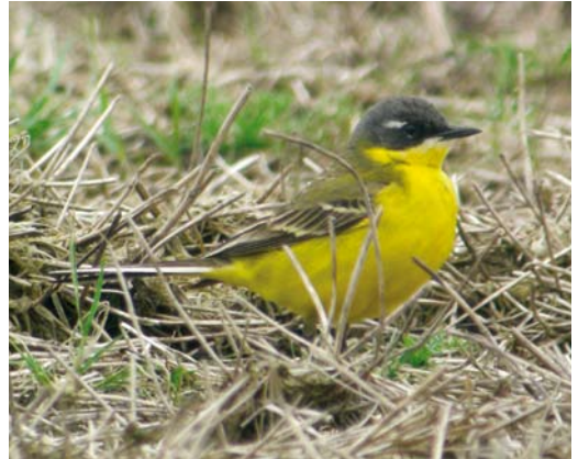
247 Nestlocatie / breeding site, Spaarndam, Noord-Holland, 11 mei 2008 (Roy Slaterus) 248 Noordse Kwikstaart / Grey-headed Wagtail Motacilla thunbergi of hybride / or hybrid, mannetje / male, Spaarndam, Noord-Holland, 4 mei 2008 (Roy Slaterus) 249 Noordse Kwikstaart / Grey-headed Wagtail Motacilla thunbergi of hybride / or hybrid, mannetje / male, Spaarndam, Noord-Holland, 4 juni 2008 (Roy Slaterus) 250 Noordse Kwikstaart / Grey-headed Wagtail Motacilla thunbergi of hybride / or hybrid, mannetje / male, Spaarndam, Noord-Holland, 17 mei 2008 (Roy Slaterus)

perkt was. Bij vrouwtje Noordse Kwikstaart is de wenkbrauwstreep doorgaans smaller en korter en zijn de oorstreek, kruin en bovendelen donkerder en kouder grijs van kleur. Daarnaast valt de donkere teugelstreep meestal meer op en is de middenborst, net als bij mannetjes, gevlekt. De determinatie van vrouwtjes 'gele kwikstaarten' is echter dermate complex dat zekerheid omtrent de identiteit van het vrouwtje moeilijk te verkrijgen is.