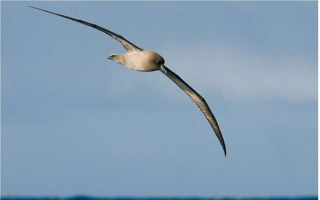
273 Light-mantled Albatross / Roetkopalbatros Phoebastria palpebrata , at sea off Campbell Island, New Zealand, 19 November 2008 (Otto Plantema)