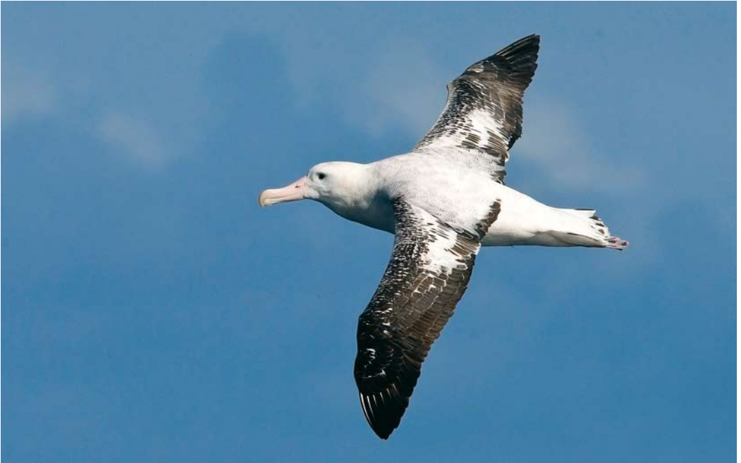
279 Gibson's Albatross / Gibsons Albatros Diomedea gibsoni , at sea off Antipodes Islands, New Zealand, 20 November 2008 ( Otto Plantema ) 280-281 Antipodean/Gibson's Albatross / Antipodenalbatros/Gibsons Albatros Diomedea antipodensis/gibsoni , at sea off Antipodes Islands, New Zealand, 20 November 2008 ( Otto Plantema )