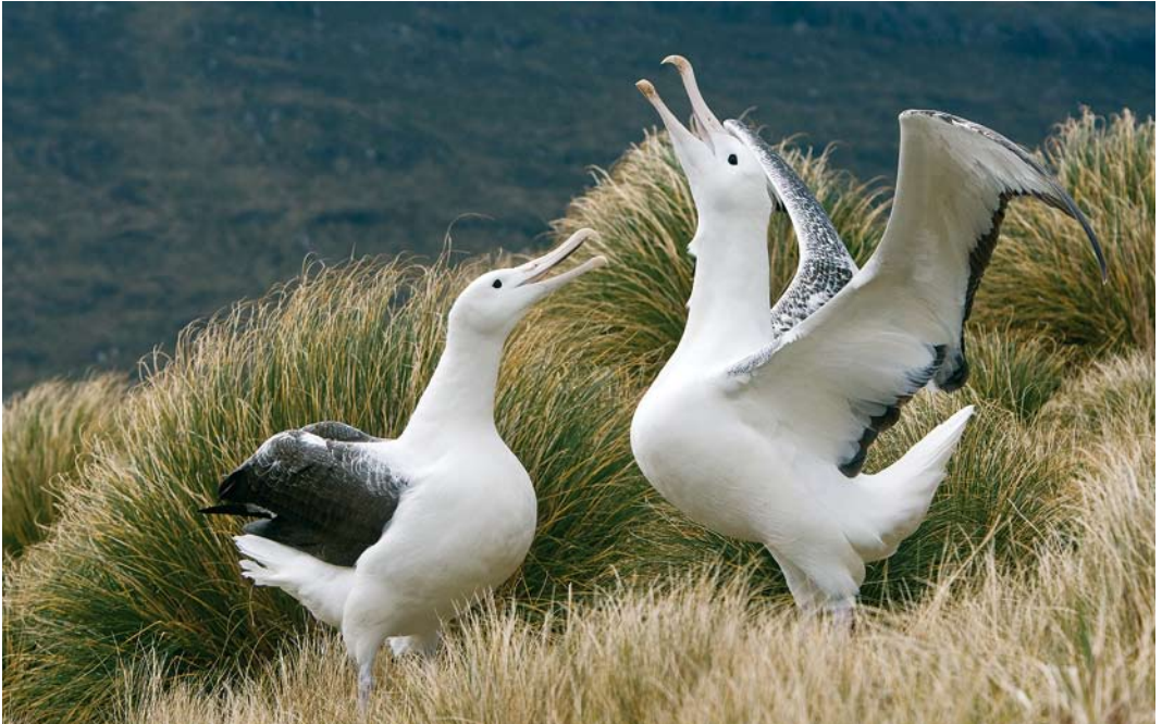
271 Southern Royal Albatrosses / Zuidelijke Koningsalbatrossen Diomedea epomophora , Campbell Island, New Zealand, 18 November 2008