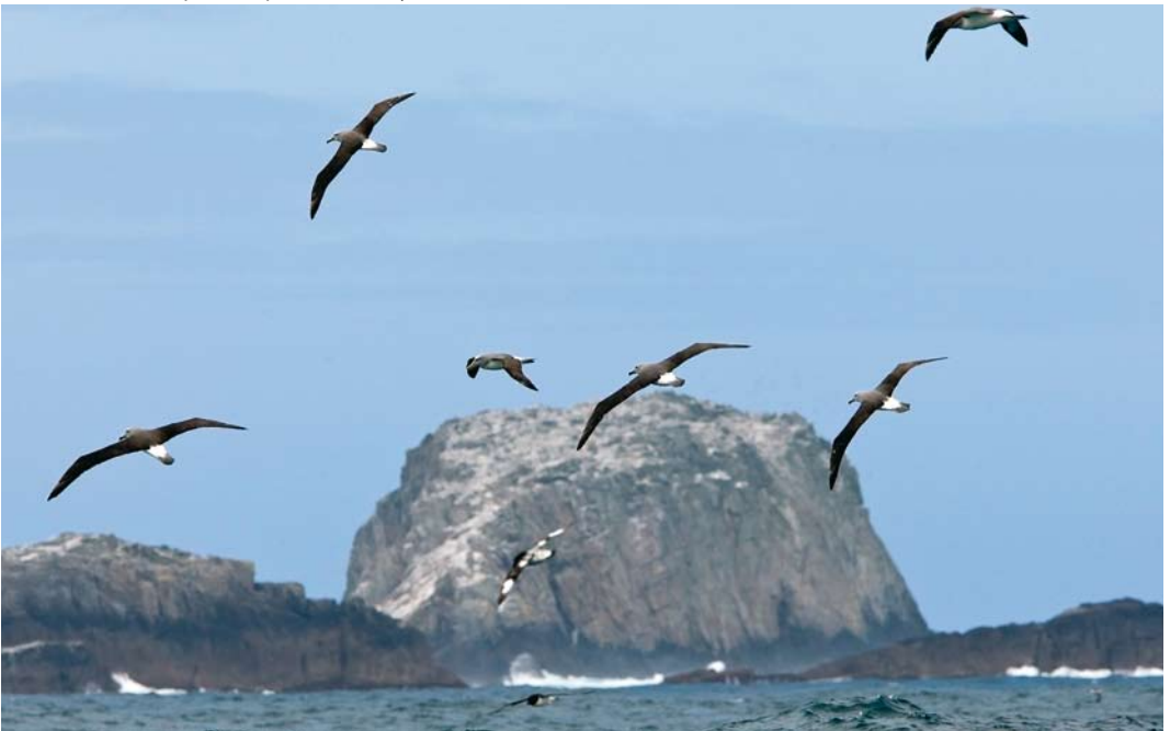
286 Salvin's Albatrosses / Salvins Albatrossen Diomedea salvini , with Cape Petrels / Kaapse Stormvogels Daption capense , Bounty Island, New Zealand, 21 November 2008