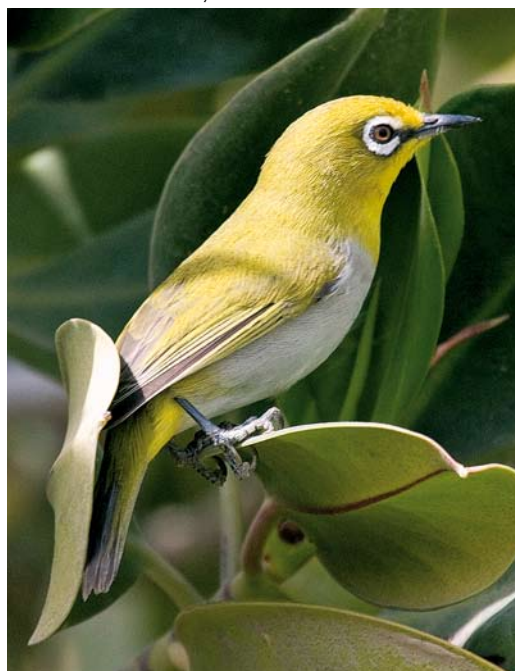
269 Oriental White-eye / Indische Brilvogel Zosterops palpebrosus , Koor-e Azini, Hormozgan, Iran, 3 March 2009 (Maysam Ghasemi)