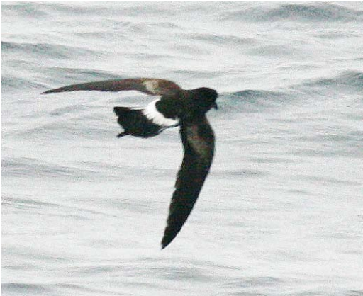
257-260 'Fuegian' Wilson's Storm Petrel / Wilsons Stormvogeltje Oceanites oceanicus chilensis , off Valparaiso, Chile, 31 January 2009

was inadvertently first published as a 'nomen nudum' by Alexander (1928). The taxon was later described in detail by Murphy (1936) and referred to as 'Fuegian Petrel', a new subspecies of Wilson's Storm Petrel. Subsequent to that, for reasons we have yet to establish, the taxon was dropped as a subspecies of Wilson's. Until very recently, only two subspecies of Wilson's, O o oceanicus and O o exasperatus , were recognized in the literature (cf Harrison 1983 (and subsequent editions), del Hoyo et al 1992, Dickinson 2003), although Harrison also mentions O o maorianus (see below) as a subspecies of Wilson's. Interestingly, in his account of Wilson's Storm Petrel, Harrison (1983) notes that 'Cape Horn birds may have pale vents (Ron Naveen pers comm)'. It would appear Ron Naveen was most likely referring here once again to chilensis , which shows some pale mottling on the lower belly. Onley &