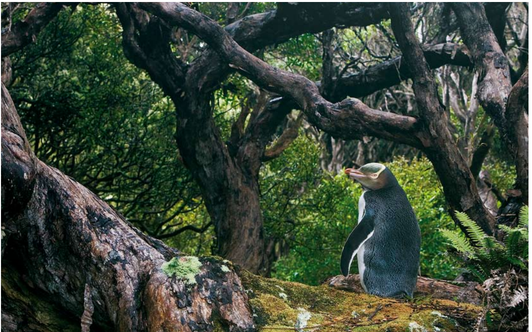
296 Yellow-eyed Penguin / Geelooopinguïen Megadyptes antipodes , Enderby Island, Auckland Islands, New Zealand, 12 November 2008