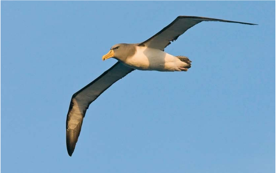
287-288 Chatham Albatross / Chathamalbatros Thalassarche eremita , Chatham Islands, New Zealand, 22 November 2008 ( Otto Plantema ) 289 Salvin's Albatross / Salvins Albatros Diomedea salvini , Bounty Island, New Zealand, 21 November 2008 ( Otto Plantema )