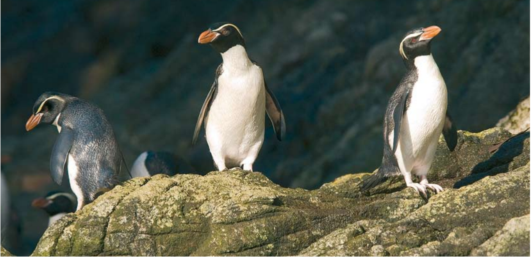
297 Snares Crested Penguins / Snareskuifpinguïns Eudyptes robustus , Snares Islands, New Zealand, 11 November 2008

only one good sighting of a bird near its burrow in thick shrubbery. This species also breeds in small numbers on New Zealand Southern Island. The current status is 'Endangered' with an estimated population of 2000 pairs (Shirihai & Jarrett 2007), making it one of the world's rarest penguin species. The main threats include habitat degradation and introduced predators. It may be the most ancient of all living penguins; molecular research (Baker 2006) has shown that it is closely related to the 'crested penguins' Eudyptes . Birds leave the colony at dawn and return the same evening during chick rearing, although they may spend two to three days at sea at other times. Blue Penguins Eudyptula minor , another shy endemic, were only seen in small numbers on open sea near Chatham Island.