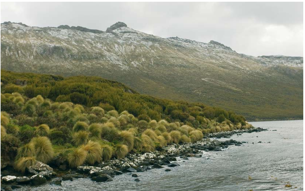
272 Tussock on Campbell Island, New Zealand, 18 November 2008 (Otto Plantema)