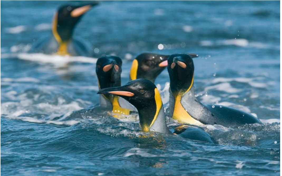
295 King Penguins / Koningspinguïns Aptenodytes patagonicus , Macquarie Island, Australia, 15 November 2008