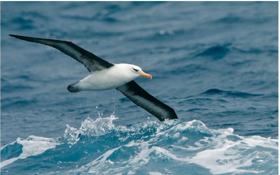
274 Campbell Albatross / Campbellalbatros Thalassarche impavida , at sea off Campbell Island, New Zealand, 19 November 2008 (Otto Plantema)