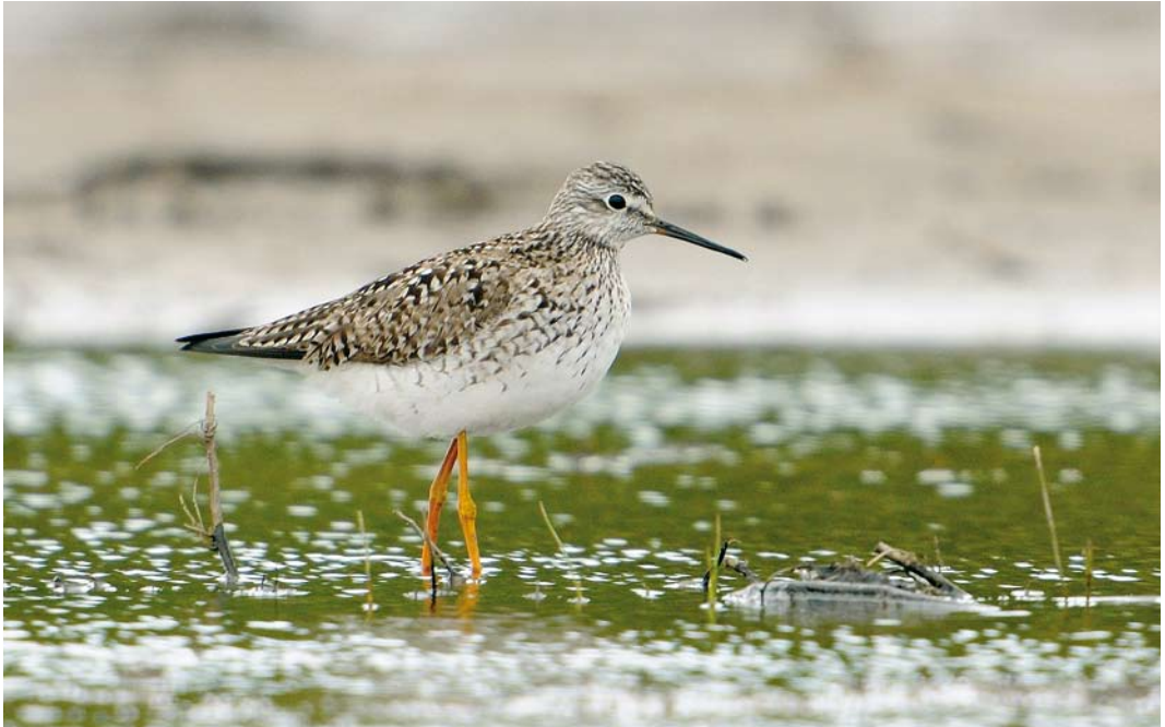
326 Kleine Geelpootruiter / Lesser Yellowlegs Tringa flavipes , De Nederlanden, Texel, Noord-Holland, 1 mei 2009 (Dirk-Jan van Unen)