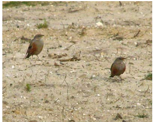
328 Ralreiger / Squacco Heron Ardeola ralloides , Willeskop, Utrecht, 19 juni 2009 329 Roodkopklauwier / Woodchat Shrike Lanius senator , Texel, Noord-Holland, 15 juni 2009 330 Bosgors / Rustic Bunting Emberiza rustica , adult vrouwtje, Zwanenwater, Noord-Holland, 6 juni 2009 331 Veldrietzanger / Paddyfield Warbler Acrocephalus agricola , Den Oever, Noord-Holland, 14 juni 2009 332 Krekelzanger / River Warbler Locustella fluviatilis , Sneekermeer, Friesland, 9 juni 2009 333 Alpenheggenmussen / Alpine Accentors Prunella collaris , Molenheide, Mill, Noord-Brabant, 7 mei 2009