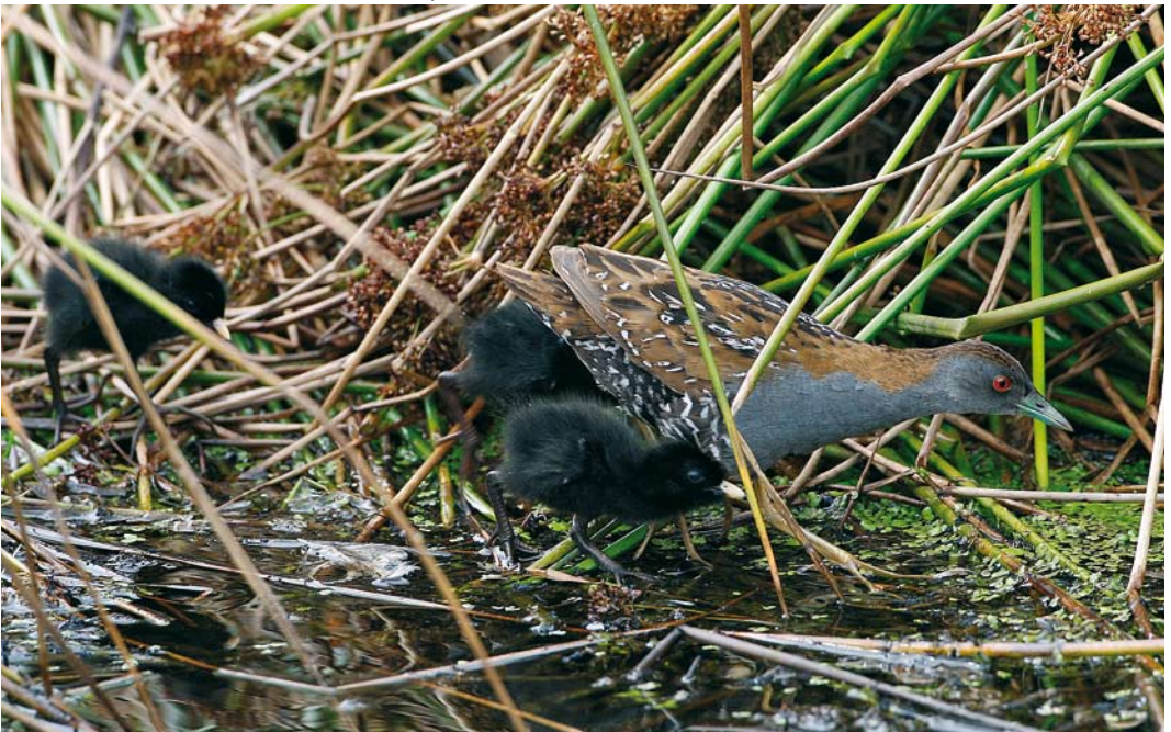
325 Kleinste Waterhoenders / Baillon's Crakes Porzana pusilla , mannetje en pulli, Zevenhoven, Zuid-Holland, 18 juli 2009 (Martin van der Schalk)