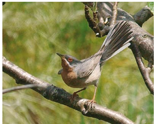
311-312 Presumed African Royal Tern / vermoedelijke Afrikaanse Koningsstern Sterna maxima albididorsalis , Clonakilty, Cork, Ireland, 7 June 2009 ( Michael O'Keefe ) 313 Allen's Gallinule / Afrikaans Purperhoen Porphyrio alleni , Lampedusa, Italy, 13 April 2009 ( Michele Viganò ) cf Dutch Birding 31: 191, 2009 314 African Openbill / Afrikaanse Gaper Anastomus lamelligerus , Luxor, Egypt, 26 May 2009 ( Benjamin Steffen ) 315 Iraq Babbler / Iraakse Babbelaar Turdoides altirostris , adult, Birecik, Şanlıurfa, Turkey, 6 June 2009 ( Arnoud B van den Berg/The Sound Approach ) 316 Subalpine Warbler / Baardgrasmus Sylvia cantillans , male, Trongisvágur, Suðuroy, Faeroes, 22 May 2009 ( Silas K K Olofson )