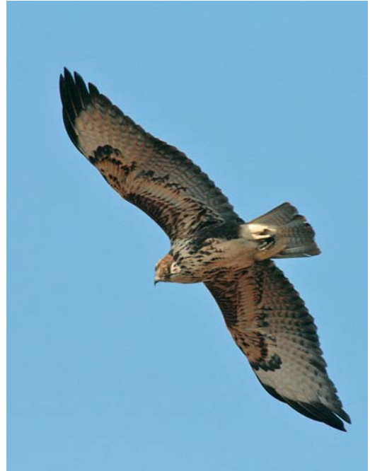
264 Hybrid Atlas Long-legged x Common Buzzard / hybride Atlasarendbuizerd x Buizerd Buteo rufinus cirtensis x buteo , recently fledged juvenile, Pantelleria, Italy, 5 September 2008. Note long wings, well contrasting flanks and less well-marked carpal patch than in typical Long-legged Buzzard.

nominate buteo of Sicilian population. Underwing close to nominate buteo though possibly cleaner and with more contrasting median coverts; lesser and marginal coverts visibly darker and more solidly patterned than in cirtensis . Carpal patch not solid, not striking and quite pale, therefore different from nominate rufinus but similar to many juvenile cirtensis (Corso in prep) but less patterned and less conspicuous.