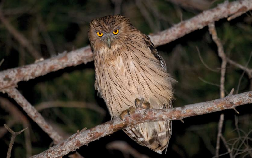
336 Western Brown Fish Owl / Westelijke Bruine Visuil Ketupa zeylonensis semenowi , adult, southern Turkey, 13 July 2009 (Arnoud B van den Berg/ The Sound Approach ) 337 Western Brown Fish Owl / Westelijke Bruine Visuil Ketupa zeylonensis semenowi , adult, southern Turkey, 5 July 2009 (Soner Bekir) 338 Western Brown Fish Owl / Westelijke Bruine Visuil Ketupa zeylonensis semenowi , fledgling, southern Turkey, 15 July 2009 (Arnoud B van den Berg/ The Sound Approach )