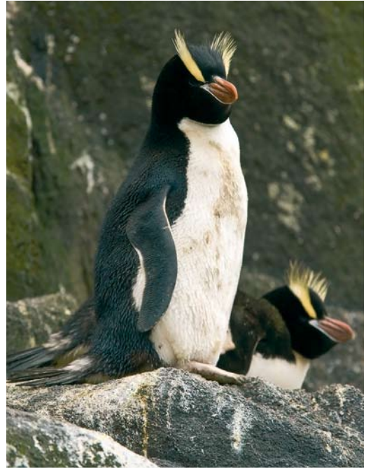
290 Gentoo Penguins / Ezelspinguïns Pygoscelis papua , Macquarie Island, Australia, 15 November 2008 ( Otto Plantema ) 291-292 Erect-crested Penguins / Grote Kuifpinguïns Eudyptes sclateri , Bounty Islands, New Zealand, 21 November 2008 ( Otto Plantema )