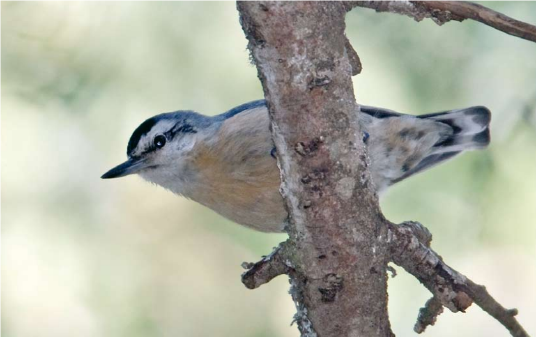
304 Algerian Nuthatch / Algerijnse Boomklever Sitta ledanti , male, Djebel Babor, Petit Kabylie, Algeria, 2 June 2009. Note orange-buff vent and undertail-coverts with diffuse blackish spots.