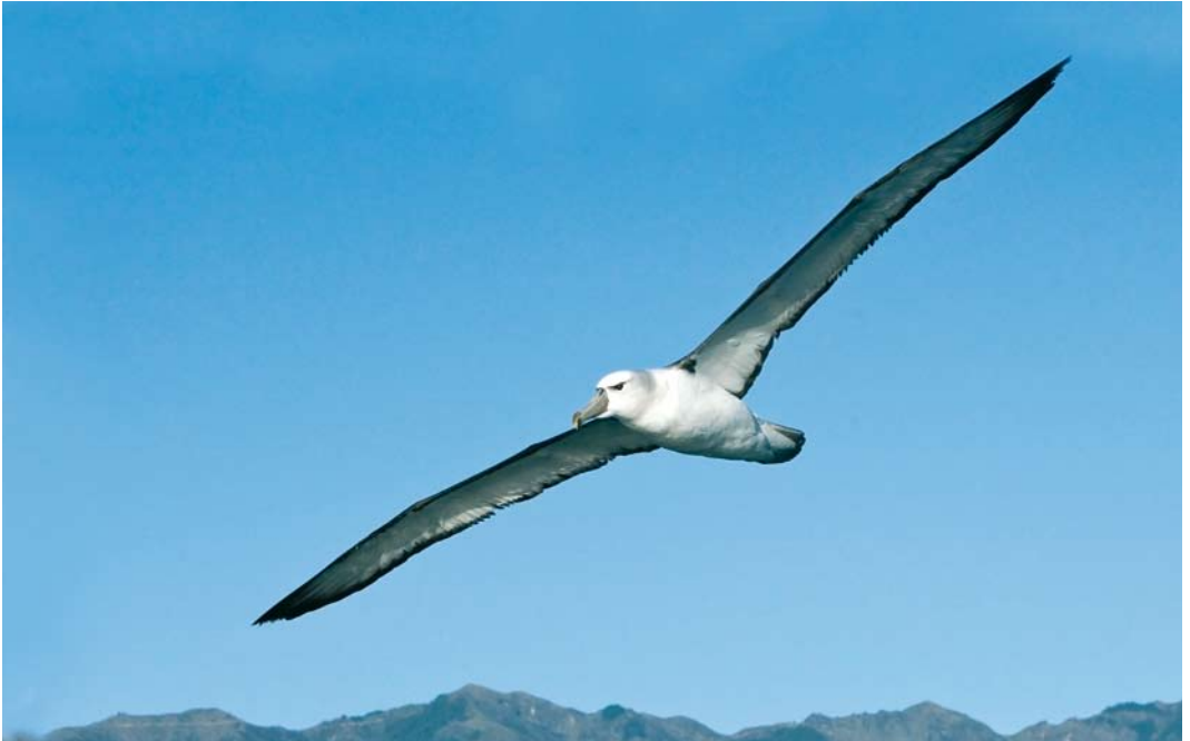
275 Shy Albatross / Witkapalbatros Thalassarche cauta , at sea off Southern Island, New Zealand, 28 November 2008