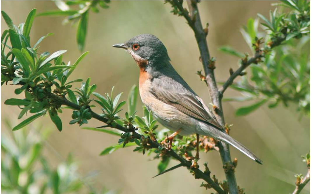
317 Subalpine Warbler / Baardgrasmus Sylvia cantillans , male, Zeebrugge, West-Vlaanderen, Belgium, 9 May 2009 (Johan Buckens)