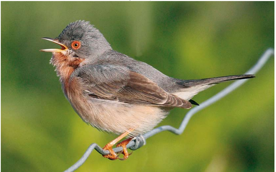
318 Moltoni's Warbler / Moltoni's Baardgrasmus Sylvia subalpina , male, Unst, Shetland, Scotland, 10 June 2009 (Hugh Harrop)