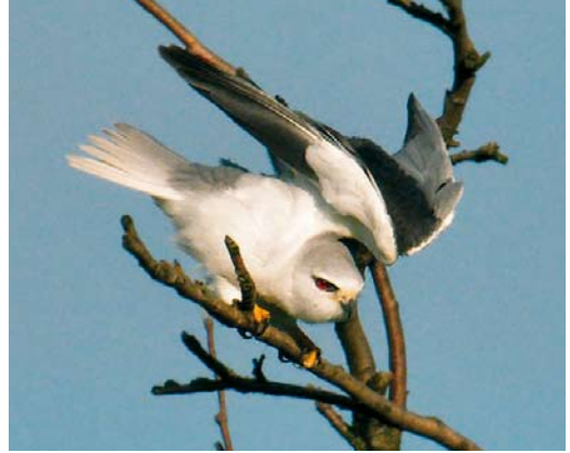
334-335 Grijze Wouw / Black-winged Kite Elanus caeruleus , Bleskensgraaf, Zuid-Holland, 22 mei 2009 (Hans Gebuis)

the Netherlands. When found it was hunting but soon it perched in a bare tree. It was seen by almost 30 birders. Eventually, it was disturbed by a Carrion Crow Corvus corone and it flew away in a south-westerly direction. There are three previous records for the Netherlands: on 31 May 1971, on 29-31 March 1998 and from 4 June to 23 August 2000.