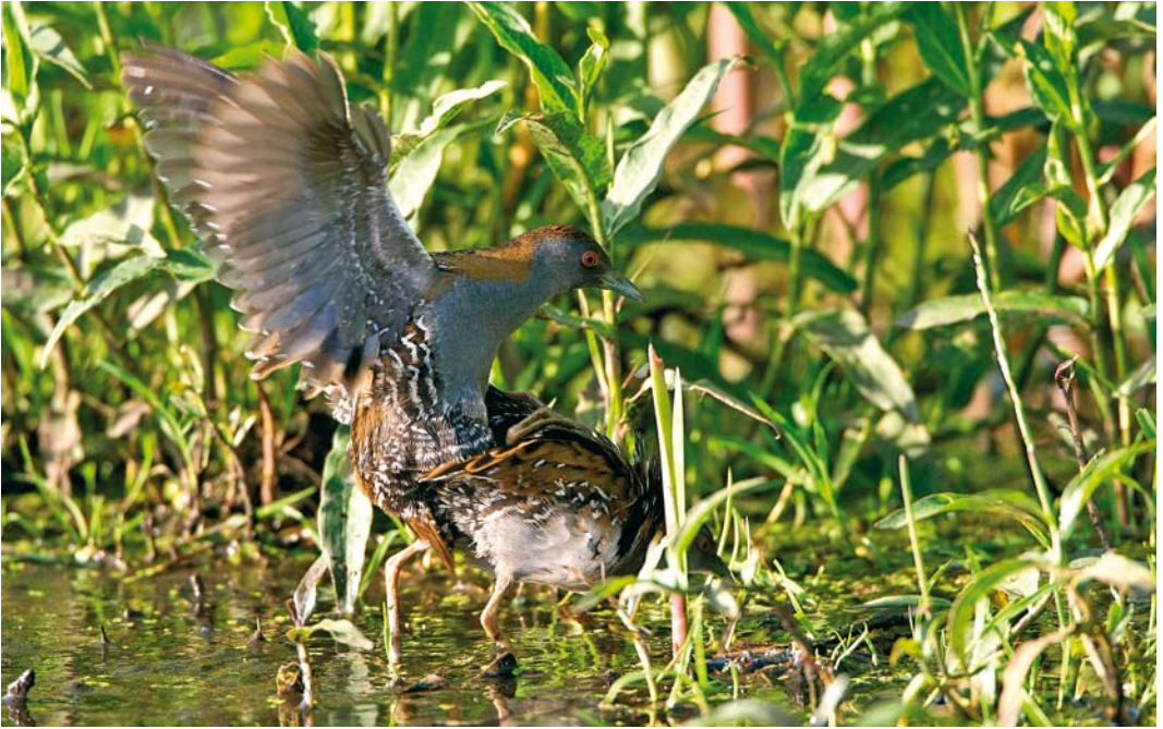
324 Kleinste Waterhoenders / Baillon's Crakes Porzana pusilla , mannetje en vrouwtje, Zevenhoven, Zuid-Holland, 15 juni 2009