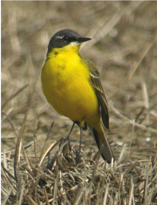
245 Noordse Kwikstaart / Grey-headed Wagtail Motacilla thunbergi of hybride / or hybrid, mannetje / male, Spaarndam, Noord-Holland, 3 mei 2008. Relatief brede wenkbrauwstreep (voor Noordse), gedeeltelijk witachtige oogring en beperkte mate van borsttekening duiden mogelijk op hybride / Rather broad supercilium (for Grey-headed), pale lower part of eye-ring and relatively few dark spots on breast may indicate hybrid origin.