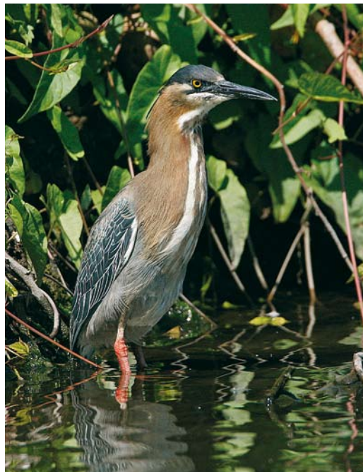
319 Ralreiger / Squacco Heron Ardeola ralloides , Bergen op Zoom, Noord-Brabant, 29 mei 2009 (Pim A Wolf) 320 Groene Reiger / Green Heron Butorides virescens , adult, Zaandam, Noord-Holland, 4 juli 2009 (Martin van der Schalk) 321 Dougalls Stern / Roseate Tern Sterna dougallii , adult, Stellendam, Zuid-Holland, 7 mei 2009 (Pim A Wolf)