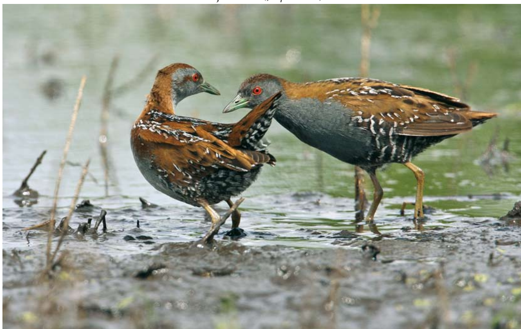
323 Kleinste Waterhoenders / Baillon's Crakes Porzana pusilla , mannetje en vrouwtje, Zevenhoven, Zuid-Holland, 20 juni 2009