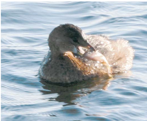
68-69 Dikbekfuut / Pied-billed Grebe Podilymbus podiceps , Kluizen, Oost-Vlaanderen, 6 januari 2009 (Johan Buckens)

Reeds eerder, op 20 oktober 2008, had ik een flitsontmoeting met vermoedelijk dezelfde vogel op precies dezelfde plaats. Tijdens een telling zag ik toen op een veel te grote afstand en in tegenlicht exact hetzelfde silhouet en gedrag. Samen met mijn vriendin Petra Beernaert hebben we nog zeker twee uur vruchteloos gezocht naar de verdachte 'dikke Dodaars'. De naam Dikbekfuut viel toen al maar het was Petra die maande tot voorzichtigheid. Verschillende bezoeken daarna leverden niets meer op en de 'zaak Dikbekfuut' werd gesloten – tot vandaag! Beseffend dat dit de eerste waarneming was voor België en een volkstoeloop kon en zou teweegbrengen belde ik dezelfde avond nog met Danny Camerlinck (die de waargenomen kenmerken kon verifiëren aan de hand van veldgidsen), Pieter d'Haluin, Peter Adriaens en Hilbran Verstraete voor overleg. Dinsdagmorgen 6 januari konden bovengenoemde personen samen met Johan Buckens en Kenny Hessel de waarneming bevestigen. Nog voordat we definitieve toelatingen konden regelen om het terrein te betreden ging dit nieuws als een lopend vuurtje rond en waren nieuwsgierigen niet meer tegen te houden. Bijna kwam mijn vergunning in het geding omdat vele enthousiastelingen over hekken en draad het terrein binnenslopen. Dankzij overleg, lobbywerk en bemiddeling via Peter Adriaens en Lieven De Schampelaere (Natuurpunt) met de algemene directeur Alfred Bauwens van de Vlaamse Maatschappij voor Watervoorziening (eigenaar