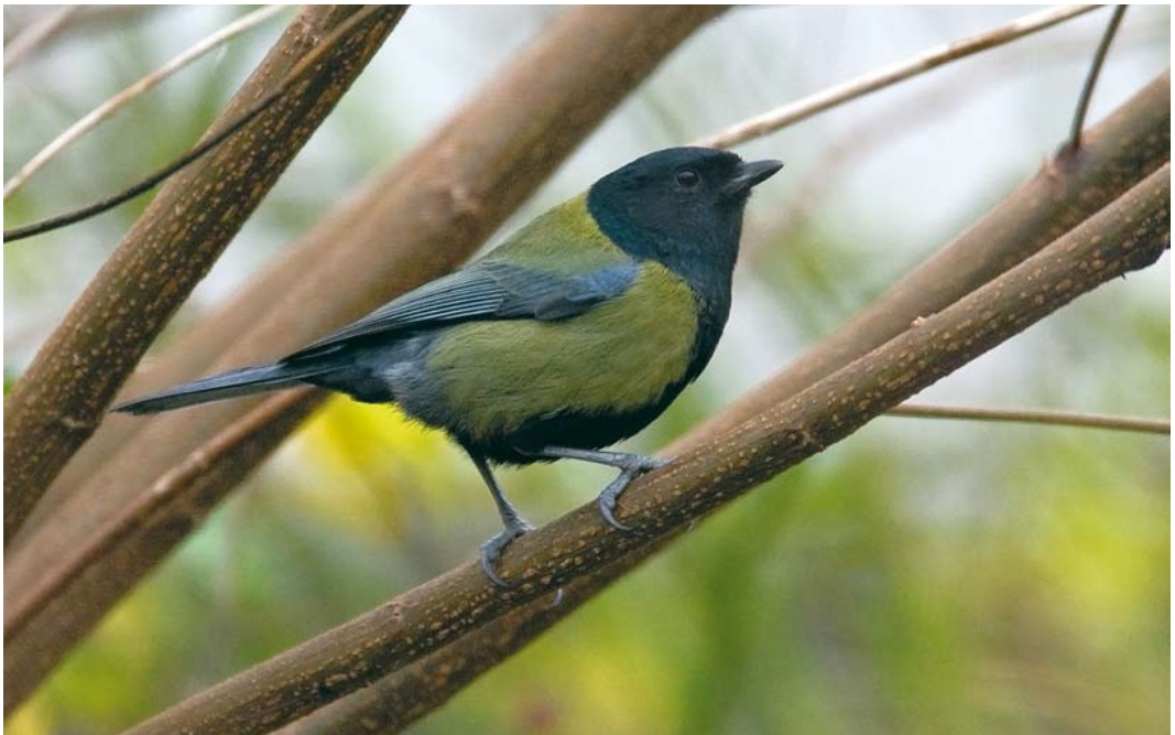
18 Koolmees / Great Tit Parus major , Krimpen aan den IJssel, Zuid-Holland, 29 november 2008

Naar aanleiding van de waarneming in Krimpen aan den IJssel meldde Chris van Rijswijk (in litt) dat een vergelijkbare 'Zwartkopkoolmees' al drie winters lang (2006/07 tot 2008/09) dagelijks de tuin van zijn ouders bezoekt in Rotterdam-Overschie, Zuid-Holland (c 15 km van Krimpen aan den IJssel). Het verenkleed lijkt sterk op dat