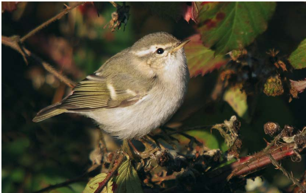
59 Humes Bladkoning / Hume's Leaf Warbler Phylloscopus humei , Offingawier, Friesland, 28 december 2008 (Lex Aalders)