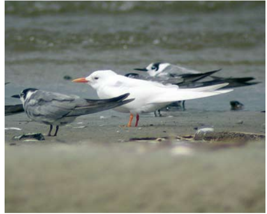
14-15 Leucistic Common Tern / Visdief Sterna hirundo , with normally coloured Common Tern / Visdief and Black Terns / Zwarte Sterns Chlidonias niger , Swinoujscie, Poland, 4 August 2008 (Lukasz Lawicki)

was detected. In general, plumage mutations among Sternidae are rare (van Grouw 2006, Hein van Grouw in litt). Up to now, only one example of a leucistic Common Tern has been published in the literature. This concerns a bird photographed by Martin Budding at Maasvlakte, Zuid-Holland, the Netherlands, on 11 September 1988 (cf Dutch