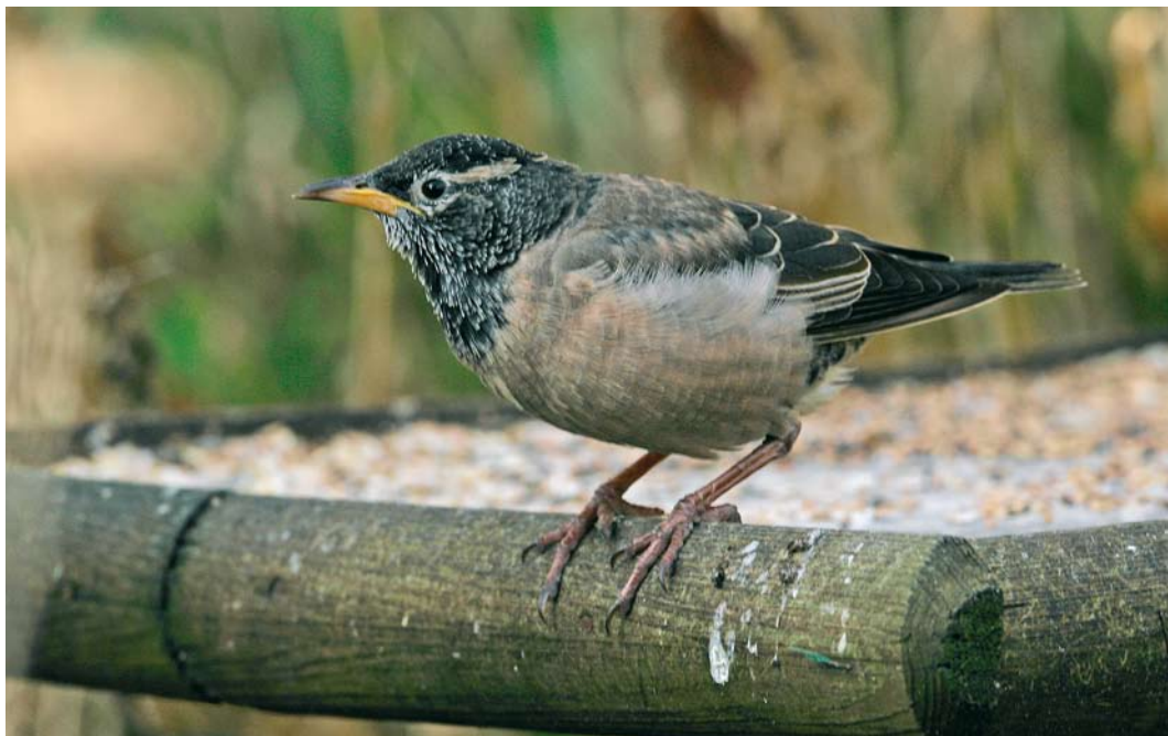
61 Roze Spreeuw / Rosy Starling Pastor roseus , eerstejaars, Den Helder, Noord-Holland, 27 december 2008