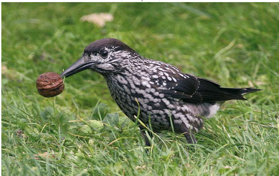
62 Notenkraker / Spotted Nutcracker Nucifraga caryocatactes , Dongen, Noord-Brabant, 8 november 2008