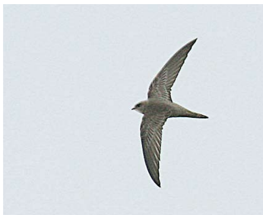
93-94 Vale Gierzwaluw / Pallid Swift Apus pallidus , eerstejaars, Vlieland, Friesland, 20 oktober 2006 (Bas van den Boogaard). Let op contrast tussen donkere kleine dekveren en lichte middelste en grote dekveren, nauwelijks aanwezig lengteverschil tussen buitenste twee staartpennen (t4 en t5), lichte binnenvlag van staartpennen en lichtere anaalstreek, onderstaartdekveren en kop. 95 Vale Gierzwaluw / Pallid Swift Apus pallidus , eerstejaars, Vlieland, Friesland, 20 oktober 2006 (Han Zevenhuizen). Lichte bases van borst- en buikveren vormen ruitpatroon. 96 Vale Gierzwaluw / Pallid Swift Apus pallidus , eerstejaars, Vlieland, Friesland, 20 oktober 2006 (Han Zevenhuizen). Let op contrast tussen iets donkerdere 'zadel' en lichtere kop en stuit. Alle handpennen en dekveren vers en van één generatie, duidend op eerstejaars.

de zomer en onderbreken de rui tijdens de trek om die te completeren in de wintergebieden; deze vogels hebben in het najaar dus een ruigens in de handvleugel met nog gedeeltelijk oude en gesleten veren. Sommige adulten ruien vermoedelijk pas in de wintergebieden en zullen laat in het najaar aanzienlijk meer gesleten zijn dan eerstejaars vogels, zonder de duidelijke lichte randen aan dekveren, stuitveren en bovenstaartdekveren van de vogel van Vlieland.