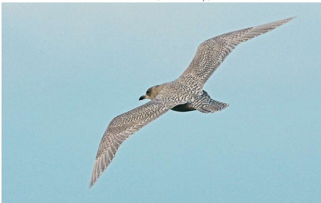
159 Kleine Burgemeester / Iceland Gull Larus glaucooides , eerste-winter, Katwijk aan Zee, Zuid-Holland, 1 februari 2008