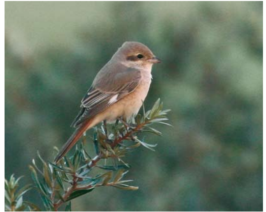
110 Daurian Shrike / Daurische Klauwier Lanius isabellinus , adult male, Den Hoorn, Texel, Noord-Holland, 26 September 2006 111 Daurian Shrike / Daurische Klauwier Lanius isabellinus , adult male, Den Hoorn, Texel, Noord-Holland, 26 September 2006 112 Daurian Shrike / Daurische Klauwier Lanius isabellinus , adult female, Maasvlakte, Rotterdam, Zuid-Holland, Netherlands, 27 August 2006