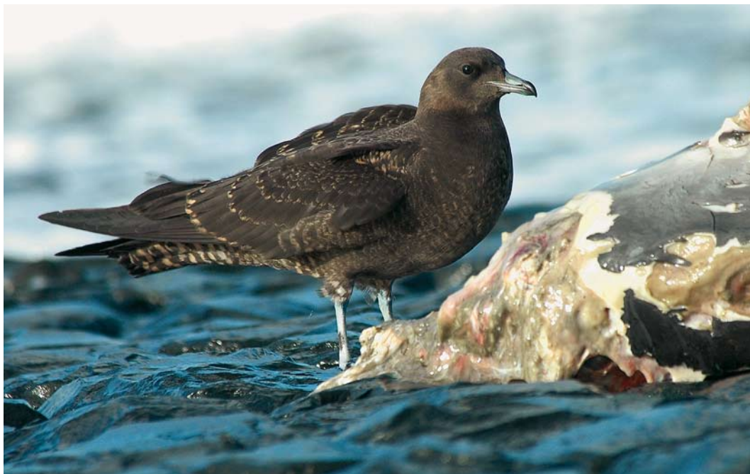
63 Middelste Jager / Pomarine Skua Stercorarius pomarinus , juveniel, met Bruinvis / Harbour Porpoise Phocoena phocoena , Hondsbossche Zeewering, Noord-Holland, 23 november 2007