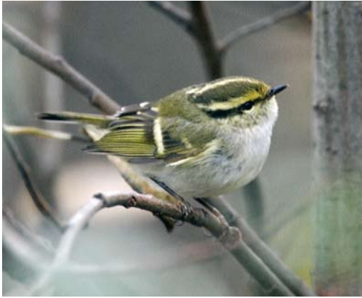
77 Pallas' Boszanger / Pallas's Leaf Warbler Phylloscopus proregulus , Zwarte Pad, Katwijk, Zuid-Holland, 8 december 2007 ( Menno van Duijn )