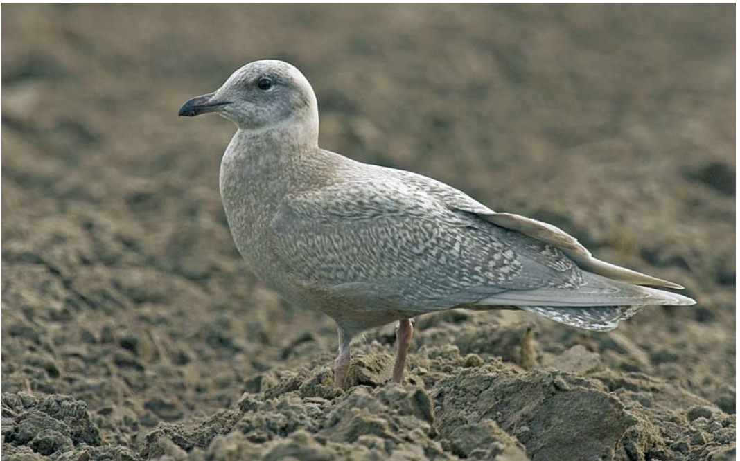
66 Kleine Burgemeester / Iceland Gull Larus glaucooides , eerstejaars, Texel, Noord-Holland, 27 november 2007 (Arend Wassink)