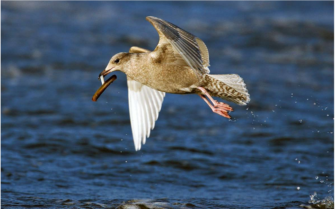
65 Kleine Burgemeester / Iceland Gull Larus glaucooides , eerstejaars, Katwijk aan Zee, Zuid-Holland, 1 december 2007 (Menno van Duijn)