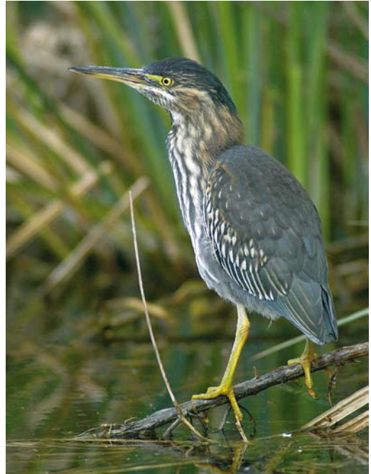
449 Green Heron / Groene Reiger Butorides virescens , third-year, Noorder IJplas, Amsterdam, Noord-Holland, 1 June 2007 450 Green Heron / Groene Reiger Butorides virescens , second calendar-year, Nieuwe Meer, Amsterdam, Noord-Holland, 28 April 2006 451 Squacco Heron / Ralreiger Ardeola ralloides , Julianadorp, Noord-Holland, 2 August 2007