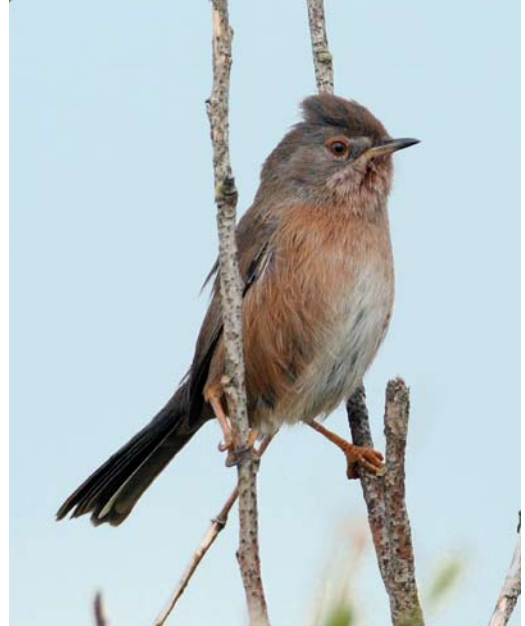
539 Provençaalse Grasmus / Dartford Warbler Sylvia undata , Heist, West-Vlaanderen, 18 oktober 2008

tober verbleef er één in de Kalkense Meersen en bij Uitbergen, Oost-Vlaanderen; van 18 tot 31 oktober pleisterden er twee in de Achterhaven van Zeebrugge en van 24 tot 29 oktober werden er tot twee vogels gezien op de reigerslaapplaats in Harchies, Hainaut. De hoogste tellingen van Kleine Zilverreigers Egretta garzetta betroffen 19 in de IJzervallei in Woumen op 9 en 17 oktober. De grootste concentratie Grote Zilverreigers Casmerodius albus hield zich weer op in de Dijlevallei en telde maximaal 31 exemplaren in het Grootbroek in Sint-Agatha-Rode, Vlaams-Brabant, op 11 en 17 oktober. In Zonhoven, Limburg, waren er 20 op 20 oktober en bij Genk 10 op 22 oktober. Tussen 1 en 20 september werden in totaal nog 36 Purperreigers Ardea purpurea waargenomen. In oktober volgden er nog vier, waarvan de laatste op 19 oktober in Sleidinge, West-Vlaanderen, en op 29 oktober in Flemalle, Liège. Er werden in de eerste helft van september nog 106 Zwarte Ooievaars Ciconia nigra gezien waarvan 18 over de telpost van Torgny, Luxembourg. Op 10 oktober volgde een late vogel over Attenhoven, Vlaams-Brabant. Op 10 september vloog de grootste groep Ooievaars C. ciconia van de periode, 127 exemplaren, over het Groot Schietveld in Brecht, Antwerpen.