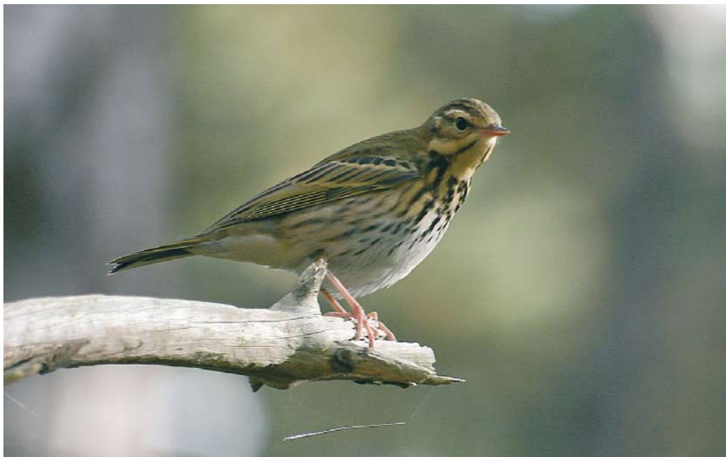
528 Siberische Boompieper / Olive-backed Pipit Anthus hodgsoni , Lange Paal, Vlieland, Friesland, 18 oktober 2008