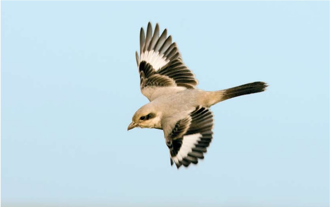
498 Steppe Grey Shrike / Steppeklapekster Lanius pallidirostris , Grainthorpe, Lincolnshire, England, 20 November 2008 (Graham Catley)