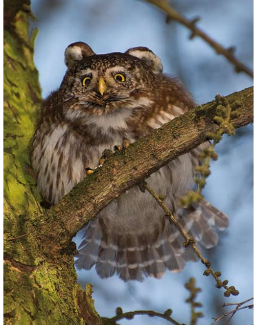
476 Dwerguil / Eurasian Pygmy Owl Glaucidium passerinum , Valkenswaard, Noord-Brabant, 11 februari 2008 (Arnoud B van den Berg)

De periode 2004-08 was lijsttechnisch interessant omdat er diverse soorten niet of beperkt werden gezien door de toplijsters. Absolute blockers als Grijsz Gors, Steenortolaan en Huisgierzwaluw werden alleen door vogelaars gezien die hun lijst niet bijhouden op de