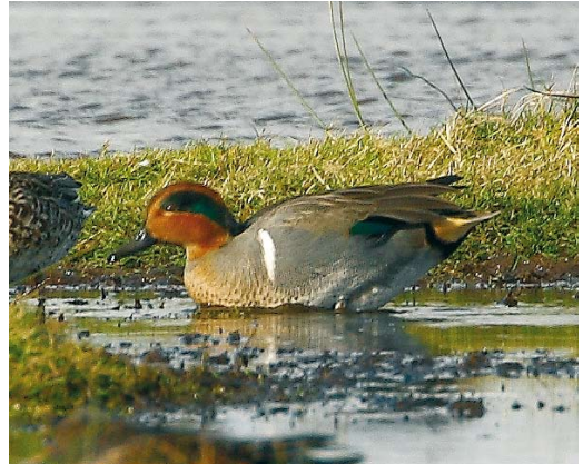
527 Amerikaanse Wintertaling / Green-winged Teal Anas carolinensis , mannetje, Ottersaat, Texel, Noord-Holland, 27 oktober 2008