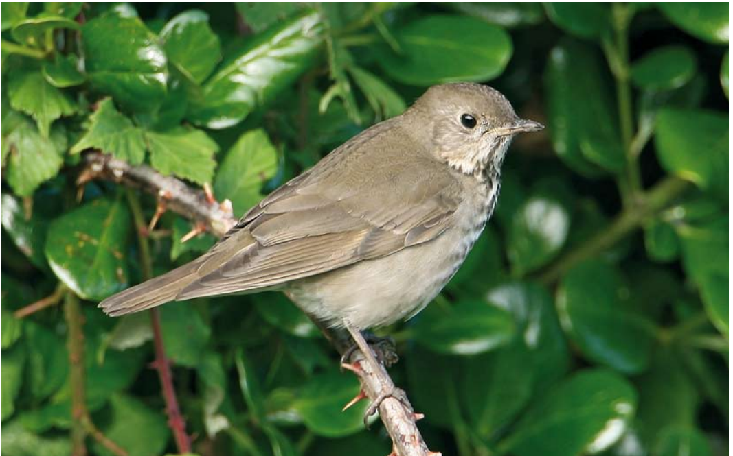
491 Grey-cheeked Thrush / Grijswangdwerglijster Catharus minimus , St Agnes, Scilly, England, 18 October 2008