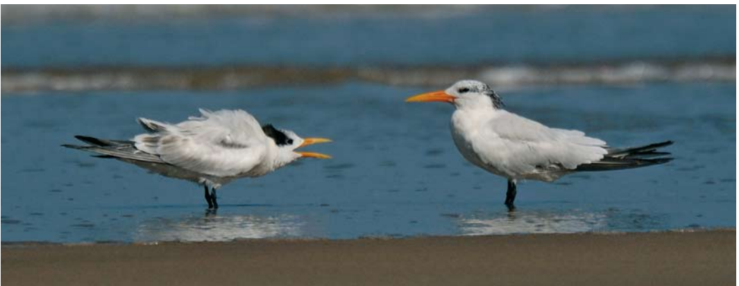
485 Eleonora's Falcon / Eleonora's Valk Falco eleonora , first-year, Maldon, Essex, England, 13 September 2008 ( Russell Neave ) cf Dutch Birding 30: 347, 2008 486 Amur Falcon / Amoeroodpootvalk Falco amurensis , second calendar-year male, Tophill Low, East Yorkshire, England, 6 October 2008 ( Dave Bryan ) 487 Amur Falcon / Amoeroodpootvalk Falco amurensis , second calendar-year male, Tophill Low, East Yorkshire, England, 26 September 2008 ( Andrew Lawson ) 488 Green Heron / Groene Reiger Butorides virescens , first-year, West Hythe, Kent, England, 29 October 2008 ( Dave Stewart ) 489 African Royal Terns / Afrikaanse Koningssterns Sterna maxima albidorsalis , adult and juvenile, north of Asilah, Morocco, 5 October 2008 ( Arnoud B van den Berg )