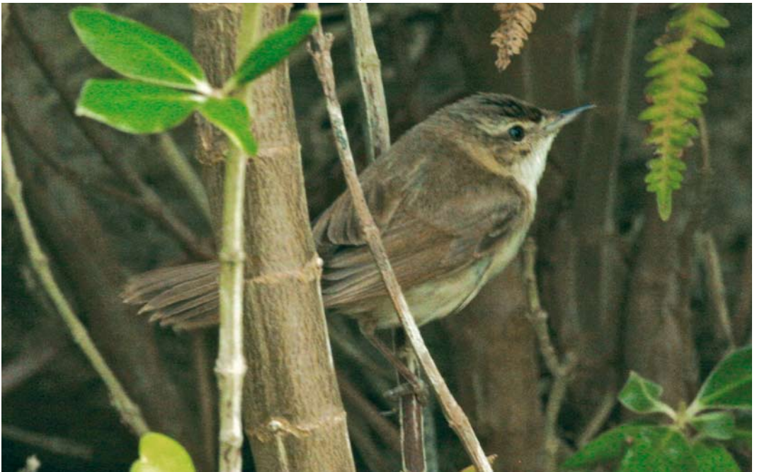
493 Paddyfield Warbler / Veldrietzanger Acrocephalus agricola , Sein, Finistère, France, 14 October 2008