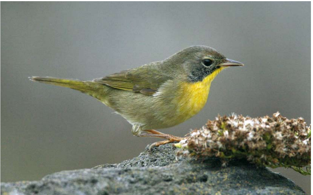
522 Common Yellowthroat / Gewone Maskerzanger Geothlypis trichas , Corvo, Azores, 30 October 2008