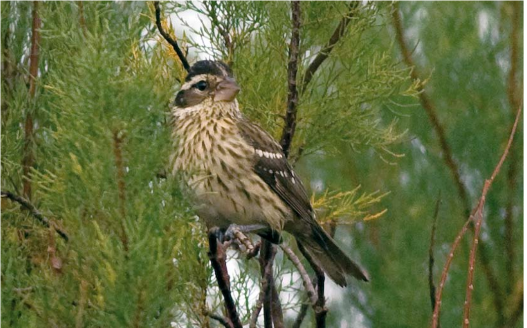
521 Rose-breasted Grosbeak / Roodborstkardinaal Pheucticus ludovicianus , Corvo, Azores, 17 October 2008