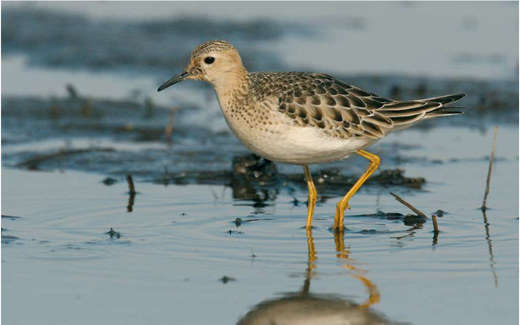
454 Buff-breasted Sandpiper / Blonde Ruiters Tryngites subruficollis , first-year, Petten, Noord-Holland, 11 October 2007