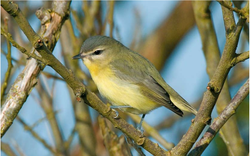
503 Philadelphia Vireo / Philadelphiavireo Vireo philadelphicus , Loop Head, Clare, Ireland, 14 October 2008