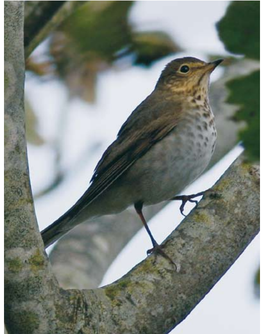
500 Asian Brown Flycatcher / Bruine Vliegenvanger Muscicapa dauurica , first-year, Fair Isle, Shetland, Scotland, 24 September 2008 ( Mark Breaks ) 501 Swainson's Thrush / Dwerglijster Catharus ustulatus , Galley Head, Cork, Ireland, 18 October 2008 ( Paul & Andrea Kelly/irishbirdimages.com ) 502 White-throated Sparrow / Witkeelgors Zonotrichia albicollis , first-year, Cape Clear, Cork, Ireland, 17 October 2008 ( Paul & Andrea Kelly/irishbirdimages.com )