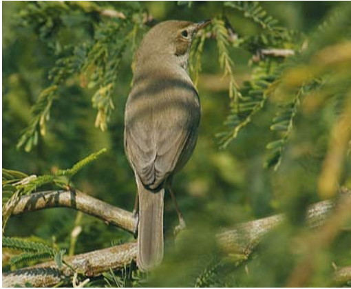
478 Mystery photograph XI (January)