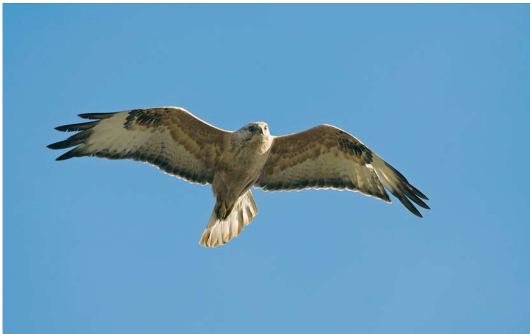
481 Long-legged Buzzard / Arendbuizerd Buteo rufinus , immature, Doel, Oost-Vlaanderen, Belgium, 25 October 2008