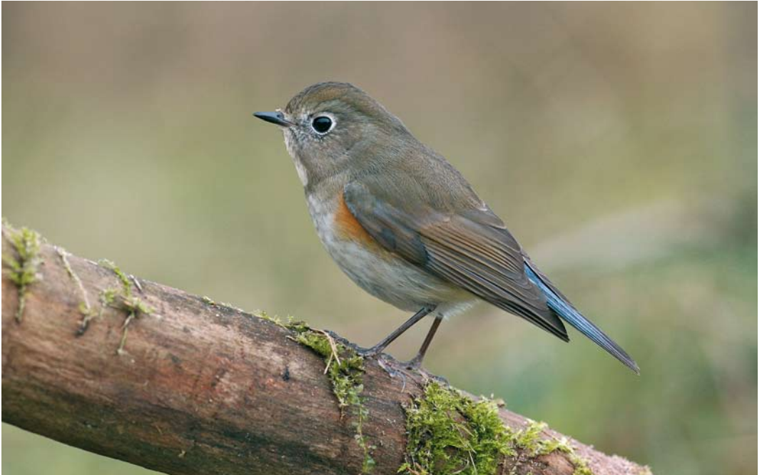
458 Red-flanked Bluetail / Blauwstaart Tarsiger cyanurus , first-year male, Zandvoort, Noord-Holland, 2 February 2007