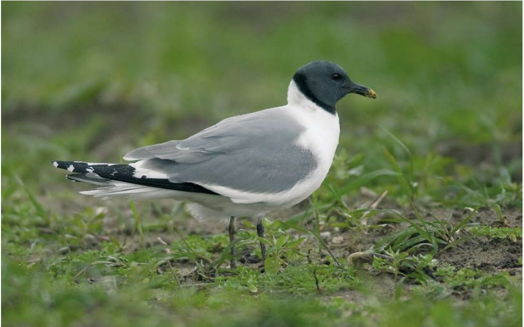
525 Vorkstaartmeeuw / Sabine's Gull Xema sabini , adult zomerkleed, Oudeschild, Texel, Noord-Holland, 15 oktober 2008 (René Pop)