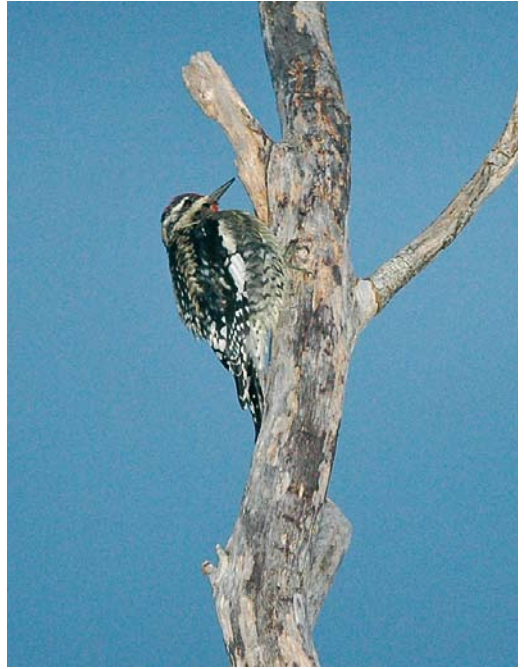
516 Double-crested Cormorant / Georde Aalscholver Phalacrocorax auritus , first-year, Porto Martins, Terceira, Azores, 7 November 2008 ( Martin Gottschling ) 517 Yellow-bellied Sapsucker / Geelbuiksapspecht Sphyrapicus varius , first-year male, Corvo, Azores, 29 October 2008 ( Martin Gottschling ) 518 Common Nighthawk / Amerikaanse Nachtzwaluw Chordeiles minor , juvenile, Corvo, Azores, 19 October 2008 ( David Monticelli )