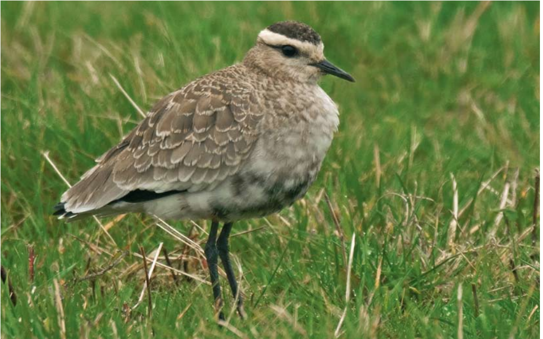
490 Sociable Lapwing / Steppiekievit Vanellus gregarius , adult, St Mary's, Scilly, England, 14 October 2008