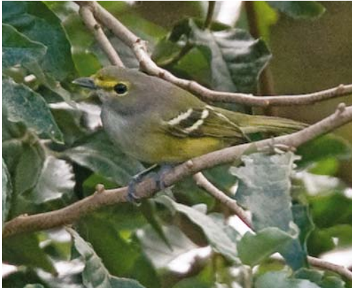
523 White-eyed Vireo / Witoogvireo Vireo griseus , Corvo, Azores, 24 October 2008 (Vincent Legrand)