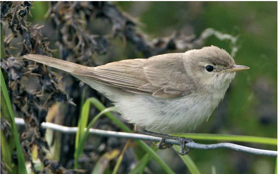
495 Sykes's Warbler / Sykes' Spotvogel Acrocephalus rama , Sumburgh, Shetland, Scotland, 25 September 2008