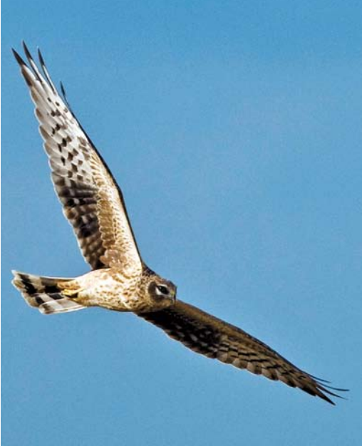
538 Steppiekiekendief / Pallid Harrier Circus macrourus , Burdinne, Liège, 3 september 2008