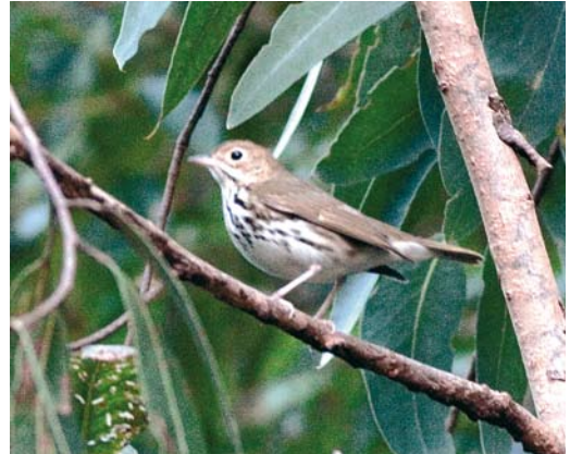
524 Ovenbird / Ovenvogel Seiurus aurocapilla , Serreta, Terceira, Azores, 21 October 2008

by the fact that, already by 7 November this autumn, 65 individuals were trapped at the Castricum ringing station alone. If accepted, a Hume's Leaf Warbler P humei at Sfântu Gheorghe will be the first for Romania. The first for the Faeroes was photographed at Sørvágur, Vágur, on 11 October. In Britain, 13 were seen in the first half of November alone. The third Radde's Warbler P schwarzi for Spain was trapped at Amadorio river, Alicante, on 10 October. The first Dusky Warbler P fuscatus for Romania was trapped at Sfântu Gheorghe. One seen at Batumi on 10 October might be the first for Georgia. The fifth for Malta occurred at Ghadira nature reserve on 31 October. In Italy, one was trapped near Modena on 25 October and, in Portugal, one was photographed at Quinta do Lago on 3-4 November.