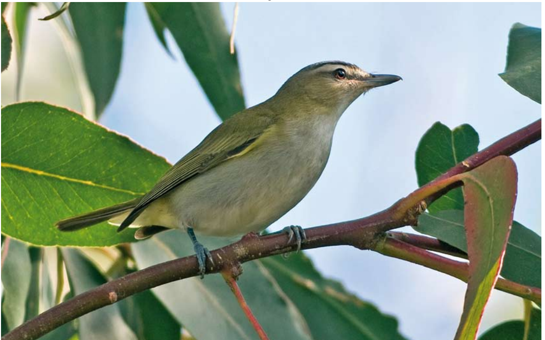
504 Red-eyed Vireo / Roodoogvireo Vireo olivaceus , St Mary's, Scilly, England, 11 October 2008