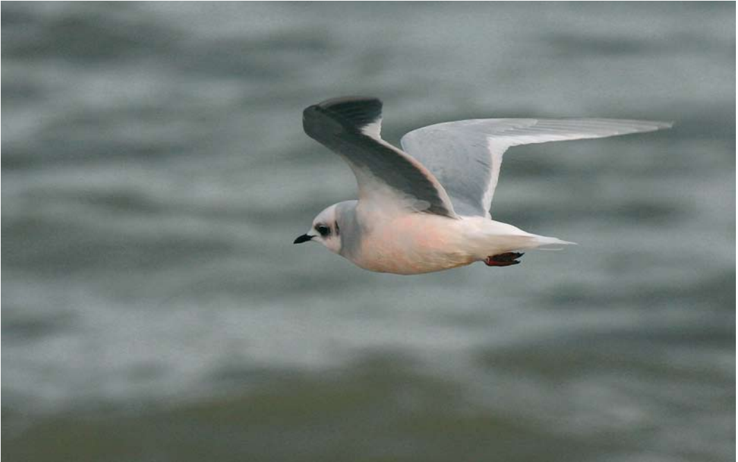
471 Ross' Meeuw / Ross's Gull Rhodostethia rosea , adult, Scheveningen, Zuid-Holland, 23 november 2004