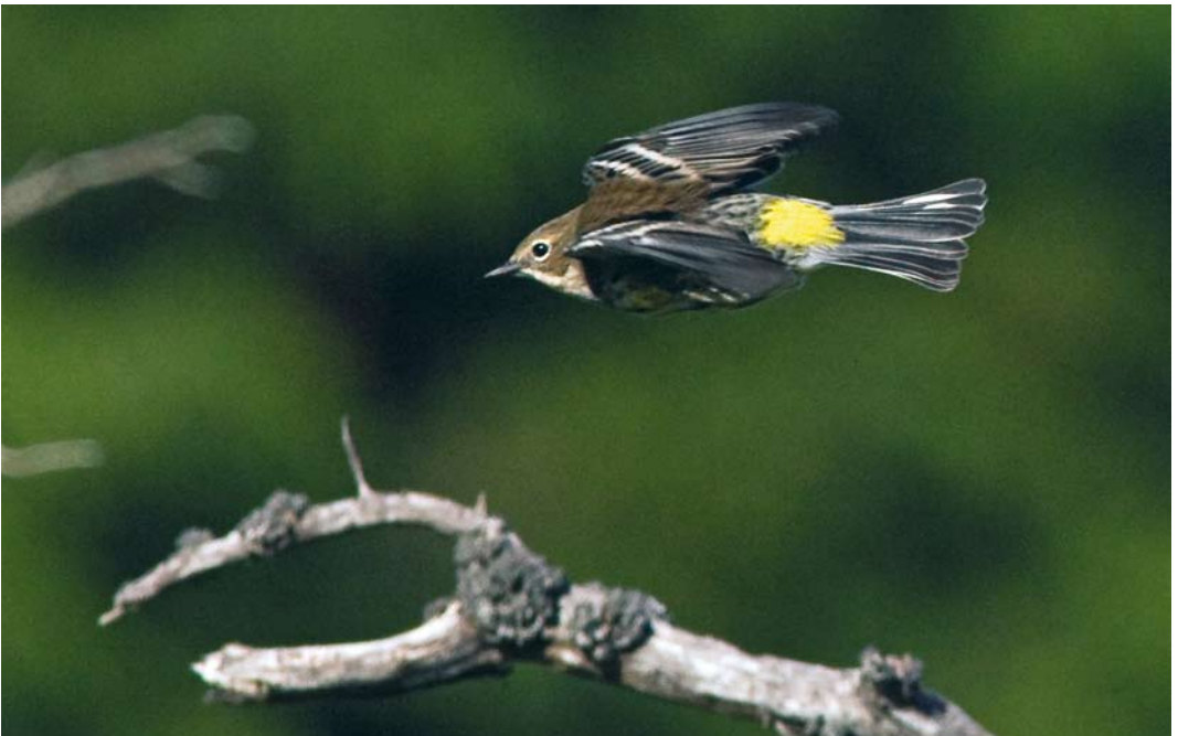
520 Myrtle Warbler / Mirtezanger Dendroica coronata , Corvo, Azores, 26 October 2008