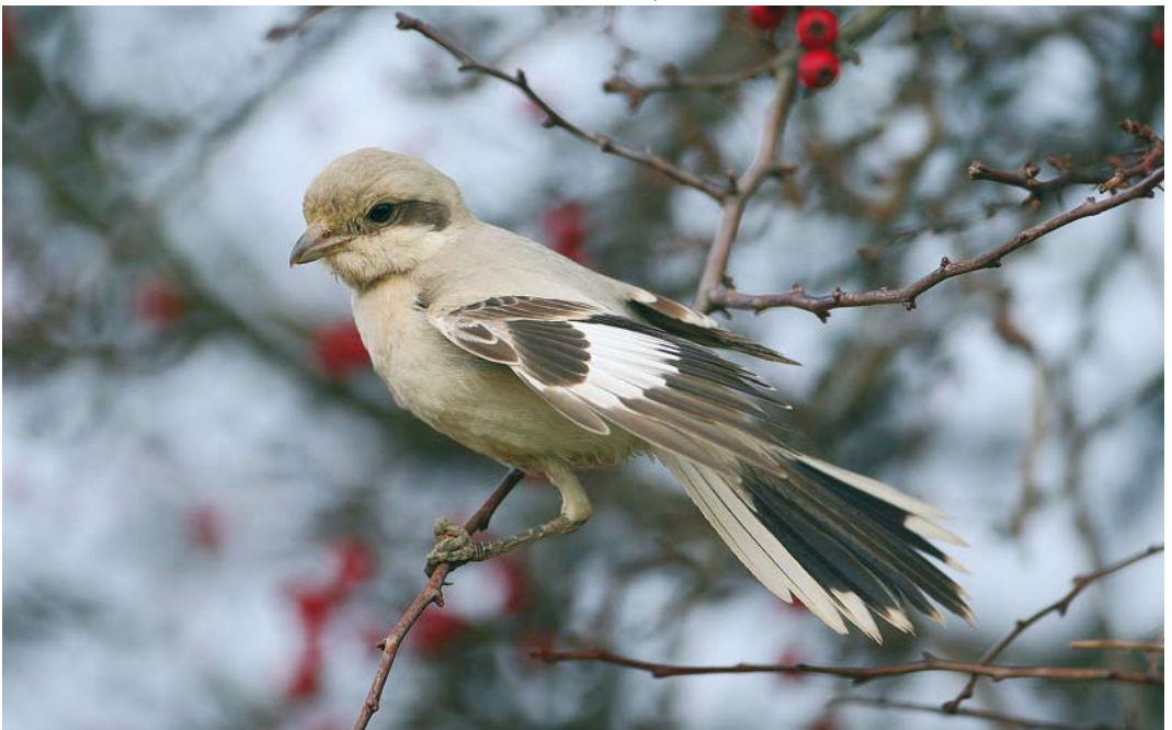
499 Steppe Grey Shrike / Steppeklapekster Lanius pallidirostris , Grainthorpe, Lincolnshire, England, 15 November 2008 (Gary Thoburn)