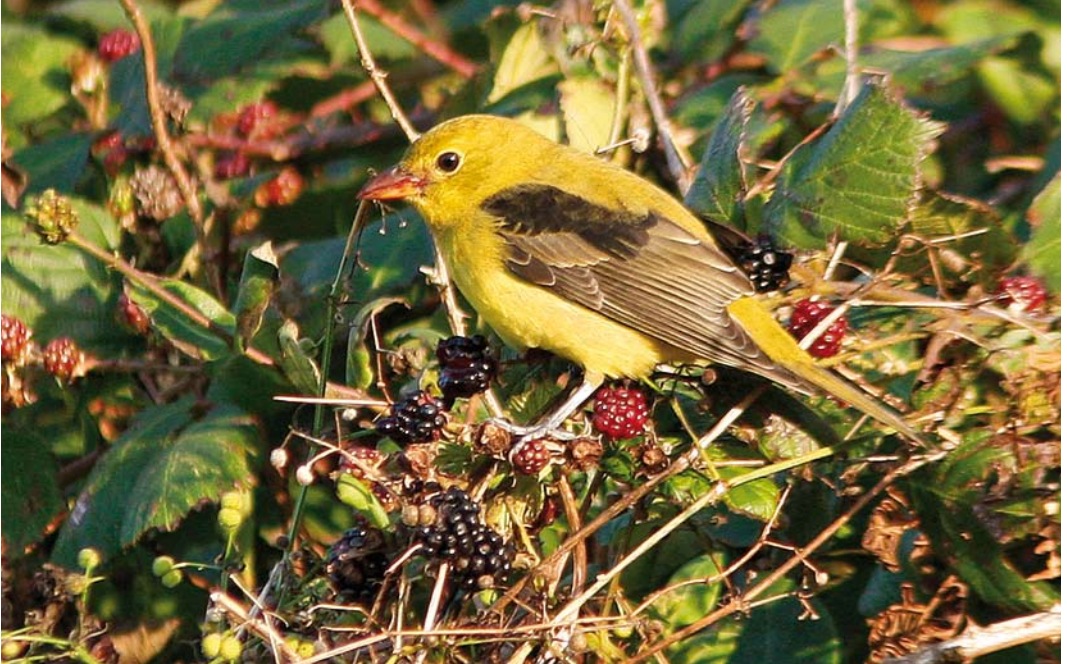
494 Scarlet Tanager / Zwartvleugeltangare Piranga olivacea , first-winter male, Garinish Point, Cork, Ireland, 8 October 2008