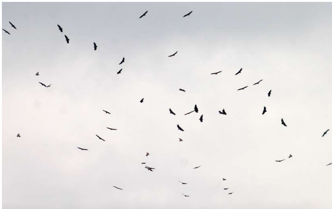
452 Griffon Vultures / Vale Gieren Gyps fulvus , Oostburg, Zeeland, 18 June 2007

ber 2006, when it was taken into care; also, it is regarded as the same individual seen in Germany on 2-15 July (it was not seen in the Netherlands between from 1 June to 19 July) (Hudson & Rarities Committee 2008). It has been accepted by BBRC in Category D of the British list.