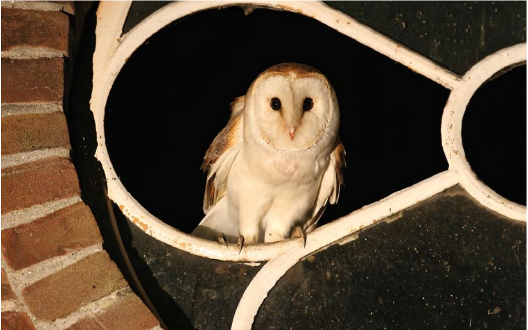
457 Pale Barn Owl / Witte Kerkuil Tyto alba alba , Zuid-Holland, 11 July 2007

partly because of uncertainties about its status. For instance, de Jong (1995) suggests that 'intermediates' between this taxon and Dark Barn Owl T. a. guttata occur regularly in the southern Netherlands. The only Pale Barn Owl mentioned by van den Berg & Bosman (2001) concerns a photographed bird ringed south-west of Ommen, Overijssel, on 22 January 1976 and found dead as road victim at Varades, Loire-Atlantique, France, on 22 April 1976 (Limosa 54: 97-98, 1981). This record has not been formally considered by the CDNA and will be reviewed. As a consequence, it seems possible that the 1983 specimen will turn out to be the first record of this subspecies; it was found while studying the differences with Dark Barn Owl and was wrongly labelled as the latter. Information about the location of the individual photographed in 2007 is withheld at the request of the observers.