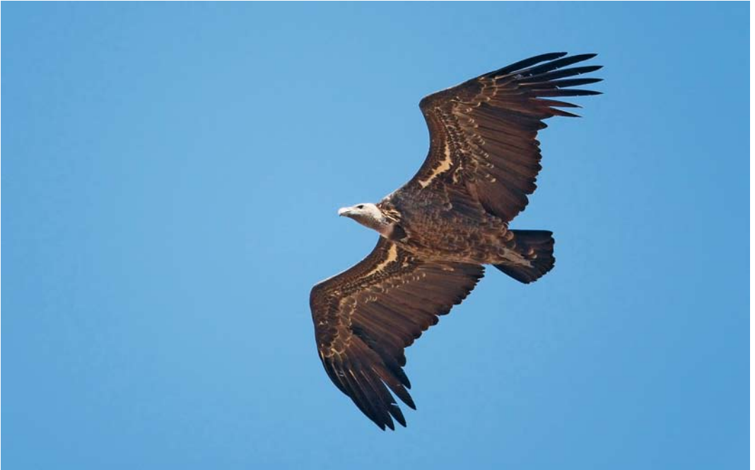
483 Rüppells Vulture / Rüppells Gier Gyps rueppellii , Tarifa, Cádiz, Spain, 7 September 2008 cf Dutch Birding 30: 347, 2008