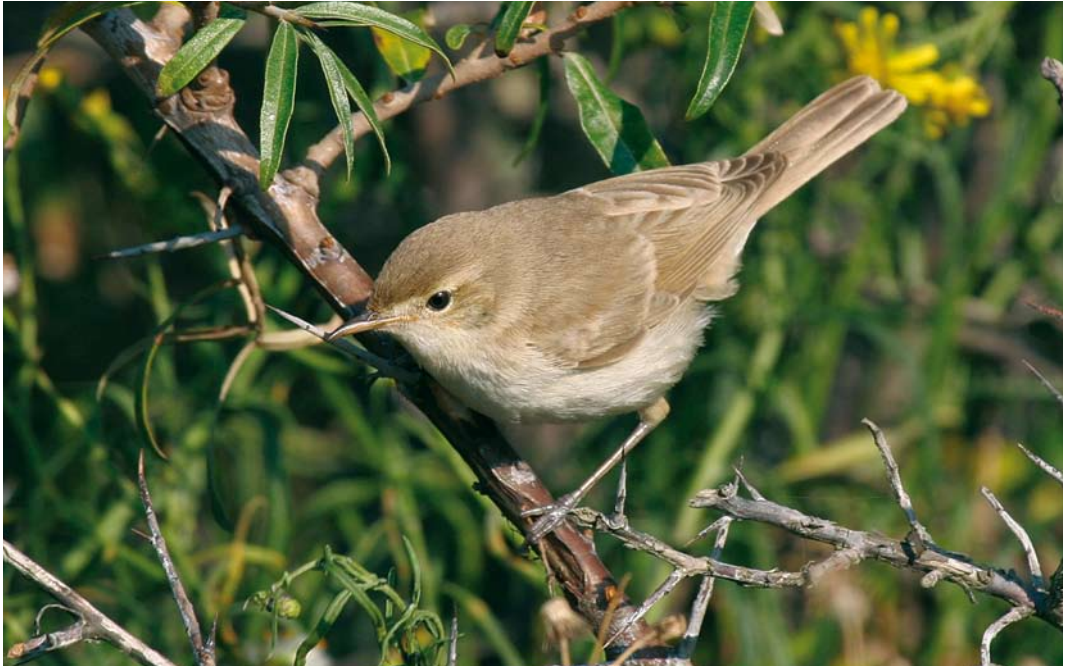
460 Booted Warbler / Kleine Spotvogel Acrocephalus caligatus , Maasvlakte, Zuid-Holland, 16 September 2007 (Loes van Rietschoten)