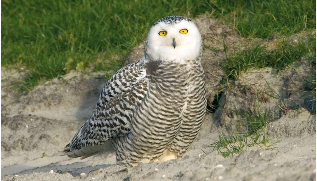
544 Sneeuwuil / Snowy Owl Bubo scandiacus , eerstejaars, Texel, Noord-Holland, 17 november 2008 (Roland Jansen)

gens lastig om de aanwezigheid van ringen met zekerheid uit te sluiten.