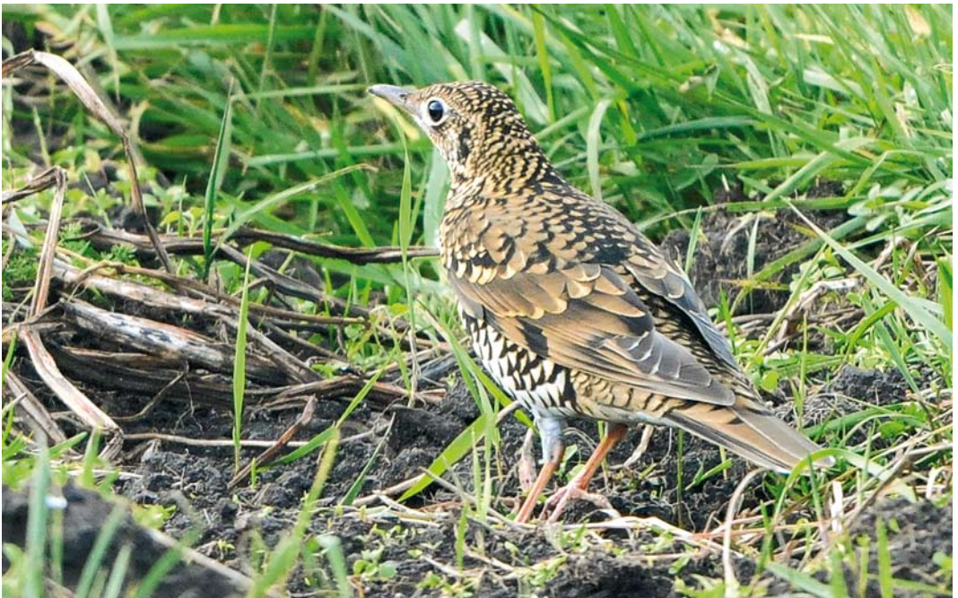
497 White's Thrush / Goudlijster Zoothera aurea , Fair Isle, Shetland, Scotland, 8 October 2008