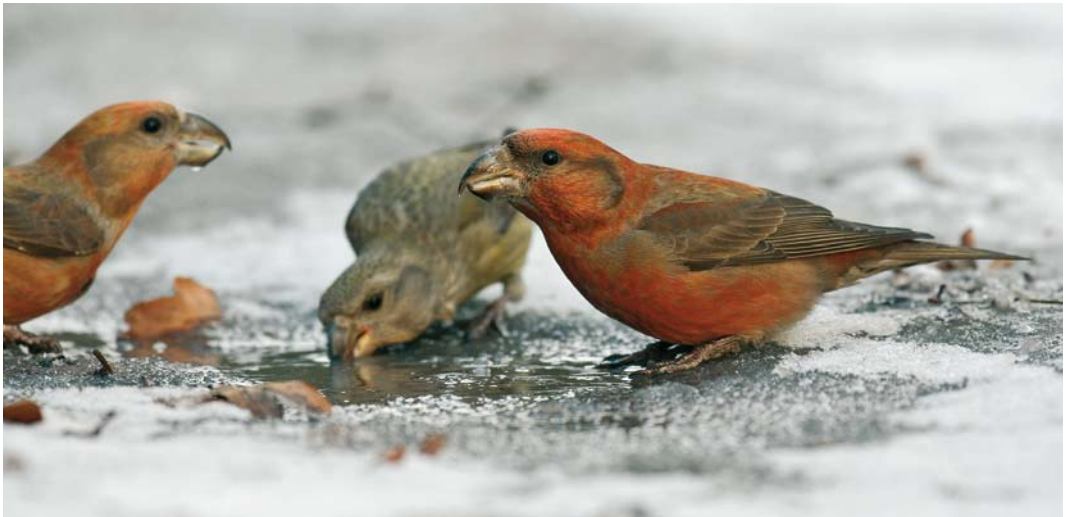
461 Eastern Crowned Warbler / Kroonboszanger Phylloscopus coronatus , Katwijk aan Zee, Zuid-Holland, 5 October 2007 (Marc Guyt/Agami) 462 Mongoolse Pieper / Blyth's Pipit Anthus godlewskii , Woerden, Utrecht, 24 January 2007 (Enno B Ebels) 463 Parrot Crossbills / Grote Kruisbekken Loxia pytyopsittacus , Schoorl, Noord-Holland, 4 January 2008 (Chris van Rijswijk/birdshooting.nl)

photographed, sound-recorded (S Bot, M Gal, S Wytéma et al); 9 October, Eemshaven, Eemsmond , Groningen, ringed, photographed (L Tervelde); 8-12 December, Amsterdamse Bos, Amsterdam , Noord-Holland, photographed, sound-recorded (R Heemskerck).