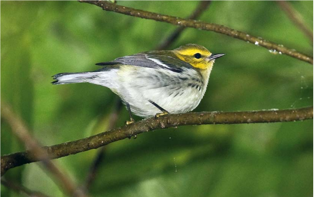
519 Black-throated Green Warbler / Gele Zwartkeelzanger Dendroica virens , Corvo, Azores, 23 October 2008