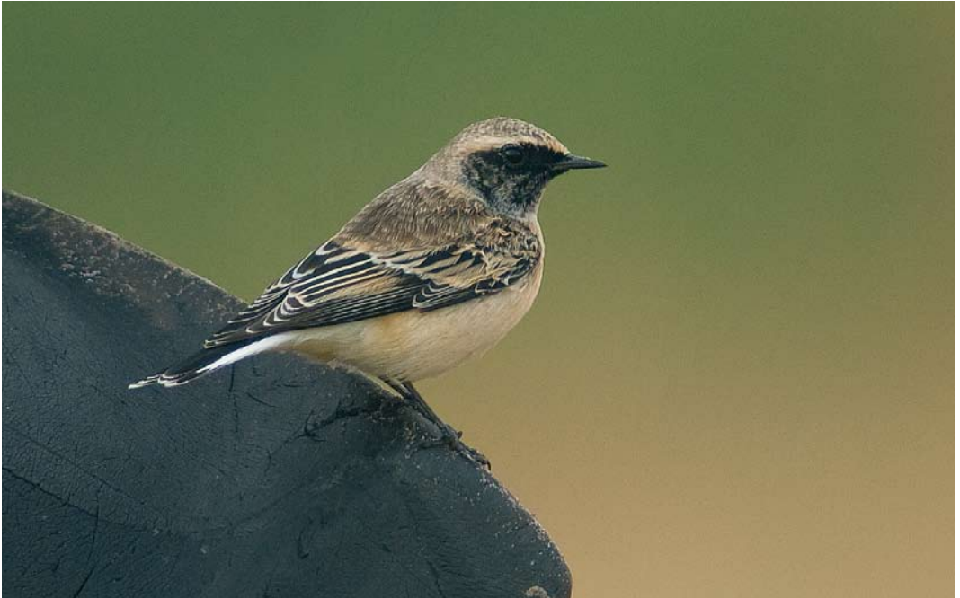
530 Bonte Tapuit / Pied Wheatear Oenanthe pleschanka , eerstejaars mannetje, Jan Ayeslag, Texel, Noord-Holland, 13 oktober 2008