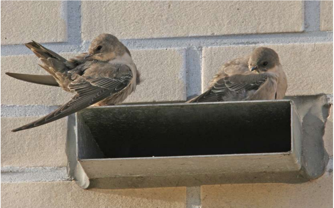
473 Rotszwaluwen / Eurasian Crag Martins Ptyonoprogne rupestris , Hoorn, Noord-Holland, 18 november 2006