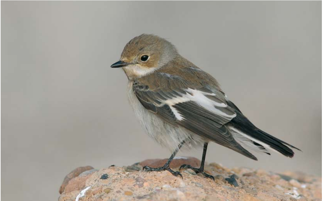
492 Collared Flycatcher / Withalsvliegenvanger Ficedula albicollis , female, Helgoland, Schleswig-Holstein, Germany, 27 September 2008 (Roef Mulder)