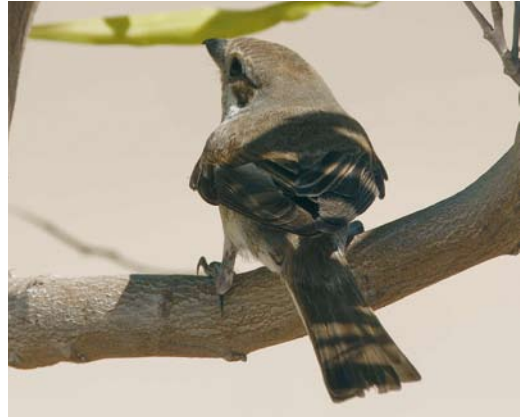
479 Mystery photograph XII (September)

in favour of Lesser Crested. This character, however, is subject to considerable variation and must be used with care. The most important difference can be found in the pattern of the upperwing. Royal shows a prominent dark carpal bar and an obvious dark greyish bar on both the greater coverts and secondaries. These three characters are also present in Lesser Crested but much less obvious and thus creating a weaker upperwing pattern. In rest, this character is still useful. The carpal bar of the mystery bird can be seen well and looks rather dark grey. The greater coverts can also be seen well and the outer ones are pale grey, whereas the inner ones are darker grey. In Royal, all the greater coverts have the same rather dark grey colour and the paler grey outer greater coverts are a strong pointer for Lesser Crested. In addition, in Royal, the outer primaries are rather blackish, whereas in Lesser Crested these are also paler, like those shown by the mystery bird. In conclusion, this tern can be safely identified as a Lesser Crested. It was photographed by Edwin Winkel at the Red Sea coast of Egypt on 3 October 2007. Another photograph of the same bird is shown in plate 477.