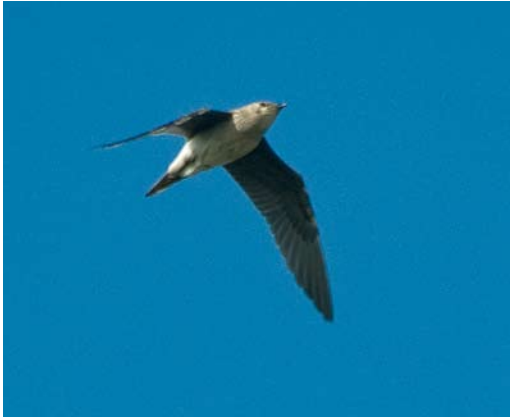
526 Steppevorkstaartplevier / Black-winged Pratincole Glareola nordmanni , Petten, Noord-Holland, 13 september 2008