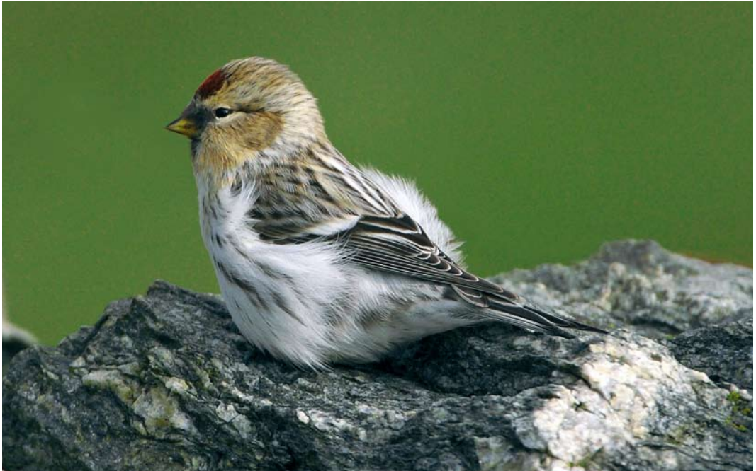
515 Hornemann's Redpoll / Groenlandse Witsluitbarmsijs Carduelis hornemanni hornemanni , Cullivoe, Yell, Shetland, Scotland, 5 October 2008

Shetland. The second for France was photographed on Sein, Finistère, on 15 October. In Ireland, a Swainson's Thrush Catharus ustulatus was discovered at Galley Head, Cork, on 11 October. Grey-cheeked Thrushes C. minimus were found on Ouessant, Finistère, on 7 October, at Portland, Dorset, on 8 October (trapped) and in Scilly on St Agnes on 14-22 October, on St Mary's on 26-31 October and on Bryher on 4 November. A female Black-throated Thrush Turdus atrogularis was trapped on Utsira on 7 October and one was reported in Norfolk on 31 October. In Denmark, a female returned to Nivå, Sjælland, on 17 November for its third consecutive winter. The 13th for Israel was found at Ein Avdat on 14 November. A first-winter American Robin Turdus migratorius at Selfoss on 18-28 October was the fifth for Iceland.