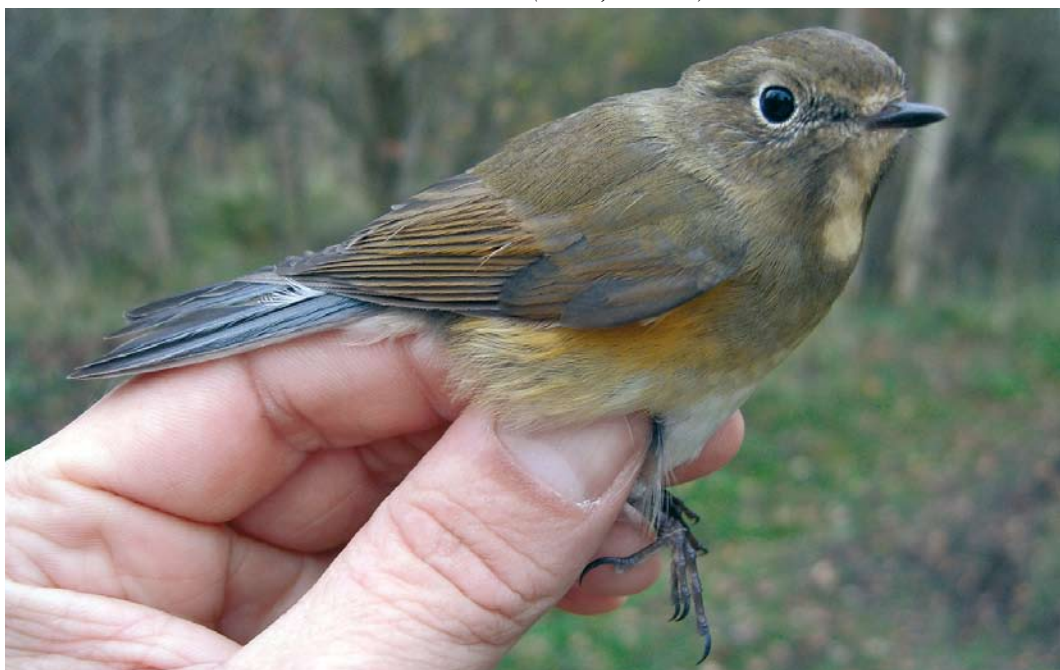
529 Blauwstaart / Red-flanked Bluetail Tarsiger cyanurus , Groene Glop, Schiermonnikoog, Friesland, 1 november 2008