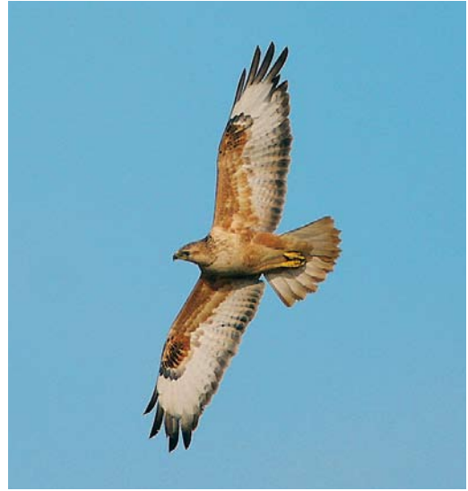
540-541 Arendbuizerd / Long-legged Buzzard Buteo rufinus , onvolwassen, Doel, Oost-Vlaanderen, 25 oktober 2008 (Patrick Beirens)