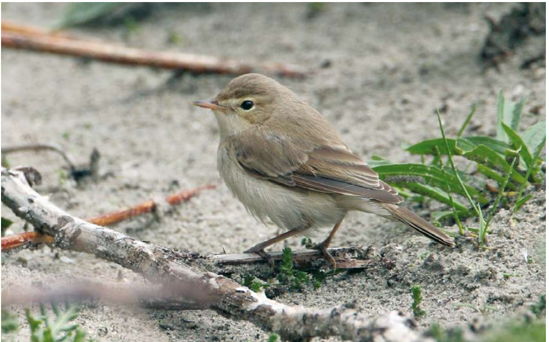
531 Kleine Spotvogel / Booted Warbler Acrocephalus caligatus , Maasvlakte, Zuid-Holland, 13 september 2008 (Martin van der Schalk)