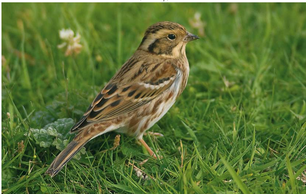
533 Bosgors / Rustic Bunting Emberiza rustica , eerstejaars, Robbenjager, Texel, Noord-Holland, 4 oktober 2008