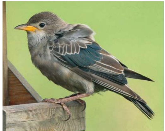
534 Baardgrasmus / Subalpine Warbler Sylvia cantillans , eerstejaars, Den Helder, Noord-Holland, 14 september 2008 535 Notenkraker / Spotted Nutcracker Nucifraga caryocatactes , Horst, Limburg, 25 oktober 2008 536 Roze Spreeuw / Rosy Starling Sturnus roseus , eerstejaars, De Cocksdorp, Texel, Noord-Holland, 25 september 2008 537 Roze Spreeuw / Rosy Starling Sturnus roseus , eerstejaars, De Cocksdorp, Texel, Noord-Holland, 16 oktober 2008

genwoordigd, met 4198 langs de Nollledijk op 13 oktober (landelijk record) en 3646 langs de Vulkaan op 11 oktober (derde dagtelling ooit in Nederland). Een 'Pleskes Mees' C cyanus x caeruleus werd op 22 oktober gemeld op de Maasvlakte. Een Taigaboombkruiper Certhia familiaris werd op 24 september geringd op Vlieland. Andere exemplaren werden gemeld op 20 september in het Lauwersmeergebied, Friesland; op 28 september op Texel en bij Mirns, Friesland; op 4 en 23 oktober op Schiermonnikoog; tussen 10 en 24 oktober op Vlieland; op 11 oktober in Amsterdam; op 18 oktober in Eelde, Drenthe; en op 31 oktober in Hoogkerk, Groningen. In totaal werden 26 doortrekkende Buidelmezen Remiz pendulinus doorgegeven. Opvallend waren de exemplaren die zich op meerdere dagen bij de telposten Hoekse Sluis en Kinderdijk lieten zien. Verder waren er ringvangsten bij Saeftinghe op 18 oktober en Castricum op 29 oktober. Na drie meldingen in septem-