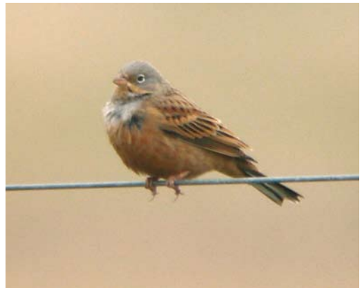
505 Blackpoll Warbler / Zwartkopzanger Dendroica striata , first-year, Utö, Korppoo, Finland, 23 October 2008 506 Alder Flycatcher / Elzenfeetiran Empidonax alnorum , Nanjizal, Cornwall, England, 8 October 2008 507 Siberian Thrush / Siberische Lijster Zoothera sibirica , Fair Isle, Shetland, Scotland, 25 September 2008 508 Siberian Thrush / Siberische Lijster Zoothera sibirica , Sein, Finistère, France, 15 October 2008 509 Dwerggorzen / Little Buntings Emberiza pusilla , Linosa, Sicily, Italy, 20 October 2008 510 Cretzschmar's Bunting / Bruinkeelortolaan Emberiza caesia , male, North Ronaldsay, Orkney, Scotland, 21 September 2008