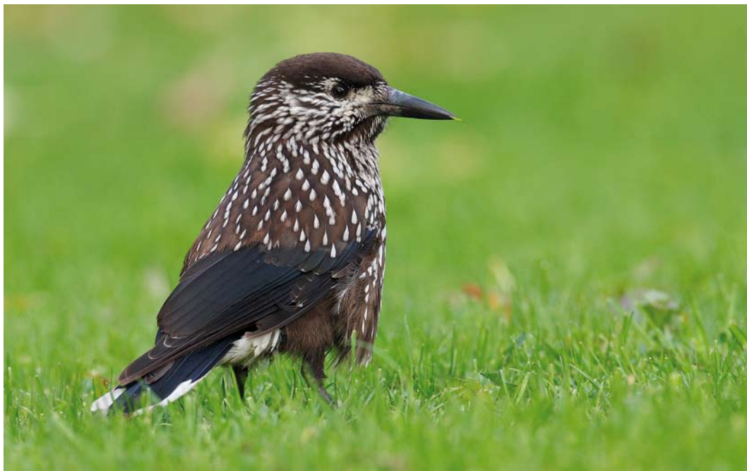
532 Notenkraker / Spotted Nutcracker Nucifraga caryocatactes , Delfzijl, Groningen, 2 november 2008 (Mark Schuurman)