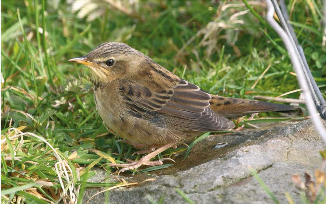
496 Pallas's Grasshopper Warbler / Siberische Sprinkhaanzanger Locustella certhiola , Fair Isle, Shetland, Scotland, 1 October 2008 (Mark Breaks)