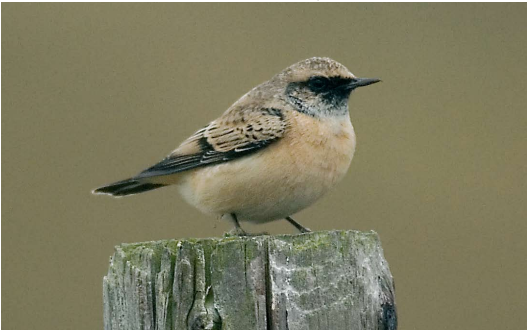
459 Pied Wheatear / Bonte Tapuit Oenanthe pleschanka , male, De Cocksdorp, Texel, Noord-Holland, 3 October 2007