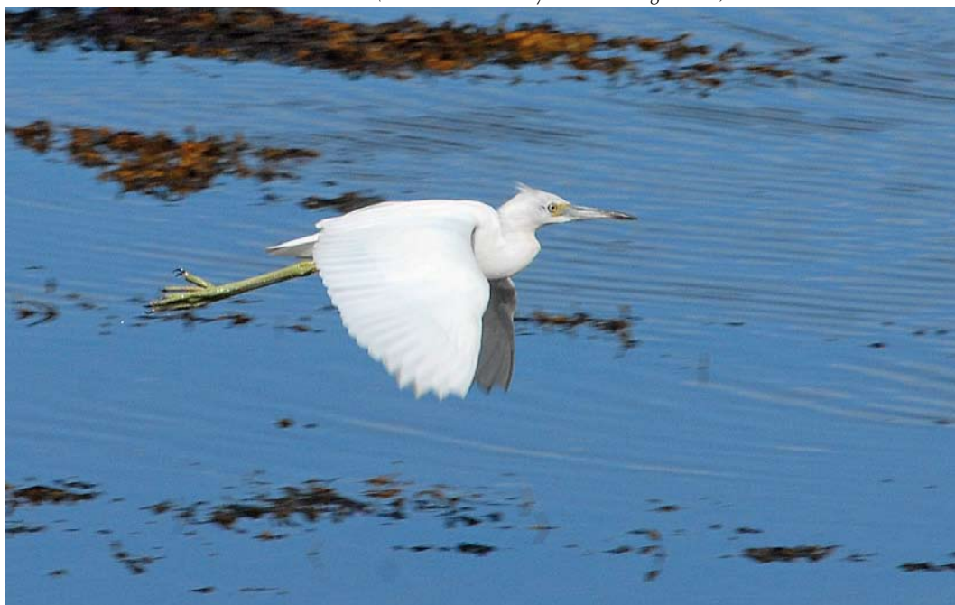
482 Little Blue Heron / Kleine Blauwe Reiger Egretta caerulea , first-year, Letterfrack, Galway, Ireland, 5 October 2008