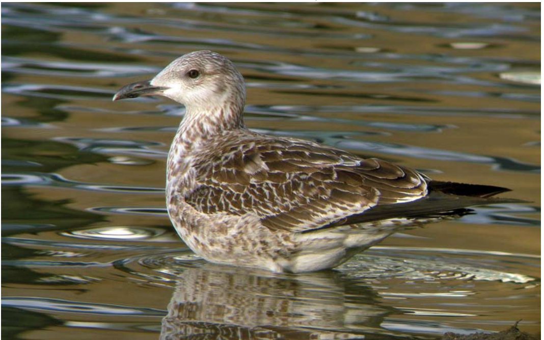
455 Baltic Gull / Baltische Mantelmeeuw Larus fuscus fuscus , first-year, Vinkhuizen, Groningen, Groningen, 19 December 2006