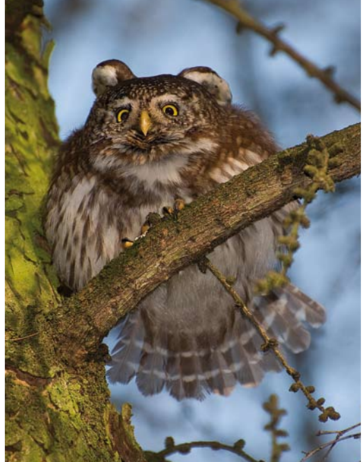
476 Dwerguil / Eurasian Pygmy Owl Glaucidium passerinum , Valkenswaard, Noord-Brabant, 11 februari 2008

De periode 2004-08 was lijsttechnisch interessant omdat er diverse soorten niet of beperkt werden gezien door de toplijsters. Absolute blockers als Grijsz Gors, Steenortolaan en Huisgierzwaluw werden alleen door vogelaars gezien die hun lijst niet bijhouden op de