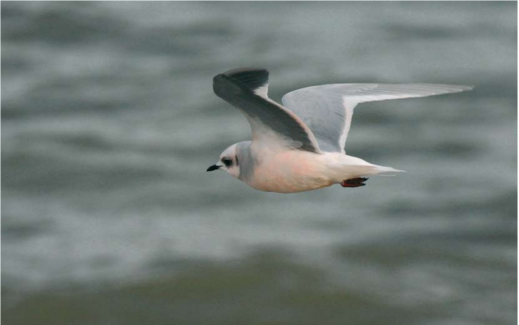
471 Ross' Meeuw / Ross's Gull Rhodostethia rosea , adult, Scheveningen, Zuid-Holland, 23 november 2004