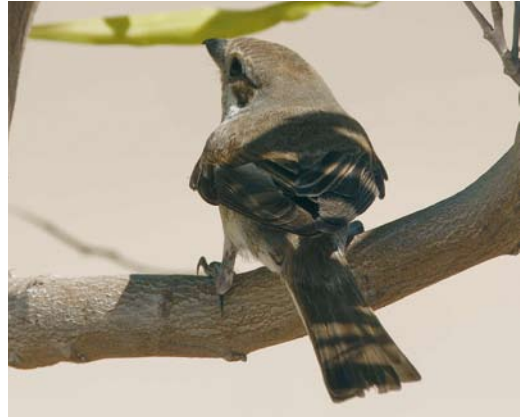
479 Mystery photograph XII (September)

in favour of Lesser Crested. This character, however, is subject to considerable variation and must be used with care. The most important difference can be found in the pattern of the upperwing. Royal shows a prominent dark carpal bar and an obvious dark greyish bar on both the greater coverts and secondaries. These three characters are also present in Lesser Crested but much less obvious and thus creating a weaker upperwing pattern. In rest, this character is still useful. The carpal bar of the mystery bird can be seen well and looks rather dark grey. The greater coverts can also be seen well and the outer ones are pale grey, whereas the inner ones are darker grey. In Royal, all the greater coverts have the same rather dark grey colour and the paler grey outer greater coverts are a strong pointer for Lesser Crested. In addition, in Royal, the outer primaries are rather blackish, whereas in Lesser Crested these are also paler, like those shown by the mystery bird. In conclusion, this tern can be safely identified as a Lesser Crested. It was photographed by Edwin Winkel at the Red Sea coast of Egypt on 3 October 2007. Another photograph of the same bird is shown in plate 477.