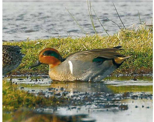
527 Amerikaanse Wintertaling / Green-winged Teal Anas carolinensis , mannetje, Ottersaat, Texel, Noord-Holland, 27 oktober 2008 (Eric Menkveld)