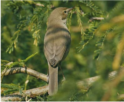
478 Mystery photograph XI (January)