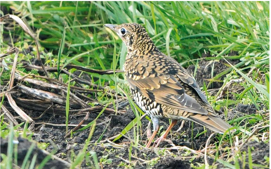
497 White's Thrush / Goudlijster Zoothera aurea , Fair Isle, Shetland, Scotland, 8 October 2008 (Rebecca Nason)