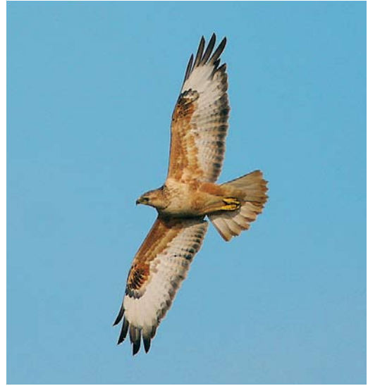
540-541 Arendbuizerd / Long-legged Buzzard Buteo rufinus , onvolwassen, Doel, Oost-Vlaanderen, 25 oktober 2008 (Patrick Beirens)