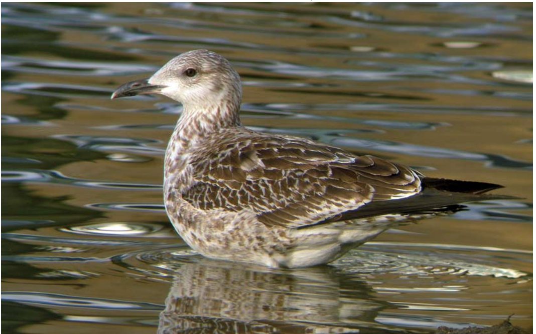
455 Baltic Gull / Baltische Mantelmeeuw Larus fuscus fuscus , first-year, Vinkhuizen, Groningen, Groningen, 19 December 2006