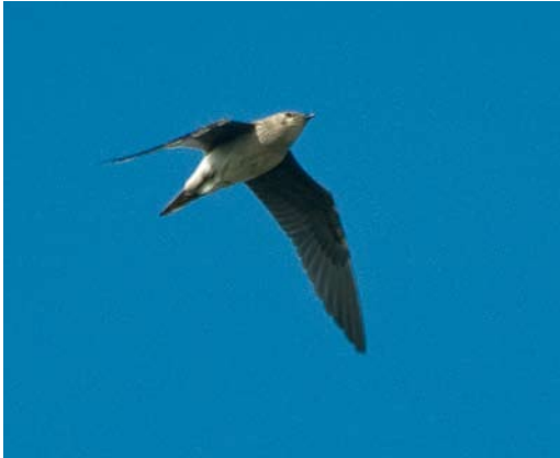
526 Steppevorkstaartplevier / Black-winged Pratincole Glareola nordmanni , Petten, Noord-Holland, 13 september 2008 (Pierre van der Wielen)