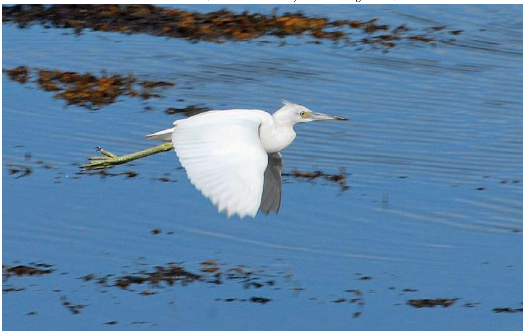
482 Little Blue Heron / Kleine Blauwe Reiger Egretta caerulea , first-year, Letterfrack, Galway, Ireland, 5 October 2008