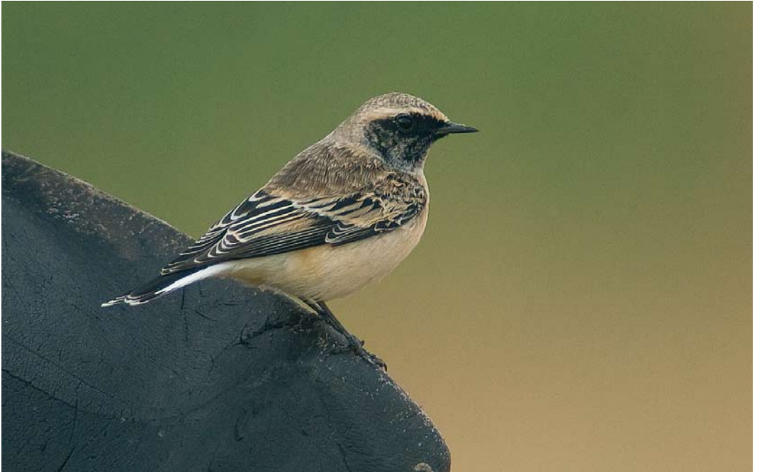
530 Bonte Tapuit / Pied Wheatear Oenanthe pleschanka , eerstejaars mannetje, Jan Ayeslag, Texel, Noord-Holland, 13 oktober 2008