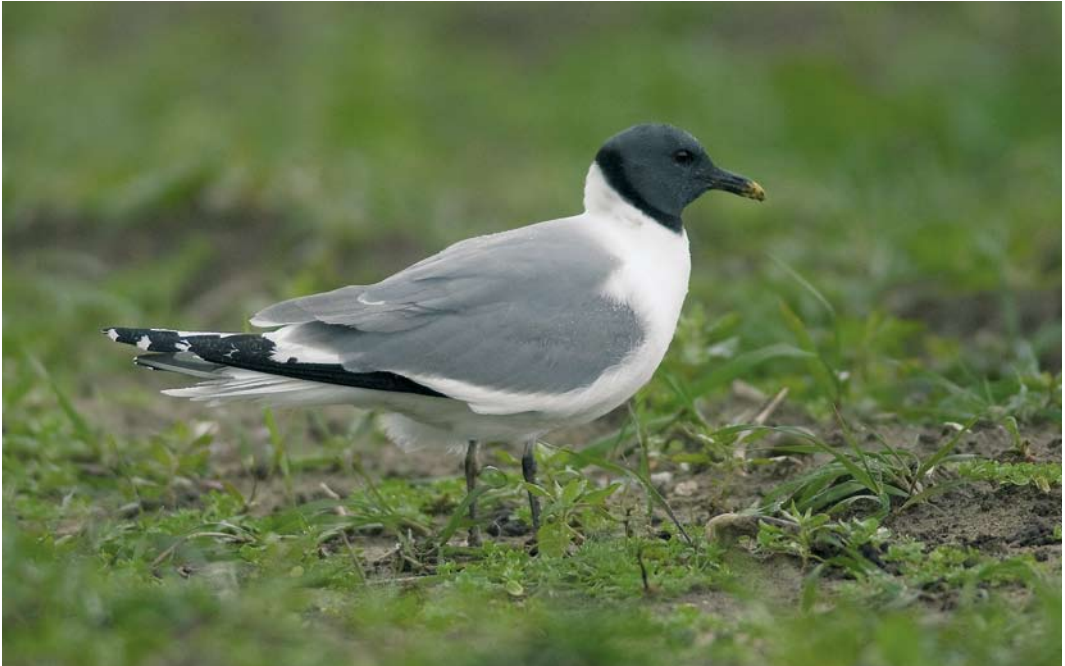
525 Vorkstaartmeeuw / Sabine's Gull Xema sabini , adult zomerkleed, Oudeschild, Texel, Noord-Holland, 15 oktober 2008 (René Pop)