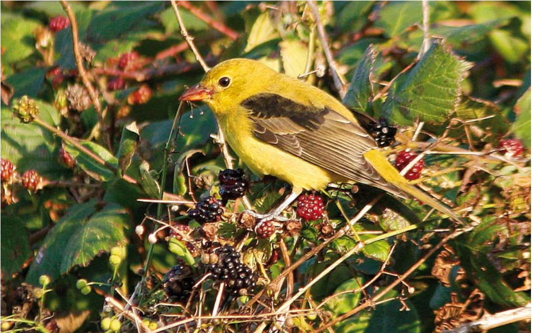
494 Scarlet Tanager / Zwartvleugeltangare Piranga olivacea , first-winter male, Garinish Point, Cork, Ireland, 8 October 2008