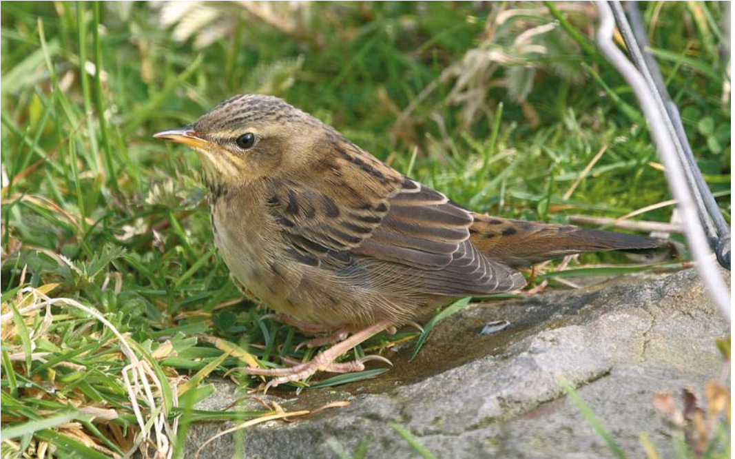
496 Pallas's Grasshopper Warbler / Siberische Sprinkhaanzanger Locustella certhiola , Fair Isle, Shetland, Scotland, 1 October 2008