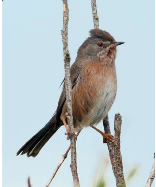
539 Provençaalse Grasmus / Dartford Warbler Sylvia undata , Heist, West-Vlaanderen, 18 oktober 2008

tober verbleef er één in de Kalkense Meersen en bij Uitbergen, Oost-Vlaanderen; van 18 tot 31 oktober pleisterden er twee in de Achterhaven van Zeebrugge en van 24 tot 29 oktober werden er tot twee vogels gezien op de reigerslaapplaats in Harchies, Hainaut. De hoogste tellingen van Kleine Zilverreigers Egretta garzetta betroffen 19 in de IJzervallei in Woumen op 9 en 17 oktober. De grootste concentratie Grote Zilverreigers Casmerodius albus hield zich weer op in de Dijlevallei en telde maximaal 31 exemplaren in het Grootbroek in Sint-Agatha-Rode, Vlaams-Brabant, op 11 en 17 oktober. In Zonhoven, Limburg, waren er 20 op 20 oktober en bij Genk 10 op 22 oktober. Tussen 1 en 20 september werden in totaal nog 36 Purperreigers Ardea purpurea waargenomen. In oktober volgden er nog vier, waarvan de laatste op 19 oktober in Sleidinge, West-Vlaanderen, en op 29 oktober in Flemalle, Liège. Er werden in de eerste helft van september nog 106 Zwarte Ooievaars Ciconia nigra gezien waarvan 18 over de telpost van Torgny, Luxembourg. Op 10 oktober volgde een late vogel over Attenhoven, Vlaams-Brabant. Op 10 september vloog de grootste groep Ooievaars C. ciconia van de periode, 127 exemplaren, over het Groot Schietveld in Brecht, Antwerpen.