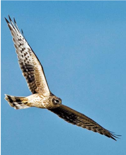
538 Steppiekiekendief / Pallid Harrier Circus macrourus , Burdinne, Liège, 3 september 2008 (Vincent Legrand)