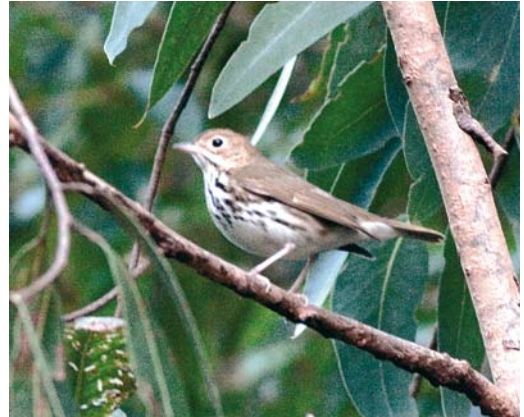
524 Ovenbird / Ovenvogel Seiurus aurocapilla , Serreta, Terceira, Azores, 21 October 2008 (Ferran López)

by the fact that, already by 7 November this autumn, 65 individuals were trapped at the Castricum ringing station alone. If accepted, a Hume's Leaf Warbler P humei at Sfântu Gheorghe will be the first for Romania. The first for the Faeroes was photographed at Sørvágur, Vágur, on 11 October. In Britain, 13 were seen in the first half of November alone. The third Radde's Warbler P schwarzi for Spain was trapped at Amadorio river, Alicante, on 10 October. The first Dusky Warbler P fuscatus for Romania was trapped at Sfântu Gheorghe. One seen at Batumi on 10 October might be the first for Georgia. The fifth for Malta occurred at Ghadira nature reserve on 31 October. In Italy, one was trapped near Modena on 25 October and, in Portugal, one was photographed at Quinta do Lago on 3-4 November.