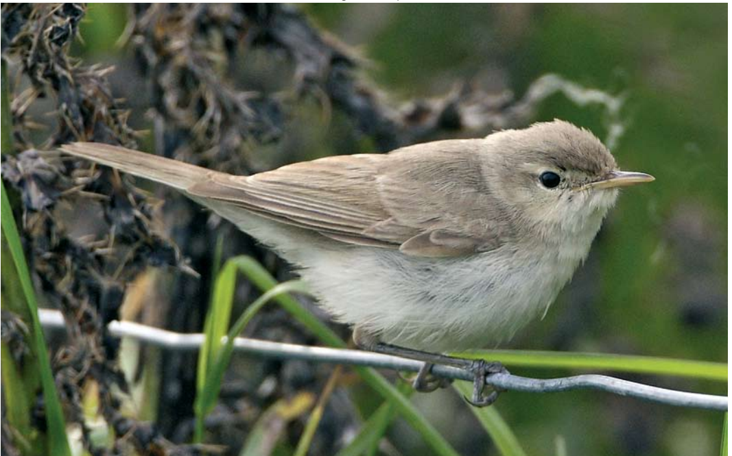
495 Sykes's Warbler / Sykes' Spotvogel Acrocephalus rama , Sumburgh, Shetland, Scotland, 25 September 2008 (Hugh Harrop)