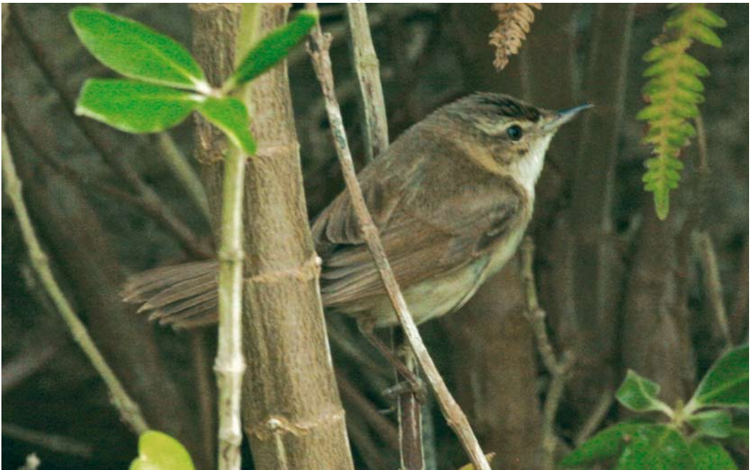
493 Paddyfield Warbler / Veldrietzanger Acrocephalus agricola , Sein, Finistère, France, 14 October 2008