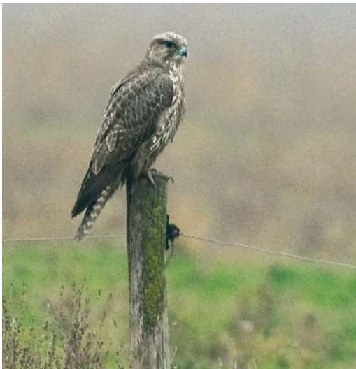
542 Giervalk / Gyr Falcon Falco rusticolus , onvolwassen, Hongerige Wolf, Groningen, 3 november 2008 (Rein Hofman)