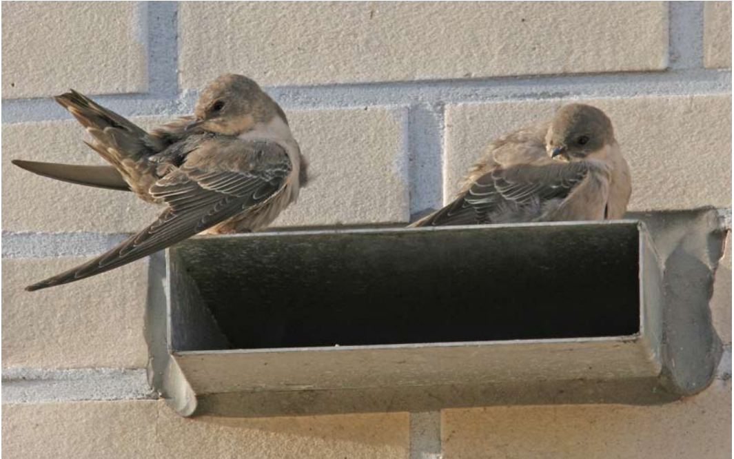
473 Rotszwaluwen / Eurasian Crag Martins Ptyonoprogne rupestris , Hoorn, Noord-Holland, 18 november 2006