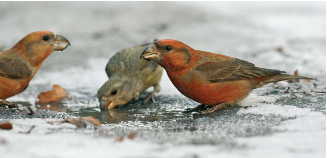
461 Eastern Crowned Warbler / Kroonboszanger Phylloscopus coronatus , Katwijk aan Zee, Zuid-Holland, 5 October 2007 462 Mongoolse Pieper / Blyth's Pipit Anthus godlewskii , Woerden, Utrecht, 24 January 2007 463 Parrot Crossbills / Grote Kruisbekken Loxia pytyopsittacus , Schoorl, Noord-Holland, 4 January 2008

photographed, sound-recorded (S Bot, M Gal, S Wytéma et al); 9 October, Eemshaven, Eemsmond , Groningen, ringed, photographed (L Tervelde); 8-12 December, Amsterdamse Bos, Amsterdam , Noord-Holland, photographed, sound-recorded (R Heemskerck).