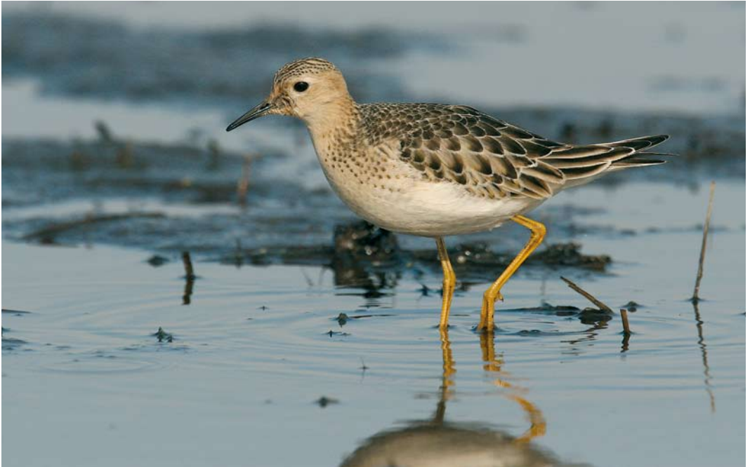
454 Buff-breasted Sandpiper / Blonde Ruiters Tryngites subruficollis , first-year, Petten, Noord-Holland, 11 October 2007