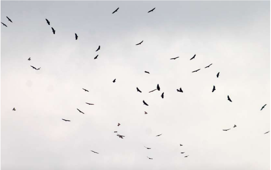
452 Griffon Vultures / Vale Gieren Gyps fulvus , Oostburg, Zeeland, 18 June 2007

ber 2006, when it was taken into care; also, it is regarded as the same individual seen in Germany on 2-15 July (it was not seen in the Netherlands between from 1 June to 19 July) (Hudson & Rarities Committee 2008). It has been accepted by BBRC in Category D of the British list.