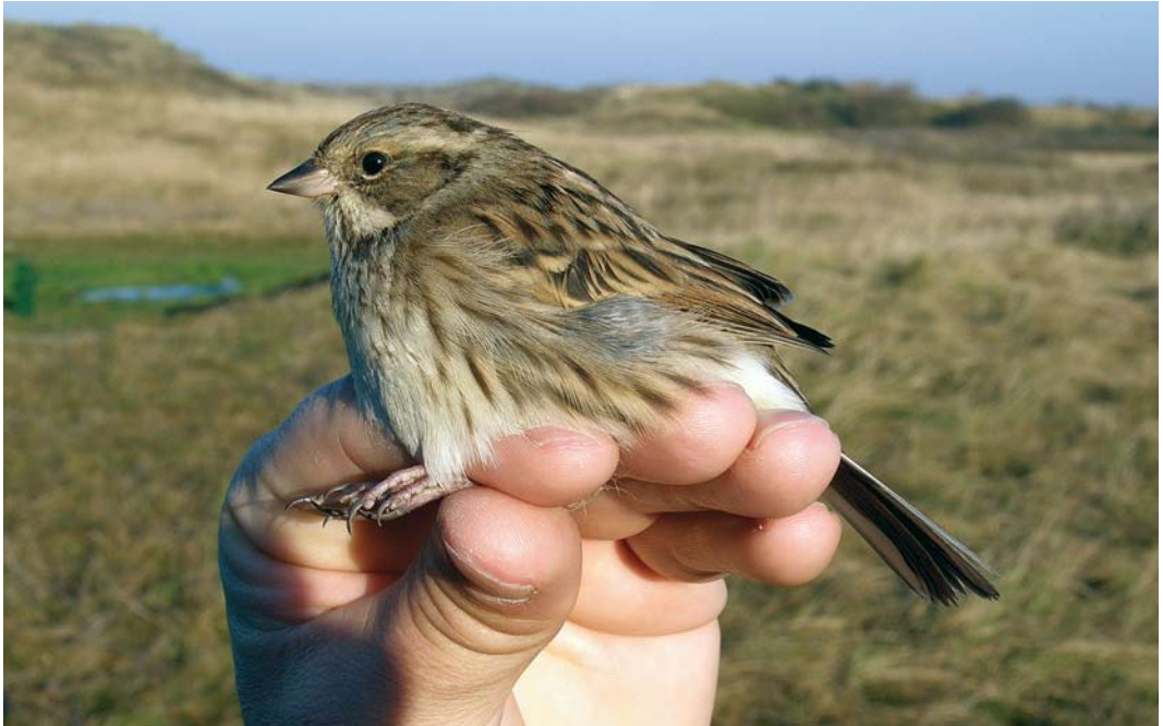
465 Black-faced Bunting / Maskergors Emberiza spodocephala , first-year female, Noordhollands Duinreservaat, Castricum, Noord-Holland, 18 November 2007 ( André J van Loon )

2008, Hargen aan Zee and Schoorl, Bergen , Noord-Holland, minimum of nine (five males and four female-types), photographed, sound-recorded, videoed (J Stok, C Oosterhuis et al; Ebels 2008; Dutch Birding 30: 55, plate 76, 61, plate 80, 62, plate 81-82, 2008).