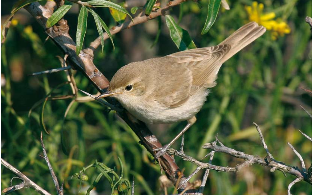
460 Booted Warbler / Kleine Spotvogel Acrocephalus caligatus , Maasvlakte, Zuid-Holland, 16 September 2007