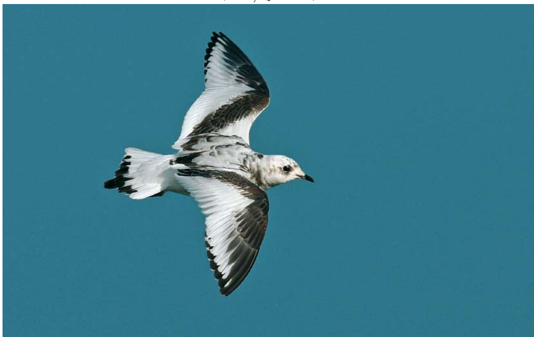
49 Ross's Gull / Ross' Meeuw Rhodostethia rosea , first-year, Douarnenez, Finistère, France, 1 January 2008