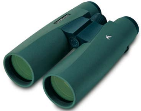
Swarovski SLC 15x56 binoculars