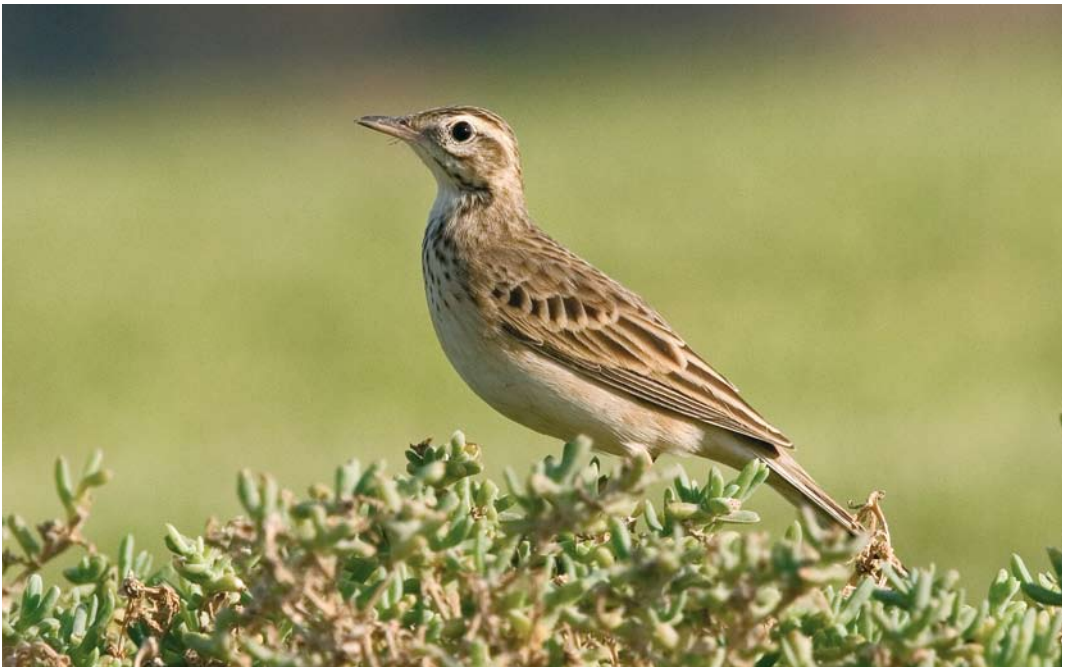
53 Richard's Pipit / Grote Pieper Anthus richardi , El Gouna, Egypt, 3 October 2007