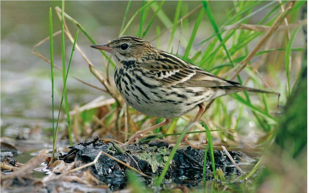
51 Pechora Pipit / Petsjorapieper Anthus gustavi , Goodwick Moor, Pembrokeshire, Wales, 22 November 2007 (Dave Stewart)