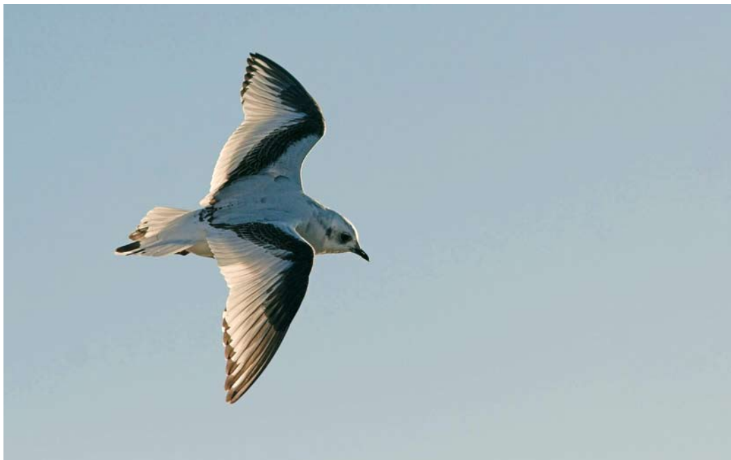
48 Ross's Gull / Ross' Meeuw Rhodostethia rosea , first-year, Esbjerg, Ribe, Denmark, 31 December 2007