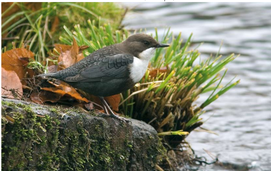
73 Zwartbuikwaterspreeuw / Black-bellied Dipper Cinclus cinclus cinclus , Rozendaal, Gelderland, 23 november 2007