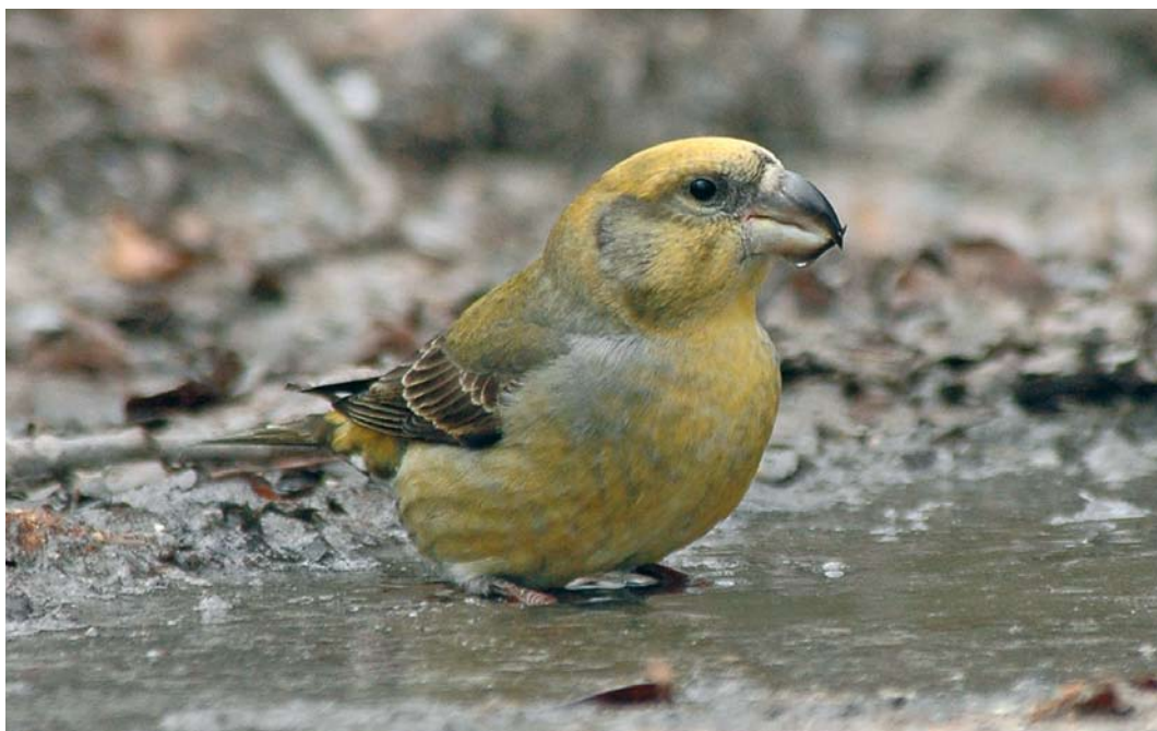
82 Grote Kruisbek / Parrot Crossbill Loxia pytyopsittacus , vrouwtje, Schoorl, Noord-Holland, 18 december 2007