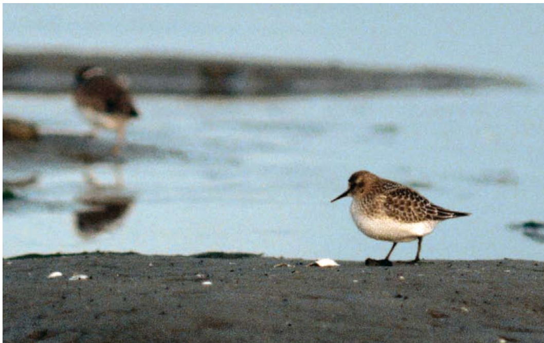
34 Bairds Strandloper / Baird's Sandpiper Calidris bairdii , juveniel, 'Bairdsstrand', Maasvlakte, Zuid-Holland, september 1980