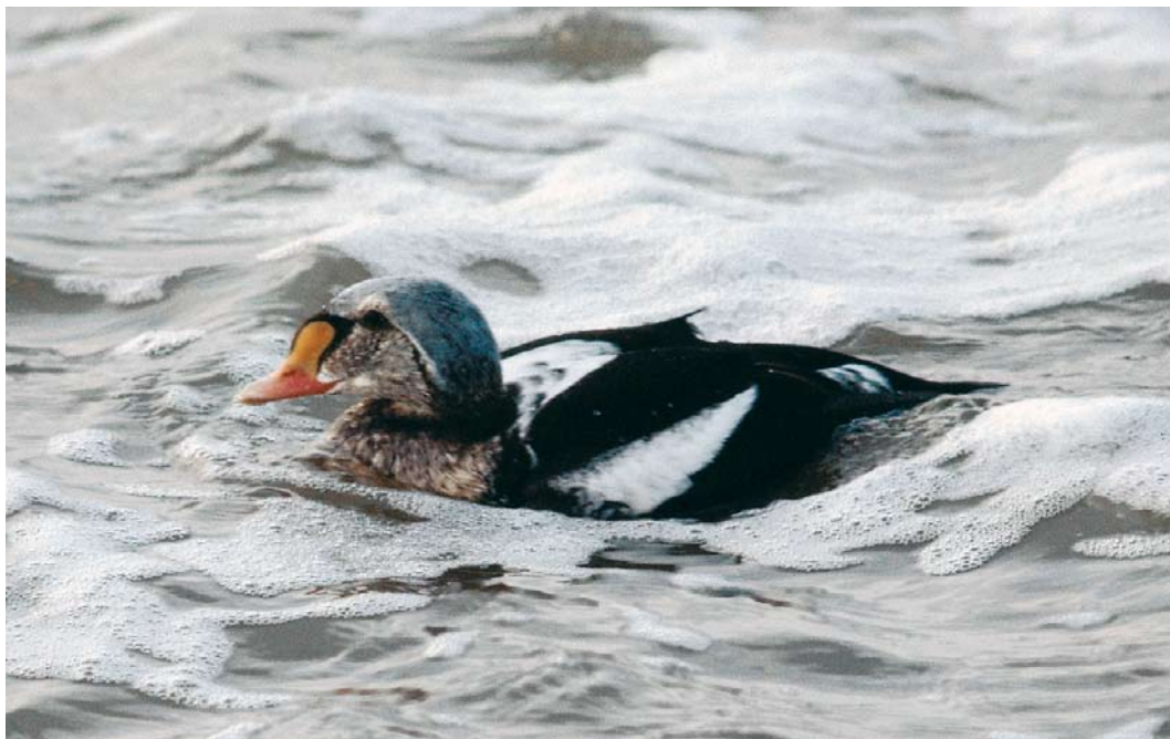
39 Koningseider / King Eider Somateria spectabilis , onvolwassen mannetje, Texel, Noord-Holland, 25 december 1981 (René Pop)