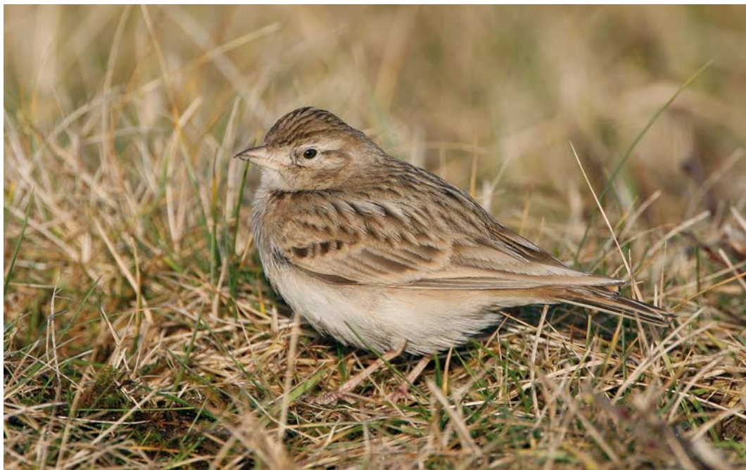
72 Kortteenleeuwerik / Greater Short-toed Lark Calandrella brachydactyla , Castricum, Noord-Holland, 6 januari 2008