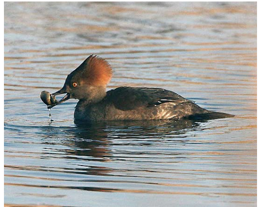
67 Middelste Jager / Pomarine Skua Stercorarius pomarinus , Katwijk, Zuid-Holland, 18 november 2007 68 Zeearend / White-tailed Eagle Haliaeetus albicilla , Harderwijk, Gelderland, 18 november 2007 69 Ringsnaveleend / Ring-necked Duck Aythya collaris , vrouwtje, Oost-Maarland, Limburg, 23 december 2007 70 Kokardezaagbek / Hooded Merganser Lophodytes cucullatus , Biddinghuizen, Flevoland, 14 december 2007

28 november overvliegend bij Holysloot, Noord-Holland. In Groningen werden Groenlandse Kolganzen A albirostris flavirostris gemeld op 9 december bij Garrelswaer en op 15 december (mogelijk dezelfde) bij het Schildmeer. Er werden ruim 40 Roodhalsganzen Branta ruficollis gemeld en daarentegen slechts negen 'losse' Witbuikrotganzen B hrota . Zwarte Rotganzen B nigricans verbleven de gehele periode op Wieringen, Noord-Holland (maximaal drie). Daarnaast werden er nog c 10 eenzame exemplaren opgemerkt. Het maximaal aantal Krooneenden Netta rufina op de bekende plas bij het Harderbos, Flevoland, bedroeg 440 op 1 december. De Grote Tafeleend Aythya valisineria was de gehele periode present bij Castricum, Noord-Holland. Er werden niet minder dan 16 Witoog-eenden A nyroca gezien, waaronder tweetallen begin november en begin december bij Windesheim, Overijssel, en op 11 december in de Hazenputten bij Sint-Oedenrode, Noord-Brabant. Op 16 december was een vrouwtje Ring-