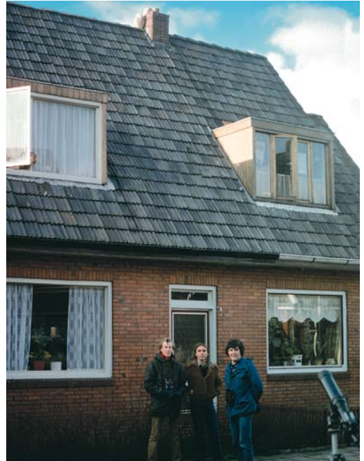
31 Sneeuwuil / Snowy Owl Bubo scandiacus , eerstejaars vrouwtje, Leeuwarden, Friesland, 10 januari 1980 (René Pop) 32 Leeuwarden, Friesland, 10 januari 1980 (Paul de Heer). Van links naar rechts / from left to right: Sneeuwuil / Snowy Owl Bubo scandiacus (boven / above), Han Blankert, René Pop en Edward van IJendoorn 33 Geelnavelduiker / Yellow-billed Loon Gavia adamsii , tweede-kalenderjaar, Kortenhoef, Noord-Holland, 3 augustus 1980 (René Pop)