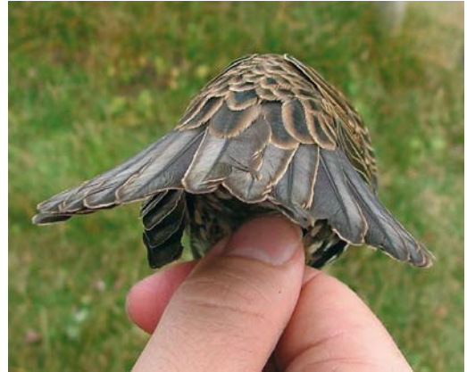
44 Mystery photograph II (November)

hardly visible. However, a rather strong carpal bar and especially a dark blackish bar on the secondaries is still visible. More important, the outermost primaries are rather black, whereas in Lesser Crested these flight-feathers are more greyish. The rather broad and relative short wings also fit Royal better than Lesser Crested.