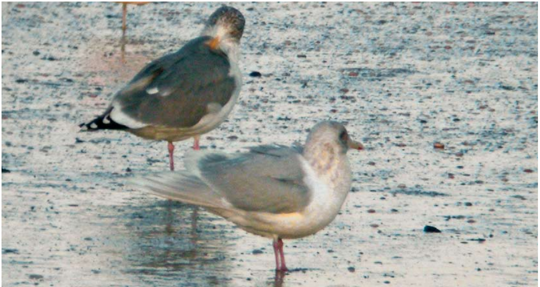
83 Kumliens Meeuw / Kumlien's Gull Larus glaucooides kumlieni , Nieuwpoort, West-Vlaanderen, 6 januari 2008