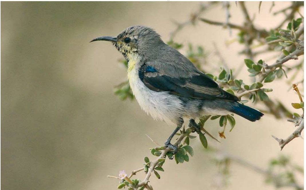
57 Purple Sunbird / Purperhoningzuiger Cinnyris asiaticus , Subiya, Kuwait, 10 January 2008