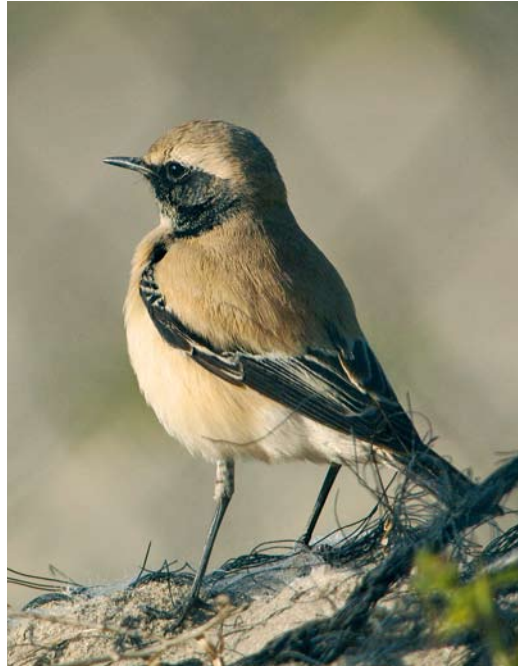
74 Grote Kruisbek / Parrot Crossbill Loxia pytyopsittacus , mannetje, Schoorl, Noord-Holland, 26 december 2007 (Marc Fasol) 75 Woestijntapuit / Desert Wheatear Oenanthe deserti , eerstejaars mannetje, Maasvlakte, Zuid-Holland, 12 november 2007 (Alexander Koenders) 76 Grote Kruisbek / Parrot Crossbill Loxia pytyopsittacus , mannetje, Oud-Leusden, Utrecht, 30 december 2007 (Harvey van Diek)