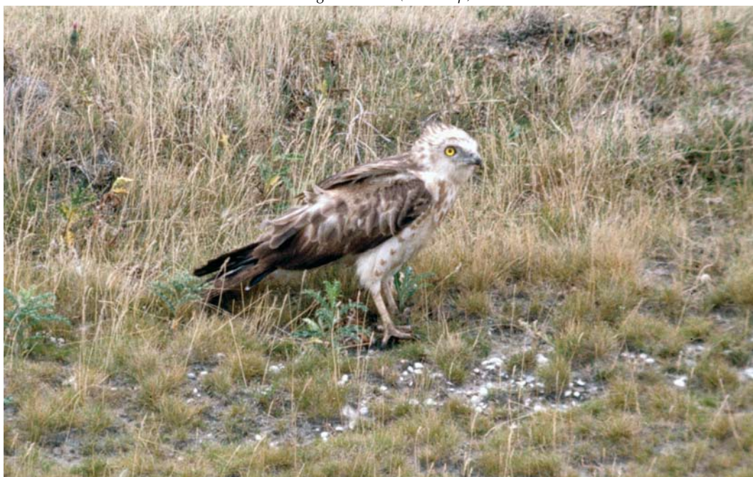
35 Slangenarend / Short-toed Snake Eagle Circaetus gallicus , Maasvlakte, Zuid-Holland, 9 augustus 1981