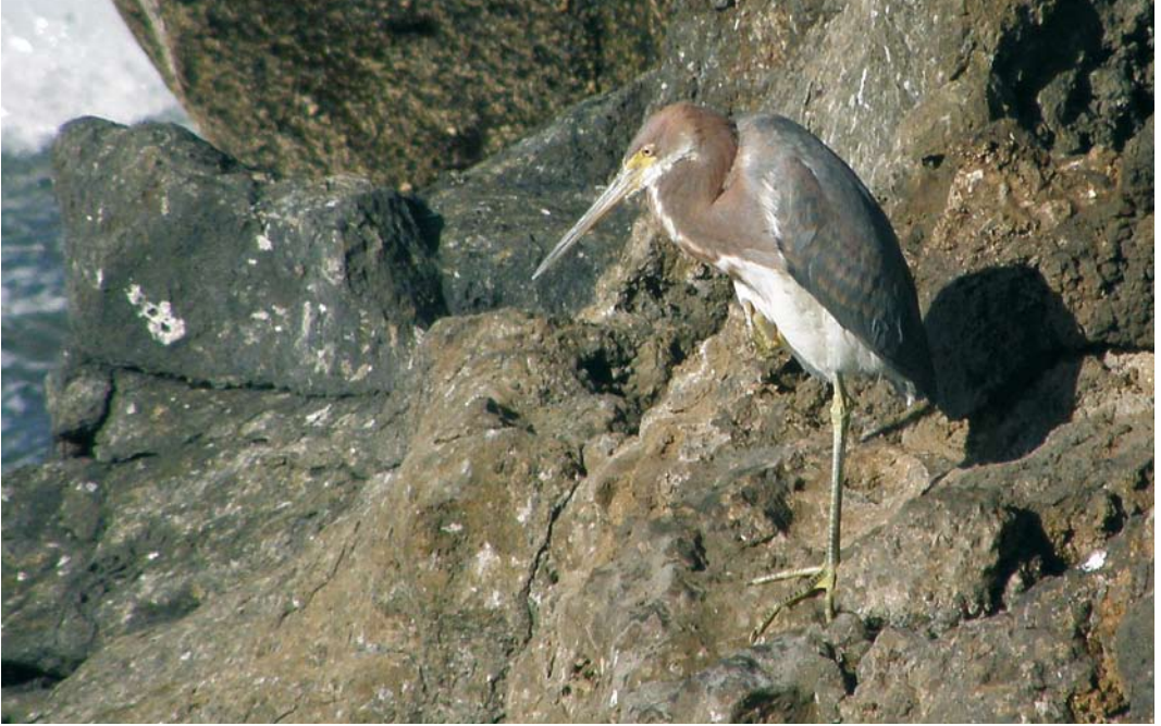
45-46 Tricolored Heron / Witbuikreiger Egretta tricolor , first-winter, Las Palmas, Gran Canaria, Canary Islands, 1 December 2007 (John & Doreen Cooper) 47 Great Blue Heron / Amerikaanse Blauwe Reiger Ardea herodias , first-winter, St Mary's, Scilly, England, 7 December 2007 (Martin Goodey)