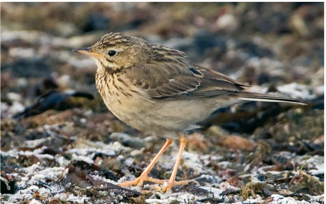
52 Blyth's Pipit / Mongoolse Pieper Anthus godlewskii , Apelviken, Halland, Sweden, 24 December 2007