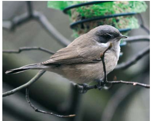
58 Cape Gull / Afrikaanse Kelpmeeuw Larus dominicanus vetula , adult, Iwik, Banc d'Arguin, Mauritania, 8 December 2007 (Jochen Dierschke) 59 Mauritanian Heron / Mauritaanse Blauwe Reiger Ardea cinerea monicae , Banc d'Arguin, Mauritania, 5 December 2007 (Jochen Dierschke) 60 Parrot Crossbills / Grote Kruisbekken Loxia pytyopsittacus , Asserbo, Sjælland, Denmark, 27 October 2007 (Helge Sørensen) 61 Little Curlew / Kleine Regenwulp Numenius minutus , Pivot fields, Kuwait, 15 December 2007 (Mike Pope) 62 Presumed Central Asian Lesser Whitethroat / vermoedelijke Vale Braamsluiper Sylvia curruca halimodendri , Velsbroek, Noord-Holland, Netherlands, 17 January 2008 (Arnoud B van den Berg)

Finland, on 5-11 January. If accepted, a first-winter on São Miguel on 16 January will be the first for the Azores. In Denmark, a third calendar-year female Black-throated Thrush T. atrogularis at Mølleparken, Nivå, Sjælland, from 7 November through January was considered to be the same individual last seen here on 12 April 2007. The 32nd and 33rd for Finland were first-years discovered at Mussalo, Kotka, on 2 December and at Lauttasaari on 6 December.