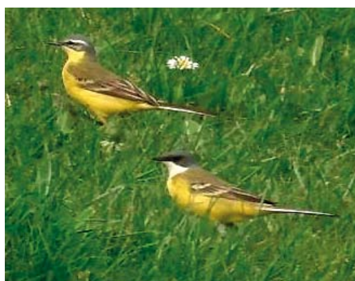
24 Italiaanse Kwikstaart / Ashy-headed Wagtail Motacilla cinereocapilla , mannetje, Flevocentrale, Flevoland, 22 april 2006 25-26 Italiaanse Kwikstaart / Ashy-headed Wagtail Motacilla cinereocapilla , mannetje, Flevocentrale, Flevoland, 22 april 2006 27 Italiaanse Kwikstaart / Ashy-headed Wagtail Motacilla cinereocapilla , mannetje (onder), met Gele Kwikstaart / Blue-headed Wagtail M flava , Flevocentrale, Flevoland, 22 april 2006

betref en nadat een aantal foto's was gemaakt werd de waarneming per semafoon doorgegeven als 'vrij zeker'. Toen de vogel enkele malen een raspande vluchtroep liet horen werd deze determinatie om c 13:30 in 'zeker' veranderd. Na enige tijd uit beeld te zijn geweest werd hij om c 15:30 teruggevonden door Edwin de Weerd en Peter van Wetter en de rest van de dag door enkele 10-tallen vogelaars bekeken. Ook deze vogel was de volgende dag verdwenen.