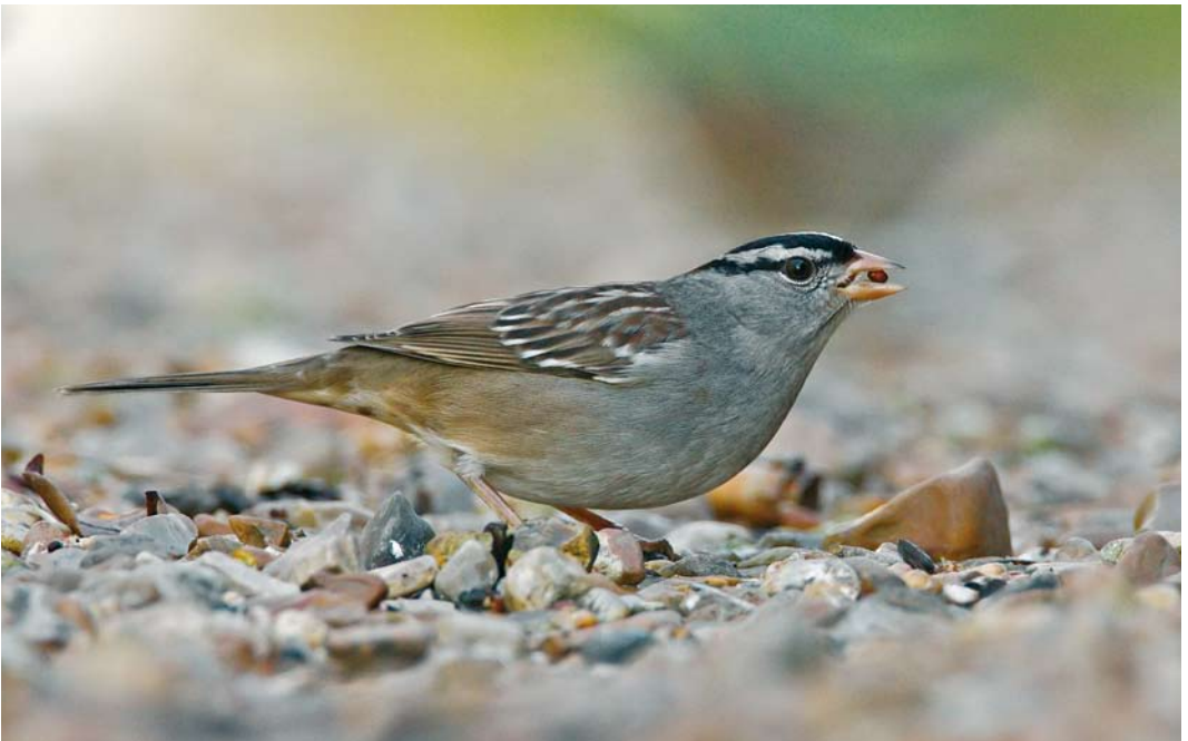
55 White-crowned Sparrow / Witkruingors Zonotrichia leucophrys , Cley, Norfolk, England, 22 January 2008