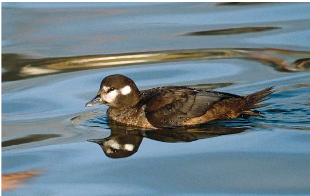
40 Harlekijneend / Harlequin Duck Histrionicus histrionicus , vrouwtje, IJmuiden, Noord-Holland, 29 december 1982