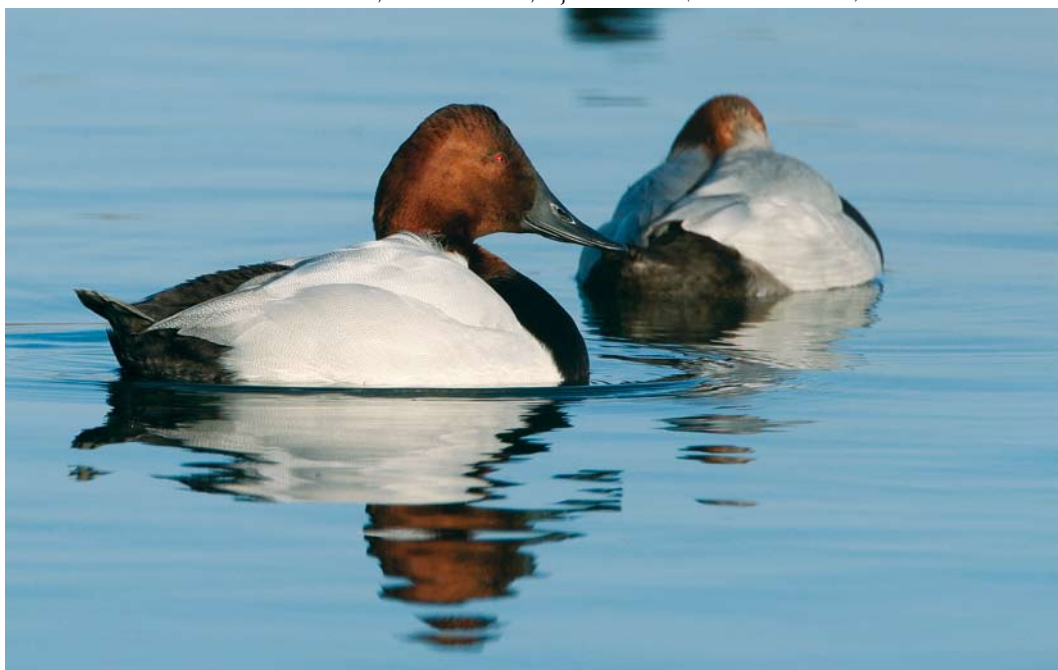
64 Grote Tafeleend / Canvasback Aythya valisineria , adult mannetje, met Tafeleend / Common Pochard A ferina , Castricum aan Zee, Noord-Holland, 6 januari 2008