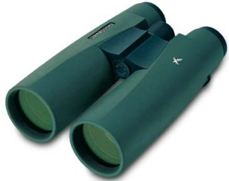
Swarovski SLC 15x56 binoculars