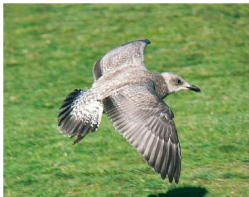
2-3 Presumed Herring Gull / vermoedelijke Zilvermeeuw Larus argentatus , first-summer, IJmuiden, Noord-Holland, Netherlands, 17 July 2006 (Leon Edelaar). Tail pattern, with very broad dark tail-band and dense vermiculations on outer tail-feathers matching that of some first-year Smithsonian Gulls L. smithsonianus . In addition, dark bars on uppertail-coverts and rump fairly broad. Undertail-coverts and vent densely marked as well, pattern reaching brownish belly. Note, however, rather pale belly and flanks, with obvious brown spotting, which differ from typical smithsonianus . This bird had smallish head and short, all-dark bill. 4-5 Presumed Herring Gull / vermoedelijke Zilvermeeuw Larus argentatus , juvenile, Vlieland, Friesland, Netherlands, 3 October 2006 (Leon Edelaar). Uniformly dark hindneck and underparts of this bird perfectly matching Smithsonian Gull L. smithsonianus but pattern on tail and uppertail-coverts is that of average Herring Gull.

band across greater coverts, reduced window on inner primaries, dark underwing-coverts, and scapular pattern. These supportive characters are not further discussed here and have been well treated by Lonergan & Mullarney (2004) and Olsen & Larsson (2005).