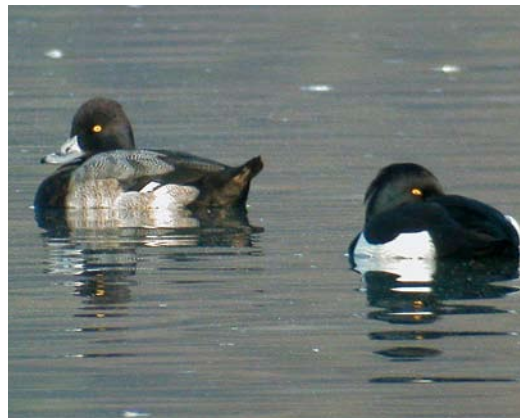
79 Kleine Topper / Lesser Scaup Aythya affinis , mannetje (links), Harelbeke, West-Vlaanderen, 12 december 2007 (Koen Verbanck)

RALLETOT ALKEN Een late Kwartelkoning Crex crex werd op 4 november opgestoten bij Bredene, West-Vlaanderen. Tussen 4 en 6 november passeerde over Wallonië een trek golf van meer dan 600 Kraanvogels Grus grus en over Vlaanderen van meer dan 500. Tussen 13 en 23 november werden er in heel België nog eens meer dan 520 opgemerkt. Wallonië verwerkte tussen 15 en 18 december een tweede (grotere) golf van c. 1170 vogels en op 29 de-