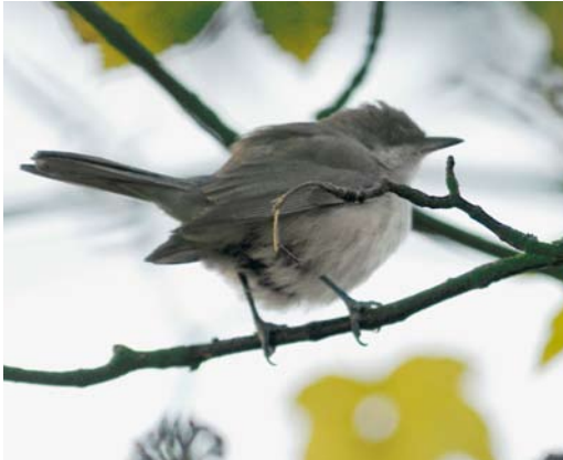
29 Westelijke Orpheusgrasmus / Western Orphean Warbler Sylvia hortensis , Middelburg, Zeeland, 30 oktober 2003