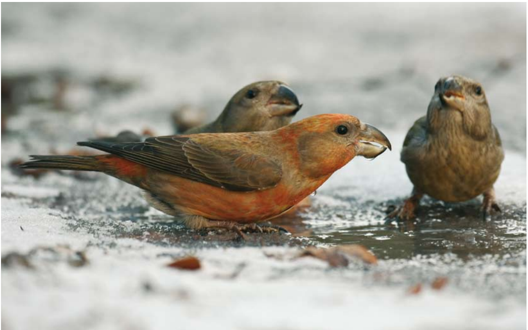
80 Grote Kruisbekken / Parrot Crossbills Loxia pytyopsittacus , Schoorl, Noord-Holland, 4 januari 2008

De eerste meldingen in het najaar van 2007 kwamen vanaf 5 oktober met verschillende overvliegende exemplaren op diverse plaatsen. In enkele gevallen kon de