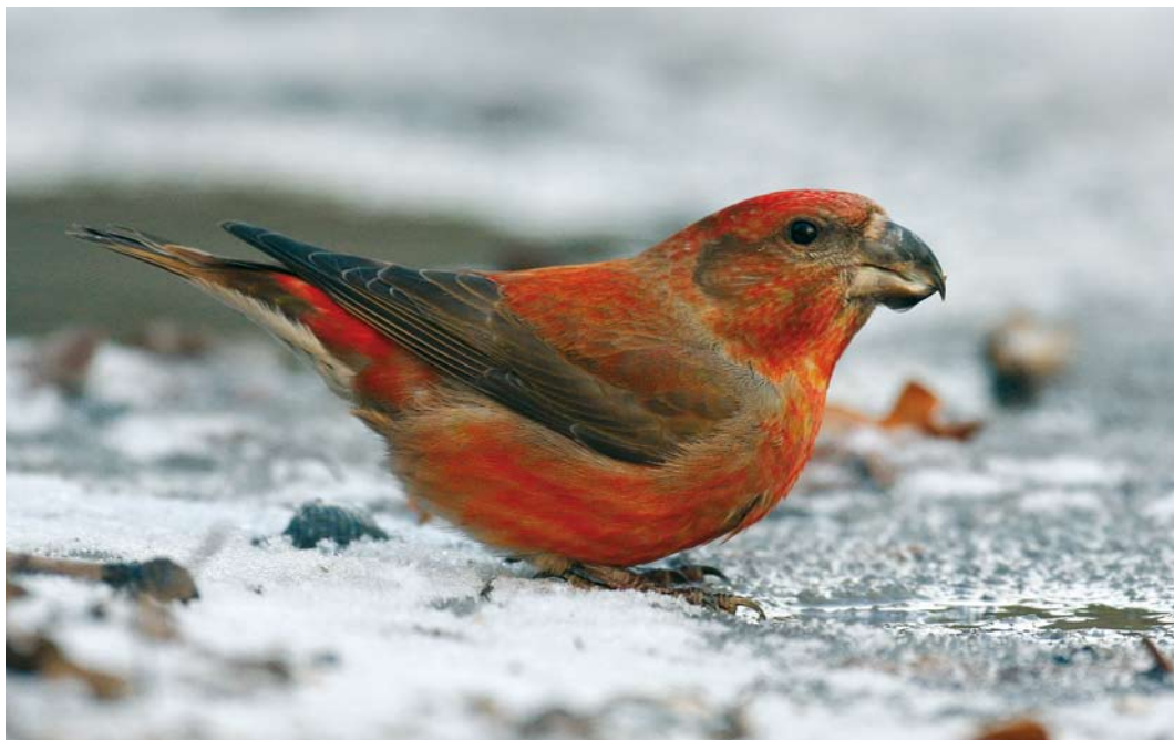
81 Grote Kruisbek / Parrot Crossbill Loxia pytyopsittacus , mannetje, Schoorl, Noord-Holland, 4 januari 2008