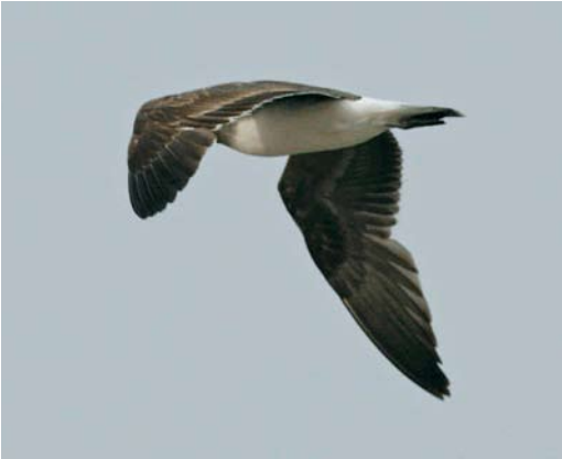
43 Mystery photograph I (May)