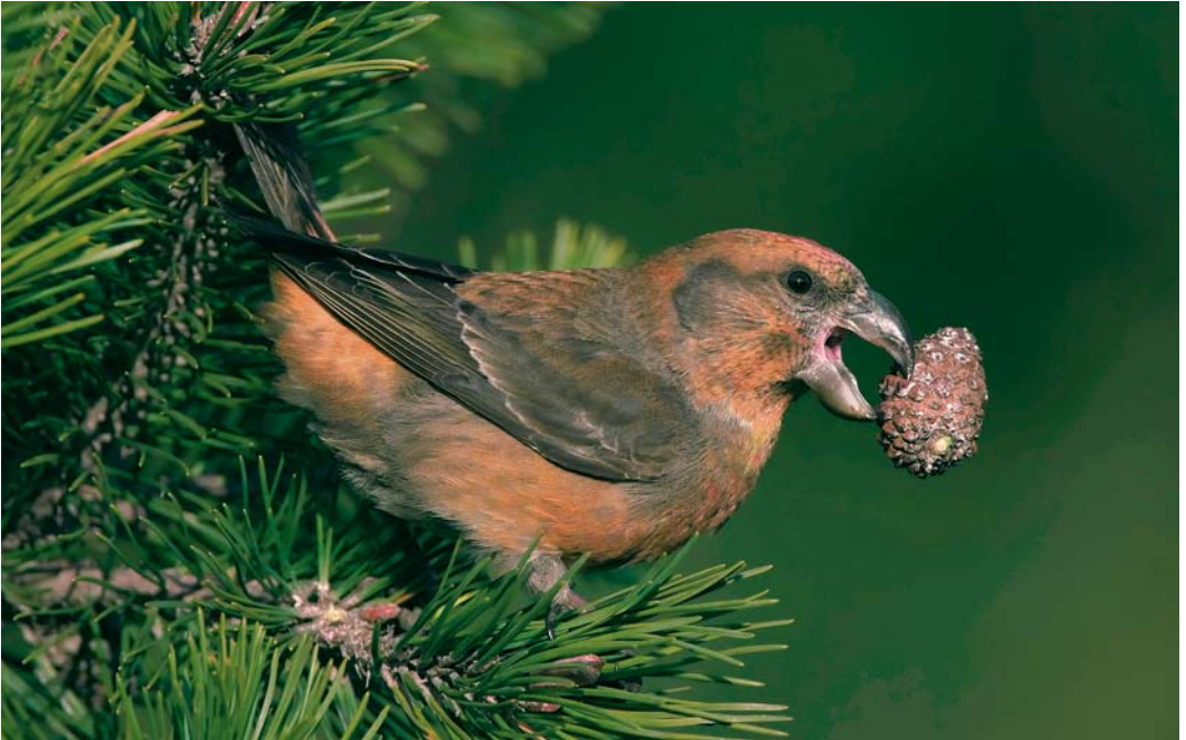
54 Parrot Crossbill / Grote Kruisbek Loxia pytyopsittacus , male, Asserbo, Sjælland, Denmark, 24 November 2007 (Lars Halkjær)