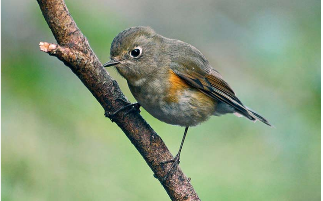
56 Red-flanked Bluetail / Blauwstaart Tarsiger cyanurus , Ouessant, Finistère, France, 17 November 2007