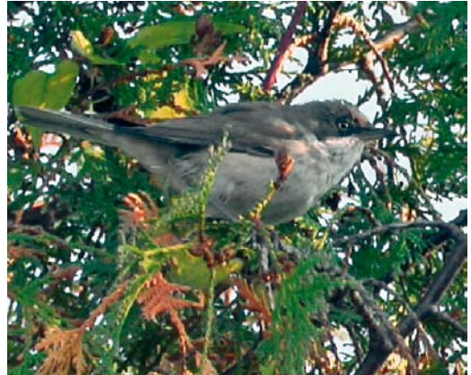
30 Westelijke Orpheusgrasmus / Western Orphean Warbler Sylvia hortensis , Middelburg, Zeeland, oktober 2003

slapen waardoor hij de volgende dag vrij snel werd teruggevonden. Met uitzondering van zondag 2 november, toen het slechte weer en de slechte toegankelijkheid van de bedrijvenavels de waarnemers parten speelden, werd hij tot en met 5 november dagelijks en door vele waarnemers gezien (Wolf 2003).