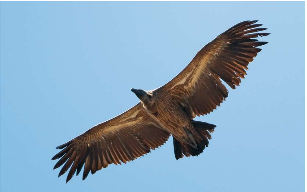
484 African White-backed Vulture / Afrikaanse Witrugulier Gyps africanus , second calendar-year, Tarifa, Cádiz, Spain, 7 September 2008 cf Dutch Birding 30: 347, 2008