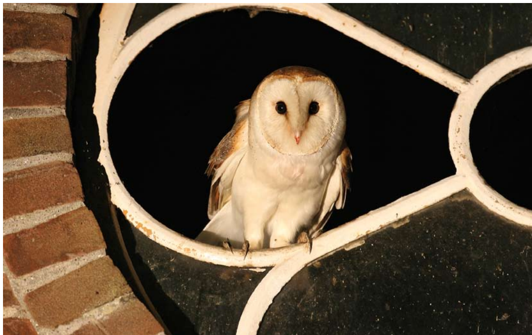
457 Pale Barn Owl / Witte Kerkuil Tyto alba alba , Zuid-Holland, 11 July 2007

partly because of uncertainties about its status. For instance, de Jong (1995) suggests that 'intermediates' between this taxon and Dark Barn Owl T. a. guttata occur regularly in the southern Netherlands. The only Pale Barn Owl mentioned by van den Berg & Bosman (2001) concerns a photographed bird ringed south-west of Ommen, Overijssel, on 22 January 1976 and found dead as road victim at Varades, Loire-Atlantique, France, on 22 April 1976 (Limosa 54: 97-98, 1981). This record has not been formally considered by the CDNA and will be reviewed. As a consequence, it seems possible that the 1983 specimen will turn out to be the first record of this subspecies; it was found while studying the differences with Dark Barn Owl and was wrongly labelled as the latter. Information about the location of the individual photographed in 2007 is withheld at the request of the observers.