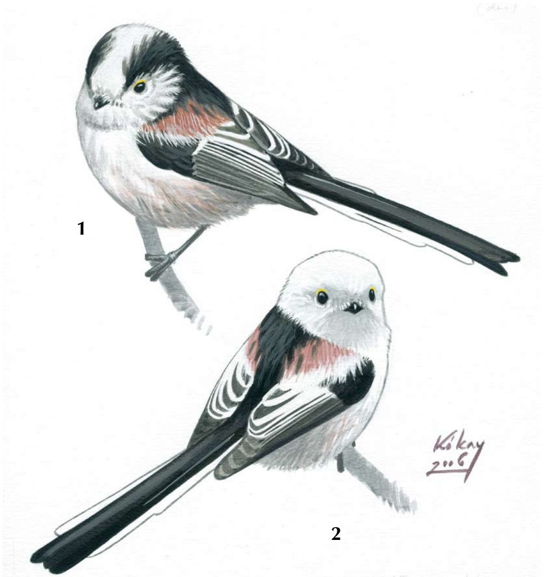
FIGURE 1 Long-tailed Bushtits / Staartmezen Aegithalos caudatus (Szabolcs Kókey). 1 europaeus , 2 caudatus . Both birds closely matching description of type specimens of both subspecies.