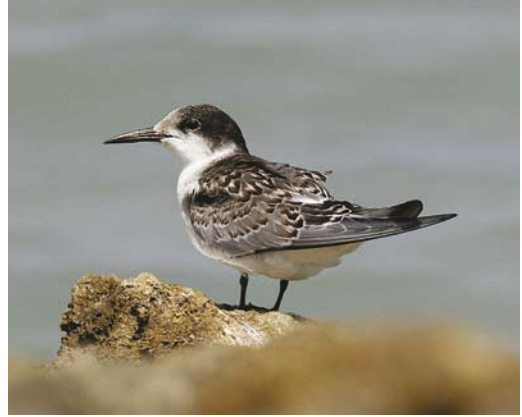
402 White-cheeked Tern / Arabische Stern Sterna repressa , Red Sea, Egypt, 9 October 2007. Note dark overall impression, boldly marked tertials and absence of white trailing edge across primary inner webs.

The white trailing-edge to the wing easily excludes the marsh terns Chlidonias , of which Whiskered Tern C hybrida was mentioned by 4% of the entrants. Juveniles of several species show tertials and median wing-coverts as heavily and boldly marked as the mystery bird. These include Little Sternula albifrons (not mentioned as solution), Sandwich Sterna sandvicensis (16%), White-cheeked S repressa (24%) and Roseate Tern S dougalli (4%). Although many other tern species show dark tertials, these are generally differently patterned, showing only a dark centre and a pale fringe, unlike the mystery bird. Another striking feature of the mystery bird, the dark central rump, can be found to some extent on quite a number of species, including Aleutian Onychoprion