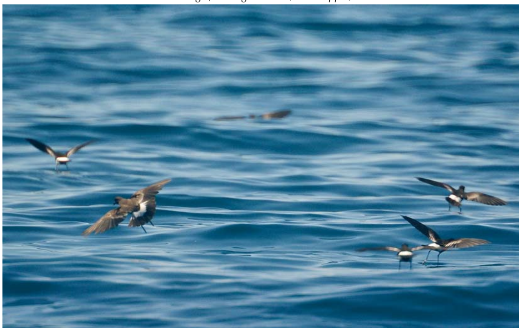
407 Wilson's Storm Petrels / Wilsons Stormvogeltjes Oceanites oceanicus , part of flock of 100, off Portimão, Portugal, 25 August 2008 (Tobias Epple)