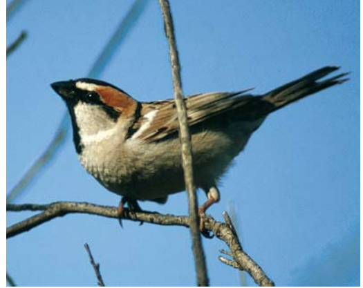
385-386 Saxaul Sparrow / Saxaulmus Passer ammodendri, male, near Sarakhs, Khorassan, Iran, 27 April 2004