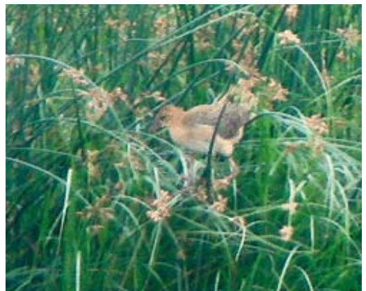
413-414 Lesser Frigatebird / Kleine Fregatvogel Fregata ariel , Zour port, Kuwait, 10 April 2008 cf Dutch Birding 30: 188, 2008 415 Balearic Shearwater / Vale Pijlstormvogel Puffinus mauretanicus , North Sea off Schleswig-Holstein, Germany, 16 August 2008 416 Bridled Tern / Brilstern Onychoprion anaethetus , adult, Nachlieli islet, western Galilee, Israel, 20 August 2008 417 Allen's Gallinule / Afrikaans Purperhoen Porphyrio alleni , Aiguamolls de l'Empordà, Catalunya, Spain, 13 August 2008 418 Allen's Gallinule / Afrikaans Purperhoen Porphyrio alleni , Aiguamolls de l'Empordà, Catalunya, Spain, August 2008