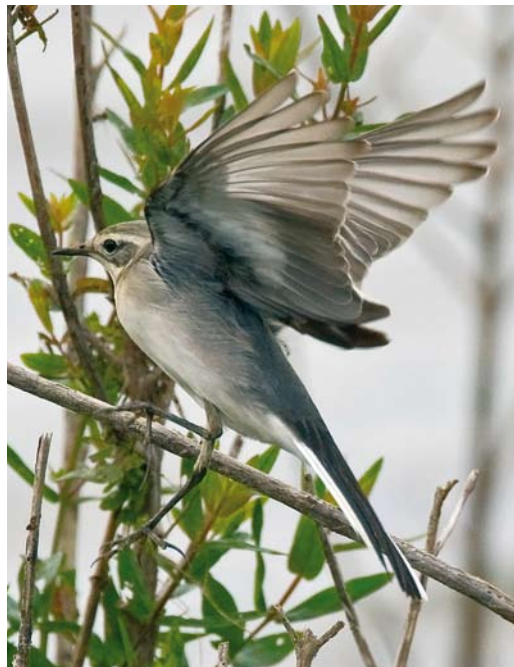
443 Graszanger / Zitting Cisticola juncidis , Beugen, Noord-Brabant, 9 september 2008 (Harvey van Diek) 444 Citroenkwikstaart / Citrine Wagtail Motacilla citreola , eerstejaars, Ooijpolder, Ubbergen, Gelderland, 25 augustus 2008 (Harvey van Diek) 445 Citroenkwikstaart / Citrine Wagtail Motacilla citreola , eerstejaars, Ooijpolder, Ubbergen, Gelderland, 25 augustus 2008 (Michel Veldt)