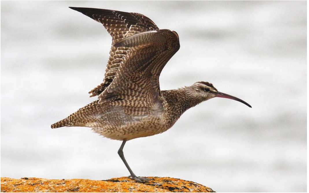
425 Hudsonian Whimbrel / Amerikaanse Regenwulp Numenius hudsonicus , Halangy Point, St Mary's, Scilly, England, 15 September 2008 426 Audouin's Gull / Audouins Meeuw Larus audouinii , Wolla Bank, Lincolnshire, England, 19 August 2008 427 Goliath Heron / Reuzenreiger Ardea goliath , Wadi Lahami, Egypt, 30 July 2008