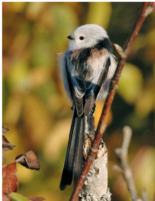
363 White-headed Long-tailed Bushtit / Witkopstaartmees Aegithalos caudatus caudatus , adult, Hanko, Hailias, Finland, 1 October 2004. Note dark tertials.