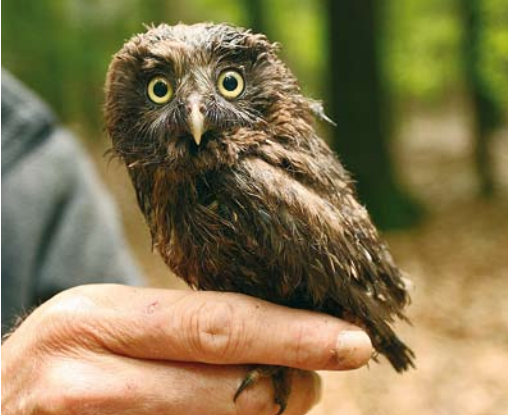
382 Ruigpootuil / Boreal Owl Aegolius funereus , juveniel, Schoonloo, Drenthe, 9 juli 2008 (Aaldrik Pot). Eén van de jongen van nest 2 tijdens ringen.

een gevolg van areaaluitbreiding en de aanwezigheid van ouder wordende bossen die zich ontwikkelen tot een stabiel en gevarieerd bosecosysteem.