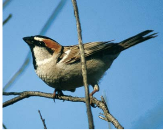
385-386 Saxaul Sparrow / Saxaulmus Passer ammodendri, male, near Sarakhs, Khorassan, Iran, 27 April 2004