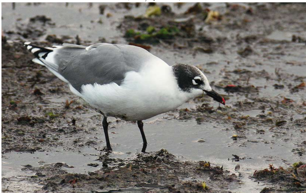
409 Franklin's Gull / Franklins Meeuw Larus pipixcan , Saint-Guénolé, Finistère, France, 31 August 2008