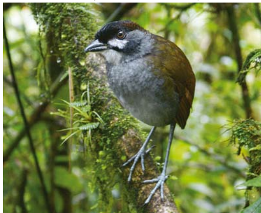
387 Jocotoco Antpitta / Jocotocomierpitta Grallaria ridgelyi , Reserva Tapichalaca, Ecuador, 13 December 2007 (Dušan M Brinkhuizen)

Until recently, it was very exceptional to see – not to mention photograph – Jocotoco Antpittas. Twitchers occasionally watched them by using tape playback but the birds' responses seemed to wane by time as in other antpittas. All this changed thanks to Angel Paz, a local farm-