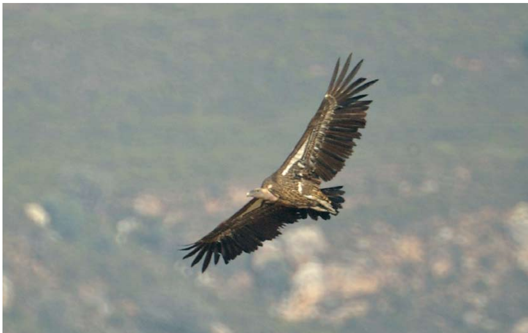
408 Rüppell's Vulture / Ruppells Gier Gyps rueppellii , Tarifa, Spain, 28 August 2008