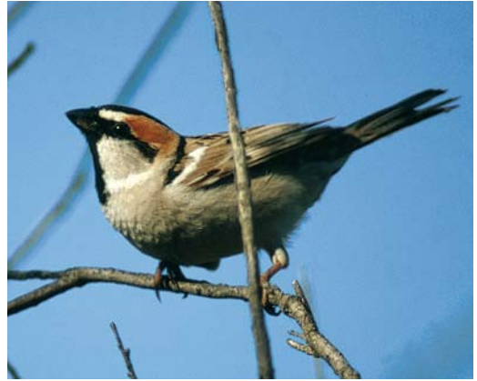
385-386 Saxaul Sparrow / Saxaulmus Passer ammodendri , male, near Sarakhs, Khorassan, Iran, 27 April 2004

misus, northwest Afghanistan...'. All the cited information on the distribution of Saxaul Sparrow seems to go back to Zarudnyi's record. However, Zarudnyi (1911) actually did not give any details of this record. Zarudnyi & Haerms (1913) specify that the species was found near Pesh-Robat in the Harirud valley on 3 November 1900 (16 November according to modern calendar). Pesh-Robat is located in the Harirud valley at 34°50' N, 61°03' E (Roselaar & Aliabadian 2007, Kees Roselaar in litt). The bird recorded by Zarudnyi could have been a straggler, as according to Dementiev & Gladkov (1954) the species 'performs local roamings' in winter.