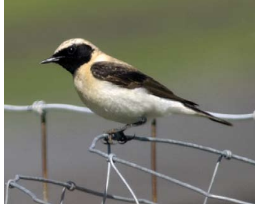
400 Oostelijke Blonde Tapuit / Eastern Black-eared Wheatear Oenanthe melanoleuca , eerste-zomer mannetje, Texel, Noord-Holland, 4 mei 2003