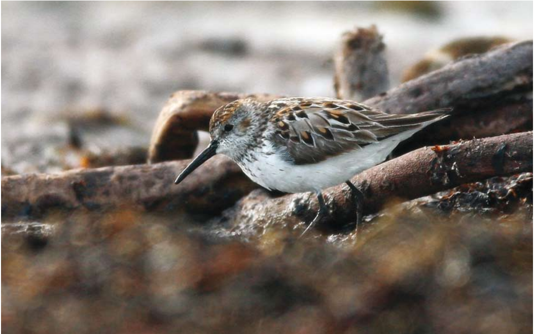
411 Western Sandpiper / Alaskastrandloper Calidris mauri , adult, Klepp, Rogaland, Norway, 13 July 2008 cf Dutch Birding 30: 263, 2008