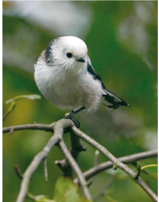
376-377 Central European Long-tailed Bushtit / Staartmees Aegithalos caudatus europaeus , adult, Engbertsdijksvenen, Overijssel, Netherlands, 6 September 2006. Intermediate bird. Note brownish wash on neck, indicating europaeus , but clear whitish underparts more indicative of nominate caudatus . 378 Central European Long-tailed Bushtit / Staartmees Aegithalos caudatus europaeus , adult, Vierlingsbeek, Noord-Brabant, Netherlands, 29 March 2008. Intermediate bird. Note whitish tertials and strong dark eye-stripe.