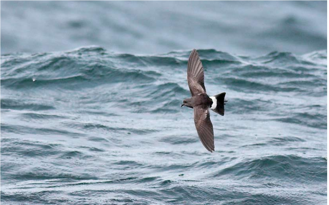
406 Wilson's Storm Petrel / Wilsons Stormvogeltje Oceanites oceanicus , 8 km south-west of Inishbofin, Galway, Ireland, 24 August 2008