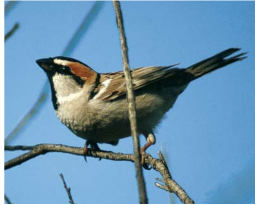
385-386 Saxaul Sparrow / Saxaulmus Passer ammodendri, male, near Sarakhs, Khorassan, Iran, 27 April 2004