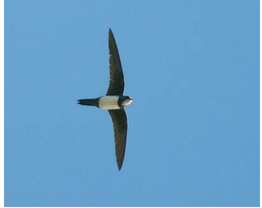
448 Alpengierzwaluw / Alpine Swift Apus melba , Zeebrugge, West-Vlaanderen, 9 mei 2008 (Johan Buckens) cf Dutch Birding 30: 288, 2008