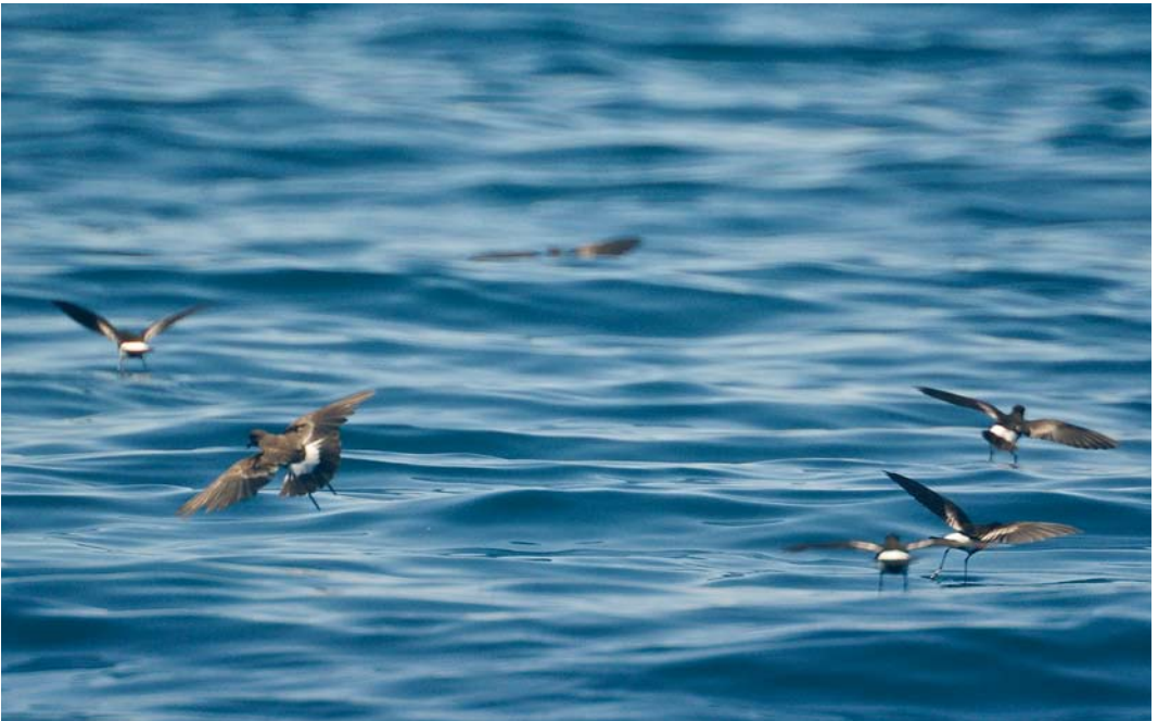
407 Wilson's Storm Petrels / Wilsons Stormvogeltjes Oceanites oceanicus , part of flock of 100, off Portimão, Portugal, 25 August 2008 ( Tobias Epple )