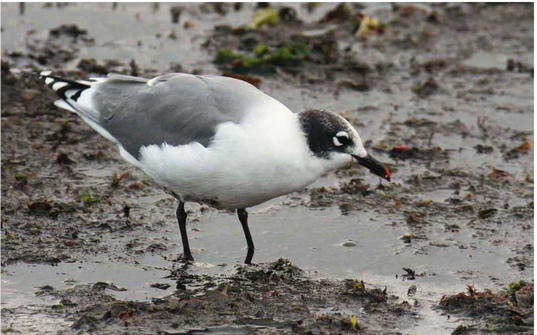
409 Franklin's Gull / Franklins Meeuw Larus pipixcan , Saint-Guénolé, Finistère, France, 31 August 2008 (Thierry Queennec)