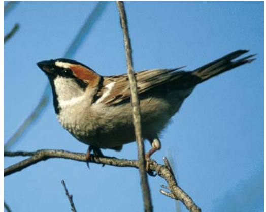
385-386 Saxaul Sparrow / Saxaulmus Passer ammodendri, male, near Sarakhs, Khorassan, Iran, 27 April 2004