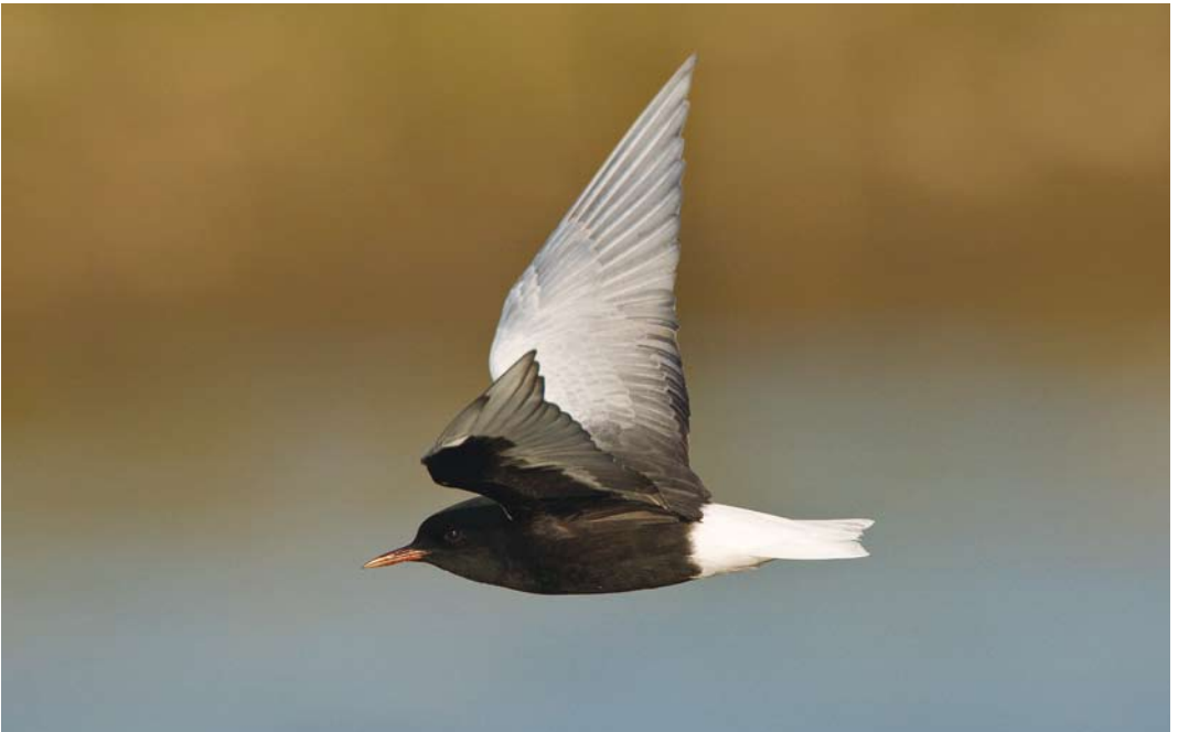
354 Witvleugelstern / White-winged Tern Chlidonias leucopterus , Bichterweerd, Limburg, 11 mei 2008