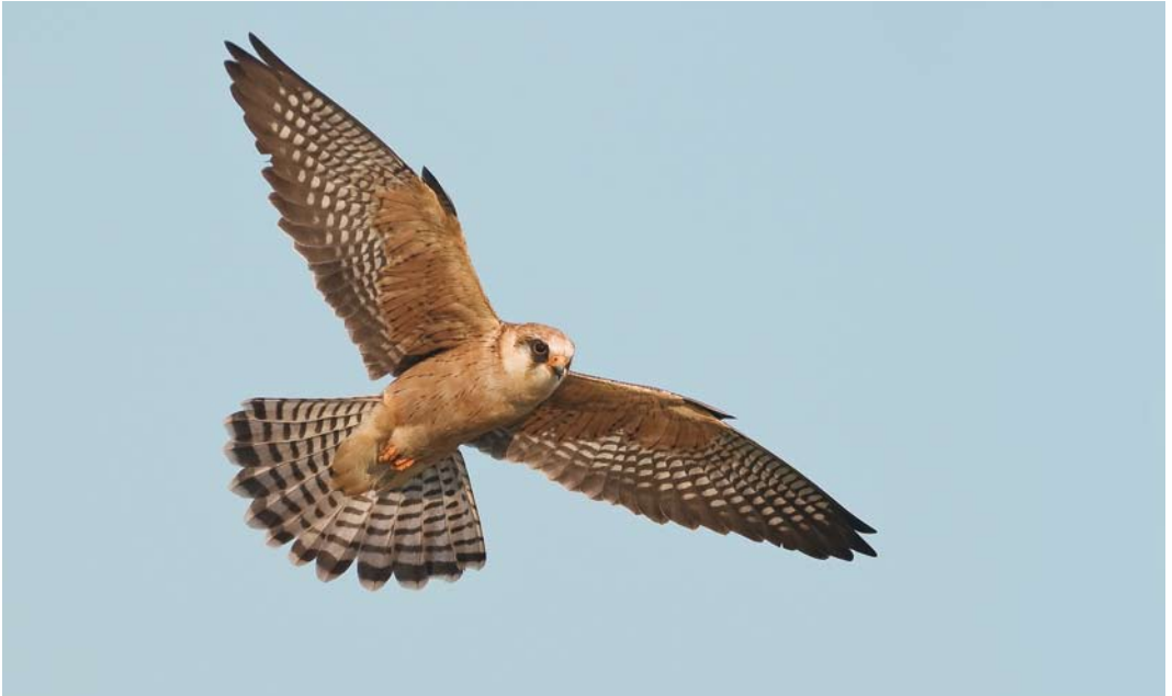
277 Roodpootvalk / Red-footed Falcon Falco vespertinus , adult vrouwtje, Fochteloërveen, Friesland, 15 mei 2008 ( Rein Hofman ). Sommige adulte vrouwtjes vertonen lengtestrepen op ondervleugeldekveren / Some adult females show longitudinal streaks on underwing-coverts. 278 Roodpootvalk / Red-footed Falcon Falco vespertinus , tweedekalenderjaar vrouwtje, Fochteloërveen, Friesland, 13 mei 2008 ( Roef Mulder ). Alle ondervleugeldekveren juveniel met bruine bandering / Second calendar-year female. All underwing-coverts juvenile, with brown barring. 279 Roodpootvalk / Red-footed Falcon Falco vespertinus , adult vrouwtje, Fochteloërveen, Friesland, 19 mei 2008 ( Rein Hofman ). Bruingrijze slagpennen en contrastrijk gebandeerde tertials en bovendelen wijzen op adulte vogel / Adult female. Brown-grey remiges and contrastingly barred tertials and upperparts indicative of adult female.