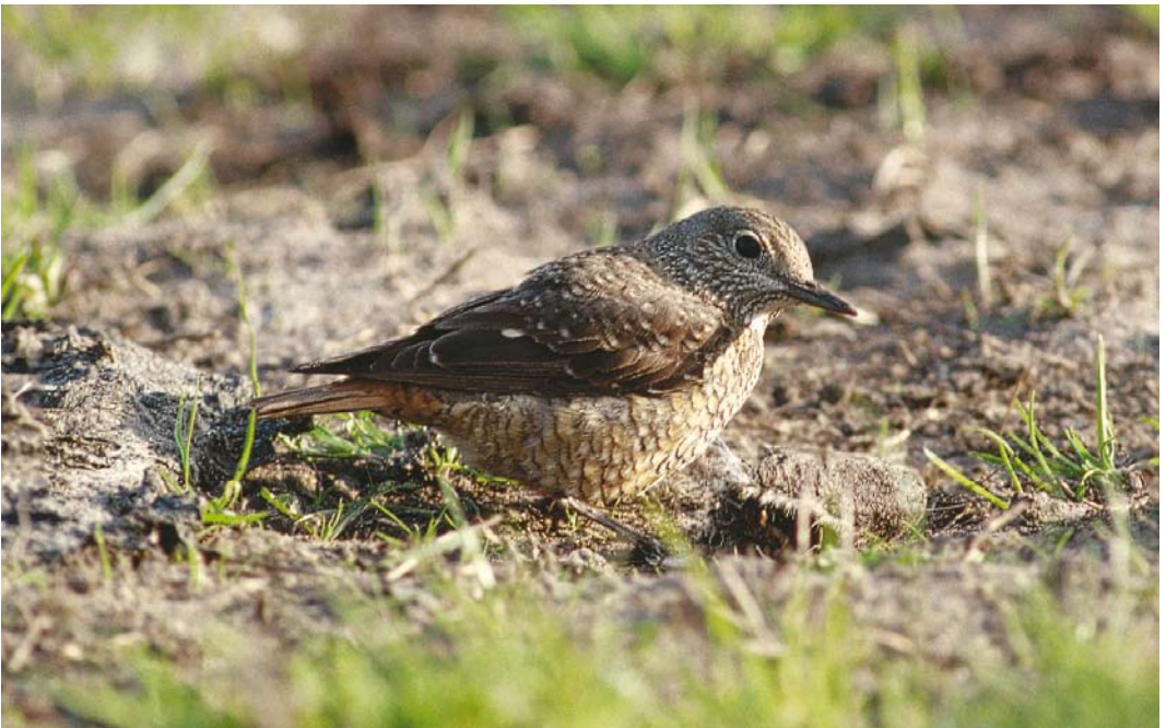
293 Rode Rotslijster / Rufous-tailed Rock Thrush Monticola saxatilis , vrouwtje, Noordburen, Wieringen, Noord-Holland, 13 mei 1994 (René van Rossum)