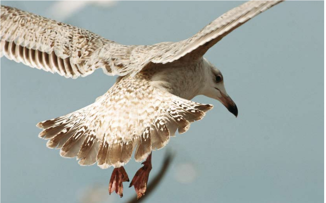
261-262 Hybride Grote Burgemeester x Grote Mantelmeeuw / hybrid Glaucous x Great Black-backed Gull Larus hyperboreus x marinus , eerste-winter, St John's, Newfoundland, Canada, 12 maart 2006