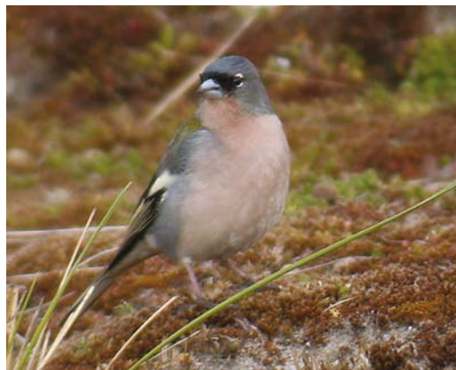
250-251 Atlasvink / Atlas Chaffinch Fringilla coelebs africana , mannetje, Maasvlakte, Zuid-Holland, 5 april 2003 (Diederik Kok)

merken die bij de (niet uitvoerig bekeken en niet gefotografeerde) vogel van de Eemshaven werden waargenomen, zoals de groene mantel, weinig contrastrijke kop-tekening en lichte grijze onderdelen, duiden ook op 'Afrikaanse Vink'. Het overwegend bruingrijze verenkleed wijst op een vrouwtje. De mantelkleur van een vrouwtje is grijs met een groene tint (een kenmerk wat in de literatuur vaak alleen voor mannetjes wordt genoemd); bestudering van foto's uit het broedgebied door AvdB en MJ gaf aan dat deze groene tint bij sommige vrouwtjes vrij uitgesproken kan zijn (cf plaat 252). De vogel is aanvaard als vrouwtje (cf van der Vliet et al 2007, Nils van Duivendijk in litt).