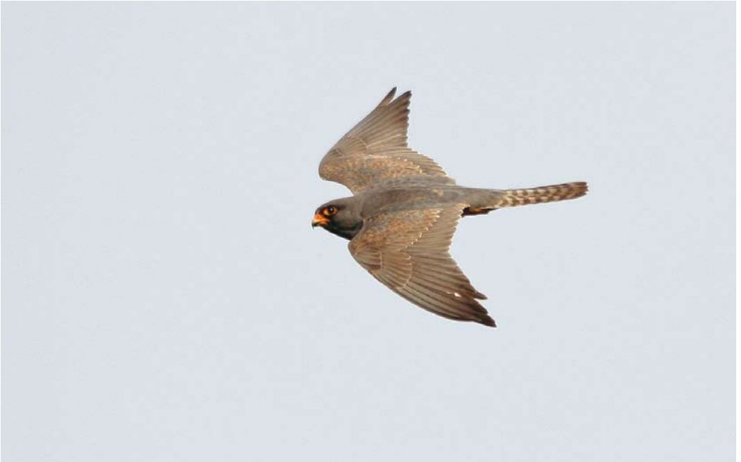
353 Roodpootvalk / Red-footed Falcon Falco vespertinus , tweede-kalenderjaar mannetje, Kalmthout, Antwerpen, 26 mei 2008 (Johan Buckens)