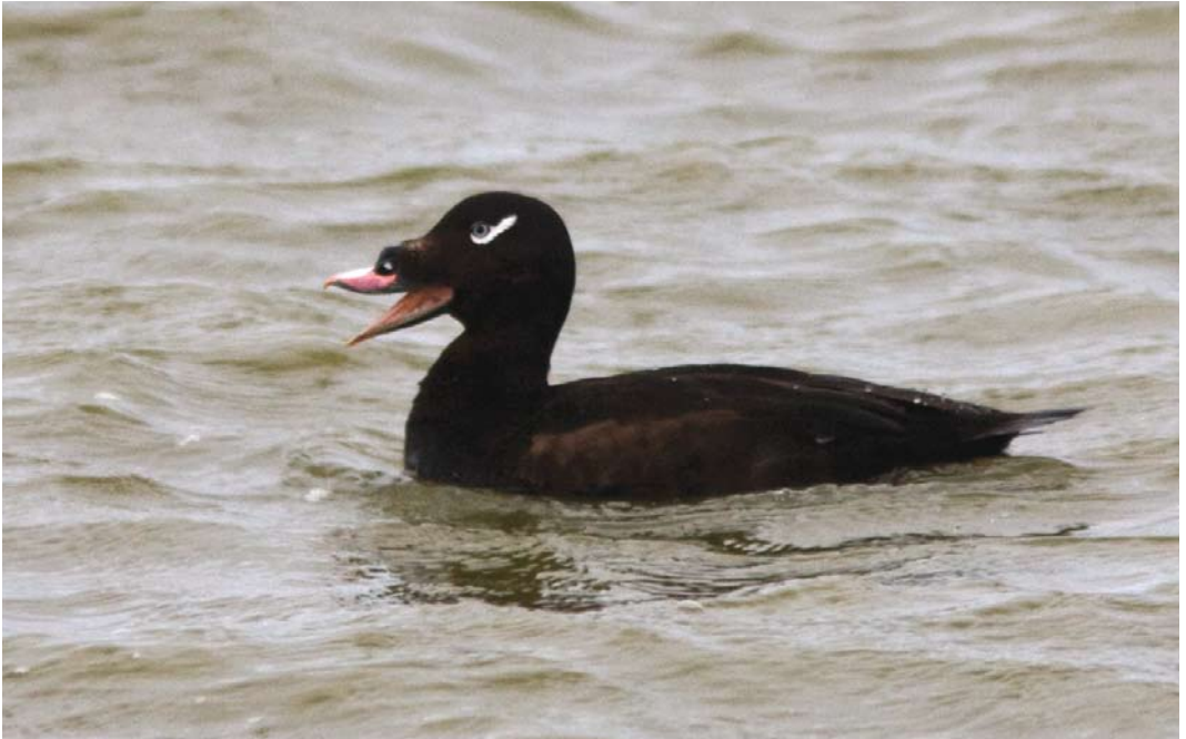
308 American White-winged Scoter / Amerikaanse Grote Zee-eend Melanitta deglandi deglandi , adult male, Bakkatjörn, Seltjarnarnes, Iceland, 12 June 2008 (Yann Kolbeinsson)