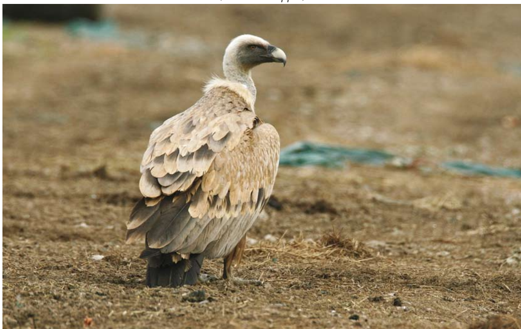
330 Vale Gier / Griffon Vulture Gyps fulvus , Kats, Zeeland, 29 mei 2008