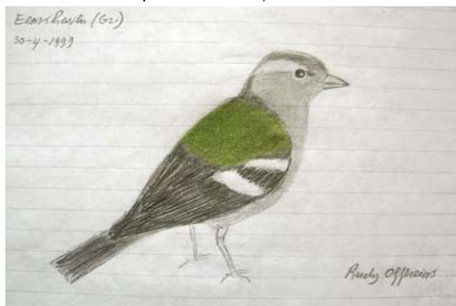
FIGUUR 1 Atlasvink / Atlas Chaffinch Fringilla coelebs africana , vrouwtje, Eemshaven, Groningen, 30 april 1999 (Rudy Offereins)

GROOTTE & BOUW Formaat en structuur als Vink (geen van waarnemers noteerde verschil).