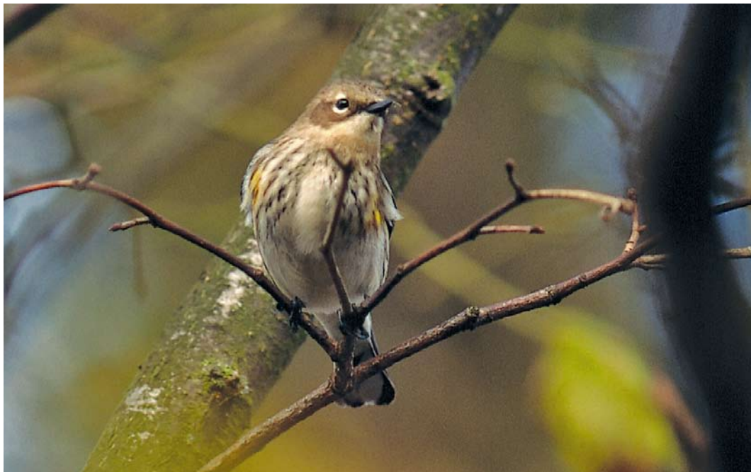
297 Mirtezanger / Myrtle Warbler Dendroica coronata , Oost-Vlieland, Vlieland, Friesland, 14 oktober 1996