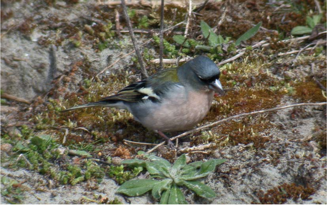
248-249 Atlasvink / Atlas Chaffinch Fringilla coelebs africana , mannetje, Maasvlakte, Zuid-Holland, 5 april 2003 (Diederik Kok)