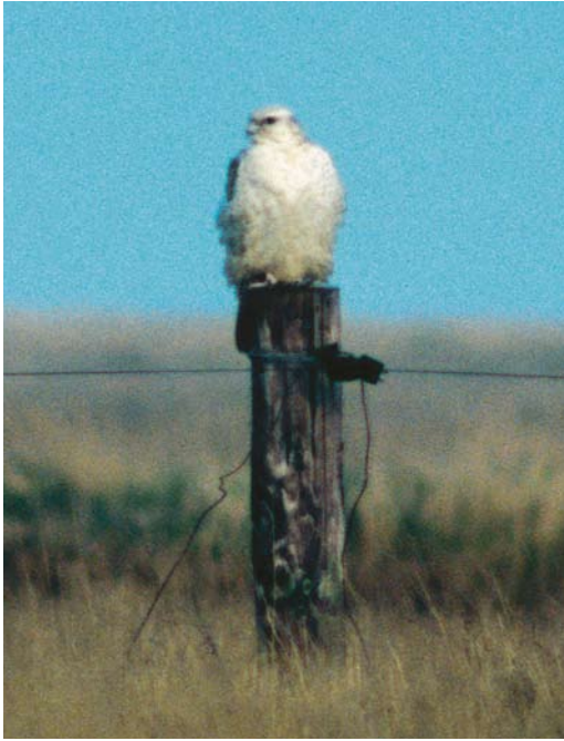
303 Giervalk / Gyrfalcon Falco rusticolus , Kobbe- duinen, Schiermonnikoog, Friesland, 27 maart 1998 (Arnoud B van den Berg)

Op 5 december vloog een aanvaardbare Grote Pijlstormvogel langs Camperduin. Het jaar eindigde met een twitchbare Hutchins' Canadese Gans op de Korendijkse Slikken, Zuid-Holland.