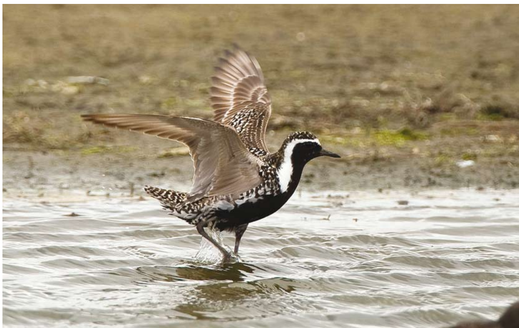
334 Aziatische Goudplevier / Pacific Golden Plover Pluvialis fulva , Ezumakeeg, Friesland, 29 juni 2008 (Toy Janssen)