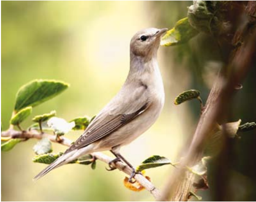
304 Garden Warbler / Tuinfluitier Sylvia borin , Hurghada, Egypt, 10 May 2007