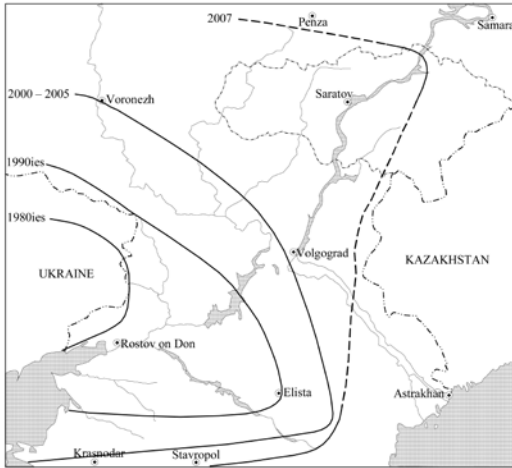
FIGURE 1 Range expansion of Syrian Woodpecker Dendrocopos syriacus in eastern Ukraine and European Russia in 1980-2007