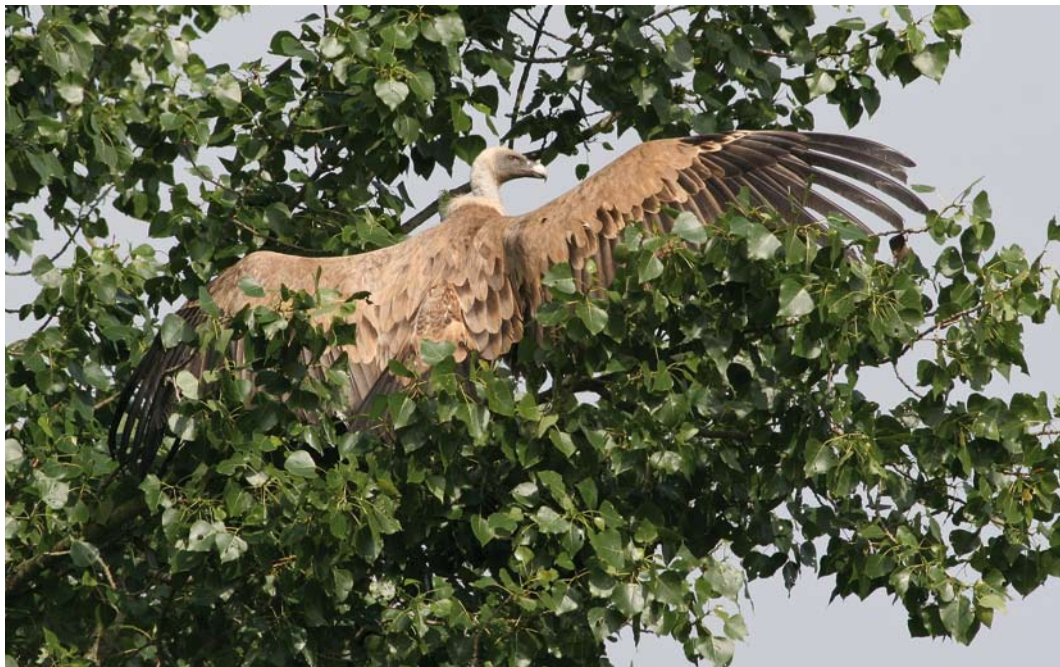
329 Vale Gier / Griffon Vulture Gyps fulvus , Biggekerke, Zeeland, 4 juni 2008