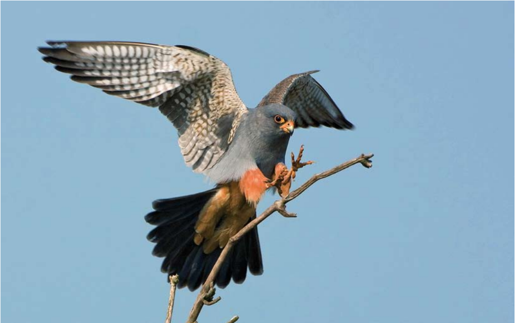
331 Roodpootvalk / Red-footed Falcon Falco vespertinus , tweede-kalenderjaar mannetje, Cranendock, Noord-Brabant, 15 mei 2008 (Jankees Schwiebbe)