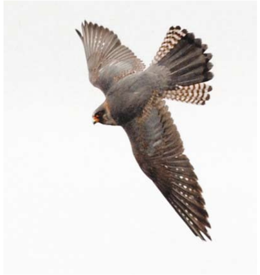
271 Roodpootvalk / Red-footed Falcon Falco vespertinus , tweede-kalenderjaar mannetje, Fochteloërveen, Friesland, 17 mei 2008 (Roef Mulder). Exemplaar met uitzonderlijk veel roestrode tekening op onderdelen. Enkele ondervleugeldekveren geruid / Second calendar-year male with exceptionally extensive rusty coloration on underparts. Some underwing-coverts moulted. 272 Roodpootvalk / Red-footed Falcon Falco vespertinus , tweede-kalenderjaar mannetje, Fochteloërveen, Friesland, 17 mei 2008 (Roef Mulder). Nog niet geruide juveniele buitenste staartpennen duidelijk zichtbaar. Geruide adult-type staartpennen hebben donkere subterminale band die bij adulte vogels ontbreekt / Second calendar-year male. Unmoulted juvenile rectrices clearly visible. Moulted adult type rectrices have dark subterminal bar, lacking in adults. 273 Roodpootvalk / Red-footed Falcon Falco vespertinus , tweede-kalenderjaar mannetje, Fochteloërveen, Friesland, 17 mei 2008 (Roef Mulder). Zelfde vogel als plaat 272 / Second calendar-year male, same bird as in plate 272. 274 Roodpootvalken / Red-footed Falcons Falco vespertinus , tweede-kalenderjaar vrouwtjes, Fochteloërveen, Friesland, 18 mei 2008 (Rik Winters). 'Juveniel-type'. Bovendelen met menging van bruine juveniele veren en grijze nieuwe veren. Tekening van kop en onderdelen sterk herinnerend aan juveniel / 'Juvenile type' second calendar-year female. Upperparts with mixture of brown juvenile and grey new feathers. Pattern of head and underparts strongly reminiscent of juvenile.