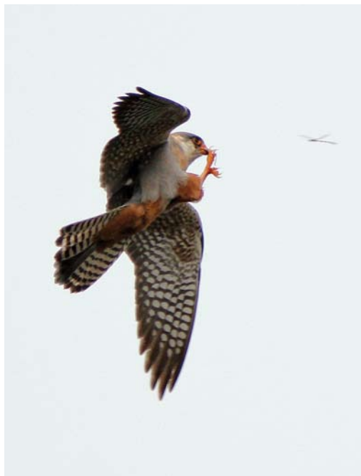
350 Vorkstaartplevier / Collared Pratincole Glaucopis trichoptera , Oostende, West-Vlaanderen, 23 juni 2008 351 Roodpootvalk / Red-footed Falcon Falco vespertinus , tweede-kalenderjaar mannetje, Kalmthout, Antwerpen, 26 mei 2008 352 Breedbekstrandloper / Broad-billed Sandpiper Limicola falcinellus , Bichterweerd, Limburg, 12 mei 2008