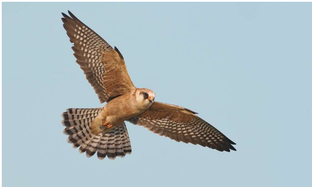
277 Roodpootvalk / Red-footed Falcon Falco vespertinus , adult vrouwtje, Fochteloërveen, Friesland, 15 mei 2008 ( Rein Hofman ). Sommige adulte vrouwtjes vertonen lengtestrepen op ondervleugeldekveren / Some adult females show longitudinal streaks on underwing-coverts. 278 Roodpootvalk / Red-footed Falcon Falco vespertinus , tweedekalenderjaar vrouwtje, Fochteloërveen, Friesland, 13 mei 2008 ( Roef Mulder ). Alle ondervleugeldekveren juveniel met bruine bandering / Second calendar-year female. All underwing-coverts juvenile, with brown barring. 279 Roodpootvalk / Red-footed Falcon Falco vespertinus , adult vrouwtje, Fochteloërveen, Friesland, 19 mei 2008 ( Rein Hofman ). Bruingrijze slagpennen en contrastrijk gebandeerde tertials en bovendelen wijzen op adulte vogel / Adult female. Brown-grey remiges and contrastingly barred tertials and upperparts indicative of adult female.