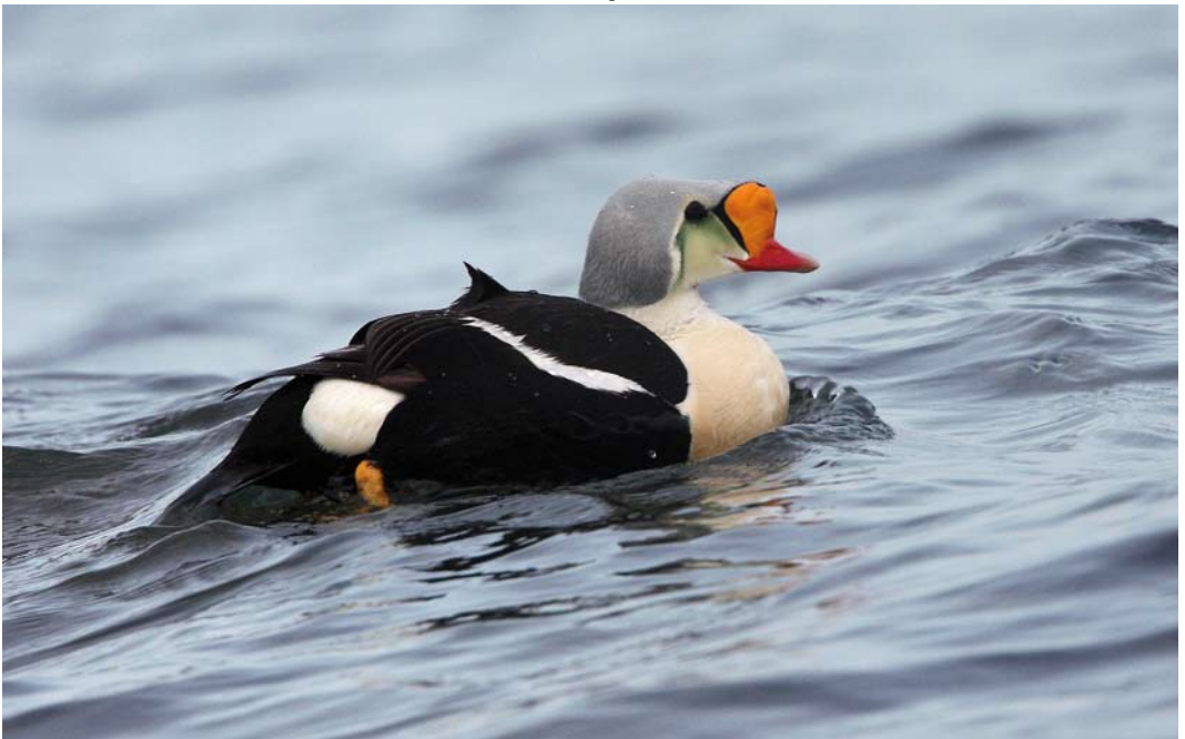
309 King Eider / Koningseider Somateria spectabilis , adult male, Woodland Bay, Girvan, Scotland, 28 May 2008 (Brian Egan)