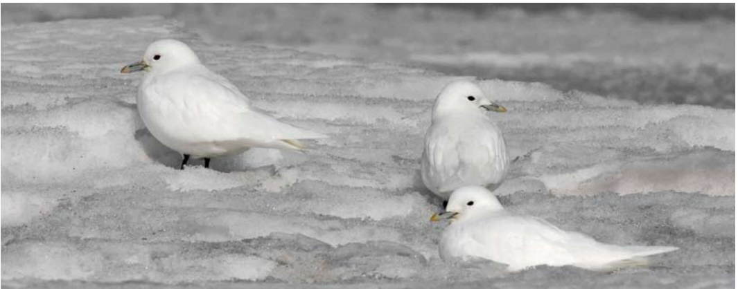
315 Hudsonian Godwit / Rode Grutto Limosa haemastica , male, with Black-tailed Godwit / Grutto L. limosa , Vannbassenget, Røst, Nordland, Norway, 24 June 2008 ( Tomas Aarvak ) 316 Forster's Tern / Forsters Stern Sterna forsteri , adult, Tacumshin, Wexford, Ireland, 2 June 2008 ( Killian Mullarney ) 317 Black-browed Albatross / Wenkbrauwalbatros Thalassarche melanophris , Atlantic Ocean, 140 km west of Kilkee, Clare, Ireland, 4 June 2008 ( Ramón López Junca ) 318 Steller's Eider / Stellers Eider Polysticta stelleri , Blikalón, Melrakkaslétta, Iceland, 12 July 2008 ( James Lidster ) 319 Ivory Gulls / Ivoormeewuven Pagophila eburnea , adult, Longyearbyen, Svalbard, 23 May 2008 ( Edwin Winkel )