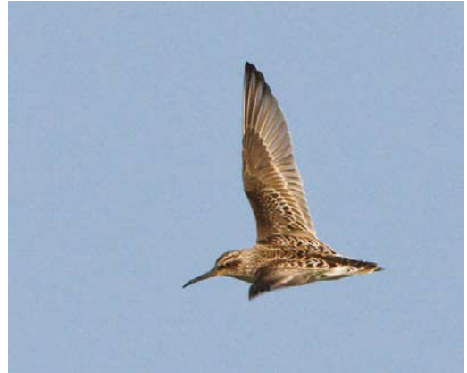
356 Breedbekstrandloper / Broad-billed Sandpiper Limicola falcinellus , Bichterweerd, Limburg, 12 mei 2008

voor bijna 100 Visarenden Pandion haliaetus en in juni waren er nog vier waarnemingen in Wallonië: in Harchies, Hompré, Luxembourg; Freux, Luxembourg; Nassogne, Luxembourg; en Virelles, Namur. Vanaf de eerste dagen van mei tekende zich een invasie van Roodpootvalken Falco vespertinus af en we ontvingen waarnemingen van in totaal 67 uit Antwerpen, Antwerpen (twee); Brecht (drie); Bredene (vier); Breuvanne, Luxembourg; Briquemont-Laloux, Namur; Condé sur Escaut; Cul-des-Sarts, Namur; Dave, Namur; De Panne, West-Vlaanderen (drie); Duffel-Rumst; Elen (drie); Forges, Namur; Gent (twee); Gerny, Luxembourg; Heist; Kalmthout (minstens zeven); Lier (drie); Lokeren, Oost-Vlaanderen (twee); Lommel (twee); Mainvault, Hainaut; Mechelen; Meetkerke, West-Vlaanderen; Namêche, Namur; Ploegsteert; Remagne, Luxembourg; Rijkevorsel, Antwerpen; Schulen; Sint-Denijs; Termes, Luxembourg; Tienen; Torhout, West-Vlaanderen; Verlaine, Liège; Virelles; Wilrijk (twee); Zandvoorde (vijf); Zeebrugge (vijf); en Zoutleeuw.