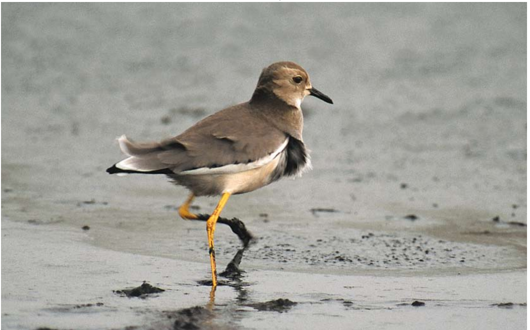
300 Witstaartkievit / White-tailed Lapwing Vanellus leucurus , Assendelft, Noord-Holland, 23 februari 1998