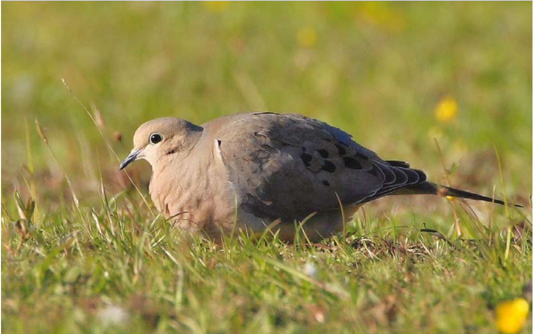
313 Mourning Dove / Treurduif Zenaida macroura , Skagen, Nordjylland, Denmark, 19 May 2008