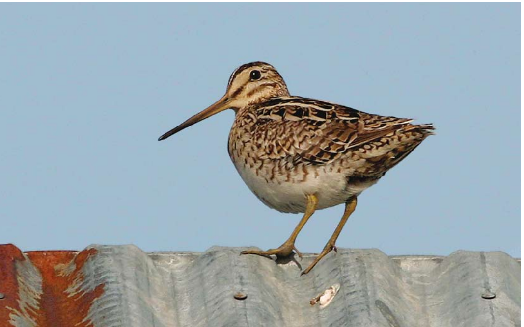
312 Swinhoe's Snipe / Siberische Snip Gallinago megala , Värtsilä, Tohmajärvi, Finland, 16 June 2008 (Petri Salo)