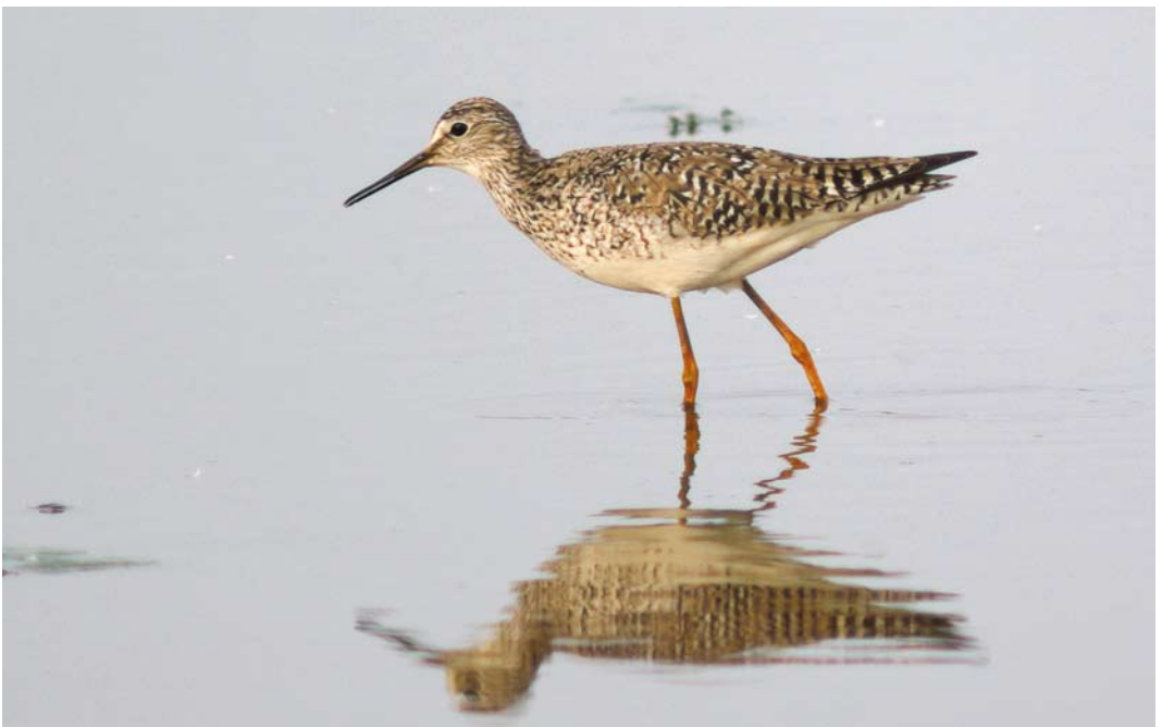
336 Kleine Geelpootruiter / Lesser Yellowlegs Tringa flavipes , Ezumakeeg, Friesland, 1 juni 2008 ( Sietze Bernardus )