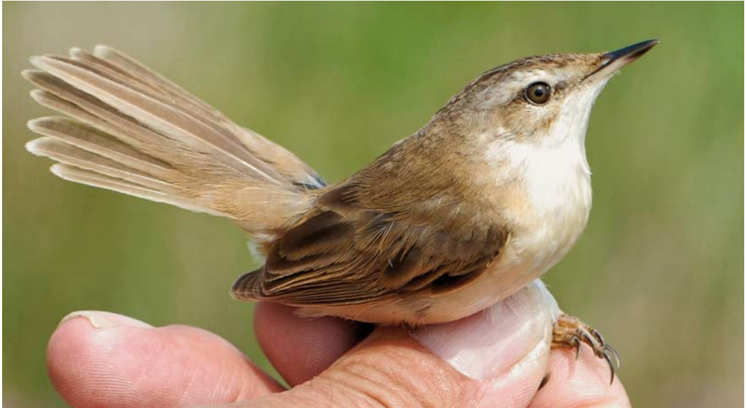
349 Veldrietzanger / Paddyfield Warbler Acrocephalus agricola , Zwanenwater, Noord-Holland, 4 juni 2008