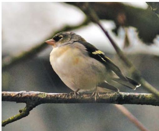
253-254 (Vermoedelijke) afwijkende Vink / (presumed) aberrant Common Chaffinch Fringilla coelebs (met kenmerken van 'Afrikaanse Vink' / showing characters of 'African Chaffinch' F c africana/spodiogenys ), Haren, Groningen, 11 december 2003 (Arnoud B van den Berg)