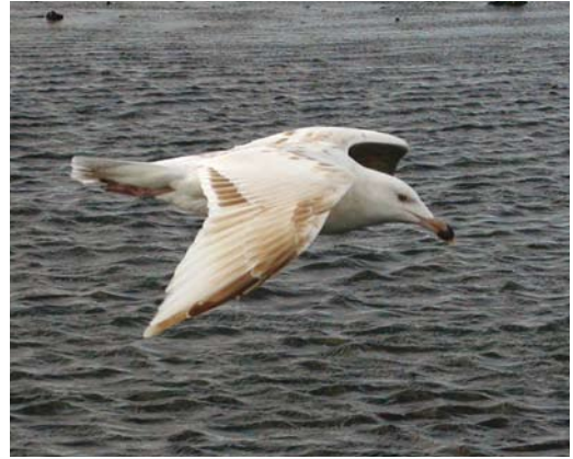
263-264 Grote Mantelmeeuw / Great Black-backed Gull Larus marinus , gebleekte bruinmutant / bleached brown mutant, Schiermonnikoog, Friesland, 5 oktober 2003

dat van een eerste-winter Grote Burgemeester en Grote Mantelmeeuw en past goed op een hybride tussen deze twee soorten zoals beschreven in Olsen & Larsson (2004). De determinatie als dit type hybride is daarmee het meest waarschijnlijk maar blijft door het ontbreken van bewijs onzeker.