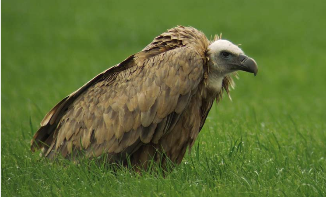
357 Vale Gier / Griffon Vulture Gyps fulvus , Slootdorp, Noord-Holland, 10 juli 2008 (Richard Houtman)