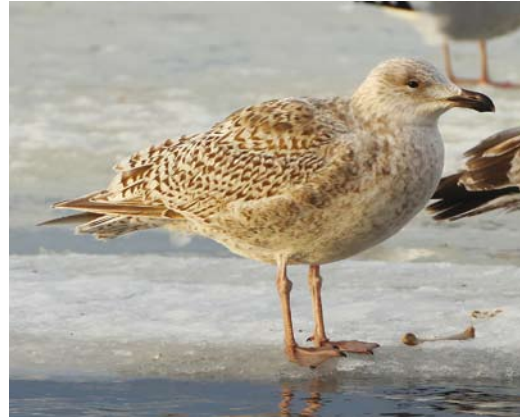
259-260 Hybride Grote Burgemeester x Grote Mantelmeeuw / hybrid Glaucous x Great Black-backed Gull Larus hyperboreus x marinus , eerste-winter, St John's, Newfoundland, Canada, 8 januari 2008