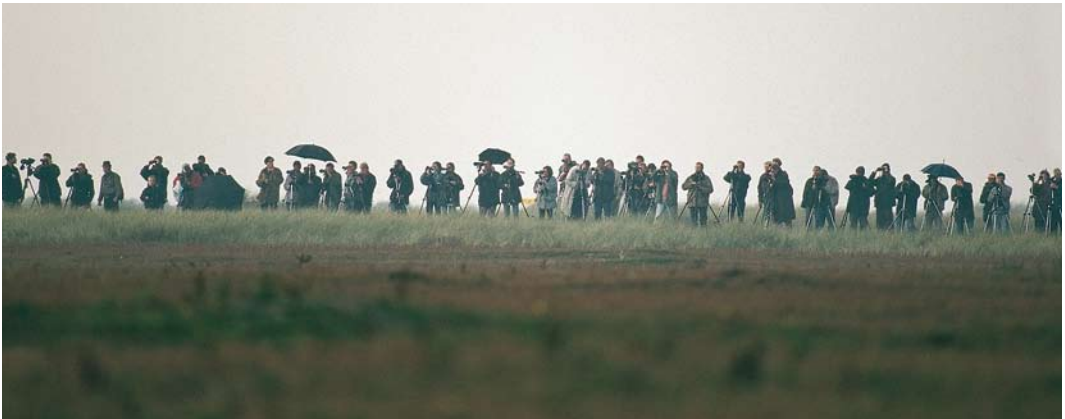
294 Izabeltapuit / Isabelline Wheatear Oenanthe isabellina , Maasvlakte, Zuid-Holland, 23 oktober 1996 295 Struikrietzanger / Blyth's Reed Warbler Acrocephalus dumetorum , Walem, Limburg, 23 juni 1996 296 Vogelaars bij Mongoolse Pieper / birders at Blyth's Pipit Anthus godlewskii , Maasvlakte, Zuid-Holland, oktober 1996

raam vloog in Hoogerheide, Noord-Brabant, ging aan de neus van twitchend Nederland voorbij, evenals de Sperweruil Sunia ulula die op 2 april door Hans van de Laar in Brunssum, Limburg, werd gefotografeerd en daarna nooit meer teruggezien. Daarna kwam het jaar los: Alain Kind (her)ontdekte op 20 april een Grote Geelpootruiter in De Braakman, Zeeland. De vogel werd succesvol getwitcht en was met regelmaat tot ver in mei op deze plek zichtbaar. Tussendoor zou hij aan de Engelse oostkust zijn gezien, maar het is nooit helemaal zeker geworden of het inderdaad om dezelfde ging. Op 4 mei was het weer tijd voor een doubletje, en wat voor één – een Daurische dubbelslag! Bij Katwijk, Zuid-Holland, werd op het Wantveld door Arnold Meijer in de middag de derde Daurische Kauw C dauricus voor de WP ontdekt terwijl op de noordpunt van Texel een reeds 's ochtends door een groepje jeugdbonders gevonden 'izabelklauwier' (later gedetermineerd als Daurische Klauwier I isabellinus ) spontaan werd heront-