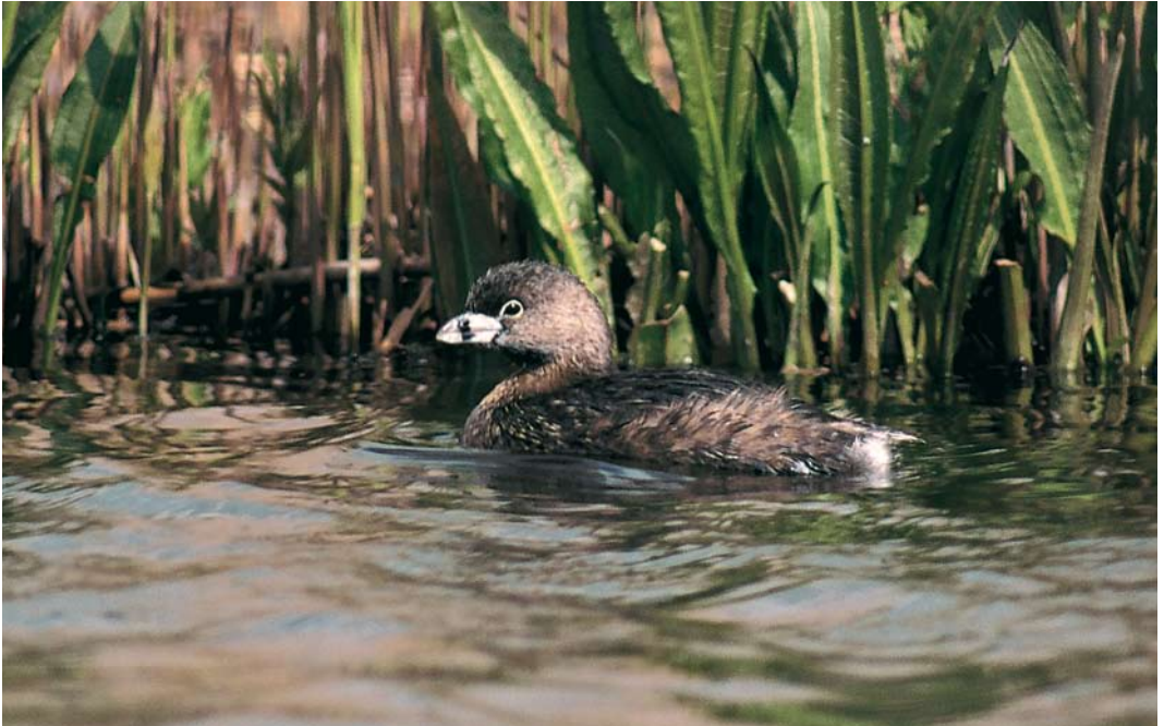
299 Dikbekfuut / Pied-billed Grebe Podilymbus podiceps , Akersloot, Noord-Holland, 21 april 1997