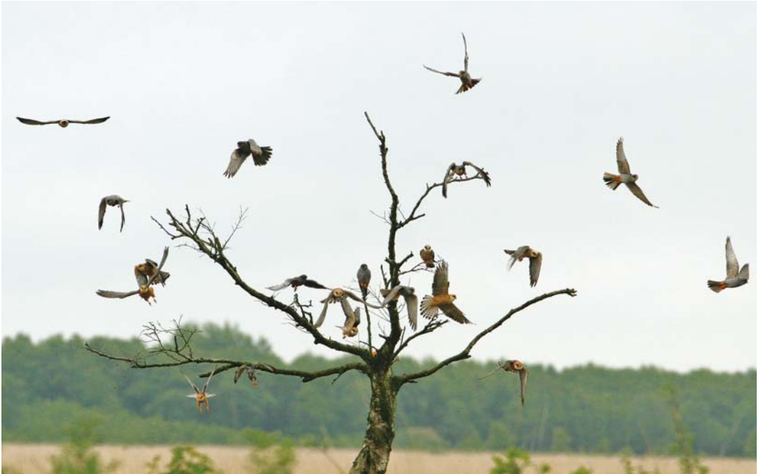
265 Roodpootvalken / Red-footed Falcons Falco vespertinus , Fochteloërveen, Friesland, 17 mei 2008 266 Roodpootvalken / Red-footed Falcons Falco vespertinus , Fochteloërveen, Friesland, 17 mei 2008 267 Roodpootvalk / Red-footed Falcon Falco vespertinus , tweede-kalenderjaar mannetje, Fochteloërveen, Friesland, 15 mei 2008