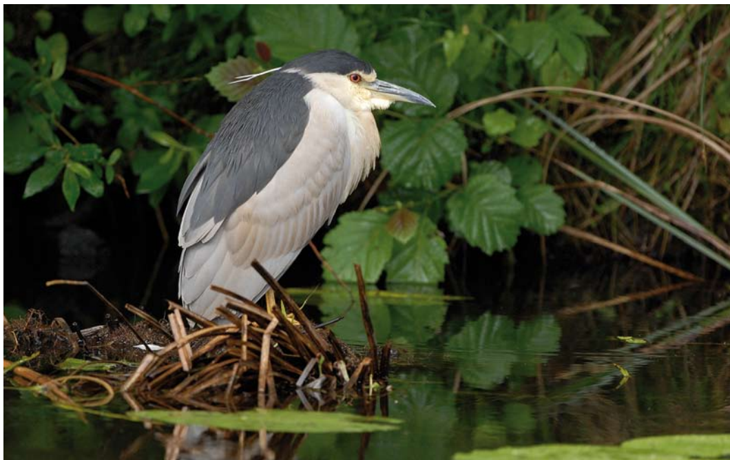
327 Kwak / Black-crowned Night Heron Nycticorax nycticorax , Dwarsgracht, De Wieden, Overijssel, 16 juni 2008 (Ronald Messemaker)