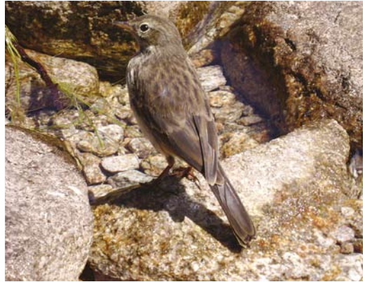
305 Water Pipit / Waterpieper Anthus spinoletta , Lac de Melo, Haute-Corse, Corsica, France, 25 July 2007 (Dick Groenendijk)

VI This mystery bird is foraging on the ground and only its upperside is visible. It is clearly a passerine but it looks rather featureless and difficult to identify. It shows long and rather narrow tertials that almost entirely cover the primaries. The absence of a primary projection in combination with long and rather narrow tertials points to a pipit Anthus . This assumption is confirmed by the rather slender body, long tail, streaked upperparts and, just visible, white-edged outer tail-feathers. Most entrants indeed recognised it as a pipit, although a few opted for White-winged Snowfinch Montifringilla nivalis . However, the latter shows, for instance, an obvious primary projection and much shorter tertials.