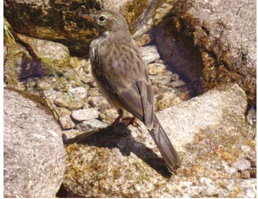
305 Water Pipit / Waterpieper Anthus spinoletta , Lac de Melo, Haute-Corse, Corsica, France, 25 July 2007 (Dick Groenendijk)

VI This mystery bird is foraging on the ground and only its upperside is visible. It is clearly a passerine but it looks rather featureless and difficult to identify. It shows long and rather narrow tertials that almost entirely cover the primaries. The absence of a primary projection in combination with long and rather narrow tertials points to a pipit Anthus . This assumption is confirmed by the rather slender body, long tail, streaked upperparts and, just visible, white-edged outer tail-feathers. Most entrants indeed recognised it as a pipit, although a few opted for White-winged Snowfinch Montifringilla nivalis . However, the latter shows, for instance, an obvious primary projection and much shorter tertials.