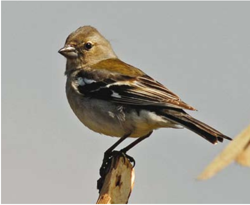
252 Atlasvink / Atlas Chaffinch Fringilla coelebs africana , vrouwtje, Romanni, Marokko, 28 maart 2006 (Arnoud B van den Berg). Let op duidelijke groentint op mantel / note strong greenish coloration on mantle.

kleine afstanden naar het zuiden afleggen (Cramp & Perrins 1994, van den Berg & The Sound Approach 2005). In Europa zijn c 10 waarnemingen van 'Afrikaanse Vink' bekend, waarbij in slechts enkele gevallen determinatie tot op ondersoort mogelijk bleek. Daarnaast zijn er in bijvoorbeeld Brittannië, Ierland, Nederland, Noorwegen en Zweden waarnemingen van Vinken met (enkele) kleeckenmerken van 'Afrikaanse Vink' die bij nadere bestudering echter niet in alle kenmerken overeen kwamen met wat van 'Afrikaanse Vink' bekend is. Deze naar wordt aangenomen afwijkende of hybride Vinken ('look-alikes') zorgen voor veel verwarring en maken het lastig om een helder beeld te krijgen van het voorkomen van 'Afrikaanse Vink' buiten Noordwest-Afrika (zie onder).