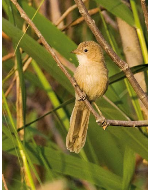
323 Citril Finch / Citroenkanarie Serinus citrinella , adult male, Fair Isle, Shetland, Scotland, 7 June 2008 324 Iraq Babbler / Iraakse Babbelaar Turdoides altirostris , Birecik, Turkey, 8 May 2008 325 Rustic Bunting / Bosgors Emberiza rustica , Helgoland, Schleswig-Holstein, Germany, 8 June 2008