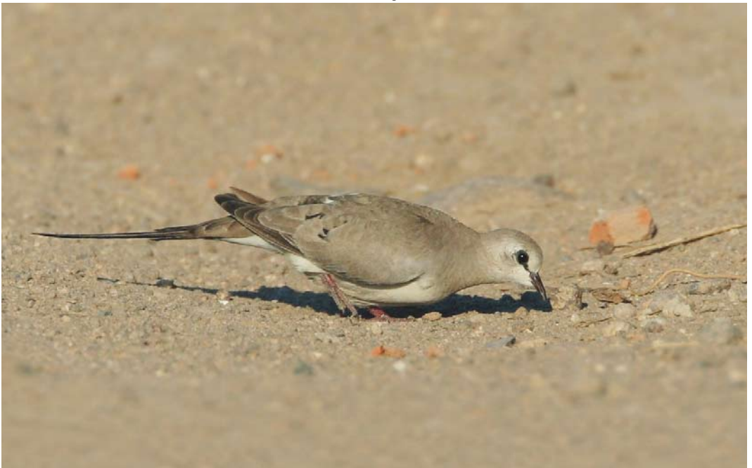
314 Namaqua Dove / Maskerduif Oena capensis , female, Skala Kallonis, Lesvos, Greece, 20 June 2008 (Ole Krogh)