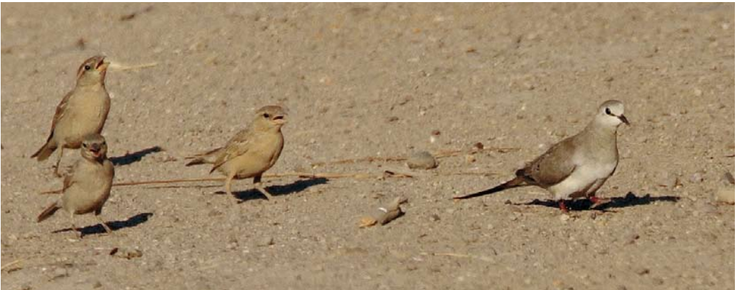
320 Red-throated Pipit / Roodkeelpieper Anthus cervinus , Palestino, Rio Verde, Esmeraldas, Ecuador, 28 March 2008 cf Dutch Birding 30: 199, 2008 321 Iraq Babbler / Iraakse Babbelaar Turdoides altirostris , Birecik, Turkey, 8 May 2008 322 Namaqua Dove / Maskerduif Oena capensis , female, with House Sparrows / Huismussen Passer domesticus , Skala Kallonis, Lesvos, Greece, 20 June 2008

GULLS TO TERNS In Svalbard, the numbers of Ivory Gull Pagophila eburnea in Adventfjorden, Longyearbyen, decreased from an April-May peak of 120 in 1995, 90 in 1996, 39 in 1997 to 37 in 1998; then, in 2004-06, the annual maxima remained just above 20 but in 2007 only up to eight individuals were seen. This spring, the situation was the same as in 2007 with only a handful from early May onwards and peaks of eight on 20 May and five on 23 May. The first Bonaparte's Gull Chroicocephalus philadelphia for Svalbard was an adult photographed at Longyearbyen on 9-12 June. First-summers stayed at Loch Ruthven, Highland, Scotland, on 3-13 June and Koksijde, West-Vlaanderen, Belgium, on 8 June. The first-summer Ross's Gull Rhodostethia rosea at Esbjerg, Vestjylland, Denmark, from 27 December stayed until at least 29 June. Adult Laughing Gulls Larus atricilla were found at Cabo da Praia, Terceira, Azores, on 4 and 16 June, at the Var mouth, Alpes-Maritimes, France, on 8