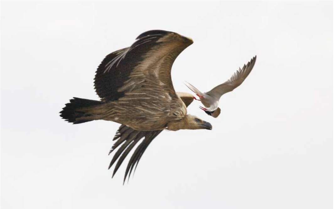
311 Griffon Vulture Vale Gier Gyps fulvus , with Common Tern / Visdief Sterna hirundo , Neuwerk, Hamburg, Schleswig-Holstein, Germany, June 2008 (Stefan Pfützke)