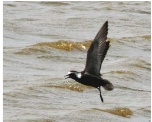
337 Poelsnip / Great Snipe Callinago media , Dwars in den Weg, Zeeland, 14 mei 2008 338 Blonde Ruiter / Buff-breasted Sandpiper Tryngites subruficollis , Waal en Burg, Texel, Noord-Holland, 11 juni 2008 339 Amerikaanse Goudplevier / American Golden Plover Pluvialis dominica , Prunjepolder, Zeeland, 23 mei 2008 340 Amerikaanse Goudplevier / American Golden Plover Pluvialis dominica , Prunjepolder, Zeeland, 24 mei 2008

een groot aantal dagen goed voor waarnemingen en ook langs de Friese IJsselmeerkust werden vanaf eind mei tot vijf exemplaren geteld. Tot 10 mei werden nog c 14 doortrekkende Lachsterns Gelochelidon nilotica gemeld, waaronder een exemplaar dat op 5 mei door 10-tallen vogelaars op Breskens werd bekeken. De Witwangstern Chlidonias hybrida die zich vanaf 25 april ophield in de omgeving van de Kinseldam in Waterland werd voor het laatst op 1 mei gezien. Tot medio juni trokken er vervolgens c 40 door, waaronder groepjes van 11 tot 13 mei op de Strabrechtse Heide (drie); op 14 mei in De Hamert (vijf); van 28 tot 30 mei in de Brabantse Biesbosch (maximaal vijf); van 1 tot 8 juni op Tiengemeten (maximaal zeven); en op 7 juni in de Sliedrechtse Biesbosch (drie). Tussen begin mei en begin juni trokken c 30 Witvleugelsterns C leucopterus door. Vanaf 13 mei tot ten minste eind mei verbleef er net als in eerdere jaren een adulte in een kolonie van Zwarte Sterns C niger