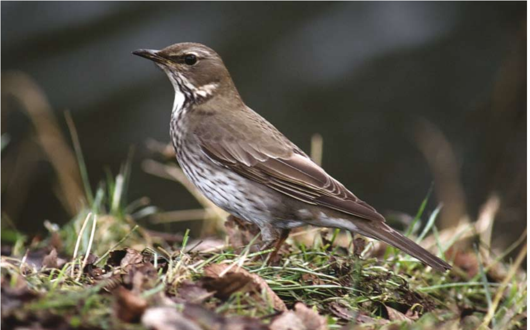
292 Zwartkeellijster / Black-throated Thrush Turdus atrogularis , vrouwtje, Den Helder, Noord-Holland, 12 januari 1996