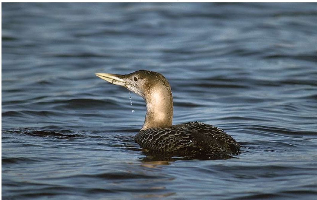
298 Geelsnavelduiker / Yellow-billed Loon Gavia adamsii , Reeuwijk, Zuid-Holland, 15 januari 1996 (Hans Gebuis)