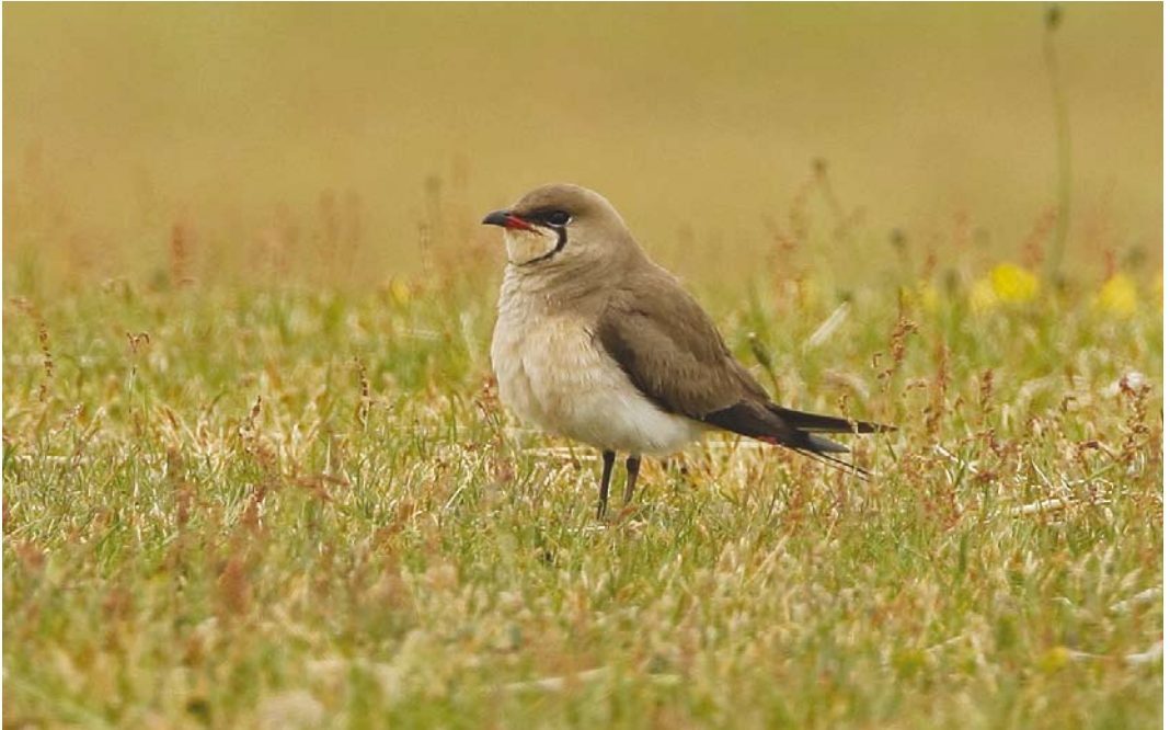
335 Vorkstaartplevier / Collared Pratincole Glaucopis pratincola , Texel, Noord-Holland, 1 juni 2008