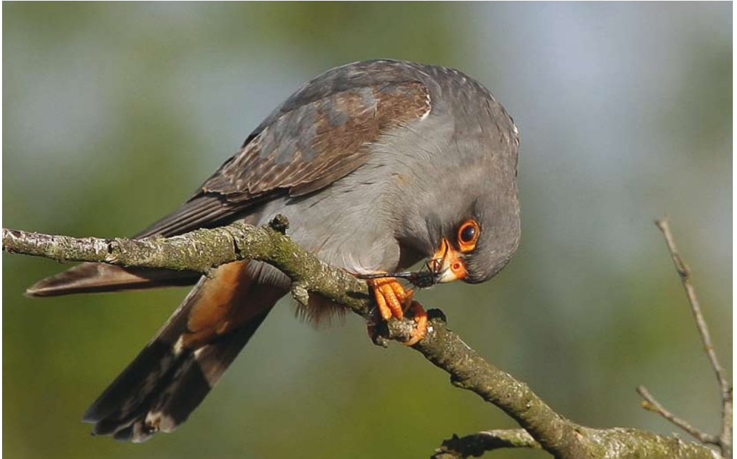
275 Roodpootvalk / Red-footed Falcon Falco vespertinus , tweede-kalenderjaar mannetje met witsnuitlibel / whiteface Leucorrhinia , Fochteloërveen, Friesland, 18 mei 2008 276 Roodpootvalk / Red-footed Falcon Falco vespertinus , adult mannetje, Fochteloërveen, Friesland, 21 mei 2008. Ontbreken van juveniele kenmerken en zilvergrijze bovenzijde van handpennen duiden op adult. Van dichtbij zijn ook bij adulte mannetjes fijne donkere schachtstrepen zichtbaar op borst en flank / Lack of any juvenile characters and silvery-grey upperside of primaries indicate adult male. In close view, also adult males show fine dark shaft-streaks on breast and flank.