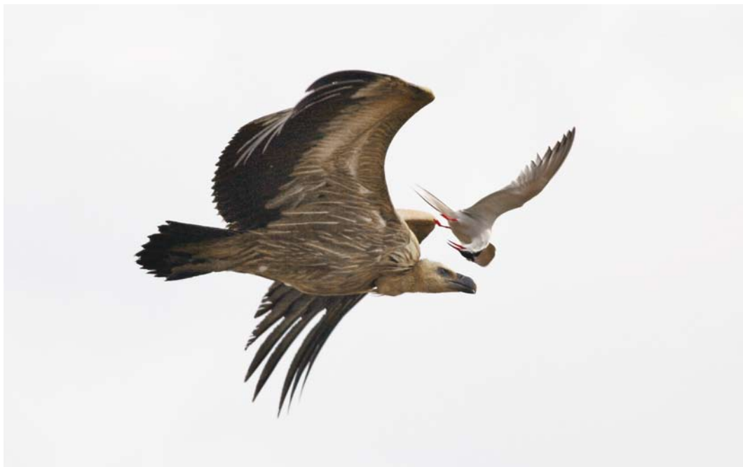
311 Griffon Vulture Vale Gier Gyps fulvus , with Common Tern / Visdief Sterna hirundo , Neuwerk, Hamburg, Schleswig-Holstein, Germany, June 2008