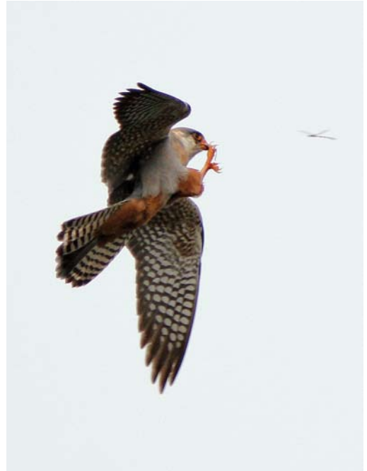
350 Vorkstaartplevier / Collared Pratincole Glaucopis pratincola , Oostende, West-Vlaanderen, 23 juni 2008 351 Roodpootvalk / Red-footed Falcon Falco vespertinus , tweede-kalenderjaar mannetje, Kalmthout, Antwerpen, 26 mei 2008 352 Breedbekstrandloper / Broad-billed Sandpiper Limicola falcinellus , Bichterweerd, Limburg, 12 mei 2008