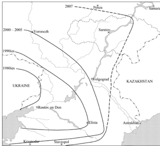
FIGURE 1 Range expansion of Syrian Woodpecker Dendrocopos syriacus in eastern Ukraine and European Russia in 1980-2007