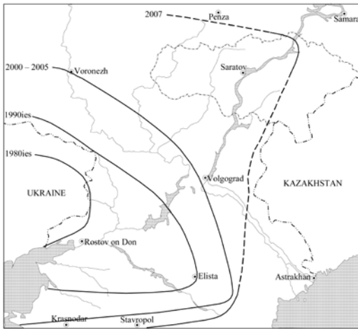
FIGURE 1 Range expansion of Syrian Woodpecker Dendrocopos syriacus in eastern Ukraine and European Russia in 1980-2007