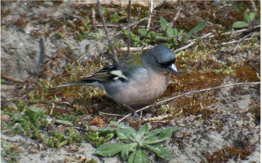
248-249 Atlasvink / Atlas Chaffinch Fringilla coelebs africana , mannetje, Maasvlakte, Zuid-Holland, 5 april 2003