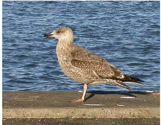
14-15 Probable Herring Gull / waarschijnlijke Zilvermeeuw Larus argentatus , first-year, Hirtshals Havn, Nordjylland, Denmark, 25 February 2004 (Kenneth Rude Nielsen). Bird with largely dark tail and densely barred upper- and undertail-coverts. Note surprisingly dark longest two undertail-coverts in plate 15. See also plate 16-17, depicting same bird. Feathers of this bird have been taken for DNA sampling. 16-17 Probable Herring Gull / waarschijnlijke Zilvermeeuw Larus argentatus , first-year, Hirtshals Havn, Nordjylland, Denmark, 17 February 2004 (Rune SØ Neergaard). Same bird as in plate 14-15. Underparts paler and more clearly streaked than in typical Smithsonian Gull L. smithsonianus . In addition, new greyish scapulars looking slightly darker than usual in that species, while upper flank-feathers look rather too pale.

undertail-coverts seen in some smithsonianus are usually not present in argentatus (but see plate 15). Also, in first-year smithsonianus , the vent is often as boldly and densely marked as the undertail-coverts, especially along the sides, the pattern connecting clearly with the brown belly. In argentatus , strong, continuous barring on the vent occurs but is only rarely seen (and is often separated from the dark markings on the underparts by a pale central belly and rear flank).