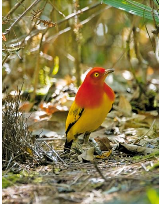
187 Lesser Bird-of-Paradise / Kleine Paradijsvogel Paradisaea minor , male, Baiyer river, Western Highlands, Papua New Guinea, 21 July 2007 ( Otto Plantema ) 188 Flame Bowerbird / Oranje Prielvogel Sericulus aureus , Kiunga, Western Province, Papua New Guinea, October 2006 ( Otto Plantema ) 189 King of Saxony Bird-of-Paradise / Wimpeldrager Pteridophora alberti , male, Tari, Southern Highlands, Papua New Guinea, 7 October 2006 ( Otto Plantema )