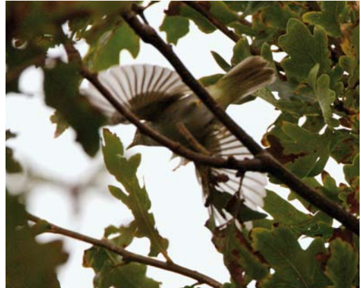
172 Kroonboszanger / Eastern Crowned Warbler Phylloscopus coronatus , Katwijk aan Zee, Zuid-Holland, 5 oktober 2007 (René van Rossum)

NAAKTE DELEN Iris donker, groot lijkend. Bovensnavel geeloranje met donkere punt. Ondersnavel geheel geeloranje. Poot licht vleeskleurig tot gelig.