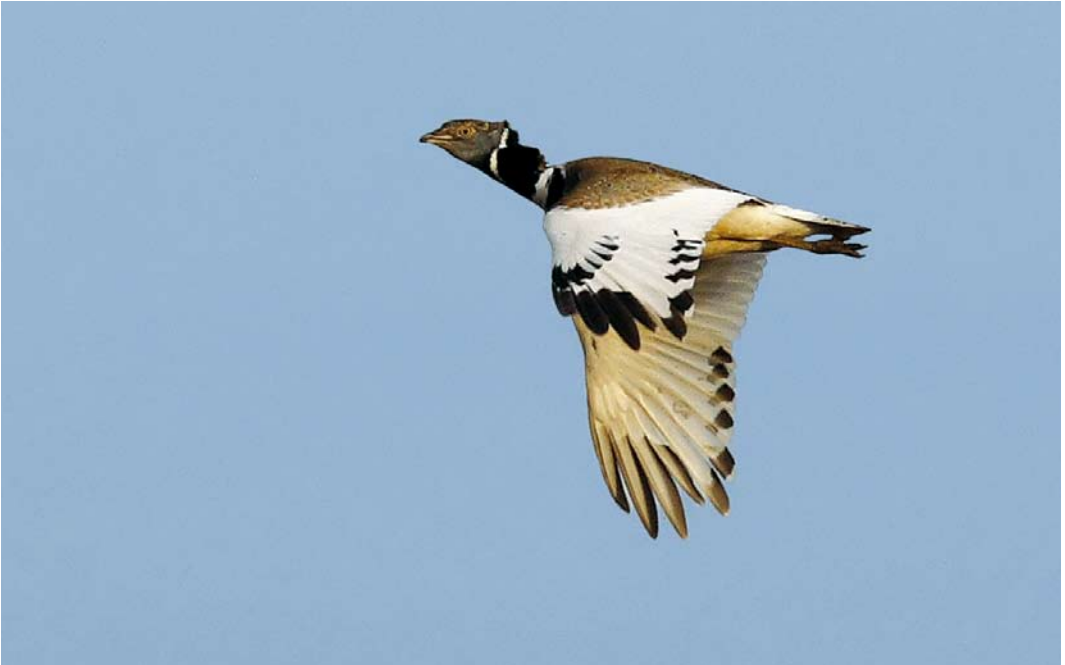
244 Kleine Trap / Little Bustard Tetrax tetrax , mannetje, Korbeek-Dijle, Vlaams-Brabant, 20 april 2008 (Raymond De Smet)

c 108 volgden. Op 17 april werd een Roodpootvalk Falco vespertinus gezien bij Doel, Oost-Vlaanderen; op 22 april was er één bij Fleurus, Hainaut; op 25 april trok er één over Drogen, Oost-Vlaanderen; en op 27 april volgde een vrouwtje in Dendermonde, Oost-Vlaanderen.