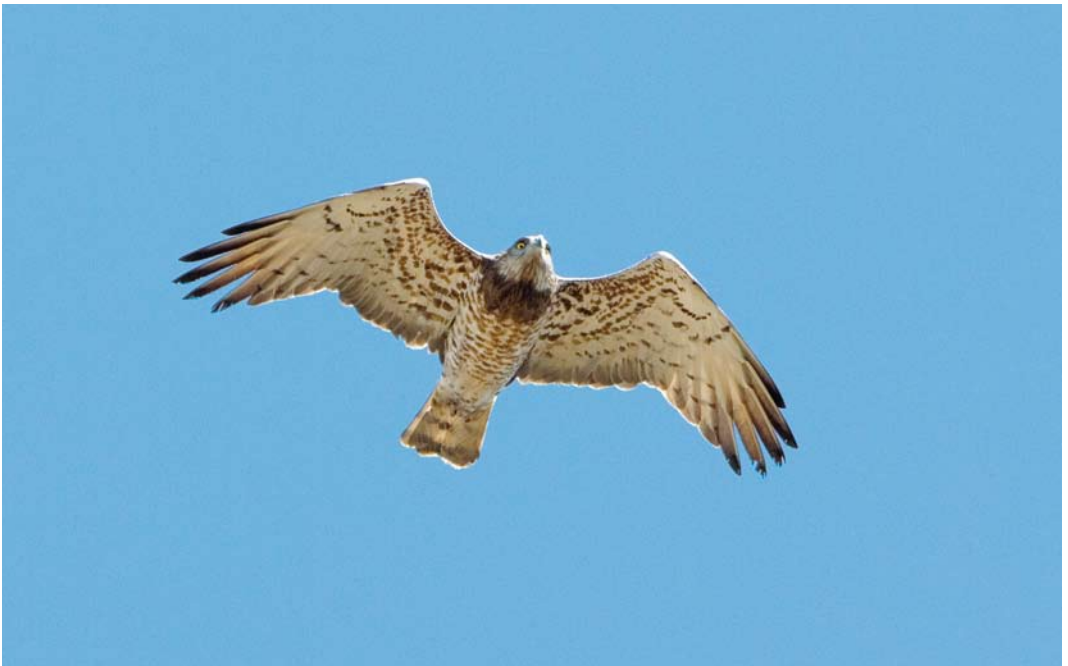
211 Short-toed Snake Eagle / Slangenarend Circaetus gallicus , Loozerheide, Limburg, Netherlands, 5 May 2008 (René Weenink)