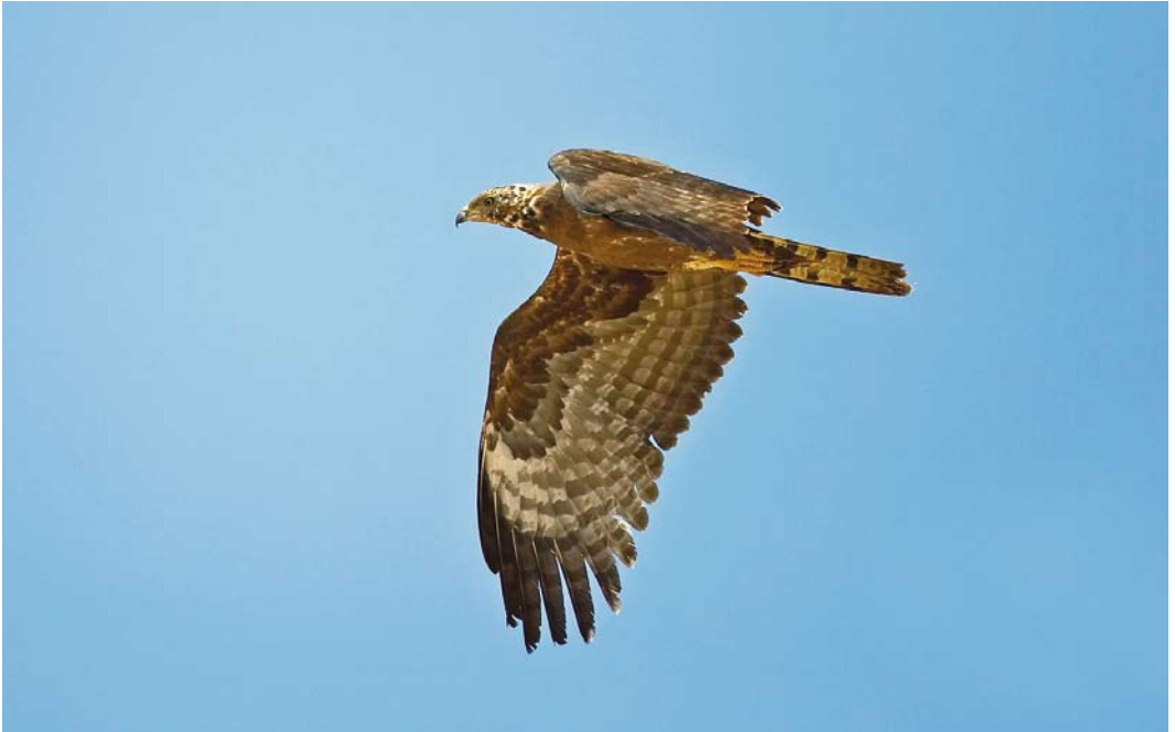
210 Crested Honey Buzzard / Aziatische Wespendiff Pernis ptilorhyncus , Eilat, Israel, 24 March 2008 (Dick Forsman)