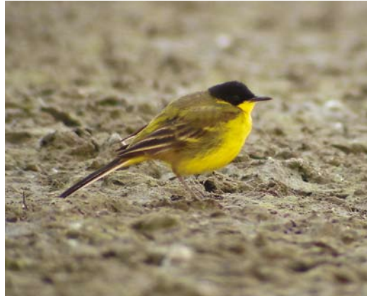
220 Purple Sandpiper / Paarse Strandloper Calidris maritima , Essaouira, Morocco, 2 March 2008 221 Black Lark / Zwarte Leeuwerik Melanocorypha yeltoniensis , male, Winterton North Dunes, Norfolk, England, 21 April 2008 222 Moltoni's Subalpine Warbler / Moltoni's Baardgrasmus Sylvia cantillans moltonii , Taouz, Tafilalt, Morocco, 26 March 2008 223 Black-headed Wagtail / Balkankwikstaart Motacilla feldegg , male, Przereb, Zator fishponds, Krakow, Poland, 3 May 2008

April. The adult Killdeer C vociferus first seen on Mainland, Shetland, Scotland, from 6 April into November 2007 reappeared on 6 March and was seen again over Mousa on 2 April and on Noss on 11 April. In Outer Hebrides, another was found on North Uist on 2 May. In total, four Caspian Plovers C asiaticus were found in Israel, including two at Yotvata until 28 March, one at Elifaz on 3-8 April and one at Ma'agan Michael on 24 April. On 1 May, a female was present on Fair Isle, Shetland; it was last seen the next morning at 10:30. In the Netherlands, a migrating American Golden Plover Pluvialis dominica was photographed while flying past the renowned spring migration observation post at Breskens, Zeeland, on 20 April. Sociable Lapwings Vanellus gregarius occurred at Chozas de Abajo, León, Spain, on 20 March; at La Nava lagoon, Palencia, Spain, on 28 March; at Vercelli, Italy, on 13 April; in the Marne