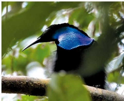
194 Magnificent Riflebird / Prachtgeweenvogel Ptilornis magnificens , male, Kiunga, Western Province, Papua New Guinea, 1 August 2007

Beehler, B M, Pratt, T K & Zimmerman, D A 1986. Birds of New Guinea. Princeton. Cooper, W T & Forshaw, J M 1977. The birds of paradise and bowerbirds. Sydney.