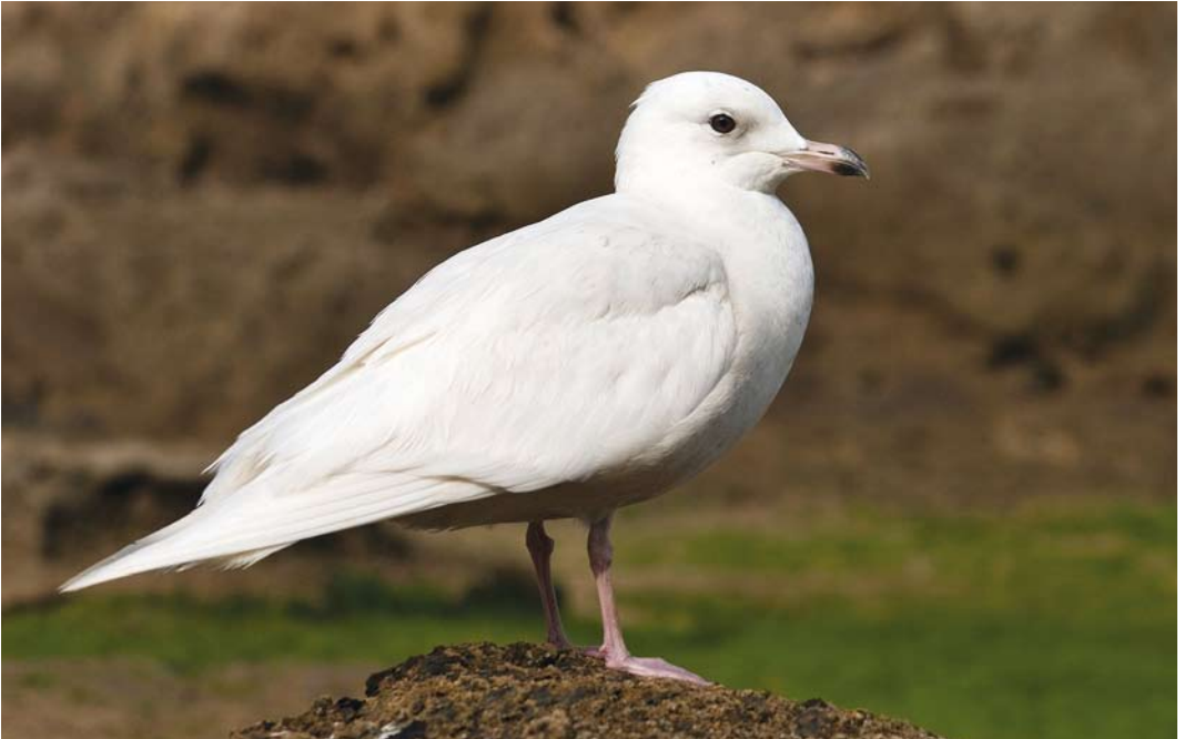
224 Iceland Gull / Kleine Burgemeester Larus glaucooides , Essaouira, Morocco, 2 March 2008 (Harvey van Diek)