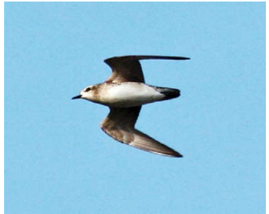
235 Slangenarend / Short-toed Snake Eagle Circaetus gallicus , Spaarnwoude, Noord-Holland, 23 april 2008 (Roy Slaterus) 236 Steppiekiekendief / Pallid Harrier Circus macrourus , Zwaagdijk-Oost, Noord-Holland, 24 april 2008 (Roy Slaterus) 237 Griel / Eurasian Stone-curlew Burhinus oediacnemus , met Grote Zilverreiger / Great Egret Casmerodius albus , Zoetermeer, Zuid-Holland, 31 maart 2008 (Arno van Berge Henegouwen) 238 Amerikaanse Goudplevier / American Golden Plover Pluvialis dominica , Breskens, Zeeland, 20 april 2008 (Jacques Leclercq)

april werd de soort alleen nog gezien in het Lauwersmeergebied, de Carel Coenraadpolder, op de Dollardkwelder en op Schiermonnikoog. Witbuikrotganzen B hrota en Zwarte Rotganzen B nigricans werden hoofdzakelijk aangetroffen tussen Rotganzen B bernicla op bekende plekken, zoals Wieringen, Noord-Holland; Texel, Noord-Holland; Terschelling, Friesland; Schiermonnikoog; het Lauwersmeergebied; en Schouwen-Duiveland, Zeeland. In de meeste gevallen ging het om solitaire exemplaren. Witoogeenden Aythya nyroca werden gemeld tot 25 april bij Huizen, Noord-Holland (vrouwje); van 1 tot 5 maart bij Nederweert, Limburg (mannetje); van 8 tot 24 maart in de Botshol, Noord-Holland (vrouwje); tot ten minste 28 maart bij Castricum, Noord-Holland (paar); van 15 maart tot 12 april in de Oostvaardersplassen, Flevoland (vrouwje); en op 19 april bij Woudenberg, Utrecht (mannetje). Ten minste twee andere gingen als zekere 'escape' de boeken in.