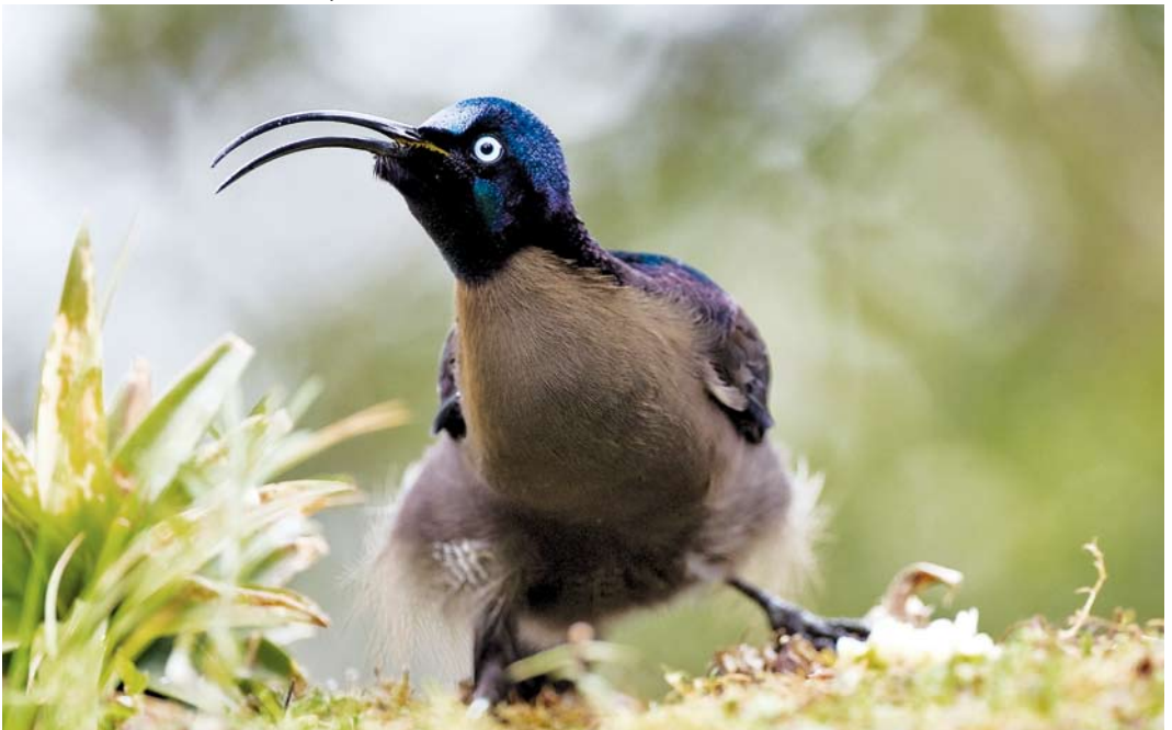
182 Brown Sicklebills / Bruine Sikkelsnavel Epimachus meyeri , male, Mount Hagen, Enga Province, Papua New Guinea, 16 October 2006