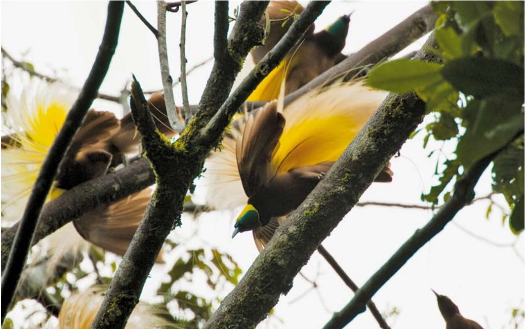
181 Greater Birds-of-Paradise / Grote Paradijsvogels Paradisaea apoda , Kiunga, Western Province, Papua New Guinea, 22 October 2006