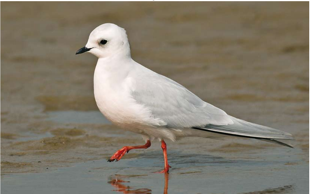
225 Ross's Gull / Ross' Meeuw Rhodostethia rosea , adult, Fairhaven lake, Lancashire, England, 21 April 2008