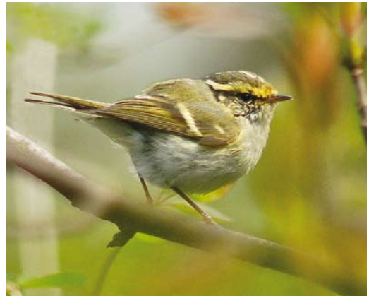
239 Hutchins' Canadese Gans / Hutchins's Cackling Goose Branta hutchinsii hutchinsii , met Brandganzen / Barnacle Geese B leucopsis , Taczoyil, Friesland, 11 april 2008 240-241 Hybride Ringsnavelmeeuw x Stormmeeuw / hybrid Ring-billed x Common Gull Larus delawarensis x canus canus , derde kalenderjaar, Zandvoortseweg, Middelburg, 24 april 2008 242 Pallas' Boszanger / Pallas's Leaf Warbler Phylloscopus proregulus , Scheveningse Bosjes, Den Haag, Zuid-Holland, 13 april 2008

Daarnaast werden er ook enkele als zekere 'escape' ontmaskerd, zoals bij Egmond, Noord-Holland, en op Wieringen. Een ongeringd mannetje Bronskopeend Anas falcata bevond zich van 30 januari tot 26 maart bij 's-Gravezande, Zuid-Holland. De lokatie en het tamme gedrag van de vogel wezen echter op een herkomst uit gevangenschap. Van 16 tot 27 maart verbleef een mannetje Amerikaanse Smient A americana in de omgeving van Amerongen, Utrecht, en Maurik, Gelderland, maar was bij tijd en wijle moeilijk te lokaliseren. Van 6 tot 23 april hield een mannetje zich op in de Middelpolder bij Amstelveen, Noord-Holland, en vanaf 28 april was een exemplaar present samen met een geringd mannetje Bronskopeend in de Veenhuizerstukken, Groningen. Het 'vlieg wonder' (een exemplaar met een slechte vleugel) van het Kinselmeer, Noord-Holland, werd voor het laatst op 29 maart gemeld. Het mannetje Blauwvleugeltaling A discors dat zich van 25 februari tot 8 april ten