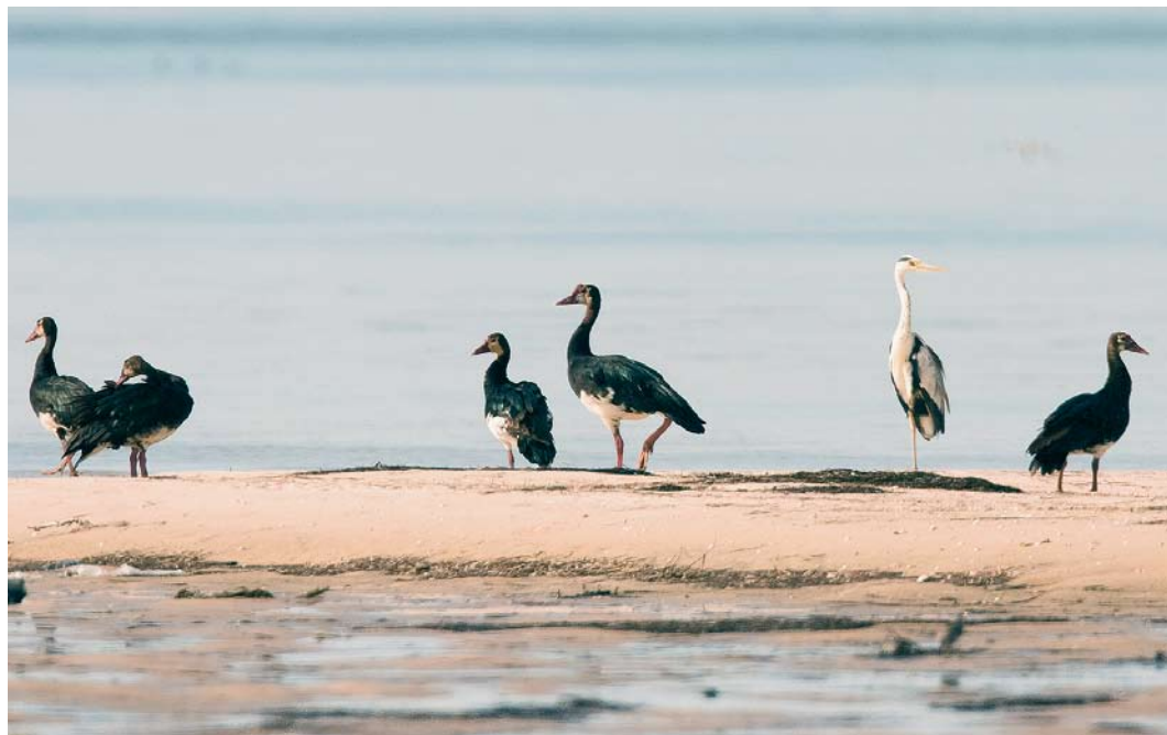
118 Spur-winged Geese / Spoorwiekganzen Plectropterus gambensis , with Mauritanian Heron / Mauritaanse Blauwe Reiger Ardea cinerea monicae , Ebel Kheaznaya, Banc d'Arguin, Mauritania, 12 December 2004

sea-grass Zostera noltii . On 12 December, the Spur-winged Geese were still present and Jan van de Kam took some photographs of the flock from a hide. On 14 December during a high tide waterbird count in the area, still nine Spur-winged Geese were seen. After that, the geese were not observed any more and the observers left the area on 17 December. Since the geese were observed there during high tide, they were mainly resting. Because the significance of this observation was not realized immediately, no description of the birds was taken in the field. However, the accompanying photograph leaves no doubt as to the identity of the birds, on basis of size (between Reed Cormorant and Eurasian Spoonbill), mainly black plumage with white belly, undertail-coverts and central band on the neck, pale 'face' with dark eye-patch and bare skin on forehead, and pinkish legs and bill. The large amount of white on the underparts indicates the nominate subspecies P. g. gambensis and excludes the much darker subspecies P. g. niger (Madge & Burn 1988).