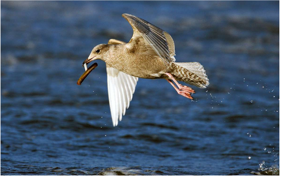
65 Kleine Burgemeester / Iceland Gull Larus glaucooides , eerstejaars, Katwijk aan Zee, Zuid-Holland, 1 december 2007