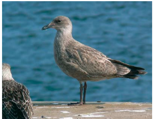
6-7 Presumed Herring Gull / vermoedelijke Zilvermeeuw Larus argentatus , first-year, Tampere, Finland, 19 November 2006. In addition to broad tail-band (with dense vermiculations on outer feathers), this bird also has thick brown spots on uppertail-coverts, especially on longer ones. In plate 7, however, note rather pale, obviously streaked hindneck and underparts, as well as rather poorly marked vent, which differ from typical Smithsonian Gull L. smithsonianus . Body of this bird looking a bit elongated for that species, too. Bars on undertail-coverts were widely spaced (not visible here).