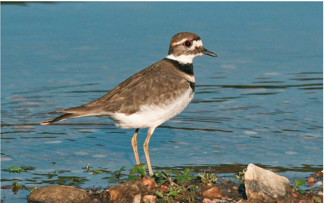
150 Killdeer / Killdeerplevier Charadrius vociferus , Cecebre reservoir, A Coruña, Spain, 21 January 2008 (Ferran López)