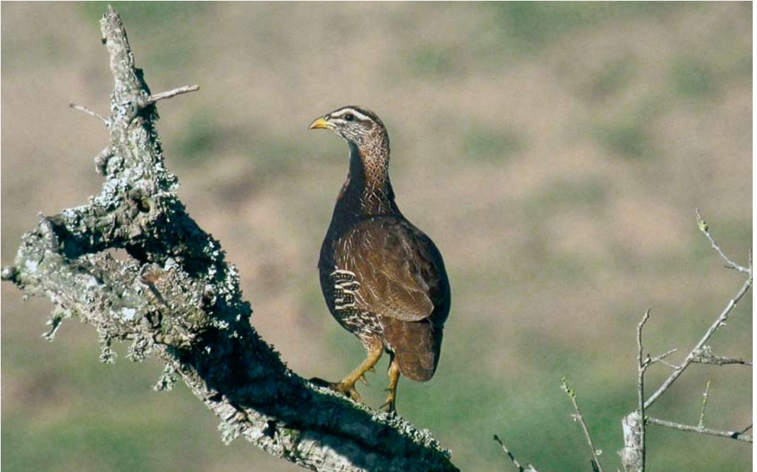
149 Double-spurred Francolin / Barbarijse Frankolijn Francolinus bicalcaratus ayesha , Sidi Bettache, Morocco, 2 March 2008