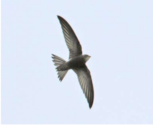
97 Vale Gierzwaluw / Pallid Swift Apus pallidus , eerstejaars, Vlieland, Friesland, 20 oktober 2006