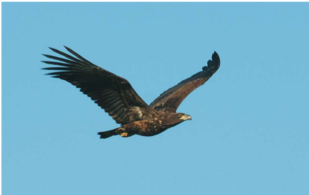
158 Zearend / White-tailed Eagle Haliaeetus albicilla , eerste-winter, Camperduin, Noord-Holland, 11 februari 2008