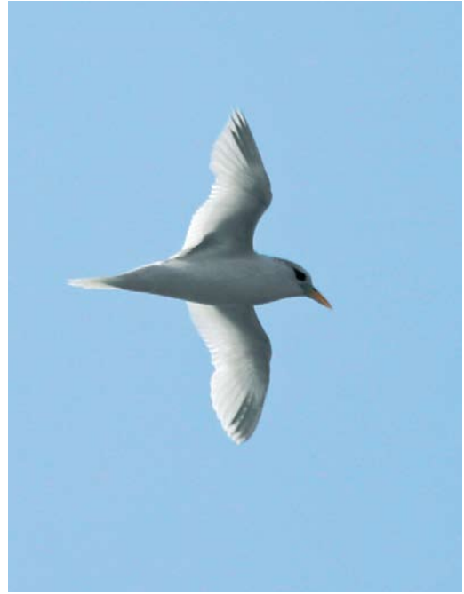
143 White-tailed Tropicbird / Witstaartkeerkringvogel Phaethon lepturus , immature, 200 nautical miles west of Flores, Azores, 20 October 2007 cf Dutch Birding 30: 41, 2008

Cumbria and in Fife and Orkney, Scotland, three single Snow Geese A caerulescens were also present. Two presumed blue-morph Ross's Geese with domestic geese near Werkendam, Noord-Brabant, the Netherlands, in February were presumed escapes but still noteworthy because this morph is extremely rare in this species. A Pink-footed Goose wintered on São Miguel, Azores, from at least 27 January to late February. Record numbers of rare geese in north-eastern Italy in January-February included three Lesser White-fronted Geese A erythropus , one Barnacle Goose and three Red-breasted Geese B ruficollis . The male Steller's Eider Polysticta stelleri present in Iceland since 1998 remained all winter. The southernmost King Eiders Somateria spectabilis were first-winter males in Calvados, Normandie, France, from 12 February and in Devon, England, from 20 February. A male American Scoter Melanitta americana stayed with Black Scoters M nigra at St Peter Ording, Schleswig-Holstein, Germany, on 13-17 February. Four Velvet Scoters M fusca at Jaffa port on 31 January constituted the seventh record for Israel. In the Netherlands, the male Bufflehead Bucephala albeola at Barendrecht, Zuid-Holland, remained for its fourth winter from 28 October 2007 into March; at least two ringed (presumed escaped) individuals were seen during the same period. The male Barrow's Goldeneye B islandica