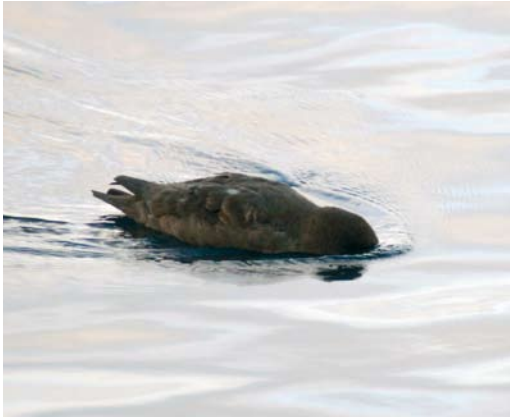
137 Mystery photograph III (July)