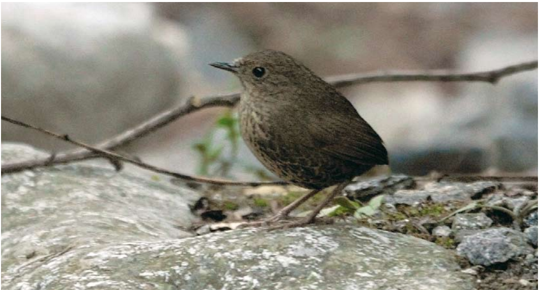
119-123 Nepal Wren Babbler / Nepalese Sluipimalia Phoepyga immaculata , Chongong, Nepal, 8 April 2007