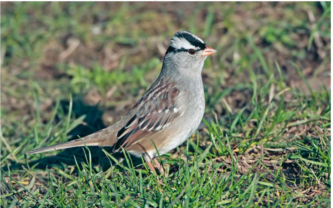
152 White-crowned Sparrow / Witkruingors Zonotrichia leucophrys , Cley, Norfolk, England, 6 February 2008 ( Kit Day )