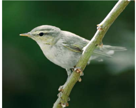
138 Mystery photograph IV (October)

30: 34, 2008) carefully and identify the birds in the photographs. Solutions can be sent in three different ways: