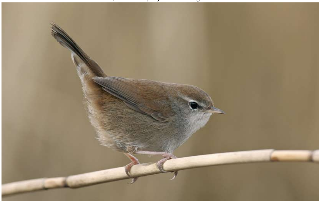
162 Cetti's Zanger / Cetti's Warbler Cettia cetti , Vlaardingen, Zuid-Holland, 2 maart 2008