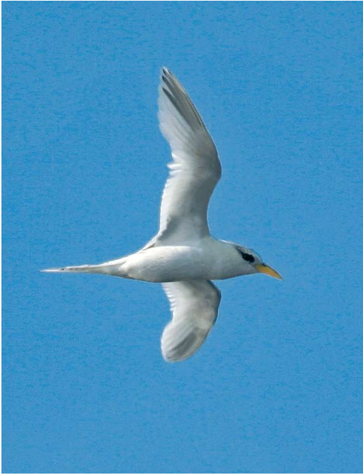
142 White-tailed Tropicbird / Witstaartkeerkringvogel Phaethon lepturus , immature, 303 nautical miles west of Flores, Azores, 18 October 2007 (Ricardo Guerreiro) cf Dutch Birding 30: 41, 2008