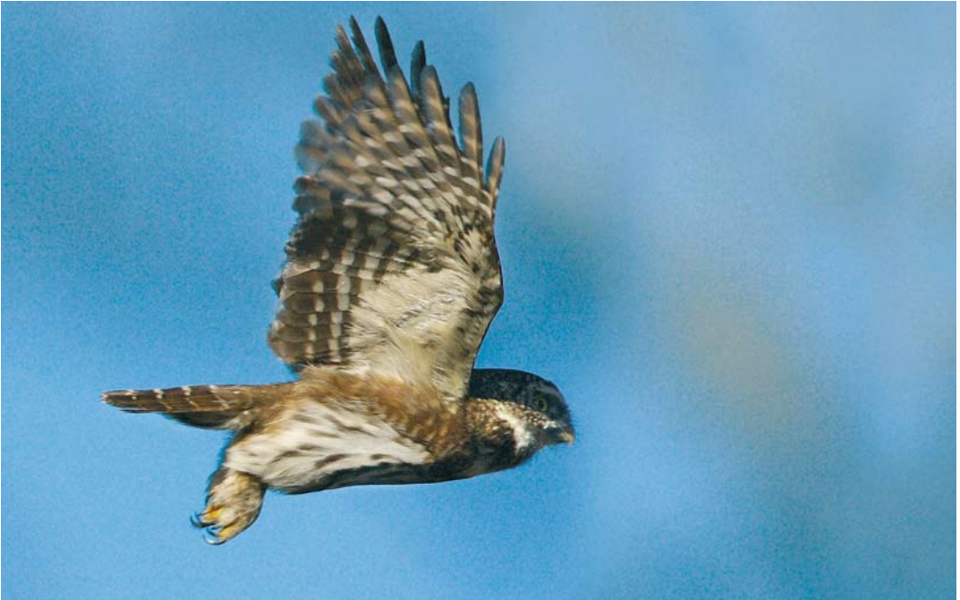
86 Dwerguil / Eurasian Pygmy Owl Glaucidium passerinum , Valkenswaard, Noord-Brabant, 11 februari 2008 87 Dwerguil / Eurasian Pygmy Owl Glaucidium passerinum , Valkenswaard, Noord-Brabant, 11 februari 2008 88 Dwerguil / Eurasian Pygmy Owl Glaucidium passerinum , Valkenswaard, Noord-Brabant, 11 februari 2008