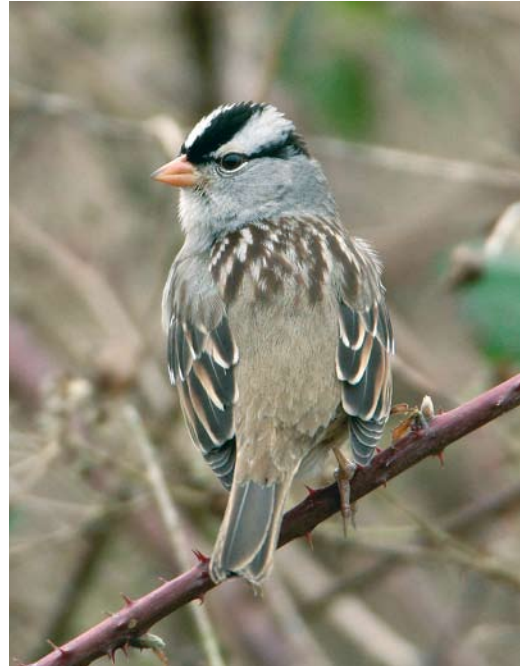
155 White-crowned Sparrow / Witkruingors Zonotrichia leucophrys , Cley, Norfolk, England, 26 January 2008

HYPOCOLIUS TO WARBLERS In Egypt, Hypocolius Hypocolius ampelinus occurred at Mövenpick Resort Hotel, El Quseir (two), on 14 February and near Tut Amon resort village (three) on 16 February. On 4 February, a Black Scrub Robin Cercotrichas podobe turned up at El Gouna, Egypt. A male Kurdistan Wheatear Oenanthe xanthoprymna stayed at Neot Smadar, Israel, from 6 March onwards. In Denmark, the third calendar-year female Black-throated Thrush Turdus atrogularis at Mølleparken, Nivå, Sjælland, from 7 November remained into March (cf Dutch Birding 30: 48, 2008). The 30th for Sweden was at Östersund, Jämtland, from 2 February. A pair of Cricket Longtails Spiloptila clamans was collecting nesting material west of Awerder, Western Sahara, on