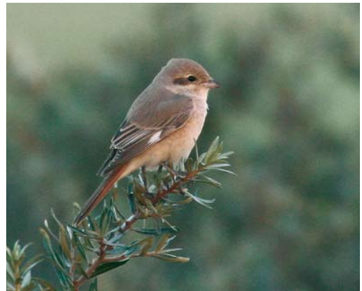
110 Daurian Shrike / Daurische Klauwier Lanius isabellinus , adult male, Den Hoorn, Texel, Noord-Holland, 26 September 2006 111 Daurian Shrike / Daurische Klauwier Lanius isabellinus , adult male, Den Hoorn, Texel, Noord-Holland, 26 September 2006 112 Daurian Shrike / Daurische Klauwier Lanius isabellinus , adult female, Maasvlakte, Rotterdam, Zuid-Holland, Netherlands, 27 August 2006