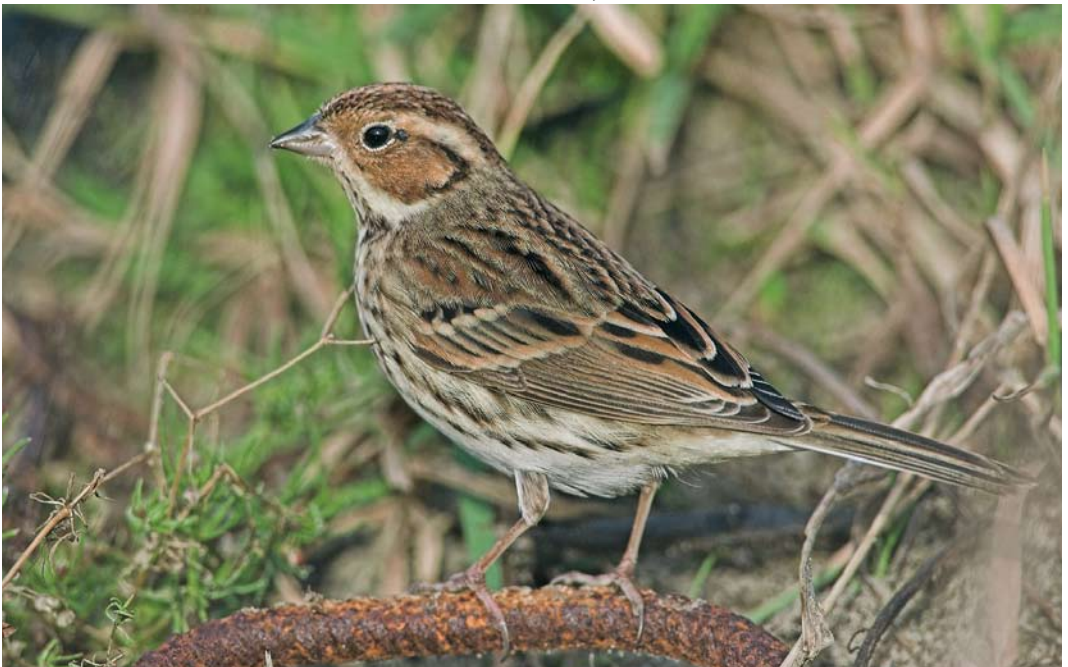
164 Dwerggors / Little Bunting Emberiza pusilla , Katwijk aan Zee, Zuid-Holland, 26 januari 2008 (Menno van Duijn)