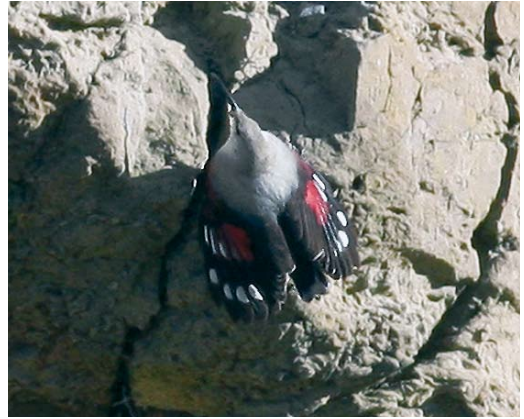
153-154 Wallcreeper / Rotskruiper Tichodroma muraria , Wimereux, Pas-de-Calais, France, 2 February 2008 (Raphaël Lebrun)