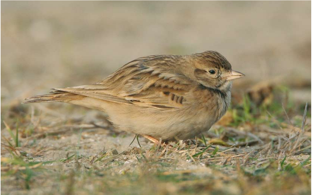
163 Kortteenleeuwerik / Greater Short-toed Lark Calandrella brachydactyla , Castricum aan Zee, Noord-Holland, 3 januari 2008 (Roland Jansen)