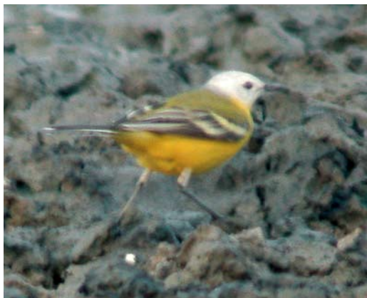
115 White-headed Wagtail / Witkopkwikstaart Motacilla leucocephala , male, Kolshengel, Taukum desert, Almaty province, Kazakhstan, 10 May 2007