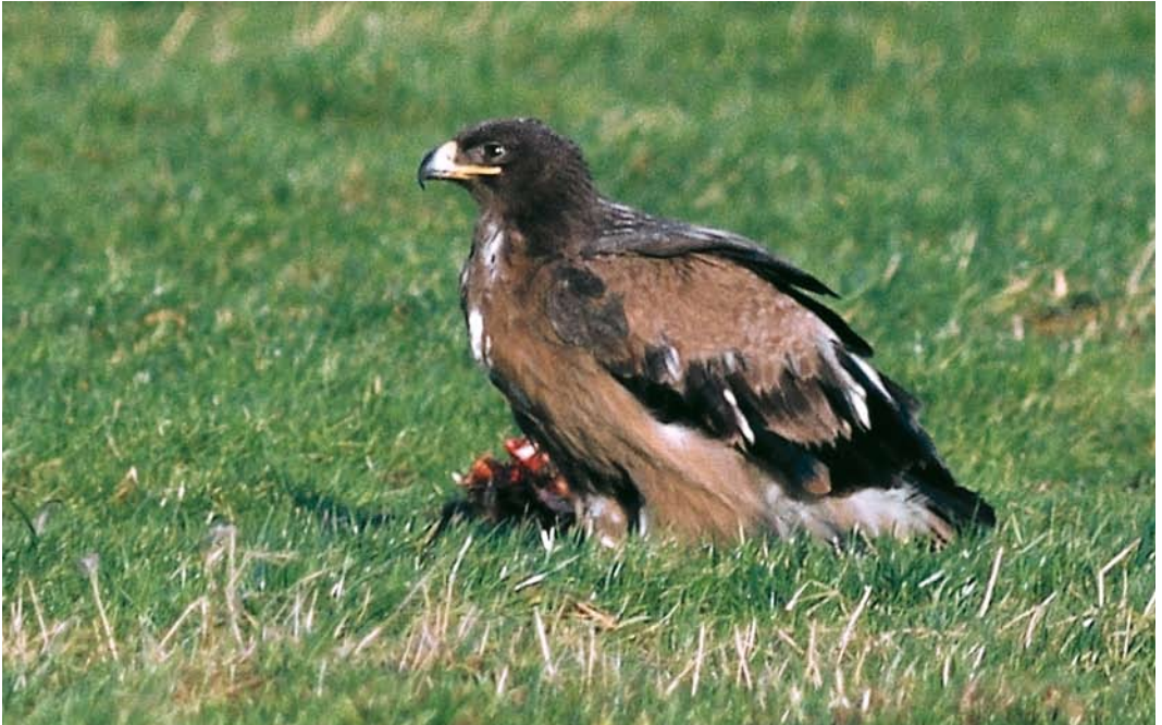
124 Stepparend / Steppe Eagle Aquila nipalensis , tweede-winter, Someren, Noord-Brabant, 17 januari 1984