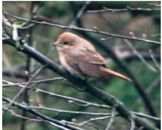
99-100 'Isabelline shrike' / 'izabelklauwier' Lanius isabellinus/phoenicuroides , first-winter, Schorrenweg, Texel, Noord-Holland, Netherlands, 18 October 1985 101 Daurian Shrike / Daurische Klauwier Lanius isabellinus , adult, De Cocksdoorp, Texel, Noord-Holland, Netherlands, 4 May 1995 102 Daurian Shrike / Daurische Klauwier Lanius isabellinus , first-winter, Lauwersoog, Friesland, Netherlands, 11 December 1996

TAIL Uppertail rufous-brown, darkest at tip. BARE PARTS Bill pale pinkish at base, getting darker towards black tip; leg blackish, eye black. SOUND Not heard.