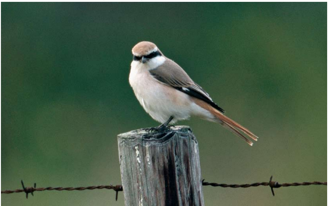
104 Turkestan Shrike / Turkestaanse Klauwier Lanius phoenicuroides , adult male, De Cocksdorp, Texel, Noord-Holland, Netherlands, 2 October 2000