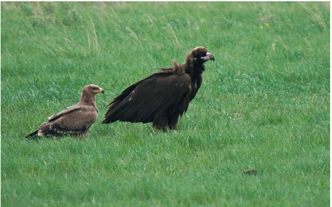
114 Cinereous Vulture / Monniksgier Aegypius monachus , immature, with Steppe Eagle / Stepparend Aquila nipalensis , west of Astana, Aqmola province, Kazakhstan, 16 May 2007 (Rob Bouwman)