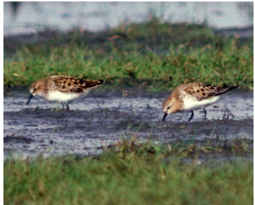
130 Giervalk / Gyrfalcon Falco rusticolus , eerste-winter, Spijk, Groningen, 24 februari 1987 ( René Pop ) 131 Alpenheggenmus / Alpine Accentor Prunella collaris , Groningen, Groningen, 17 april 1986 ( Arnoud B van den Berg ) 132 Renvogel / Cream-coloured Courser Cursorius cursor , Camperduin, Noord-Holland, 4 oktober 1986 ( René Pop ) 133 Roodkeelstrandloper / Red-necked Stint Calidris ruficollis , adult (rechts), met Kleine Strandloper / Little Stint C minuta , Jaap Deensgat, Lauwersmeer, Groningen, 29 mei 1987 ( Arnoud B van den Berg )

den rigoureuus toegepast wat leidde tot een drempelverhoging, niet alleen voor aanvaarding maar ook voor het indienen van zeldzaamheden. Als een gemelde vogel niet onmiddellijk werd teruggevonden dan werd de melding eigenlijk al niet meer geloofd. Het gevolg was dat er regelmatig lang niet zo goed is gezocht om een dwaalgast terug te vinden als de melding verdiende. Uiteindelijk ging de scepsis bij sommige gezichtbepalende vogelaars zo ver dat extreme gevallen a priori niet werden geloofd – de Roodkeelstrandloper van de Lauwersmeer, Groningen, was in dit opzicht een keerpunt. Na de eerste melding van deze fantastische soort besloot een aantal in die tijd prominente vogelaars thuis te blijven omdat dit echt niet kon – een Roodkeelstrandloper was sowieso te zeldzaam om in Nederland op te duiken en was daarbij toch niet met zekerheid te herkennen, en wie kende toen Erik van Ommen die de vogel had ontdekt en doorgegeven? De rest is geschiedenis –