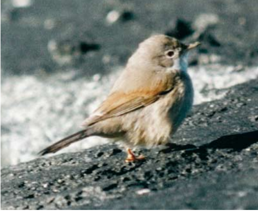
126 Brilgrasmus / Spectacled Warbler Sylvia conspicillata , IJmuiden, Noord-Holland, 2 november 1984 (René van Rossum)