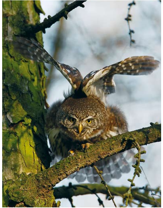
89-90 Dwerguil / Eurasian Pygmy Owl Glaucidium passerinum , Valkenswaard, Noord-Brabant, 11 februari 2008 (Edwin Winkel) 91 Dwerguil / Eurasian Pygmy Owl Glaucidium passerinum , Valkenswaard, Noord-Brabant, 11 februari 2008 (Pieter van Veelen) 92 Dwerguil / Eurasian Pygmy Owl Glaucidium passerinum , Valkenswaard, Noord-Brabant, 11 februari 2008 (Jankees Schwiebbe)