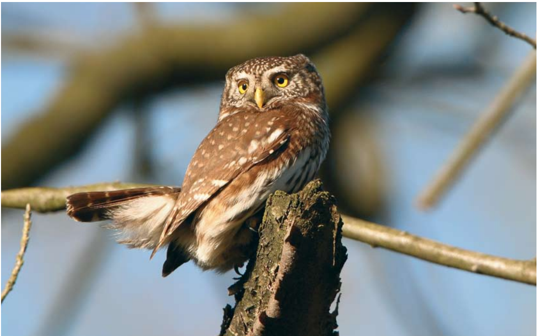
85 Dwerguil / Eurasian Pygmy Owl Glaucidium passerinum , Valkenswaard, Noord-Brabant, 11 februari 2008 (Michel Veldt)

VLEUGEL Donkerbruin met witte vlekken. Handpennen met witte dwarsbandering op regelmatige afstand. Op tertials twee vage lichte dwarsbandjes zichtbaar. Onderzijde van handpennen