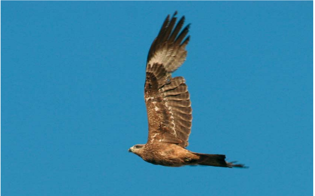
113 Hybrid Black x Black-eared Kite / hybride Zwarte x Oostelijke Zwarte Wouw Milvus migrans x lineatus (' migrans type'), second-year, Sorbulak lake, Almaty province, Kazakhstan, 1 June 2007