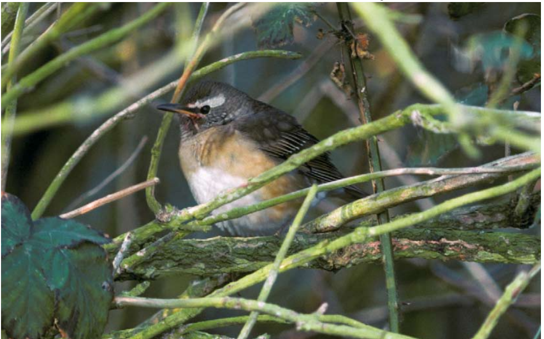
125 Vale Lijster / Eyebrowed Thrush Turdus obscurus , eerste-winter mannetje, De Cocksdorp, Texel, Noord-Holland, 4 oktober 1988