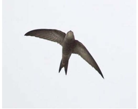
98 Vale Gierzwaluw / Pallid Swift Apus pallidus , eerstejaars, Vlieland, Friesland, 20 oktober 2006 (Bas van den Boogaard)

heeft maar de bruikbaarheid van dit kenmerk voor een zekere determinatie is discutabel.