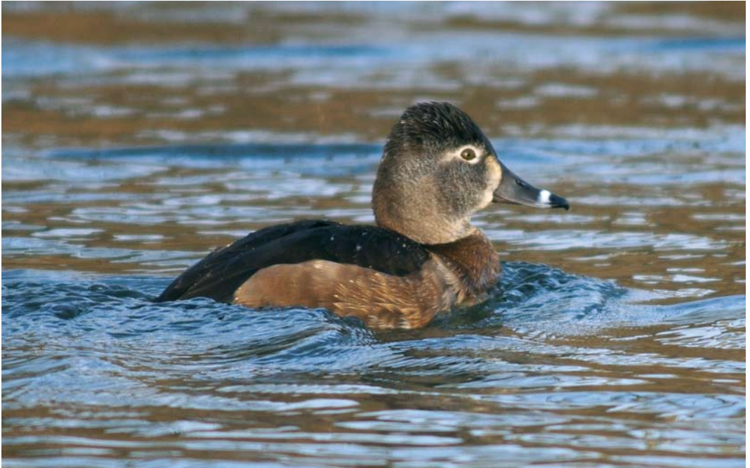
156 Ringsnaveleend / Ring-necked Duck Aythya collaris , vrouwtje, Eijsden, Limburg, 25 februari 2008