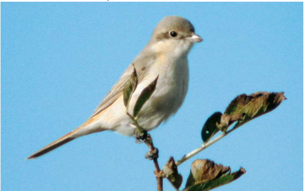
106 Daurian Shrike / Daurische Klauwier Lanius isabellinus , Horsmeertjes, Texel, Noord-Holland, Netherlands, 25 September 2003