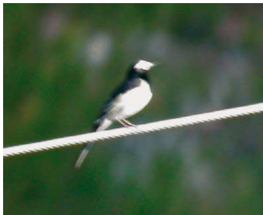
116 Himalayan Wagtail / Himalayakwikstaart Motacilla albooides , male, Kaskelen, Almaty province, Kazakhstan, 30 May 2007

On 3-6 October 2004, three Winter Wrens T. t. troglodytes were trapped at Dzhanlybek in the Volga-Ural semi-desert, West Kazakhstan province (Nikita