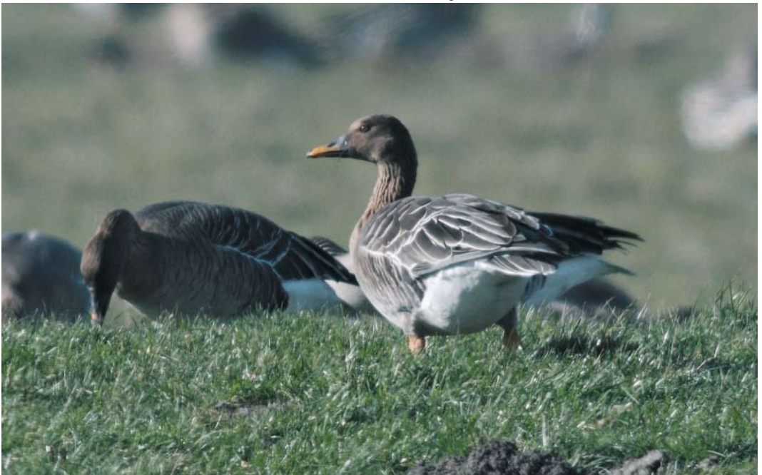
157 Taigarietgans / Taiga Bean Goose Anser fabalis , Inlaagpolder, Spaarndam, Noord-Holland, 17 februari 2008