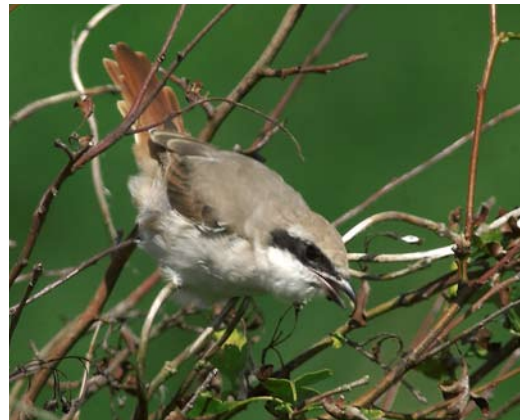
107-109 Turkestan Shrike / Turkestaanse Klauwier Lanius phoenicuroides , adult, Bleekersvallei, Texel, Noord-Holland, Netherlands, 14 August 2002 (René Pop)