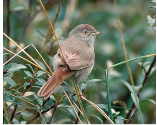
127 Woestijngasmus / Asian Desert Warbler Sylvia nana , Amsterdamse Waterleidingduinen, Zandvoort, Noord-Holland, 31 oktober 1988 (Hans Gebuis)

tes cyanus (toen Parus cyanus ), Rotsmus Petronia petronia en Grijze Gors. In 1984 waren Rotskruiper Tichodroma muraria en Sneeuwvink Montifringilla nivalis reeds gesneuveld. Ondersoorten zouden in een later artikel worden behandeld, waaronder twee taxa die nu als soort bekend staan.