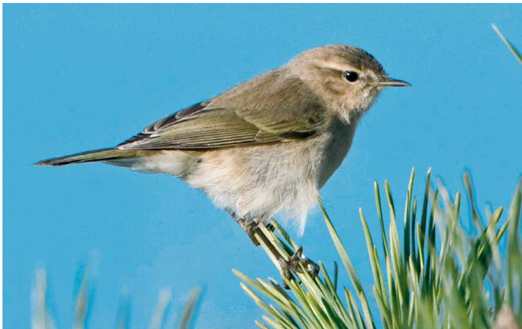
161 Siberische Tjiftjaf / Siberian Chiffchaff Phylloscopus collybita tristis , Budel-Dorplein, Noord-Brabant, 22 januari 2008