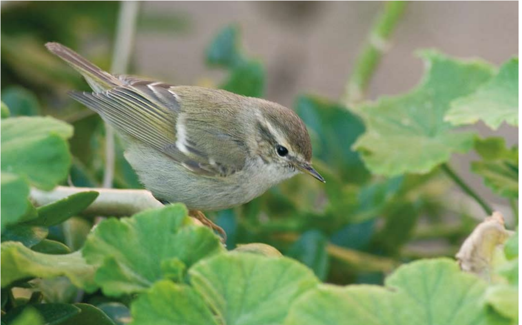
151 Hume's Leaf Warbler / Humes Bladkoning Phylloscopus humei , Ventotene, Ponziane, Lazio, Italy, 10 February 2008