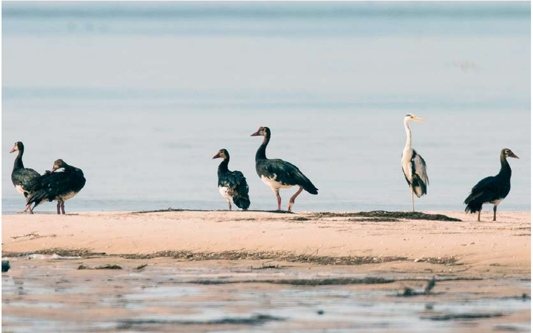
118 Spur-winged Geese / Spoorwiekganzen Plectropterus gambensis , with Mauritanian Heron / Mauritaanse Blauwe Reiger Ardea cinerea monicae , Ebel Kheaznaya, Banc d'Arguin, Mauritania, 12 December 2004

sea-grass Zostera noltii . On 12 December, the Spur-winged Geese were still present and Jan van de Kam took some photographs of the flock from a hide. On 14 December during a high tide waterbird count in the area, still nine Spur-winged Geese were seen. After that, the geese were not observed any more and the observers left the area on 17 December. Since the geese were observed there during high tide, they were mainly resting. Because the significance of this observation was not realized immediately, no description of the birds was taken in the field. However, the accompanying photograph leaves no doubt as to the identity of the birds, on basis of size (between Reed Cormorant and Eurasian Spoonbill), mainly black plumage with white belly, undertail-coverts and central band on the neck, pale 'face' with dark eye-patch and bare skin on forehead, and pinkish legs and bill. The large amount of white on the underparts indicates the nominate subspecies P. g. gambensis and excludes the much darker subspecies P. g. niger (Madge & Burn 1988).