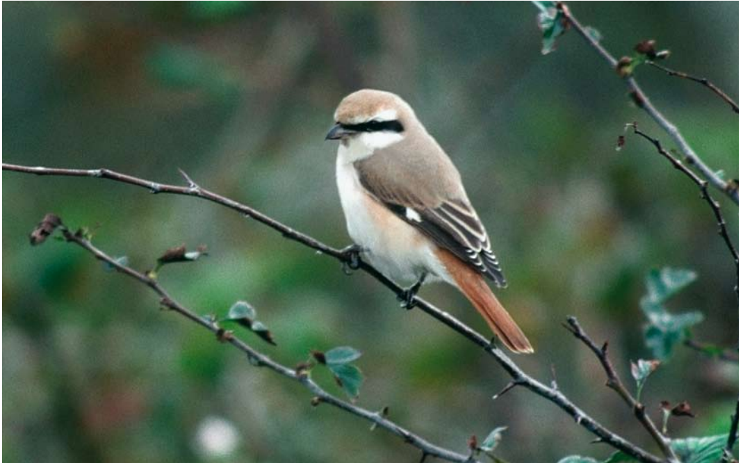
103 Turkestan Shrike / Turkestaanse Klauwier Lanius phoenicuroides , adult male, De Cocksdorp, Texel, Noord-Holland, Netherlands, 2 October 2000 (René Pop)