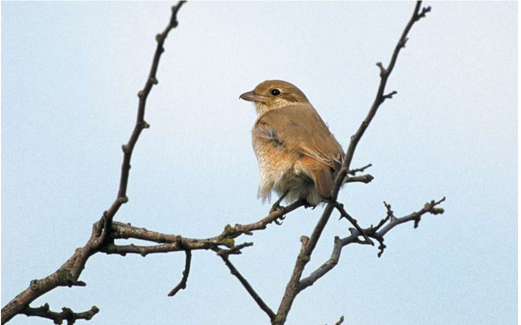
105 Daurian Shrike / Daurische Klauwier Lanius isabellinus , first-year, Castricum, Noord-Holland, Netherlands, 3 October 2000