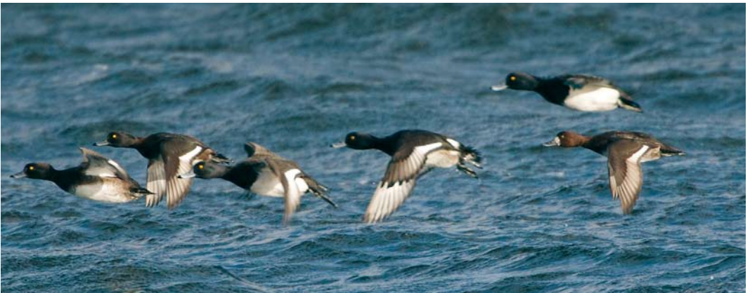
144 Killdeer / Killdeerplevier Charadrius vociferus , Cecebre reservoir, A Coruña, Spain, 21 January 2008 145 Spotted Sandpiper / Amerikaanse Oeverloper Actitis macularius , Lisvane Reservoir, Wales, 10 February 2008 146 Barrow's Goldeneye / IJslandse Brilduiker Bucephala islandica , male, Quoile Pondage, Down, Northern Ireland, 15 March 2008 147 American Scoter / Amerikaanse Zee-eend Melanitta americana , male (right), with Black Scoters / Zwarte Zee-eenden M nigra , St Peter Ording, Schleswig-Holstein, Germany, February 2008 148 Lesser Scaup / Kleine Topper Aythya affinis , female (right), with Tufted Ducks / Kuifeenden A fuligula , Cullivoe Yell, Shetland, Scotland, 6 February 2008