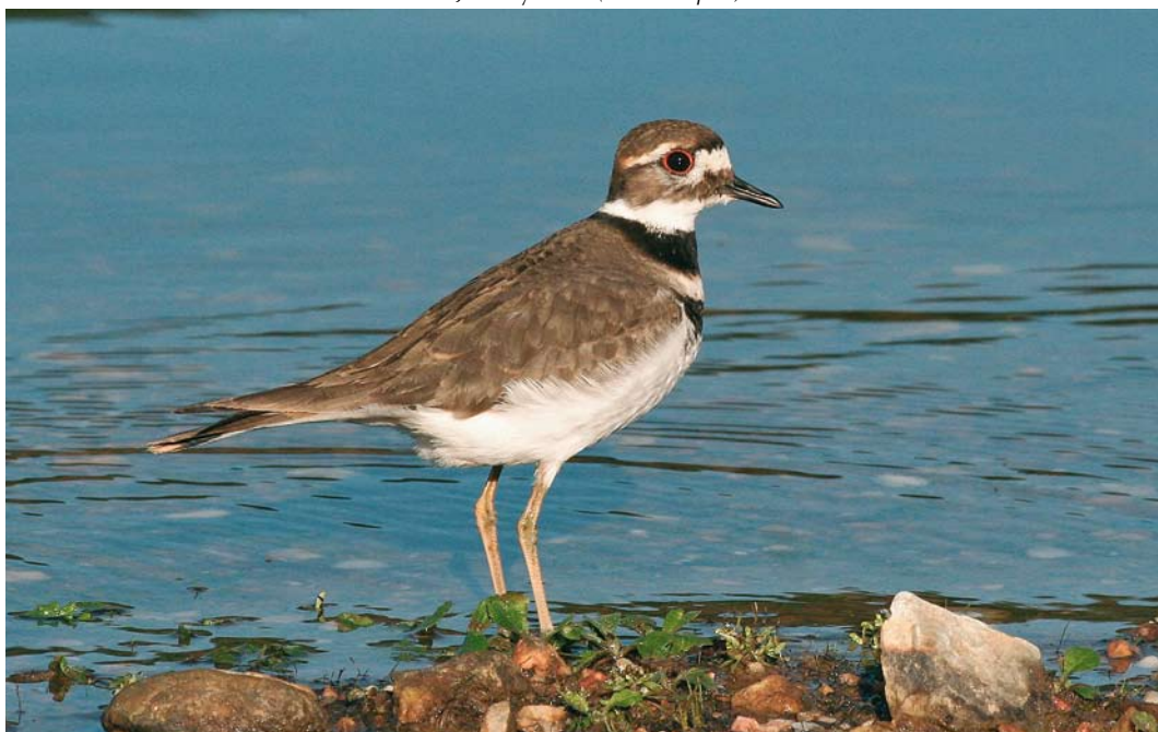
150 Killdeer / Killdeerplevier Charadrius vociferus , Cecebre reservoir, A Coruña, Spain, 21 January 2008 (Ferran López)