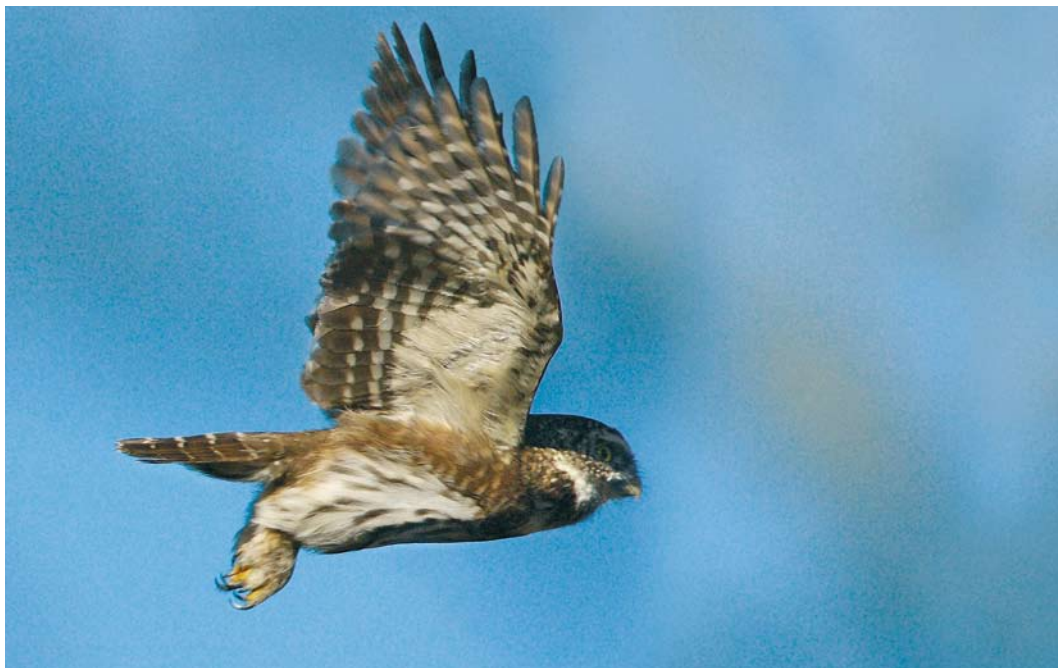
86 Dwerguil / Eurasian Pygmy Owl Glaucidium passerinum , Valkenswaard, Noord-Brabant, 11 februari 2008 87 Dwerguil / Eurasian Pygmy Owl Glaucidium passerinum , Valkenswaard, Noord-Brabant, 11 februari 2008 88 Dwerguil / Eurasian Pygmy Owl Glaucidium passerinum , Valkenswaard, Noord-Brabant, 11 februari 2008