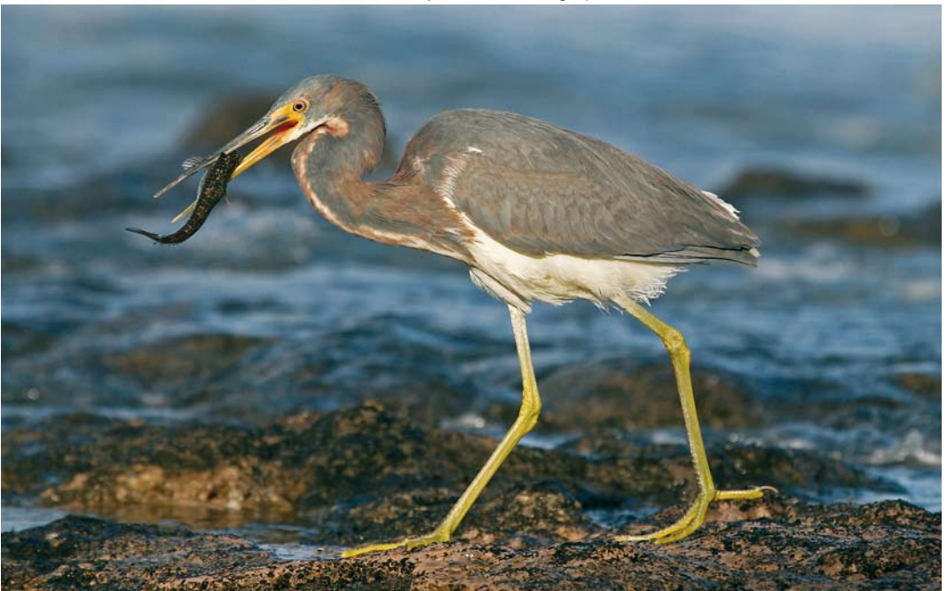
141 Tricolored Heron / Witbuikreiger Egretta tricolor , first-winter, Playa de las Americas, Tenerife, Canary Islands, 17 February 2008 ( Lee Gregory )