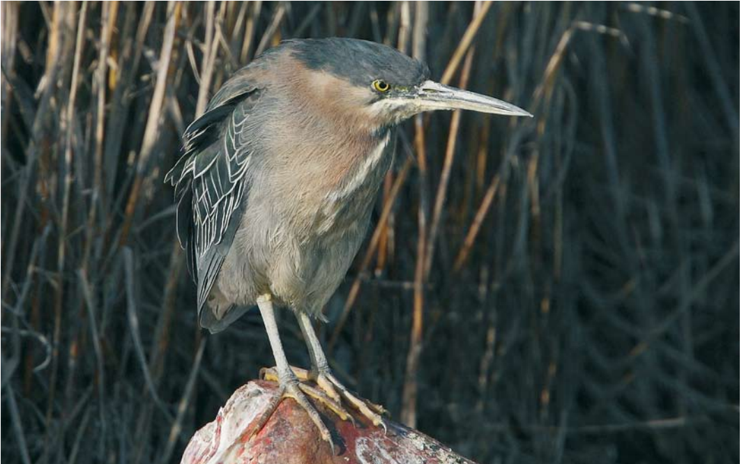
140 Green Heron / Groene Reiger Butorides virescens , Berre l'Étang, Bouches-du-Rhône, France, 21 February 2008