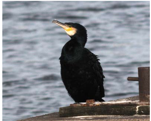
165 Hybride Grote Burgemeester x Zilvermeeuw / hybrid Glaucous x Herring Gull Larus hyperboreus x argentatus , tweede-winter, IJmuiden, Noord-Holland, 23 februari 2008 (Arnoud B van den Berg) 166 Vermoedelijke Vale Braamsluiper / presumed Central Asian Lesser Whitethroat Sylvia curruca halimodendri , Velsbroek, Noord-Holland, 17 januari 2008 (Arnoud B van den Berg) 167 Blauwvleugeltaling / Blue-winged Teal Anas discors , mannetje, Alblasserdam, Zuid-Holland, 5 maart 2008 (Anthonie Stip) 168 Grote Aalscholver / Atlantic Great Cormorant Phalacrocorax carbo carbo , adult, IJmuiden, Noord-Holland, 3 februari 2008 (Arnoud B van den Berg)

Vaalsersberg, Limburg, en van in totaal ten minste 350 vanaf 25 februari luidden alweer de voorjaars trek in. De overwinterende Terekruiter Xenus cinereus van Polder Breebaart, Groningen, bleef tot 21 januari. Een Rosse Franjepoot Phalaropus fulicarius foerageerde op 2 februari in het Meisterplak op Terschelling. Langs de Noordzeekust werden verspreid over de periode nog 14 losse Middelste Jagers Stercorarius pomarinus gemeld. Er waren opmerkelijke meldingen van onvolwassen Vorkstaartmeeuwen Xema sabini op 19 januari langs De Koog op Texel en op 22 januari (twee) langs paal 15 op Terschelling. Pleisterende Grote Burgemeesters Larus hyperboreus verbleven de gehele periode bij Den Helder, van 9 tot 27 januari bij Zoutelande, Zeeland, en van 19 tot 21 januari bij Groningen. Verder waren er nog ten minste 11 waarnemingen waarvan de meeste in januari. Met